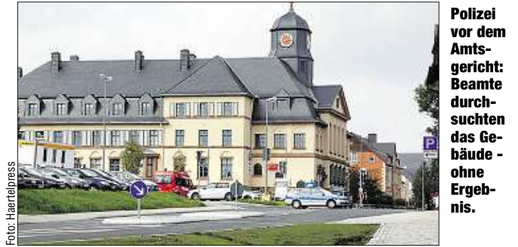
Polizei vor dem Amtsgericht: Beamte durchsuchten das Gebäude - ohne Ergebnis.