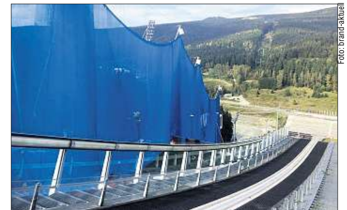
Schon der Schanzentisch der Großschanze in der Vogtland Arena ist künftig vor dem Wind geschützt.