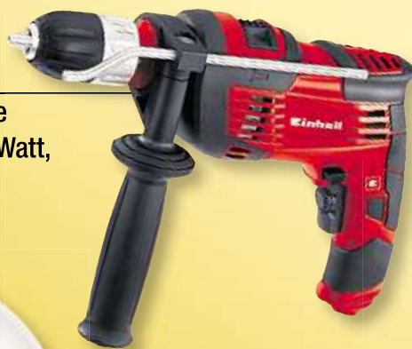
EINHELL Schlagbohrmaschine TH-ID 720/1 E, 720 Watt, Art.-Nr. 80619