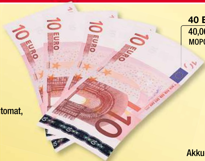
40 EURO BARGELD 40,00 Euro auf Ihr Konto MOP018:BAR40