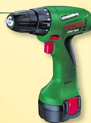
BOSCH Akku-Bohrschrauber PSR 960 im Koffer Art.-Nr. 70061