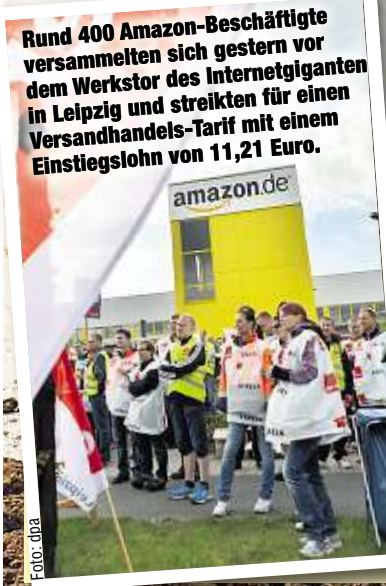
Rund 400 Amazon-Beschäftigte versammelten sich gestern vor dem Werkstor des Internetgiganten in Leipzig und streikten für einen Versandhandels-Tarif mit einem Einstiegslohn von 11,21 Euro.

Amazon-Packer, die derzeit Stundenlöhne zwischen 9,55 und 10,99 Euro erhalten, wächst da gewaltig. „Die Amazon-Manager spielen gerne die Ost-Europa-Karte, um Druck auszuüben“, sagt Gewerkschafter Schneider. In der deutschen Amazon-Zentrale in München wollte man sich auf Morgenpost-Nachfrage nicht zur Zukunft einzelner Standorte äußern. Unternehmenssprecherin Anette Nachbar erklärte allgemein: „Es gibt keine Pläne, eines der bestehenden Logistikzentren in der EU zu schließen.“ am/-bi-