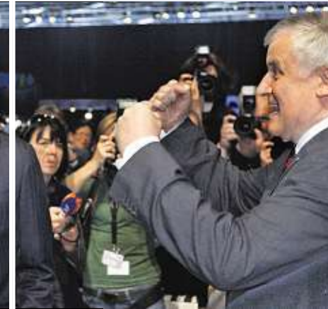
▲ Beim CSU-Parteitag vor vier Jahren: Seehofer gestikuliert in Richtung Guttenberg. Der Parteichef will den Ex-Politstar als Redner zurückholen.

„Der Guttenberg kann immer noch schnell eine Rede abschreiben.“ Im Juni sprach er auf dem Transatlantischen Dialog in Berlin, stellte klar: „Das ist nur ein Abstecher, mit keinerlei Hintergedanken verbunden.“ Trotzdem: Der ehemalige CSU-Star ist zwar längst kein Kandidat mehr fürs Kanzleramt - sein Polit-Comeback ist aber keinesfalls ausgeschlossen.