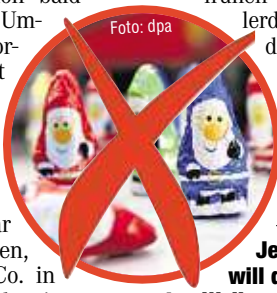
Jeder Dritte will die verführten Weihnachtsmänner verbieten.