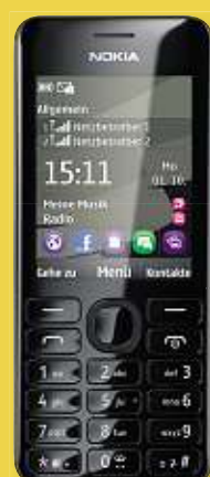
NOKIA Handy „Asha 206“, mit Kamera, Radio, Bluetooth, int. Speicher: 64 MB (erweiterbar) Art.-Nr. 46153