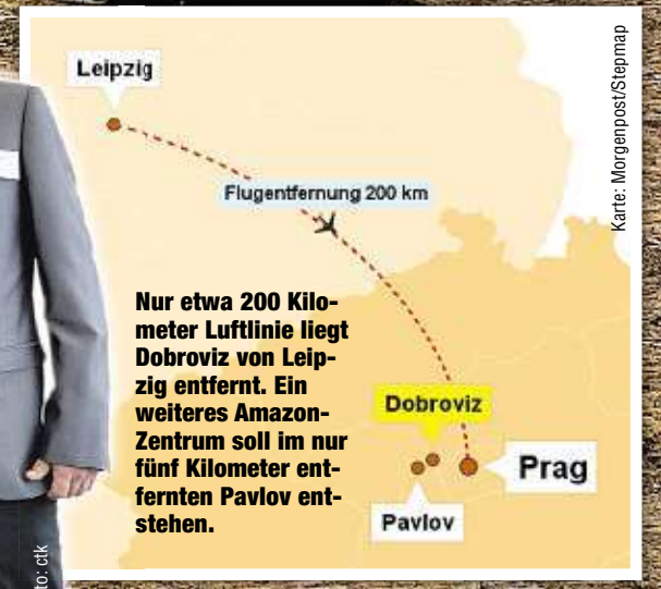
Nur etwa 200 Kilometer Luftlinie liegt Dobroviz von Leipzig entfernt. Ein weiteres Amazon-Zentrum soll im nur fünf Kilometer entfernten Pavlov entstehen.