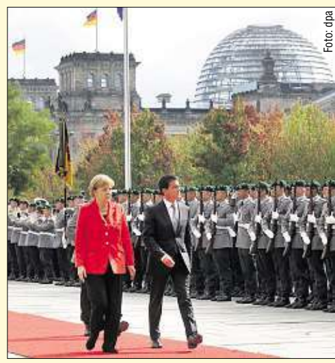
Merkel (60) empfängt Frankreichs Regierungschef Valls (52) vorm Kanzleramt.

BERLIN - Oh, es war kein leichter Antrittsbesuch in Berlin, denn Frankreichs Neu-Regierungschef Manuel Valls (52) hatte weniger gute Nachrichten im Gepäck, was den Sparkurs seines Landes angeht.