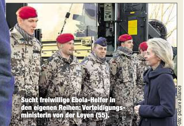
Sucht freiwillige Ebola-Helfer in den eigenen Reihen: Verteidigungsministerin von der Leyen (55).

bereit, bestätigte das Verteidigungsministerium. Prüfer hatten Mitte Juni an Bord der „Lübeck“ an einem „Sea Lynx“ einen 20 Zentimeter langen Riss entdeckt. Sonderkontrollen stellten an weiteren Fliegern ähnliche Mängel fest. Der Flugbetrieb dieser Modelle wurde bis auf Weiteres eingestellt. Eine „Aufklärung des Sachverhalts“ sei „dieses Jahr nicht mehr zu erwarten“.