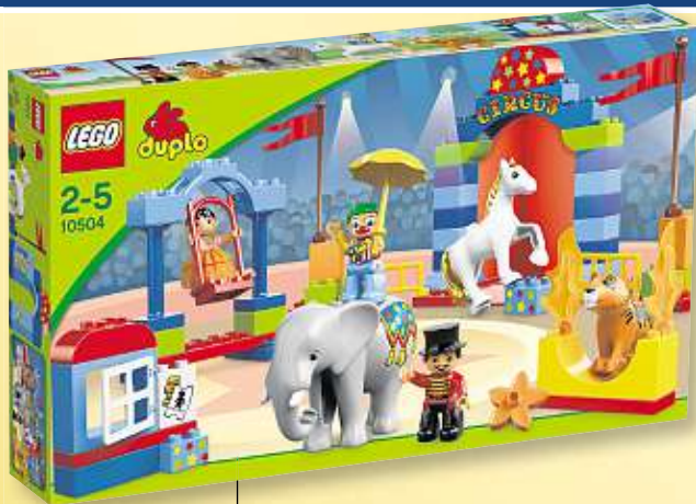
LEGO DUPLO „Großer Zirkus“, 62 Teile, für Kinder von 2–5 J. Art.-Nr. 65456

Werben Sie einen neuen Leser für die Morgenpost. Wir bedanken uns mit einer dieser wertvollen Prämien.