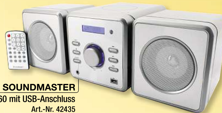
SOUNDMASTER Mini-Anlage MCD 360 mit USB-Anschluss Art.-Nr. 42435