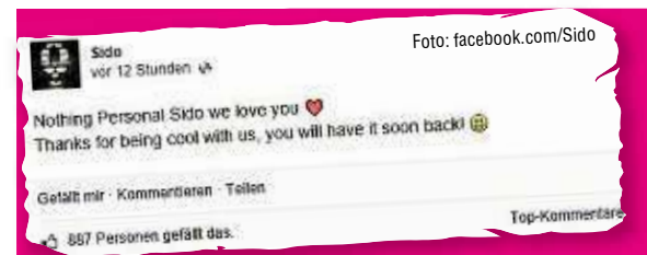
Sido (33) ist sauer: Hacker knackten sein Facebook-Profil und hinterließen diese Botschaft.