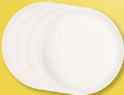
VILLEROY & BOCH Pizzateller „Artesano“, 4-tlg., Porzellan, 32 cm, Art.-Nr. 410190