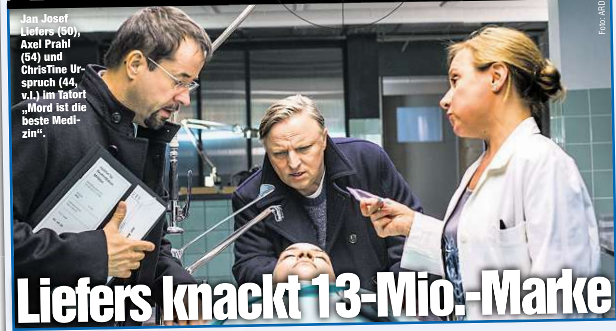
Jan Josef Liefers (50), Axel Prah (54) und Christine Urspruch (44, v.l.) im Tator „Mord ist die beste Medizin“.