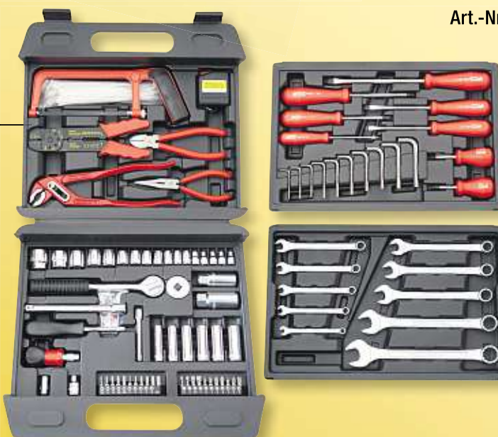
FAMEX Universal-Werkzeugkoffer, 156-tlg. Art.-Nr. 80179