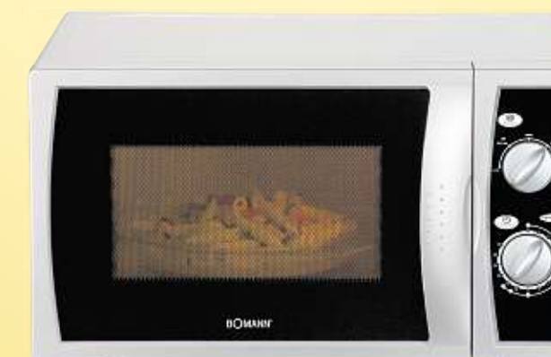
BOMANN Mikrowelle MW 2235 CB, 1.050 Watt Art.-Nr. 5106