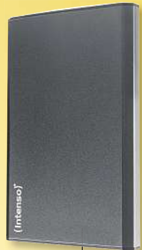
INTENSO externe 2,5" HDD-Festplatte „Memory Home“, 500 GB, mit USB 3.0-Anschluss, Art.-Nr. 48609