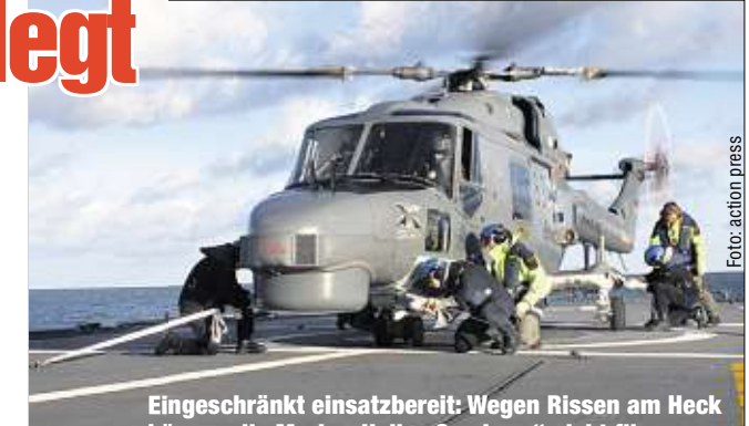
Eingeschränkt einsatzbereit: Wegen Rissen am Heck können die Marine-Helis „Sea Lynx“ nicht fliegen.

WILHELMSHAVEN - Die Fregatte „Lübeck“ ist gestern erneut zur Anti-Piraten-Mission „Atalanta“ am Horn von Afrika ausgelaufen. Die Crew soll in den nächsten Monaten für die EU-Mission vor allem die Schiffe des Welt-ernährungsprogrammes vor der