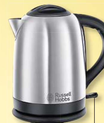
RUSSEL HOBBS Edelstahl-Wasserkocher „Oxford“, 2.400 Watt, 1,7 l Art.-Nr. 3450