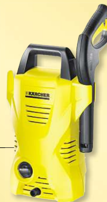
KÄRCHER Hochdruckreiniger K 2 Basic, 1.400 Watt, max. 110 bar Art.-Nr. 10346