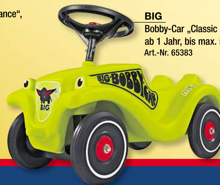
BIG Bobby-Car „Classic Racer“, ab 1 Jahr, bis max. 50 kg Art.-Nr. 65383