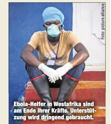
Ebola-Helfer in Westafrika sind am Ende ihrer Kräfte. Unterstützung wird dringend gebraucht.

BERLIN - Die Ebola-Epidemie wütet in Westafrika immer schlimmer, Tausende fielen ihr bereits zum Opfer - und stündlich werden es mehr. Ärzte, Pfleger und eigentlich jede helfende Hand werden in den betroffenen Regionen dringend benötigt. Deshalb sucht jetzt auch Verteidigungsministerin Ursula von der Leyen (55, CDU) - selbst von Beruf Ärztin - freiwilliges Fachpersonal in ihrer eigenen Truppe. „Ich werde einen Aufruf starten innerhalb der Bundeswehr, dass diejenigen, die wollen und können, sich melden“, kündigte die Ministerin im ARD-„Morgenmagazin“ an.