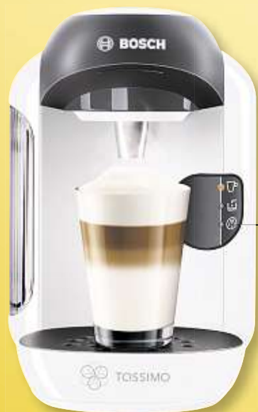
BOSCH Heißgetränke-Automat, „Tassimo Vivy“ Art.-Nr. 2670

+++ Für monatlich 14,90 Euro Sachsens günstigstes Abo +++ Für monatlich 14,90 Euro Sachsens günstigstes Abo +++ Für monatlich 14,90 Euro Sachsens günstigstes Abo +++