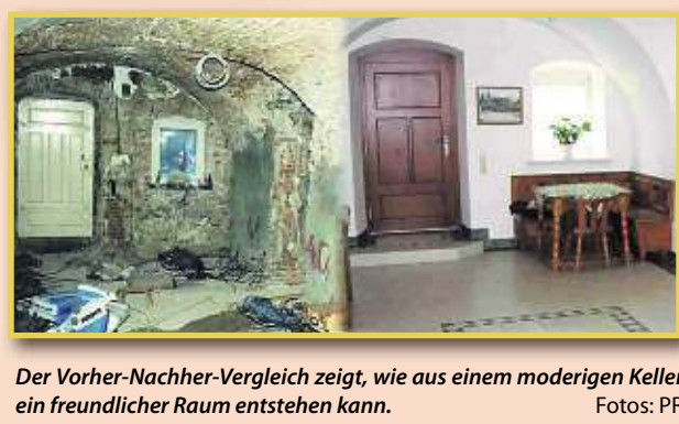
Der Vorher-Nachher-Vergleich zeigt, wie aus einem moderigen Keller ein freundlicher Raum entstehen kann.