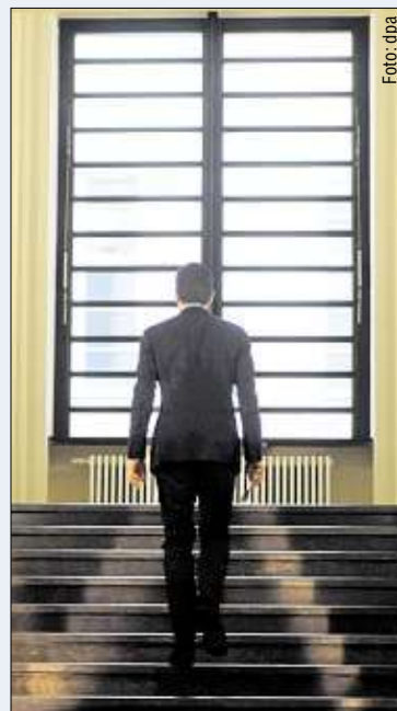
Sein letzter Gang: Guttenberg verlässt am 1. März 2011 die Pressekonferenz nach seinem Rücktritt.

BERLIN - Wird das die Wiederauferstehung eines gefallenen Hoffnungsträgers? Karl-Theodor zu Guttenberg (42, CSU), 2009 zum jüngsten Verteidigungsminister unseres Landes ernannt, könnte vor einem Comeback in der deutschen Politik stehen. Zumindest CSU-Chef Horst Seehofer (65) macht sich für die Rückkehr seines Parteifreundes stark.