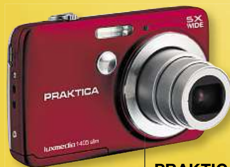
PRAKTICA Digitalkamera „luxmedia“ 1405 slim, 14 MP, 5x optischer und digitaler Zoom, 32 MB int. Speicher (erweiterbar) Art.-Nr. 67090