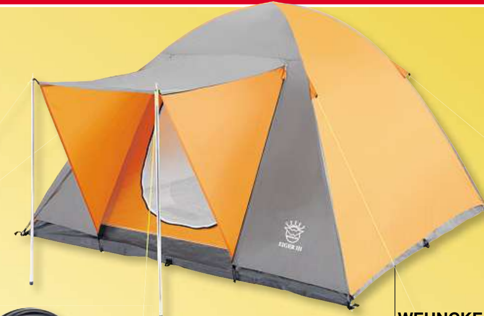
WEHNCKE Kuppelzelt „Eiger III“ für 3 Personen, Außen- und Innenzelt, Wassersäule 1.000 mm, Maße ca. 215 x 215 x 235 cm Art.-Nr. 62797