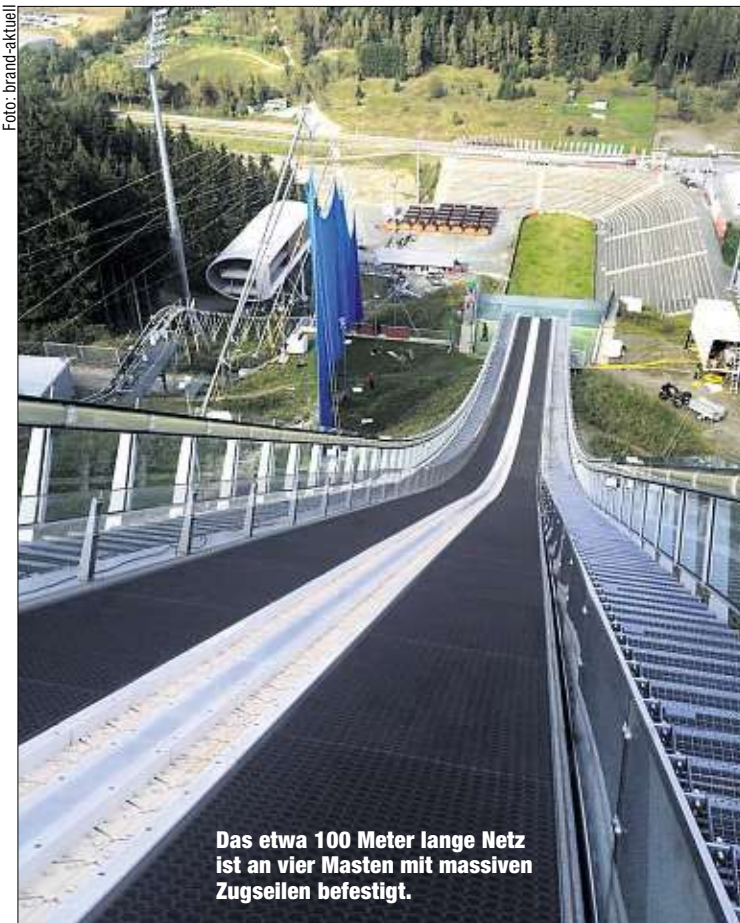
Das etwa 100 Meter lange Netz ist an vier Masten mit massiven Zugseilen befestigt.

gens: Zum Grand-Prix-Finale und zum Weltcup-Opening (20.-23. November) ist es so auch möglich, das Netz binnen weniger Minuten aufzuspannen oder herunter zu fahren. nahro Die MOPO verlost für den Sommer-Grand-Prix am 4. Oktober 5x2 Freikarten - heute ab 11 Uhr anrufen: ☎ 0371/6 94 99 79.