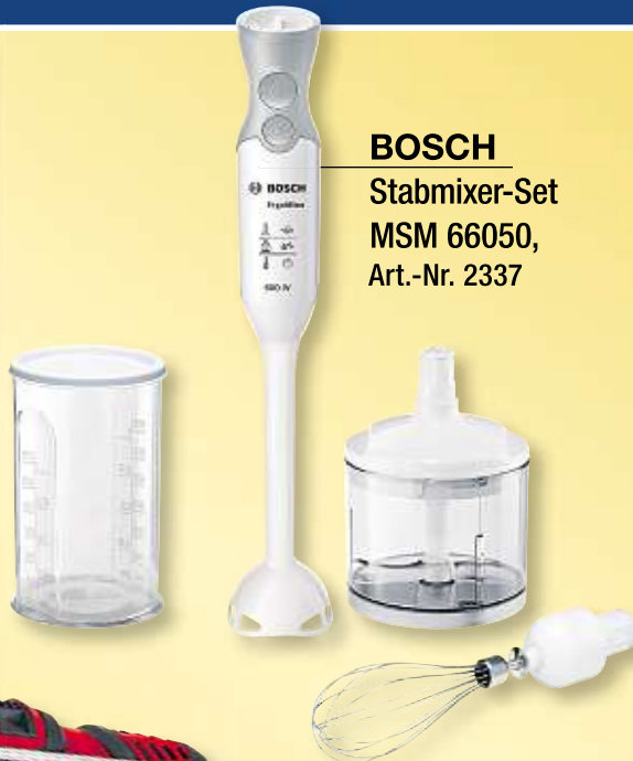
BOSCH Stabmixer-Set MSM 66050, Art.-Nr. 2337