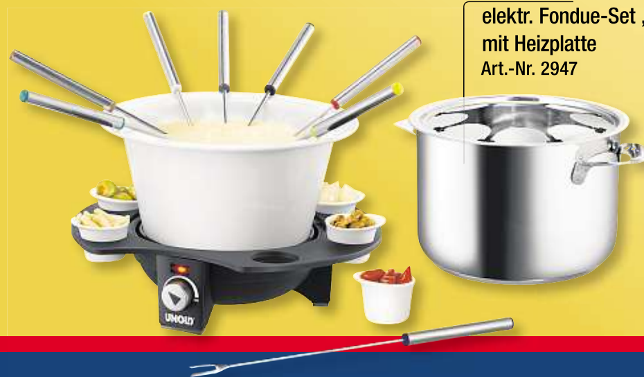
UNOLD elektr. Fondue-Set „Elegance“, mit Heizplatte Art.-Nr. 2947