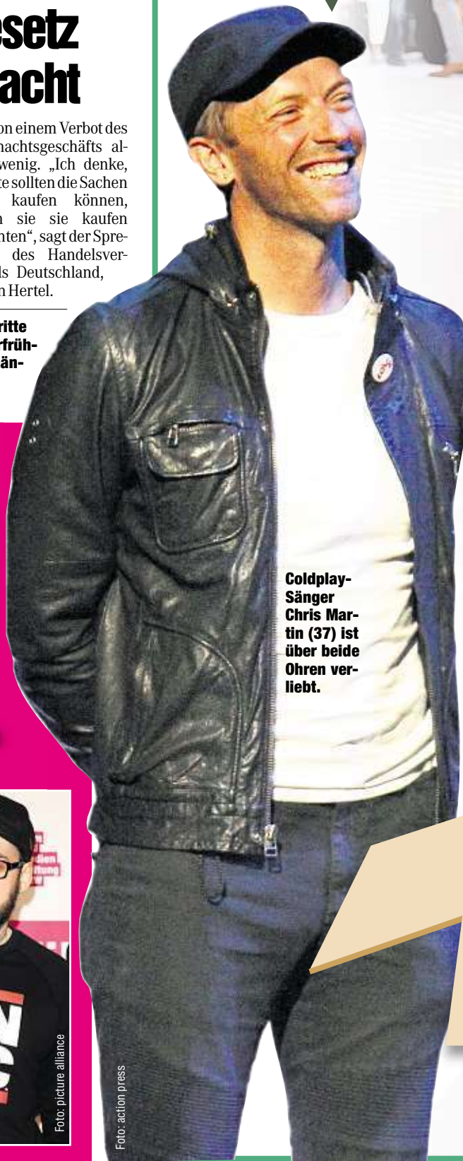
Coldplay-Sänger Chris Martin (37) ist über beide Ohren verliebt.