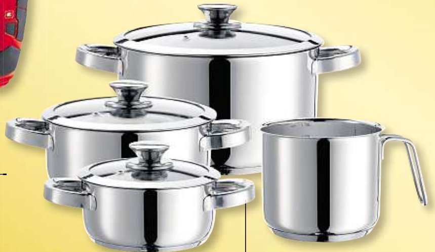
DOMESTIC BY MÄSER Edelstahl-Topfset „Varuna“, 7-tlg., für alle Herdarten geeignet, spülmaschinenfest, Art.-Nr. 22163

*Bei Belieferung in nicht zustellfähige Gebiete kostet das Abo inkl. zusätzlicher Portokosten monatlich 23,50 Euro. Bei Fragen wenden Sie sich bitte an unseren Abo-Service, Tel.: (0371) 6 90 66 33 50. Sollte die von Ihnen gewünschte Prämie nicht lieferbar sein, erhalten Sie das aktuelle Nachfolgermodell. Änderungen vorbehalten! Bitte Prämien-Gutschein und Bestell-Coupon ausschneiden und einsenden an: Chemnitzer Morgenpost, Abo-Service, Rosenhof 11, 09111 Chemnitz.