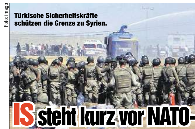
Türkische Sicherheitskräfte schützen die Grenze zu Syrien. IS steht kurz vor NATO-Grenze