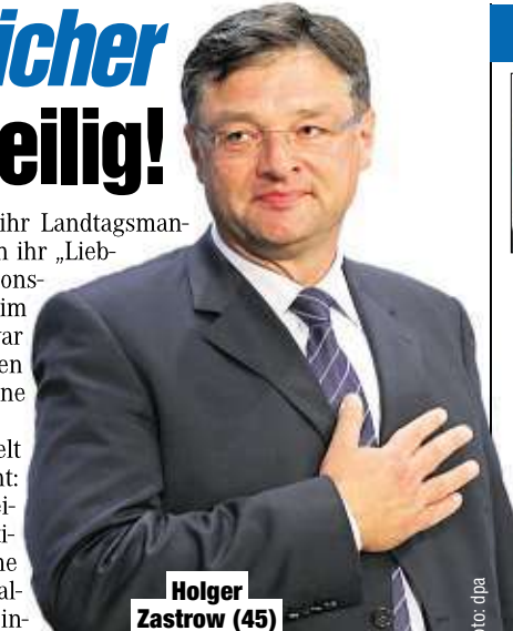
Holger Zastrow (45)

innerparteilichen Differenzen ihr Landtagsmandat ab (MOPO berichtete). Auch ihr „Lieblingsgegner“, Ex-FDP-Fraktions-Chef Holger Zastrow (45), wird im Plenum fehlen. Sein Motto war „Machete statt Florett“, was seinen Redebeiträgen eine ganz eigene Note gab. Politikprofessor Werner Patzelt (61) von der TU Dresden warnt: „Der neue Landtag wird langweilig werden, die Debatten politisches Mittelmaß. Es gibt keine mitreißenden Redner mehr. Vor allem Antje Hermenau war eine intelligente, unterhaltsame Rednerin.“