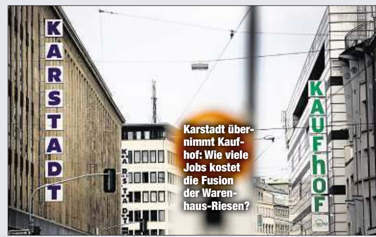
Karstadt übernimmt Kaufhof: Wie viele Jobs kostet die Fusion der Warenhaus-Riesen?

bliebenen knapp 20 000 Arbeitsplätze wegfallen. Die verbleibenden Mitarbeiter müssen sich demnach auf einen Sanierungstarifvertrag mit schlechteren Konditionen einstellen. Schon nächste Woche könnte die Bekanntgabe der Elefanten-Hochzeit folgen. Der kanadische Kaufhof-Eigentümer Hudson's Bay Company (HBC) und der österreichische Karstadt-Eigner René Benko (41) sprechen bereits seit Juni über eine mögliche Fusion der Kaufhausketten.