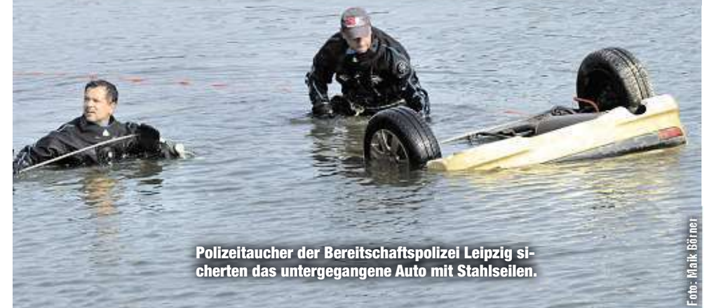
Polizeitaucher der Bereitschaftspolizei Leipzig sicherten das untergegangene Auto mit Stahlseilen.

de Mitte August bei einem Autohandel in Waldheim gestohlen.“ Eventuell zusammen mit einem VW. Dieser wurde bereits vor zwei Wochen entdeckt - ebenfalls unter Wasser, im nahen Mühlgraben. Von den Dieben gibt es noch keine Spur. Nach dem Trocknen wird sich die Kripo den Peugeot genau anschauen.