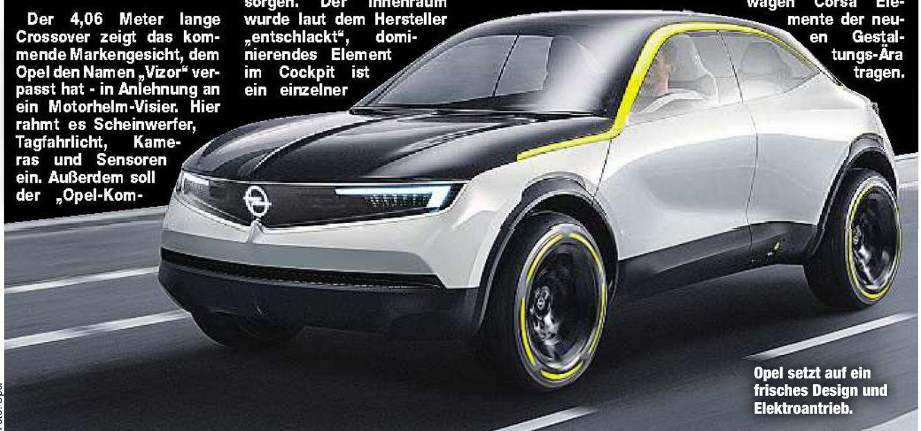
Opel setzt auf ein frisches Design und Elektroantrieb.

Bei der Technik der Studie ist der Rüsselsheimer Hersteller weniger formulierfreudig. Klar ist nur, dass ein Elektromotor als Antriebsquelle an Bord ist, den Strom liefert ein 50 kWh großer Akku. Als erstes Modell dürfte der 2019 erwartete Kleinwagen Corsa Elemente der neuen Gestaltungs-Ära tragen.