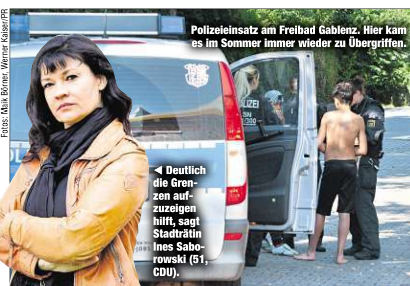
Polizeieinsatz am Freibad Gablenz. Hier kam es im Sommer immer wieder zu Übergriffen.