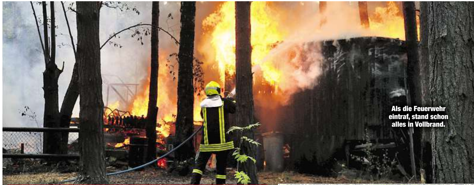
Als die Feuerwehr eintraf, stand schon alles in Vollbrand.