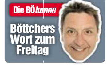
Die BÖlume Böttchers Wort zum Freitag

Prost, schönes Wochenende, Euer Böttcher! der-böttcher.de