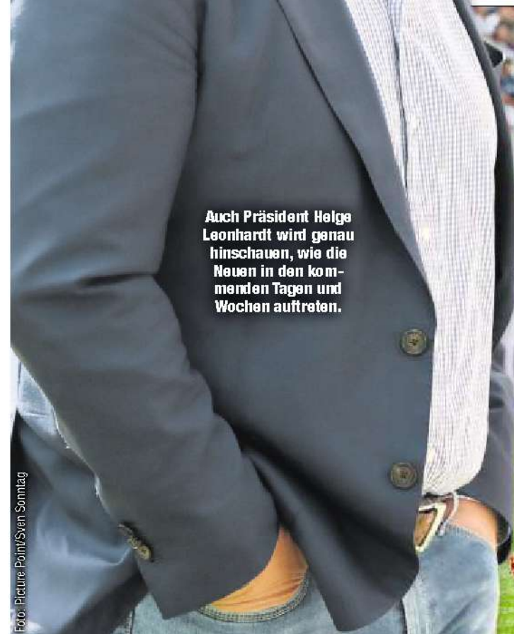
Auch Präsident Helge Leonhardt wird genau hinschauen, wie die Neuen in den kommenden Tagen und Wochen auftreten.