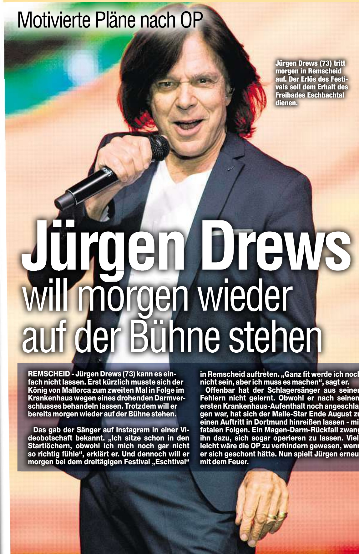
Jürgen Drews (73) tritt morgen in Remscheid auf. Der Erlös des Festivals soll dem Erhalt des Freibades Eschbachtal dienen.