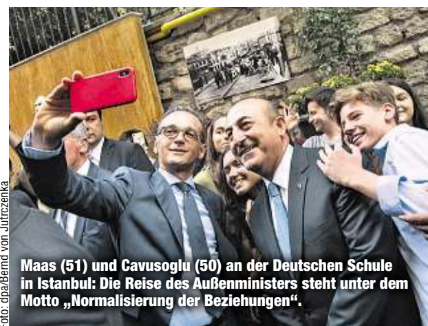
Maas (51) und Cavusoglu (50) an der Deutschen Schule in Istanbul: Die Reise des Außenministers steht unter dem Motto „Normalisierung der Beziehungen“.

ISTANBUL - Ein Selfie für die deutsch-türkischen Beziehungen: Außenminister Heiko Maas (51, SPD) und sein Amtskollege Mevlüt Cavusoglu (50) lächeln gemeinsam in die Handy-Kamera und demonstrieren völlige Entspannung im Verhältnis zwischen beiden Ländern. Die Minister trafen sich zum 150-jährigen Bestehen der Deutschen Schule in Istanbul. Wenn die deutsch-türkische Zusammenarbeit „bei uns so gut geht, wie hier an der Schule, dann haben wir schon vieles geschafft“, sagte Maas mit Blick auf die lange Zeit zerrütteter Beziehungen, die jetzt wieder normalisiert werden sollen. „Zwischen der Türkei und Deutschland ist die Freundschaft tatsächlich eine historische, eine tief verwurzelte“, sagte Cavusoglu. Die Schule sei dafür ein gutes Beispiel. Kein Wort mehr gab es zu Deutschen in türkischen Knästen oder den Nazi-Vergleichen des türkischen Staats-Chefs Recep Tayyip Erdogan (64).