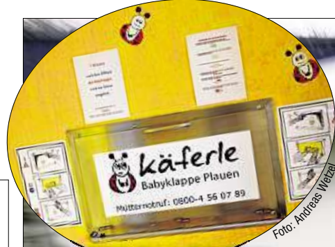
Die nächstgelegene Babyklappe befindet sich in Plauen.

15-Jährige kam am Nachmittag schwer verletzt in eine Klinik. Obwohl der Kinderwagen auf der Straße umkippte, blieb das zwei Jahre alte Kind, ein Junge, unverletzt.