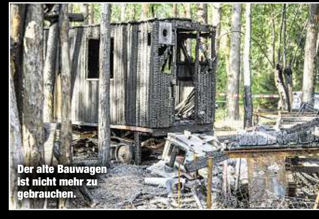
Der alte Bauwagen ist nicht mehr zu gebrauchen.