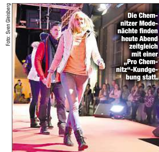
Die Chemnitzer Modenächte finden heute Abend zeitgleich mit einer „Pro Chemnitz“-Kundgebung statt.

Modenschauen und politische Parolen: Am Wochenende finden die Modenächte in der Innenstadt statt - gleichzeitig veranstaltet die rechtspopulistische Bewegung „Pro Chemnitz“ heute Abend wieder eine Kundgebung am Nischel. Viele Händler haben Angst. Teilnehmende Händler sind besorgt, hatten bereits während der vergangenen Demo-Tage Umsatzeinbu-