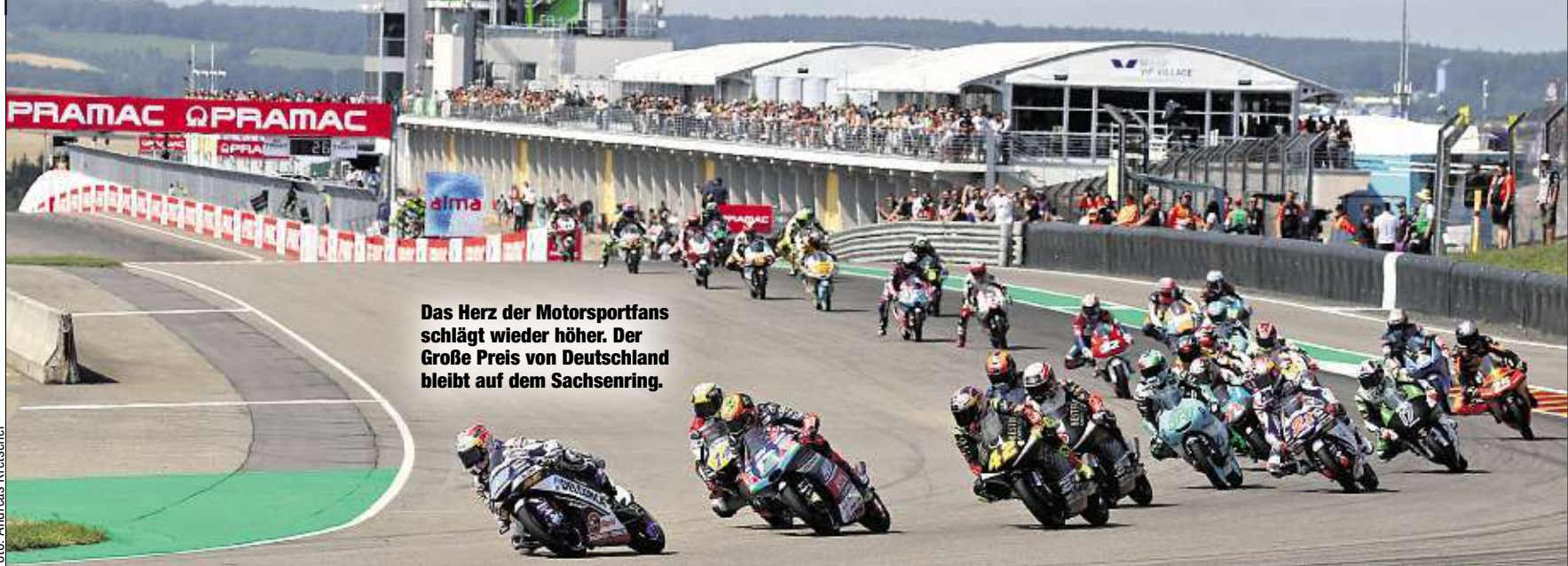
Das Herz der Motorsportfans schlägt wieder höher. Der Große Preis von Deutschland bleibt auf dem Sachsenring.