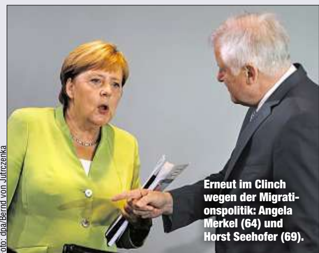
Erneut im Clinch wegen der Migrationspolitik: Angela Merkel (64) und Horst Seehofer (69).

BERLIN - Die Union ist wieder im Streit-Modus. Und wieder einmal geht es um Migration. Gezündelt hat Innenminister Horst Seehofer (69, CSU) - vor allem in Sorge vor dem Absturz seiner Partei bei der Landtagswahl in Bayern. Seehofer sieht in der Migrationsfrage „die Mutter aller Probleme“ hierzulande. Der CSU-Chef äußerte zudem Verständnis für die Vorfälle in Chemnitz, distanzierte sich aber von Rechtsradikalen. Kanzlerin Angela Merkel (64, CDU) widersprach der Einschätzung ihres Heimatministers. „Ich sag' das anders“, sagte Merkel im RTL-Interview: „Ich sage, die Migrationsfrage stellt uns vor Herausforderungen. Und dabei gibt es auch Probleme.“ Es gebe aber auch Erfolge. In Chemnitz habe man Demonstrationen erlebt „mit Erscheinungen, die nicht in Ordnung sind. Hasserfüllt und auch gegen andere Menschen gerichtet“, sagte Merkel. Es habe aber auch Demonstrationen gegeben, die gezeigt hätten, „wie Menschen auch dagegen aufstehen gegen Fremdenfeindlichkeit und Rassismus.“