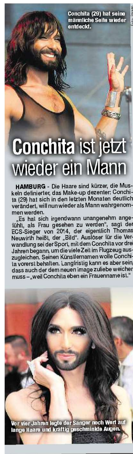
Conchita (29) hat seine männliche Seite wieder entdeckt.

zeistreife den Jungen. Dabei beendete der Elfjährige seine Überlandfahrt gekonnt, er parkte den Wagen sicher am Straßenrand. Die Beamten brachten den Ausflügler schließlich zurück zu seiner völlig überraschten Mutter. Die Fahrkenntnisse hatte der Elfjährige beim Treckerfahren erworben.