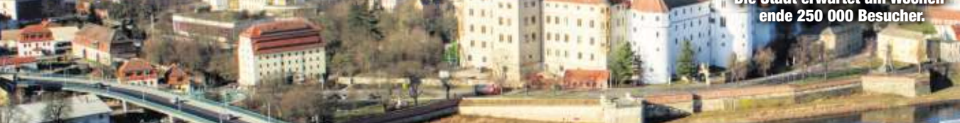
Torgau aus der Vogelperspektive. Die Stadt erwartet am Wochenende 250 000 Besucher.

Es ist das größte Volksfest im Land und ein Schaufenster sächsischen Vereinslebens: Heute Nachmittag beginnt mit dem Tag der Sachsen die dreitägige Supersause im nordsächsischen Torgau.