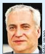
Ingmar De Vos

Dubai in speziell umgebauten Transportmaschinen des Typs Boeing 777. „Das ist die größte kommerzielle Pferde-Luftbrücke in der Geschichte. Nur Transporte zu Kriegszeiten kommen dem nahe“, so Präsident Ingmar De Vos vom Weltverband FEI.