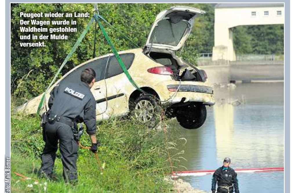
Peugeot wieder an Land: Der Wagen wurde in Waldheim gestohlen und in der Mulde versenkt.