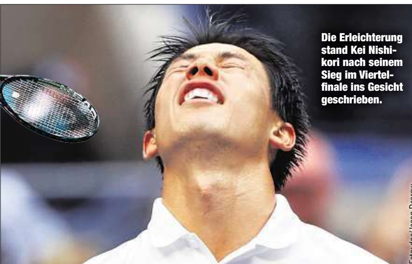
Die Erleichterung stand Kei Nishikori nach seinem Sieg im Viertelfinale ins Gesicht geschrieben.

che Bänderverletzungen im Sprunggelenk zugezogen. Drei Außenbänder sowie das Innenband sind gerissen, zudem erlitt die 24-Jährige eine Teilruptur im