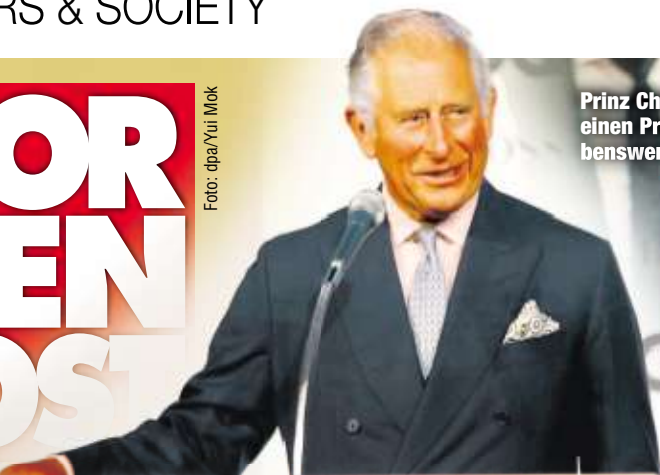
Prinz Charles (69) bekam einen Preis für sein Lebenswerk.