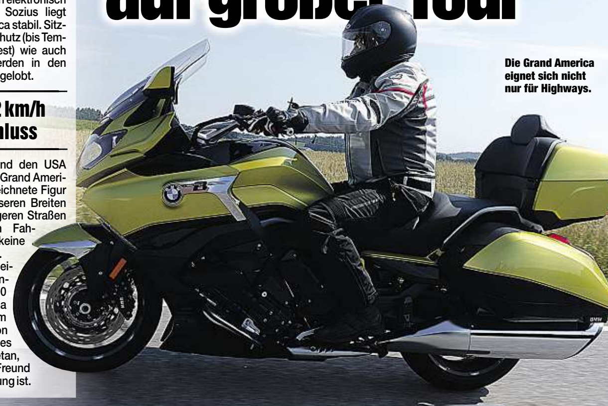
Die Grand America eignet sich nicht nur für Highways.