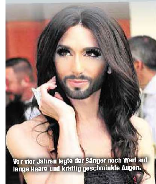
Vor vier Jahren legte der Sänger noch Wert auf lange Haare und kräftig geschminkte Augen.

„Es hat sich irgendwann unangenehm angefühlt, als Frau gesehen zu werden“, sagt der ECS-Sieger von 2014, der eigentlich Thomas Neuwirth heißt, der „Bild“. Auslöser für die Verwandlung sei der Sport, mit dem Conchita vor drei Jahren begann, um die viele Zeit im Flugzeug auszugleichen. Seinen Künstlernamen wolle Conchita vorerst behalten. Langfristig kann es aber sein, dass auch der dem neuen Image zuliebe weichen muss - „weil Conchita eben ein Frauenname ist.“