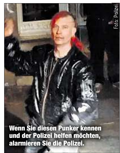
Wenn Sie diesen Punker kennen und der Polizei helfen möchten, alarmieren Sie die Polizei.

LEIPZIG - Nach Übergriffen auf ihre Beamten zu Silvester am Connewitzer Kreuz fahndet Leipzigs Polizei nun öffentlich nach diesem rothaarigen Punker (Foto). Ihm wird Landfriedensbruch vorgeworfen. Laut Polizei soll sich der etwa 30 bis 40 Jahre alte Herr mit der Irokesenfrisur und den großen Ohrringen mit einer Holzlatte an einem Wasserwerfer abgearbeitet haben. Das Polizeifahrzeug trug bei dem Kampf Mensch gegen Maschine erhebliche Blessuren davon. Die Behörde würde den Gesuchten gern an den Reparaturkosten in Höhe von 5 000 Euro beteiligen.