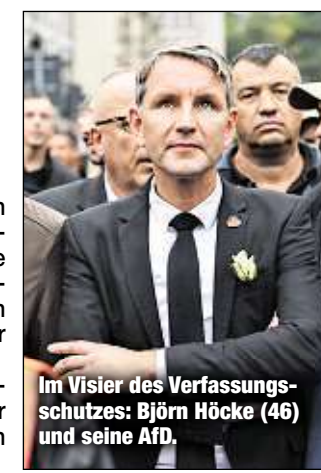
Im Visier des Verfassungsschutzes: Björn Höcke (46) und seine AfD.

Laut ARD-DeutschlandTrend finden 65 Prozent der Bundesbürger eine Beobachtung der AfD durch den Verfassungsschutz angemessen (+3 Punkte im Vergleich zum Juli 2016).