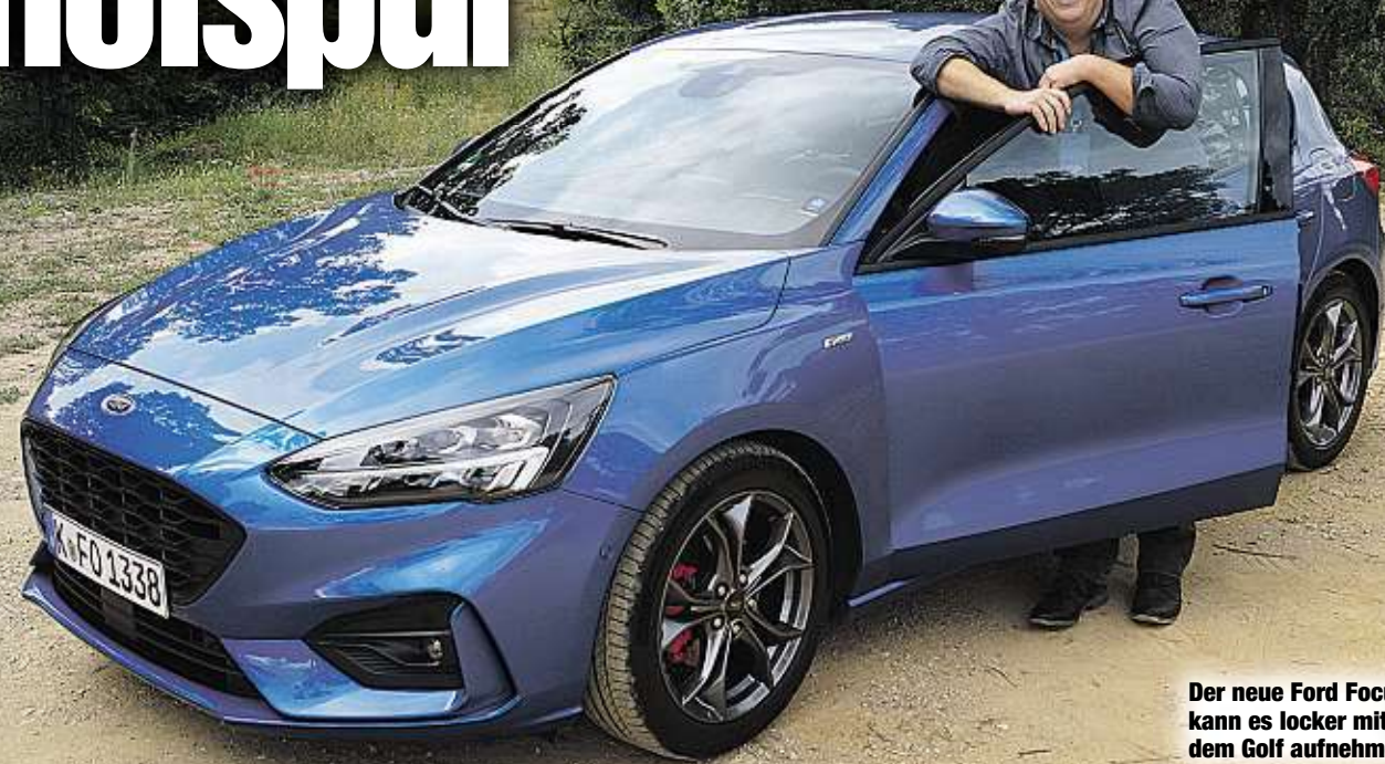
Der neue Ford Focus kann es locker mit dem Golf aufnehmen.

Motor: 1,5-Liter-Dreizylinder-Turbobenziner mit 110 kW/150 PS Max. Drehmoment: 240 Nm bei 6 000 U/min 0-100 km/h: 8,8 Sekunden Spitze: 210 km/h Verbrauch: 5,3 l/100 km CO 2 -Ausstoß: 121 g/km Abgasnorm: Euro 6d-temp Preis: ab 25 200 Euro