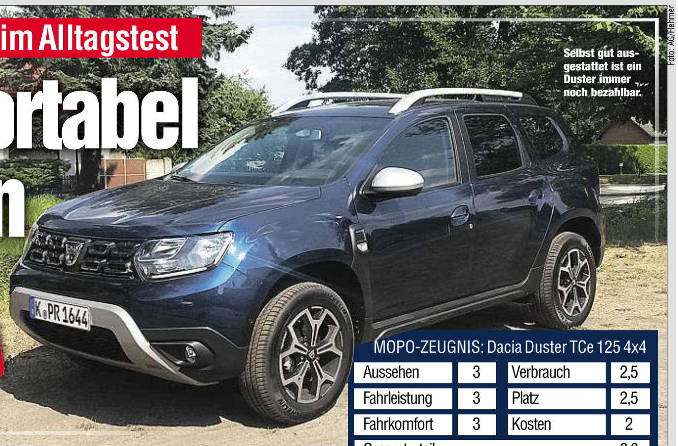
Selbst gut ausgestattet ist ein Duster immer noch bezahlbar.