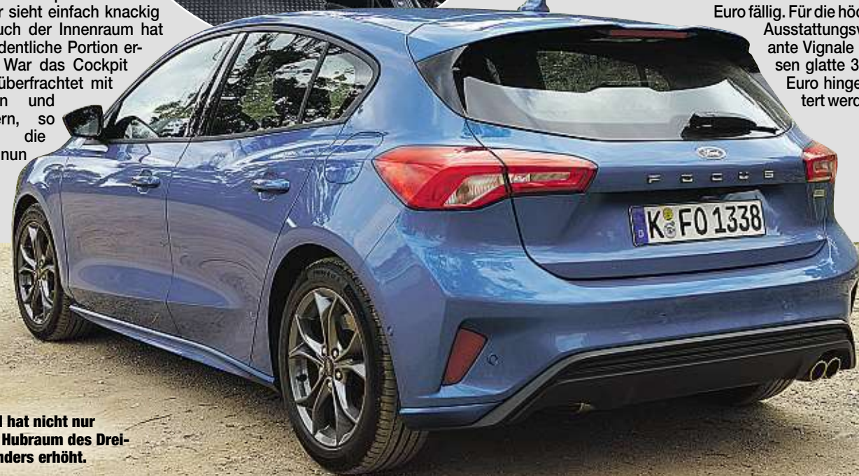
Ford hat nicht nur den Hubraum des Dreizylinders erhöht.

Um in den Genuss des Fahrspaßes zu kommen, müssen mindestens 18 700 Euro bereitgehalten werden. Einen Tausender mehr kostet die Kombiversion. Doch die Basisvariante wird eher nicht den Hof des Händlers verlassen. Der 150 PS starke 1.5 EcoBoost kostet in der Variante Cool & Connect 25 200. Für die bereits gut ausgestattete ST-Line werden weitere 1300 Euro fällig. Für die höchste Ausstattungsvariante Vignale müssen glatte 30000 Euro hingeblickert werden.