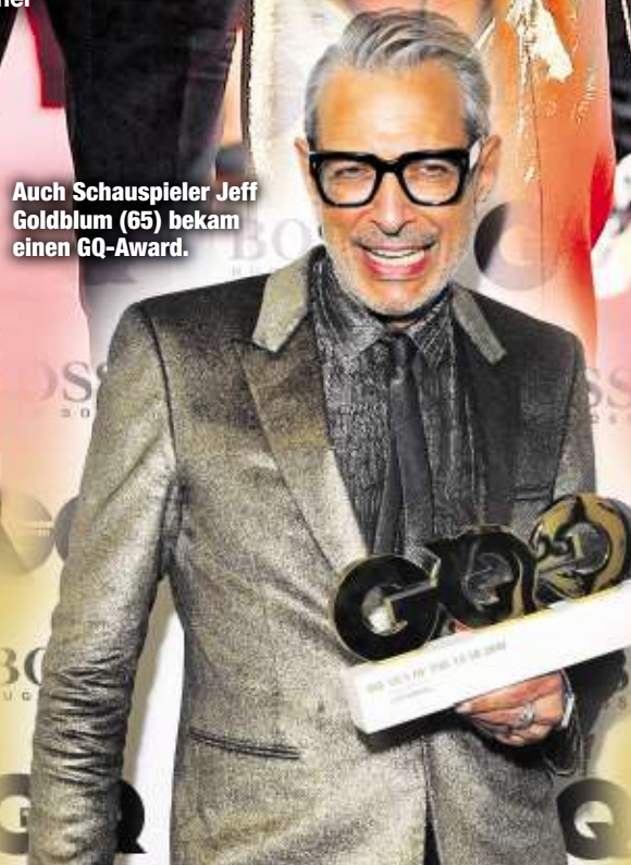
Auch Schauspieler Jeff Goldblum (65) bekam einen GQ-Award.