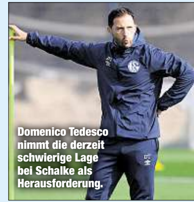
Domenico Tedesco nimmt die derzeit schwierige Lage bei Schalke als Herausforderung.