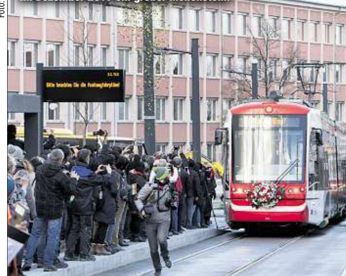
Großer Bahnhof an der Uni: Die Eröffnung des Abschnitts bis zum Campus und Technopark war im Dezember 2017 ein großer Meilenstein.

Für Thomas Rebsch (35) und Timo Stocker (30) wird die Spielzeit-Eröffnungsgala zur Feuerprobe: Das Gastonomen-Duo übernahm kürzlich den Theaterclub, weil sie darin die perfekte Ergänzung zu ihrem Saisongeschäft in der Spinnerei sehen. „Im Theaterclub startet die Saison, wo sie für unser Team in der 'Spinnerei' endet“, erklärt Rebsch. Neben neuem Mobiliar, neuer Bar und Küche gibt es auch eine neue Getränkekarte: „Es wird viele gute Weine, Bier vom Fass, Gins und Whiskys geben.“ Der Eintritt zur großen Party (Beginn: 19.30 Uhr) ist kostenlos. ISM