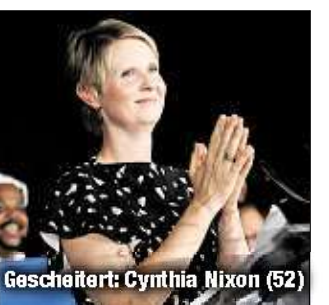
Gescheitert: Cynthia Nixon (52)

Zum Weltstar wurde Nixon durch ihre Rolle als Karriere-Anwältin Miranda Hobbes in der Erfolgsserie „Sex and the City“. Sie gilt als liberal, lebt mit ihrer Ehefrau und drei Kindern in Manhattan. Schon vor ihrer Entscheidung, als Gouverneurin antreten zu wollen, engagierte sich Nixon politisch. Den Ausschlag für die Kandidatur gab schließlich die Wahl Donald Trumps (72) zum US-Präsidenten.