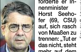
Sigmar Gabriel (59)