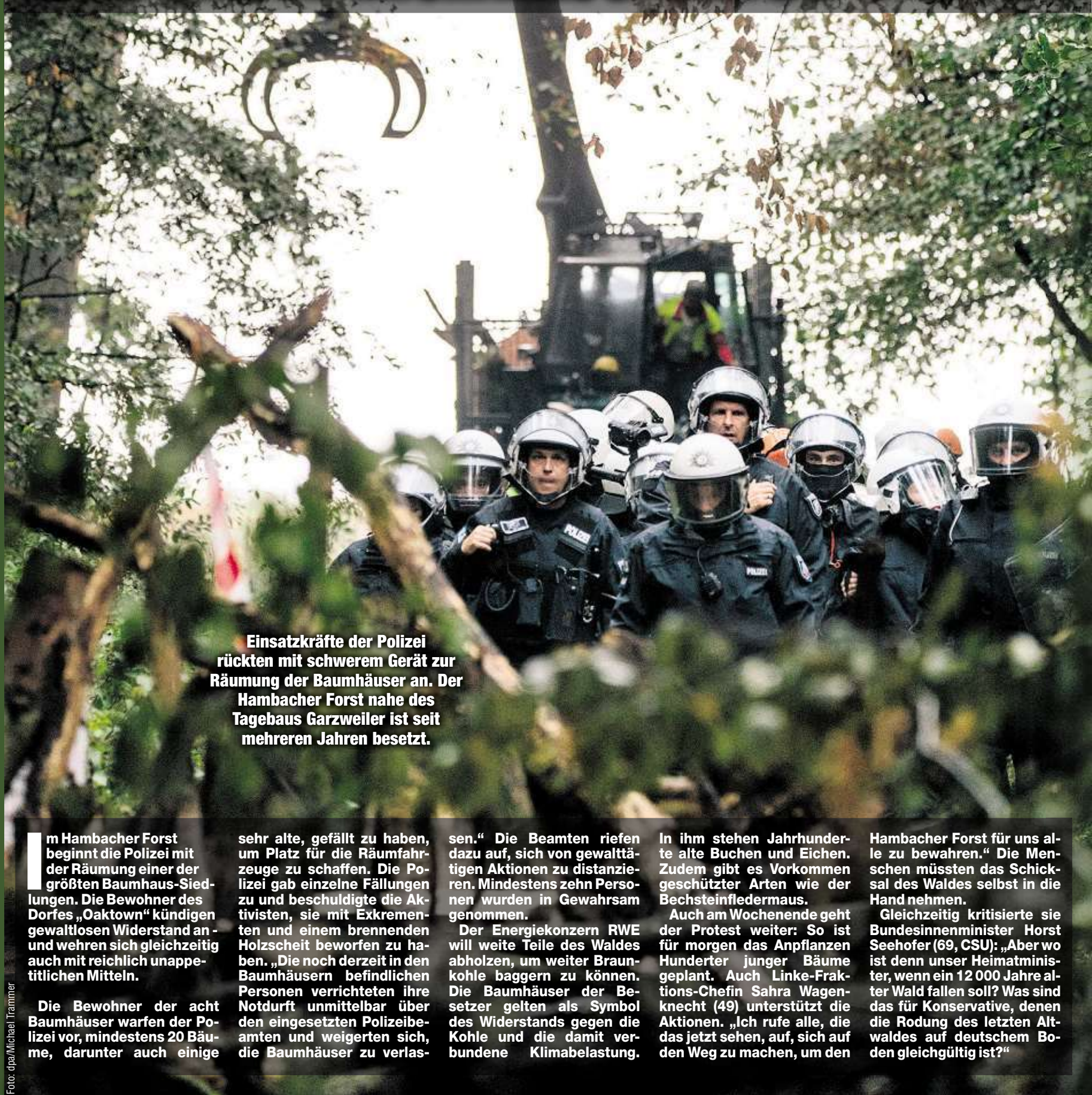
Einsatzkräfte der Polizei rückten mit schwerem Gerät zur Räumung der Baumhäuser an. Der Hambacher Forst nahe des Tagebaus Garzweiler ist seit mehreren Jahren besetzt.

Im Hambacher Forst beginnt die Polizei mit der Räumung einer der größten Baumhaus-Siedlungen. Die Bewohner des Dorfes „Oaktown“ kündigen gewaltlosen Widerstand an und wehren sich gleichzeitig auch mit reichlich unappetitlichen Mitteln.