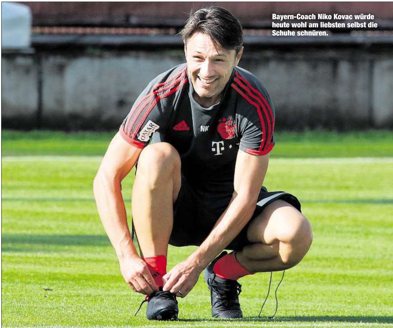
Bayern-Coach Niko Kovac würde heute wohl am liebsten selbst die Schuhe schnüren.

N iko Kovac war die Vorfreude auf spannende Wochen mit dem FC Bayern anzumerken. „Es ist etwas Schönes, wenn man jeden dritten Tag spielt“, sagte der Münchner Coach vor dem ersten von sieben Spielen in 22 Tagen. „Dann muss man an der Motivation und Konzentration der Spieler nicht allzu viel machen.“