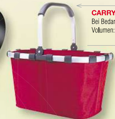
CARRYBAG von REISENTHEL Bei Bedarf flach zusammenzulegen, Volumen: ca. 22 l, max. 30 kg Art.-Nr. 56000