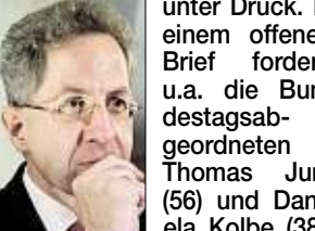
Hans-Georg Maaßen (55)