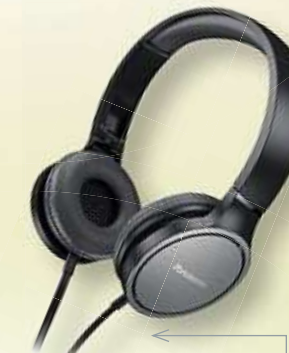
OVEREAR-KOPFHÖRER von PANASONIC | RP-HF500M, mit Mikrofon & Controller Art.-Nr. 2058141