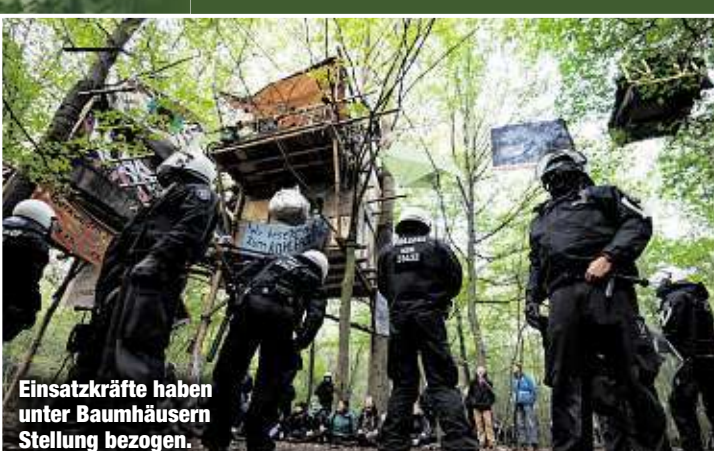
Einsatzkräfte haben unter Baumhäusern Stellung bezogen.