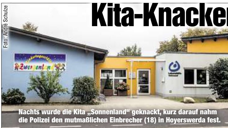
Nachts wurde die Kita „Sonnenland“ geknackt, kurz darauf nahm die Polizei den mutmaßlichen Einbrecher (18) in Hoyerswerda fest.