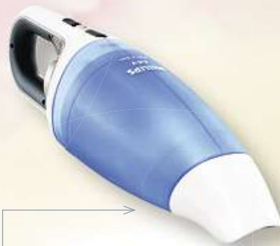
AKKUSAUGER „WET & DRY“ von PHILIPS | mit Ladestation Art.-Nr. 10568