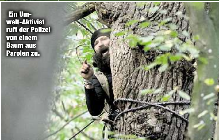
Ein Umwelt-Aktivist rief der Polizei von einem Baum aus Parolen zu.

Hambacher Forst für uns alle zu bewahren.“ Die Menschen müssten das Schicksal des Waldes selbst in die Hand nehmen. Gleichzeitig kritisierte sie Bundesinnenminister Horst Seehofer (69, CSU): „Aber wo ist denn unser Heimatminister, wenn ein 12 000 Jahre alter Wald fallen soll? Was sind das für Konservative, denen die Rodung des letzten Altwaldes auf deutschem Boden gleichgültig ist?“