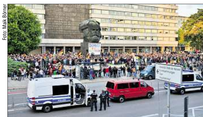
Rund 1.200 Teilnehmer trafen sich am Abend im Zentrum zur Demo.

die Teilnehmer „Widerstand“. Nach MOPo-Informationen will „Pro Chemnitz“ bis Juni 2019 jeden Freitag demonstrieren. bri