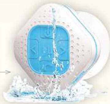
BLUETOOTH LAUTSPRECHER von SOUNDMASTER | mit Freisprech- funktion, spritzwassergeschützt, Über- tragungsweite ca. 10 m Art.-Nr. 47990