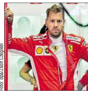
Sebastian Vettel schaute gestern nach dem Training enttäuscht drein.

Quali (15.00 Uhr) und den möglicherweise richtungsweisenden morgigen Nacht-Grand Prix (15.10 Uhr) vorzubereiten, konnte der 31-Jährige nur noch zuschauen. „Schlecht war es nicht. Natürlich hat jetzt am Abend etwas die Zeit gefehlt“, meinte der Vierfach-Champion. „Wir müssen noch etwas an der Balance tüfteln und das Auto schneller machen.“ Der Schaden sei nicht so schlimm, versicherte der Heppenheim.