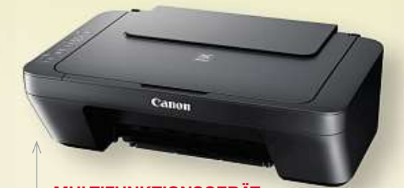
MULTIFUNKTIONSGERÄT „PIXMA 3-IN-1“ von CANON | Tintenstrahl-Druck/Scannen/Kopieren Art.-Nr. 51616