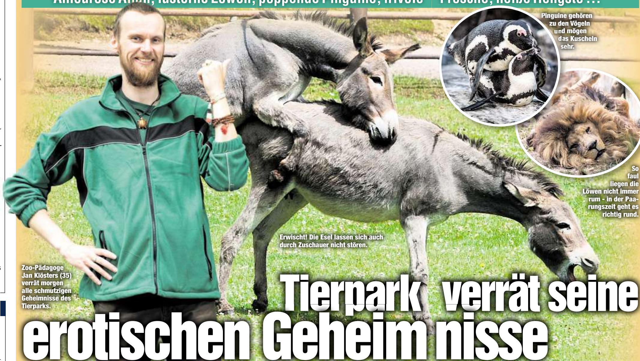
Pinguine gehören zu den Vögeln und mögen das Kuschneln sehr.