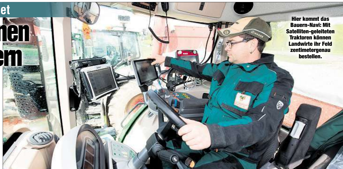
Hier kommt das Bauern-Navi: Mit Satelliten-geleiteten Traktoren können Landwirte ihr Feld zentimetergenau bestellen.

Ein Effekt: Die Bewirtschaftung (Bodenbearbeitung, Aussaat, Düngung) ist standortbezogen möglich. So kann Pflanzenschutz stärker an die lokalen Gegebenheiten angepasst, also umwelt- und ressourcenschonender ausgebracht werden. Die SAPOS-Daten übrigens stammen von den Satellitensystemen GPS (USA) und GLO-NASS (Russland).