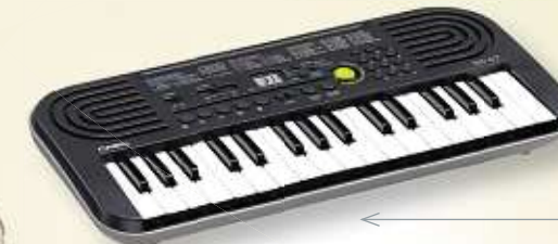
MINI-KEYBOARD von CASIO SA-47, ca. 446 x 208 x 51 mm (BxTxH), 1 kg, 100 Klangfarben/50 Rhythmen/10 Übungsstücke Art.-Nr. 64179