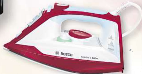
DAMPFBÜGELEISEN „SENSIXX“ von BOSCH | max. 2.400 Watt Art.-Nr. 10900