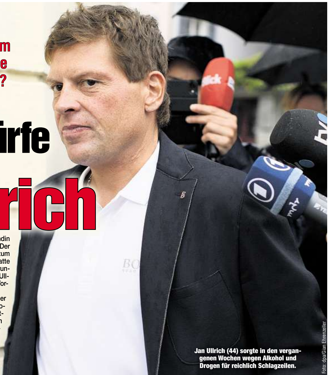
Jan Ullrich (44) sorgte in den vergangenen Wochen wegen Alkohol und Drogen für reichlich Schlagzeilen.

Erst im August hatte der einstige Rad-Profi für drei Wochen einen Entzug in der „Betty Ford“-Klinik im bayrischen Bad Brückenau gemacht. Eigentlich wollte der vierfache Vater die Therapie in den USA fortsetzen. Dazu ist es bislang allerdings noch nicht gekommen.