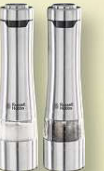
EDELSTAHL-SALZ- UND PFEFFERMÜHLE „CLASSICS“ von RUSSELL HOBBS | elektr., 2er-Set, mit Beleuchtung, Mahlgrad einstellbar, Batterien nicht enthalten Art.-Nr. 27242