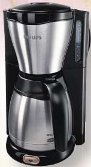
KAFFEEAUTOMAT „GAIA THERM“ von PHILIPS | mit Thermokanne, 1,2 l, 10–15 Tassen Art.-Nr. 2685