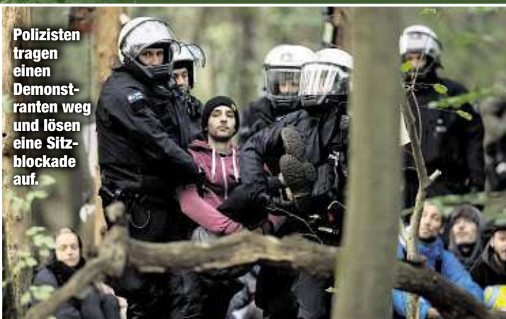
Polizisten tragen einen Demonstranten weg und lösen eine Sitzblockade auf.