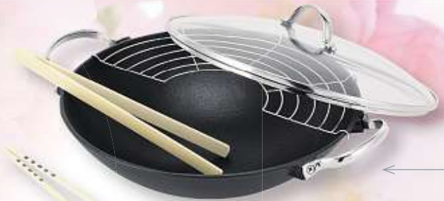
GUSSEISEN-WOK-SET „LHASA“ von BEKA 5-tlg., für alle Herdarten geeignet Art.-Nr. 5542