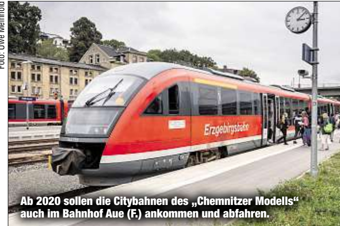
Ab 2020 sollen die Citybahnen des „Chemnitz'ers Modells“ auch im Bahnhof Aue (F) ankommen und abfahren.

In gut zwei Jahren sollen die Citybahnen durchs Zwönitztal bis nach Aue fahren. Perspektivisch stehen dann noch die Verbindungen nach Niederwiesa (Stufe 3), Limbach-Oberfrohna (Stufe 4) und Oelsnitz/E. (Stufe 5) an. Hierfür planen die VMS-Macher langfristig den Ankauf von 20 neuen Zügen. Ronny Licht