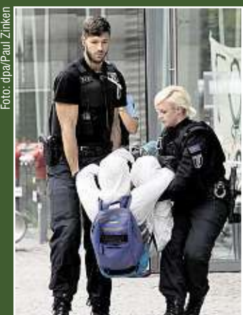
Ein Besetzer der NRW-Landesvertretung wird von Beamten herausgetragen.

Nachdem die Landesvertretung einen Strafantrag wegen Hausfriedensbruchs gestellt hatte, trugen Polizisten die Aktivisten aus dem Gebäude. Die Personalien wurden aufgenommen und Anzeigen erstattet. 60 Beamte waren im Einsatz. Die Besetzer gehörten zu der Initiative „Ende Gelände“. Sie hatten zunächst erklärt, dass Gebäude solange zu belagern, bis die Räumaktion im Wald beendet werde. Ihre Begründung: Die Landesregierung von NRW mache sich zum Handlanger von Wirtschaftsinteressen. Der Energie-Konzern RWE sei eine Gefahr für den Wald und für das Klima weltweit.