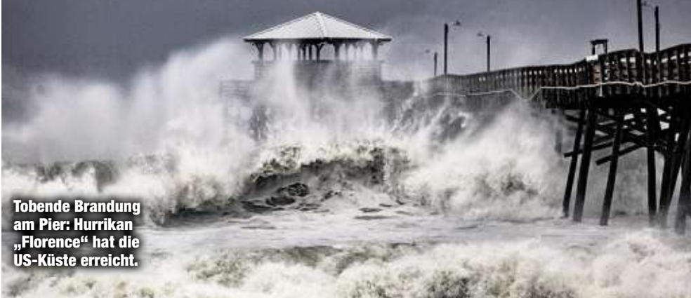
Tobende Brandung am Pier: Hurrikan „Florence“ hat die US-Küste erreicht.

rence“ an der US-Küste wütet, kämpft Südostasien mit einem noch gewaltigeren Sturm. Supertaifun „Mangkhut“, der bislang stärkste in dieser Saison, soll die Philippinen heute erreichen. Allerdings hat die Ostküste der USA eine teurere und besser ausgebaute Infrastruktur als Südostasien, daher werden die Kosten des Schadens in den USA höher sein. Zudem liegen 17 Atomkraftwerke in Florence' Einzugsgebiet.