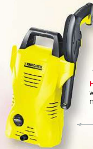
HOCHDRUCKREINIGER von KÄRCHER | K 2 Basic, max. 110 bar/ 1.400 Watt Art.-Nr. 10900