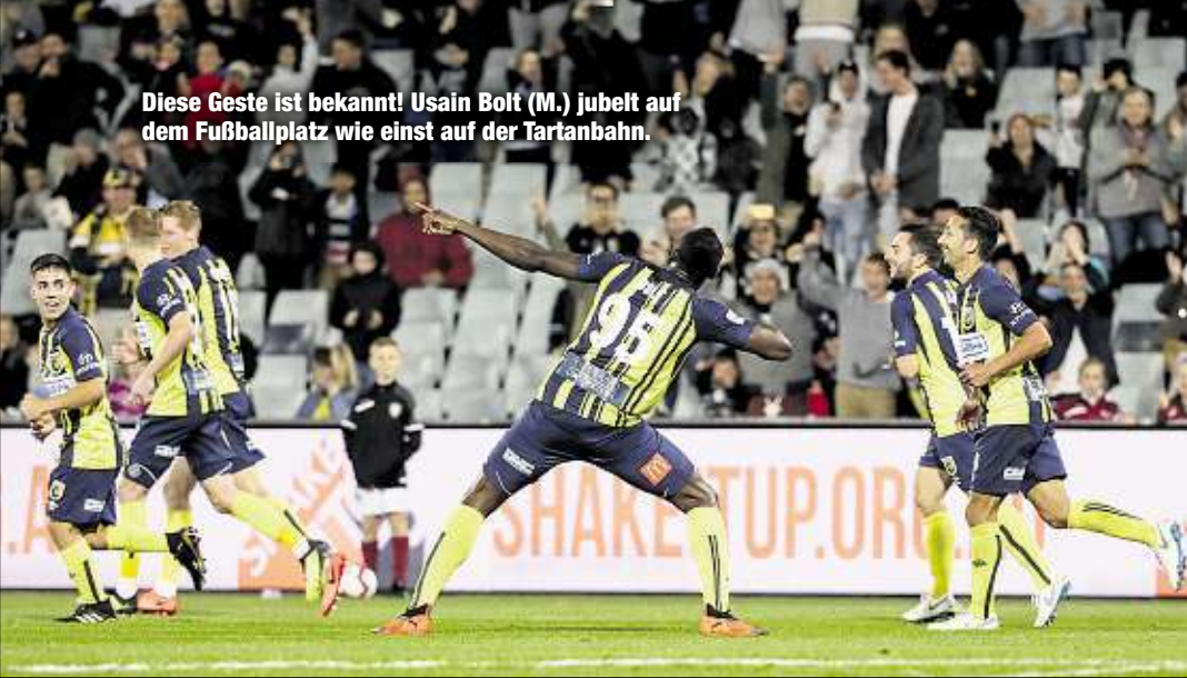
Diese Geste ist bekannt! Usain Bolt (M.) jubelt auf dem Fußballplatz wie einst auf der Tartanbahn.

angeboten hat. Sie wurden von neuen Besitzern übernommen, die den Anspruch haben, Champions League zu spielen.“ Der FC Valletta, der 24 Mal den Titel auf der Mittelmeerinsel holte, war erst im September von einer Sponsoren-Gruppe aus Abu Dhabi übernommen worden. Die neuen Investoren setzen sich zum Ziel, den Verein in die Spitze des europäischen Fußballs zu führen.