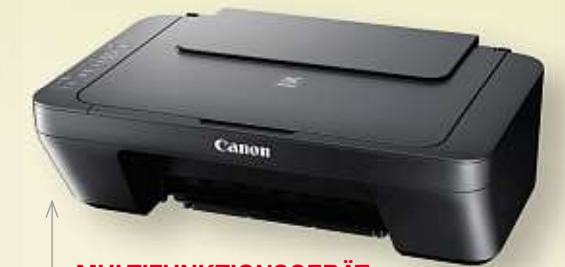
MULTIFUNKTIONSGERÄT „PIXMA 3-IN-1“ von CANON | Tintenstrahl-Druck/Scannen/Kopieren Art.-Nr. 51616