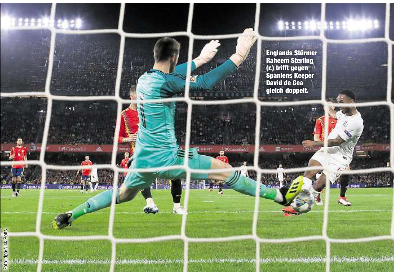
Englands Stürmer Raheem Sterling (r.) trifft gegen Spaniens Keeper David de Gea gleich doppelt.

Immerhin: Alcácer wurde in den Reihen der La Roja gefeiert. Der Stürmer von Borussia Dortmund wurde in der 57. Minute eingewechselt und traf schon eine Minute später zum 1:3.