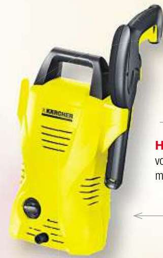
HOCHDRUCKREINIGER von KÄRCHER | K 2 Basic, max. 110 bar/ 1.400 Watt Art.-Nr. 10900