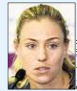
Angeli- que Kerber

SINGAPUR - Wenige Tage vor den WTA-Finals in Singapur hat sich Angeli- que Kerber „aufgrund von unter-