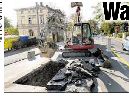
Wasserrohrbruch in der Dresdner Straße: Ein Bagger gräbt sich zum Leck vor.