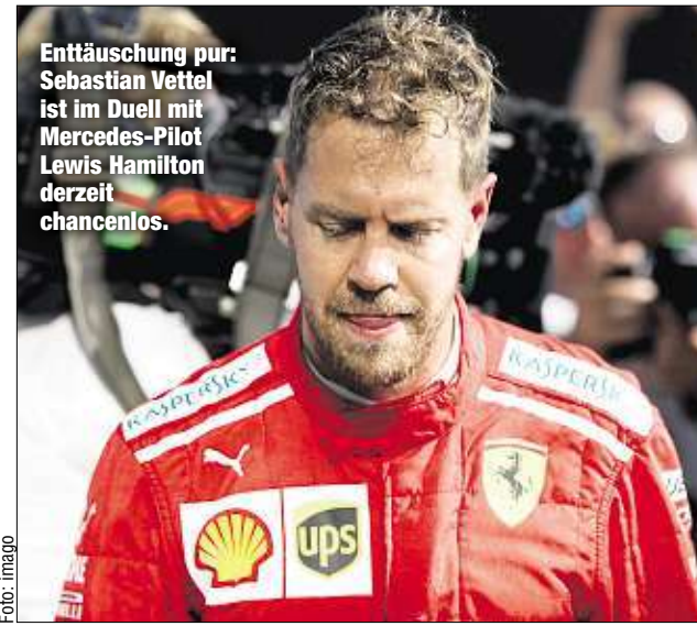
Enttäuschung pur: Sebastian Vettel ist im Duell mit Mercedes-Pilot Lewis Hamilton derzeit chancenlos.

AUSTIN - Ach ja, der Anfang war so schön. „Es gibt viele Märchen über Ferrari und wie es sich anfühlt, ein rotes Auto zu fahren“, sagte Sebastian Vettel Anfang Dezember 2014: „Am Ende kann ich diese Märchen nur bestätigen. Es handelt sich nicht bloß um eine Geschichte, da existiert eine echte Legende.“