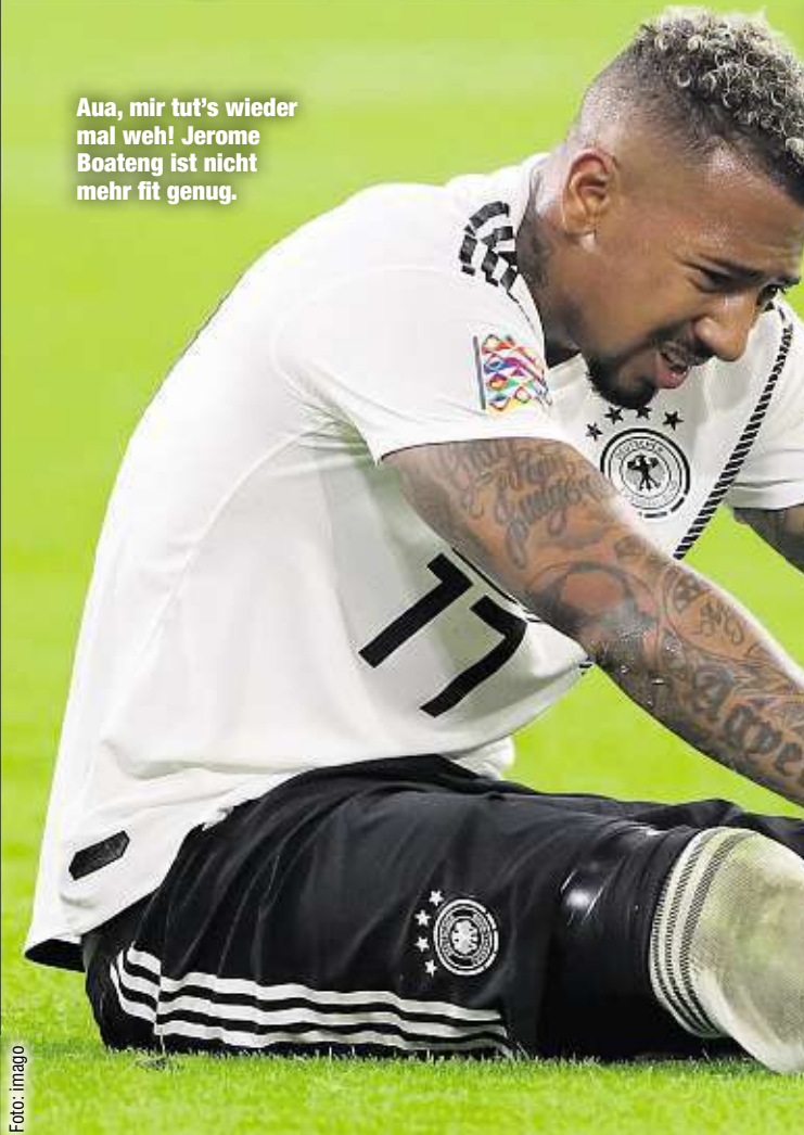
Aua, mir tut's wieder mal weh! Jerome Boateng ist nicht mehr fit genug.

PARIS - Zwischen Jerome Boateng und Paris entwickelt sich wohl keine große Liebe mehr.