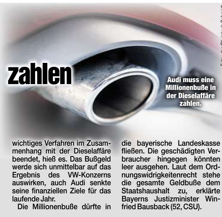
Audi muss eine Millionenbuße in der Diesellaffäre zahlen.

Erst im Sommer hatte die Staatsanwaltschaft Braunschweig ein Bußgeld über eine Milliarde Euro gegen Volkswagen verhängt. Mit dem Bußgeldbescheid werde ein weiteres