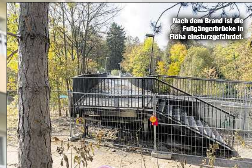
Nach dem Brand ist die Fußgängerbrücke in Flöha einsturzgefährdet.