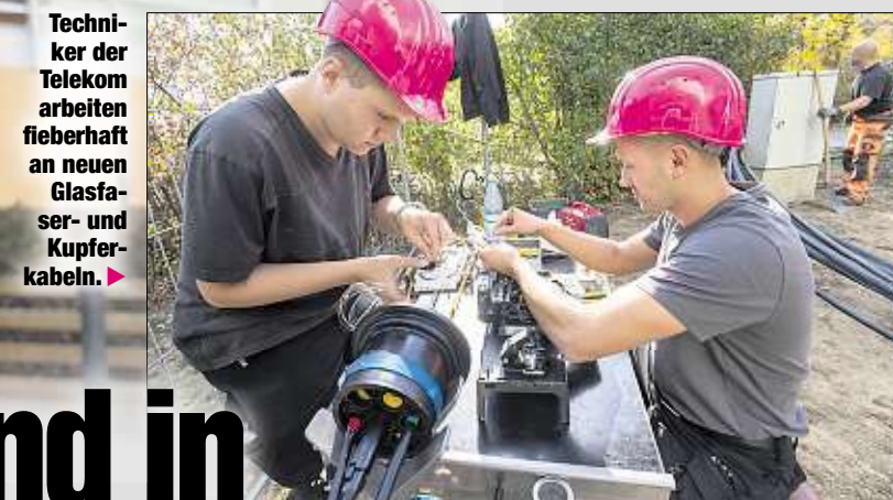
Techniker der Telekom arbeiten fiebrig an neuen Glasfaser- und Kupferkabeln.