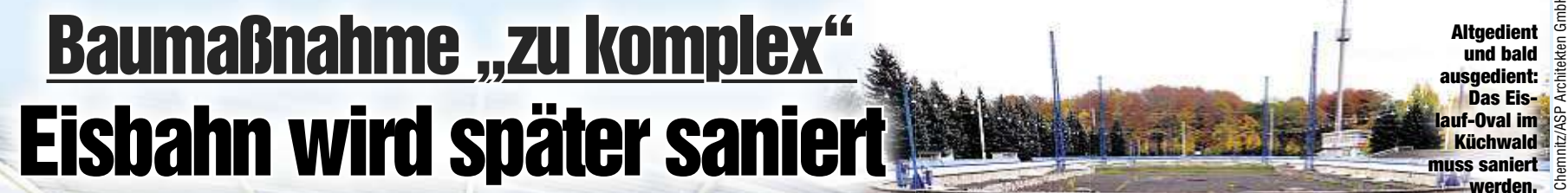
Altgedient und bald ausgedient: Das Eislauf-Oval im Küchwald muss saniert werden.

Schnittig: So soll die Eisbahn im Chemnitzer Küchwald aussehen. Das Bauvorhaben verschiebt sich um ein Jahr.