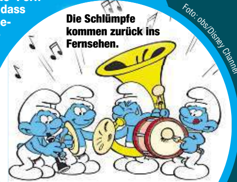
Die Schlümpfe kommen zurück ins Fernsehen.

ERFURT - Ein super Plan pünktlich zum Jubiläum: 60 Jahre nach ihrem ersten Auftritt bekommen die Schlümpfe eine neue Fernsehserie. „Ich bin überzeugt, dass die Schlümpfe weiter alle Generationen erfreuen werden“, erklärte Véronique Culliford, die Tochter des Schlumpf-Erfinders Peyo (†64). Sie wirkt als Co-Produzentin mit. Starttermin für die schlumpfige Serie ist das Jahr 2021. Hierzulande zeigt sie der Kinderkanal, wie der Sender mitteilte. Und dann heißt es wieder „La la lala lala ...“