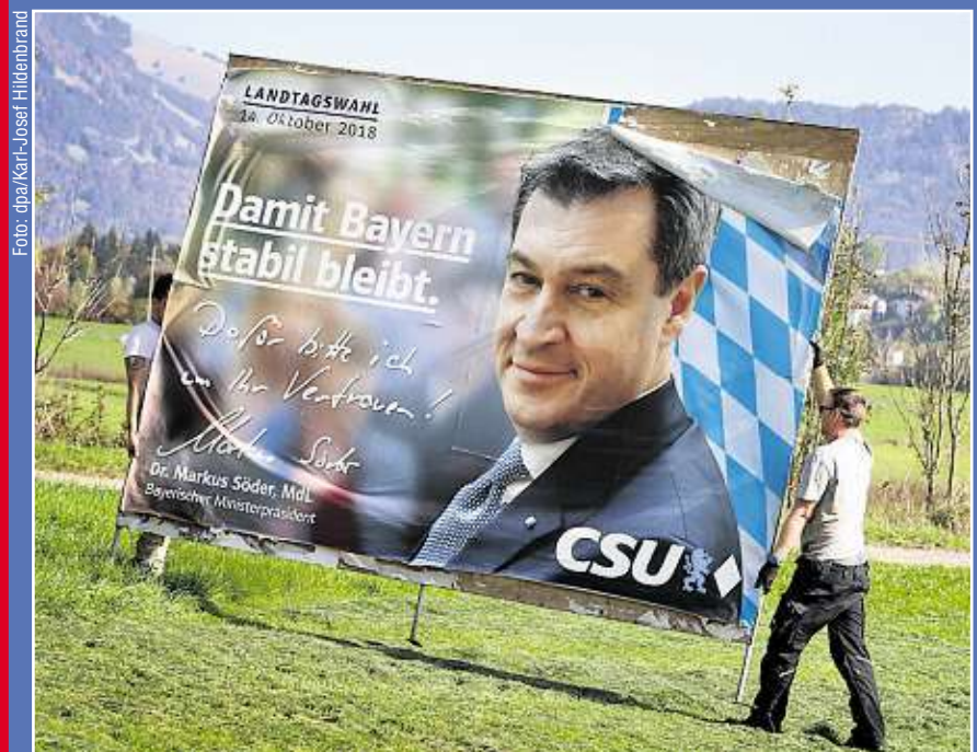
Kehraus bei den Christsozialen: Nach dem Wahl-Flasko mit einem Minus von gut zehn Prozentpunkten werden die CSU-Plakate abgebaut.