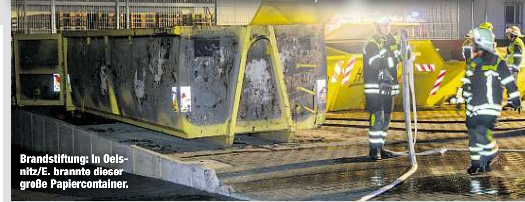
Brandstiftung: In Oelsnitz/E. brannte dieser große Papiercontainer.

aufmerksame Nachbarn das Feuer rechtzeitig entdeckt hatten. In der Pflockenstraße stand ein Papiercontainer in Flammen. Auch hier war die Feuerwehr schnell vor Ort und konnte größeren Schaden verhindern. bri