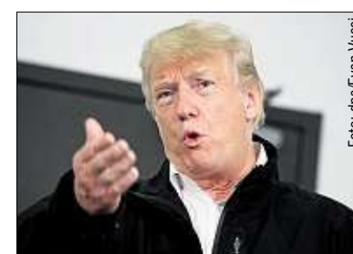
US-Präsident Trump (72) soll eine Affäre mit dem Porno-Star gehabt haben.