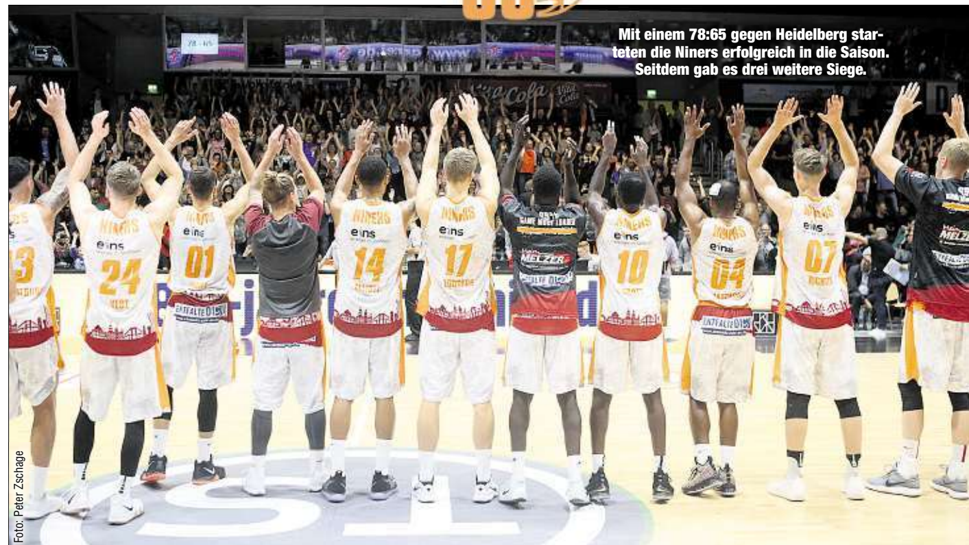
Mit einem 78:65 gegen Heidelberg starteten die Niners erfolgreich in die Saison. Seitdem gab es drei weitere Siege.