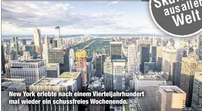
New York erlebte nach einem Vierteljahrhundert mal wieder ein schussfreies Wochenende.

richten bei einer Veranstaltung für Absolventen der Polizeischule am Montag. „Ist das nicht großartig?“ Doch die Freude währte nur kurz: Bereits am Montagmittag wurde ein Mann in der Bronx von einer Kugel getroffen, wie die New York Post berichtet.