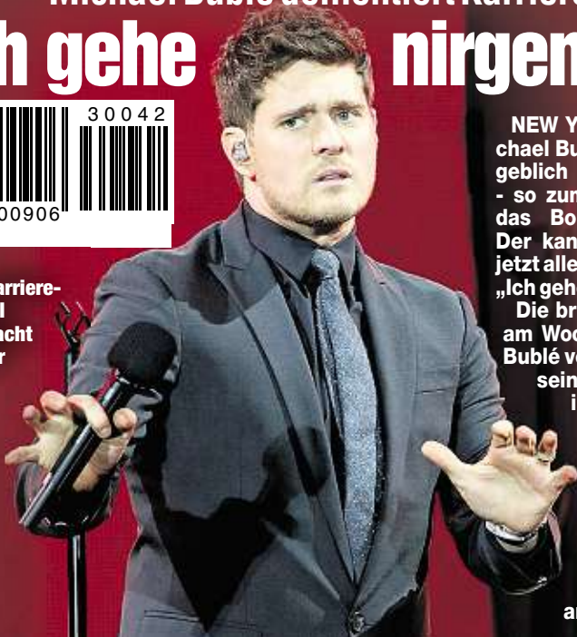
Von wegen Karriere-Ende! Michael Bublé (43) macht weiter mit der Musik.

NEW YORK - Swing-Superstar Michael Bublé (43, „Home“) macht angeblich Schluss mit seiner Musik - so zumindest berichtete kürzlich das Boulevardblatt „Daily Mail“. Der kanadische Jazz-Sänger stellt jetzt allerdings klar, das sei Quatsch: „Ich gehe nirgendwohin.“