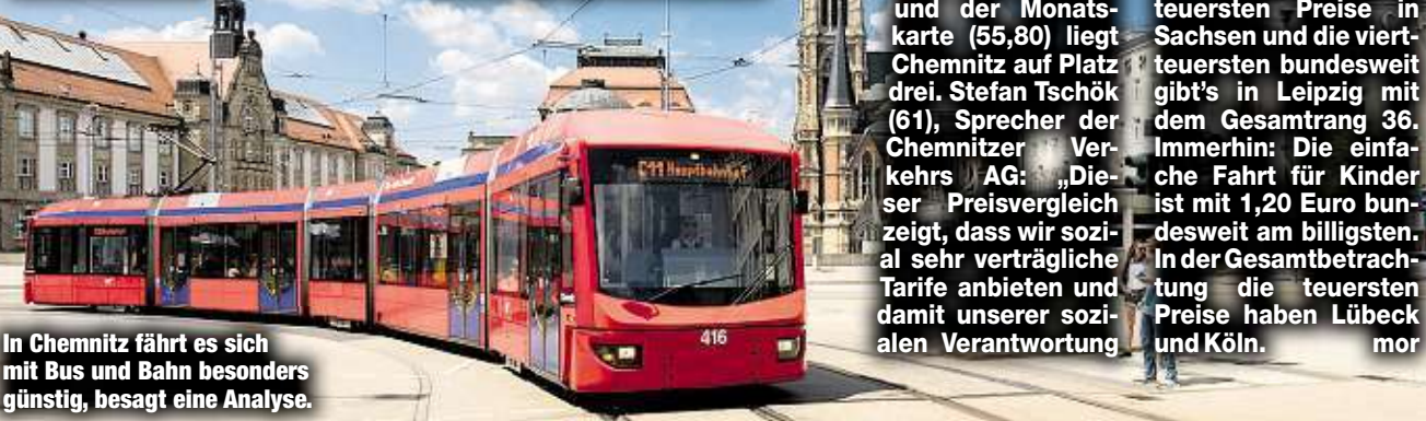
In Chemnitz fährt es sich mit Bus und Bahn besonders günstig, besagt eine Analyse.

bei der Preisgestaltung nachkommen.“ Dresden befindet sich insgesamt auf Platz 21, bei der einfachen Fahrt (2,40 Euro) aber immerhin auf Platz sieben. Die teuersten Preise in Sachsen und die vierteuertesten bundesweit gibt's in Leipzig mit dem Gesamttranz 36. Immerhin: Die einfache Fahrt für Kinder ist mit 1,20 Euro bundesweit am billigsten. In der Gesamtbetrachtung die teuersten Preise haben Lübeck und Köln.