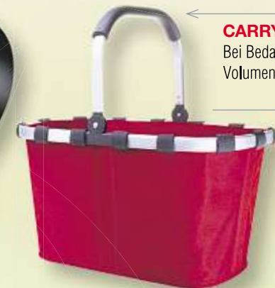
CARRYBAG von REISENTHEL Bei Bedarf flach zusammenzulegen, Volumen: ca. 22 l, max. 30 kg Art.-Nr. 56000