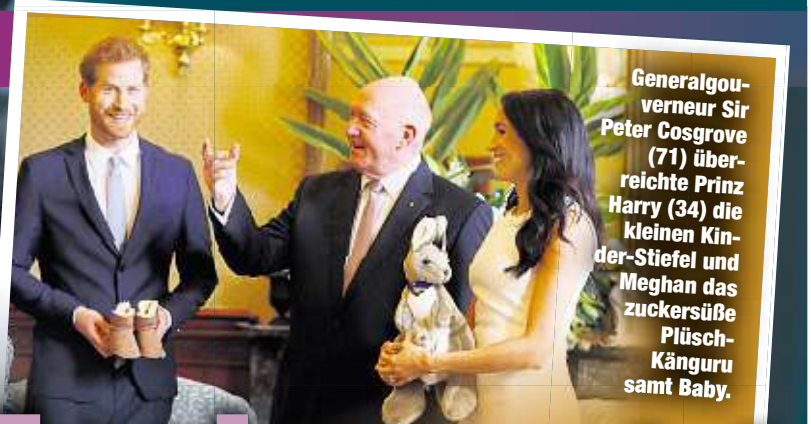
Generalgouverneur Sir Peter Cosgrove (71) überreichte Prinz Harry (34) die kleinen Kinder-Stiefel und Meghan das zuckersüße Plüsch-Känguru samt Baby.