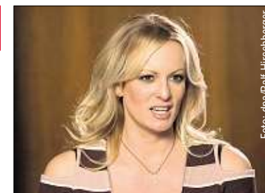
Daniels (39) musste eine Niederlage vor Gericht einstecken.

Das Gericht sah darin hingegen eine „rhetorische Überspitzen“, die durch die in der Verfassung verankerte Meinungs-freiheit gedeckt sei - und verpflichtete Clifford dazu, Trumps Anwaltskosten zu übernehmen. Cliffords Rechtsbeistand will Berufung einlegen.