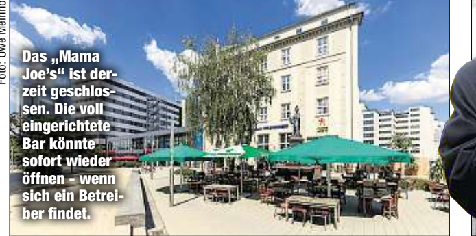
Das „Mama Joe's“ ist derzeit geschlossen. Die voll eingerichtete Bar könnte sofort wieder öffnen - wenn sich ein Betreiber findet.