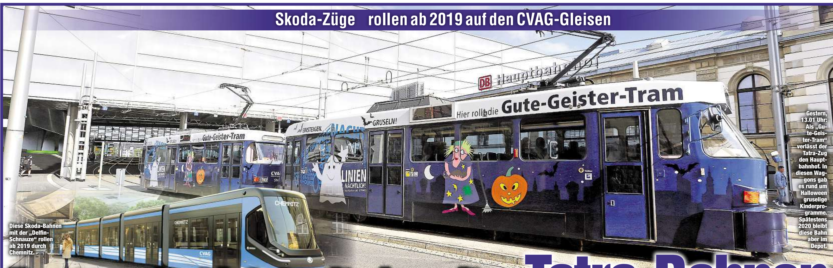
Diese Skoda-Bahnen mit der „Delfin-Schnauze“ rollen ab 2019 durch Chemnitz.