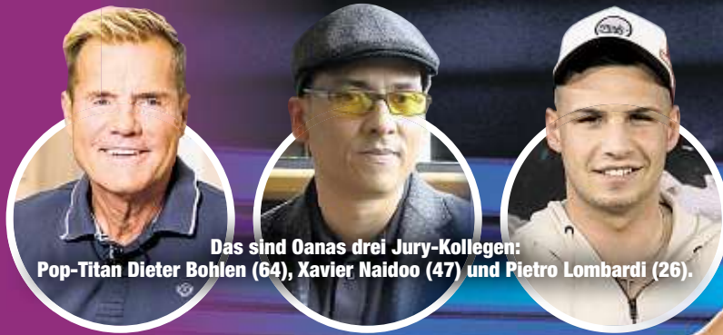
Das sind Oanas drei Jury-Kollegen: Pop-Titan Dieter Bohlen (64), Xavier Naidoo (47) und Pietro Lombardi (26).

Vom Parkett hinter DSDS-Jury-Pult: Oana Nechiti (30) tanzte seit sechs Staffeln bei „Let's Dance“.