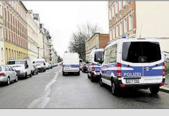
◀ Razzia wegen falscher Papiere: Polizisten haben das Haus an der Jakobstraße abgeriegelt. Die Beamten trugen zur Eigensicherung Schutzanzüge. Es kam aber nicht zu Zwischenschüssen. ▶

Auch eine Beweissicherungseinheit (32) klärte später auf: „Das war eine Durchsuchung, wir ermitteln wegen Urkundenfälschung.“ Die Beamten waren zeitgleich im Stadtgebiet auch in einem weiteren Haus zugange. Die Ermittlungen laufen weiter. rl