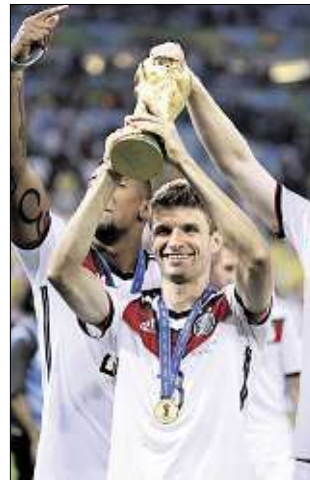
Sein größter Moment: Bei der WM 2014 durfte er den Pokal in die Höhe stemmen.

Bisher haben 13 deutsche Spieler den Eintritt in den „Klub der Hunderter“ geschafft. „Das ist eine Zahl, auf die viel geschaut wird“, sagte Müller. „Aber jetzt konzentriere ich mich mehr auf das Fußballerische als auf Statistiken.“