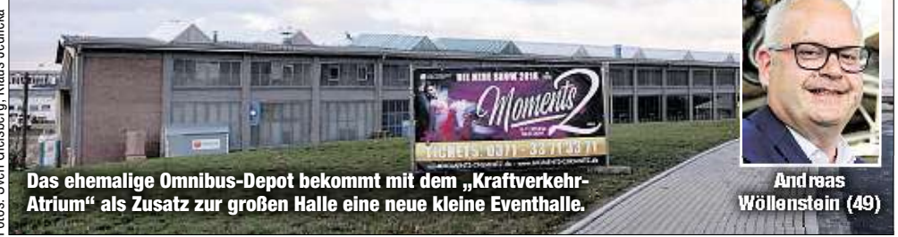
Das ehemalige Omnibus-Depot bekommt mit dem „Kraftverkehr-Atrium“ als Zusatz zur großen Halle eine neue kleine Eventhalle.

stattfinden. Wir wollen noch nicht zu viel verraten.“ Zu den Kosten schweigen die Macher. Unter der Leitung von Andreas Wöllenstein wurde das historische Industrie-Gebäude im vergangenen Jahr für eine siebenstellige Summe umfangreich saniert. Die Ursprünge des Komplexes gehen bis ins 19. Jahrhundert zurück. Nach dem Zweiten Weltkrieg baute der VEB Kraftverkehr seinen Standort dort auf, hier wurden einst die Busse des Karl-Marx-Städter Nahverkehrs gewartet. cane