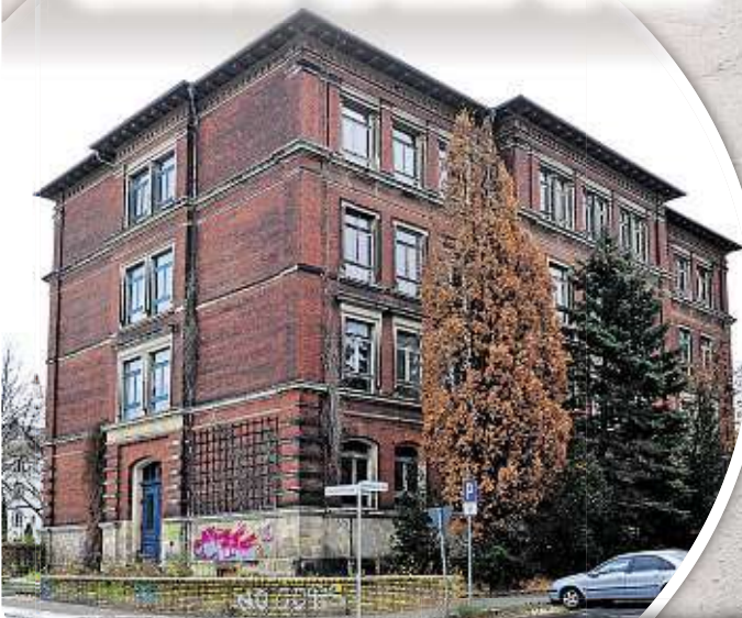
Die Dürer-Grundschule soll 2023 wieder in Betrieb gehen. Der Turnhallen-Neubau sorgt für Ärger.

Auf der Einwohnerversammlung gab die Stadtspitze um OB Barbara Ludwig (56, SPD) erstmals bekannt, dass der Garagenstandort an der Charlottenstraße wackelt.