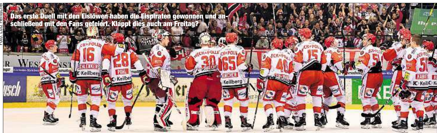
Das erste Duell mit den Eislöwen haben die Eispiraten gewonnen und anschließend mit den Fans gefeiert. Klappt dies auch am Freitag?