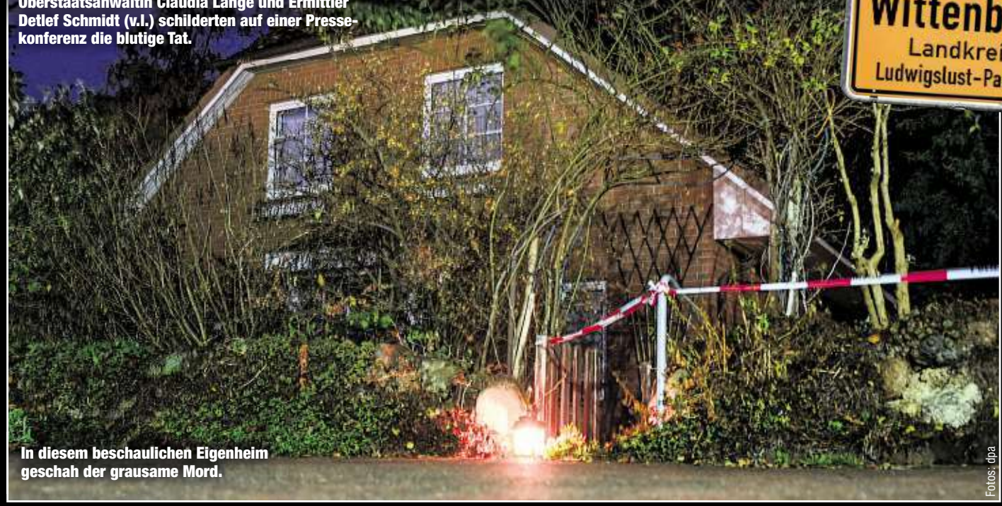
In diesem beschaulichen Eigenheim geschah der grausame Mord.