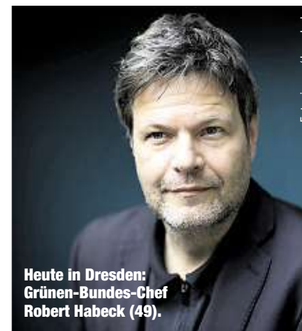
Heute in Dresden: Grünen-Bundes-Chef Robert Habeck (49).