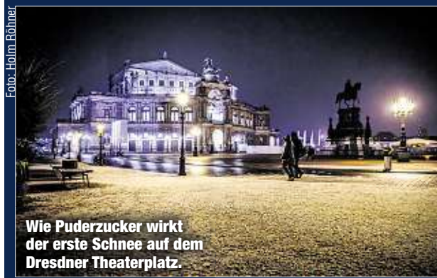
Wie Puderzucker wirkt der erste Schnee auf dem Dresdner Theaterplatz.

meter. Anderswo lag der Schnitt bei einem Zentimeter. Selbst im Dresdner Talkessel lag morgens stellenweise die weiße Pracht. Besonders eisig gab sich der Fichtelberg. Böen drückten die Temperatur gefühlt bei minus zehn Grad. Am Montagmittag wurden dort knapp minus fünf Grad gemessen. Und es wird heftiger: Der Deutsche Wetterdienst warnt vor Orkanböen, die durch den Erzgebirgskreis fegen. In freien Lagen des Berglandes drohen ab heute Mittag Schneeverwehungen. TH