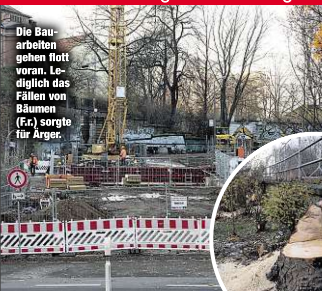
Die Bauarbeiten gehen flott voran. Lediglich das Fällen von Bäumen (Fr.) sorgte für Ärger.