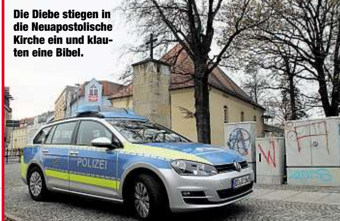
Die Diebe stiegen in die Neupostolische Kirche ein und klawten eine Bibel.