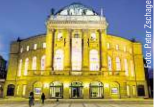
Die Oper Chemnitz sucht morgen Statisten für Mozarts „Die Zauberflöte“.

„sportliche, muskulöse und bewegungsfreudige“ Erwachsene gesucht. Diese sollen unter anderem die Bodyguards für Sarastro mimen. „Weiterhin werden Kinder-Statisten im Alter zwischen neun und zwölf Jahren gesucht - sechs Jungen und sechs Mädchen, mit jeweils drei Ersatzdarstellern.“ Das Casting findet morgen (Buß- und Betttag) um 18 Uhr im ersten Rangfoyer des Opernhauses statt. Treffpunkt ist um 17.30 Uhr am Personaleingang