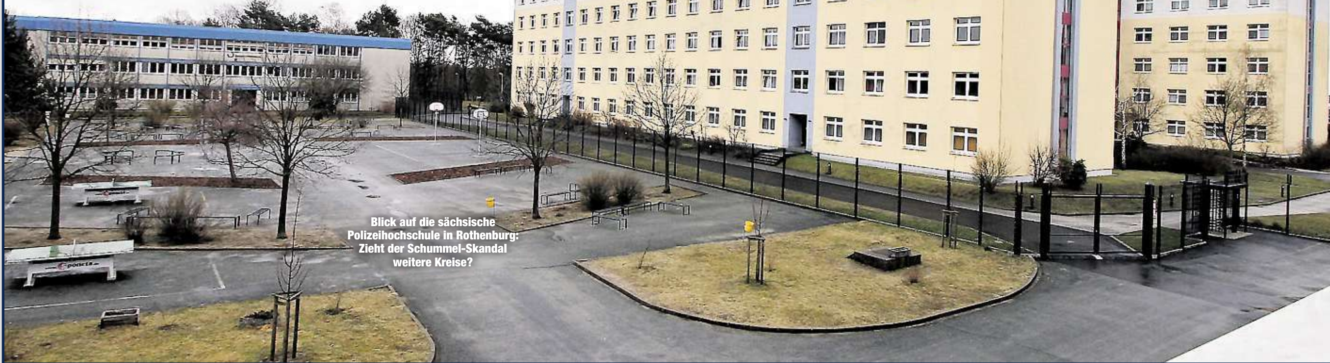
Blick auf die sächsische Polizei-Hochschule in Rothenburg: Zieht der Schummel-Skandal weitere Kreise?