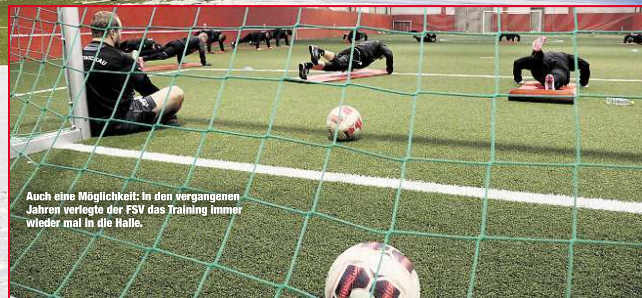
Auch eine Möglichkeit: In den vergangenen Jahren verlegte der FSV das Training immer wieder mal in die Halle.

Auslandsaufenthalt - der CFC zum Beispiel plant für sein Türkei-Camp mit 25000 bis 30000 Euro - zu leisten, wird das Geld beiseite gelegt. Zuletzt wurde in der Wintertransferperiode stets in den Kader investiert. Nicht ohne Grund meint FSV-Coach Joe Enochs zur Trainingslager-Thematik: „Das Geld können wir sinnvoller nutzen.“ Michael Thiele