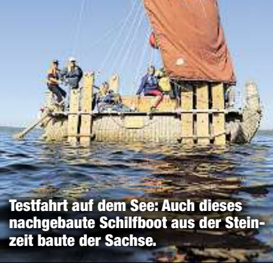
Testfahrt auf dem See: Auch dieses nachgebaute Schiffboot aus der Steinzeit baute der Sachse.

CHEMNITZ - Der Chemnitzer Archäologe und Weltumsegler Dominique Görnitz (52) steht vor unvorhergesehenen Problemen. Eigentlich wollte er vom russischen Sotschi aus über das Schwarze Meer ins Mittelmeer segeln - mit einem Schiffboot. Doch jetzt sind bürokratische Hürden aufgetaucht. Drei Expeditionen verliefen bisher problemlos. Jetzt wartet er aber auf die Schiffsteile, die aus Bolivien angeliefert werden. Und: Russland muss ihm erst mal eine