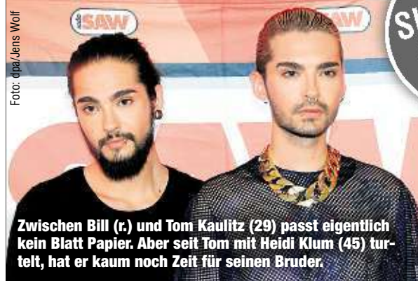
Zwischen Bill (r.) und Tom Kaulitz (29) passt eigentlich kein Blatt Papier. Aber seit Tom mit Heidi Klum (45) tutelt, hat er kaum noch Zeit für seinen Bruder.