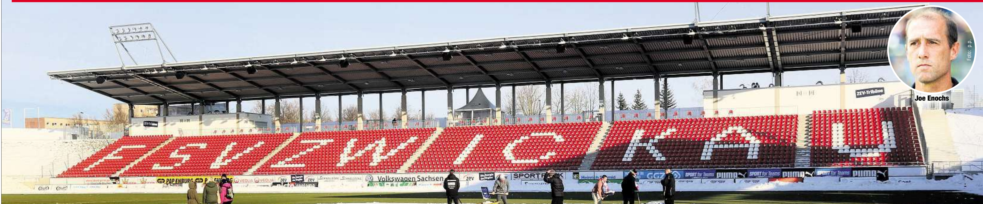
Das Zwickauer Stadion im Schnee. Solche Bedingungen könnten im Januar auf die FSV-Profis warten.