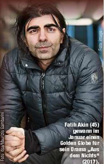
Fatih Akin (45) gewann im Januar einen Goldenen Globe für sein Drama „Aus dem Nichts“ (2017).