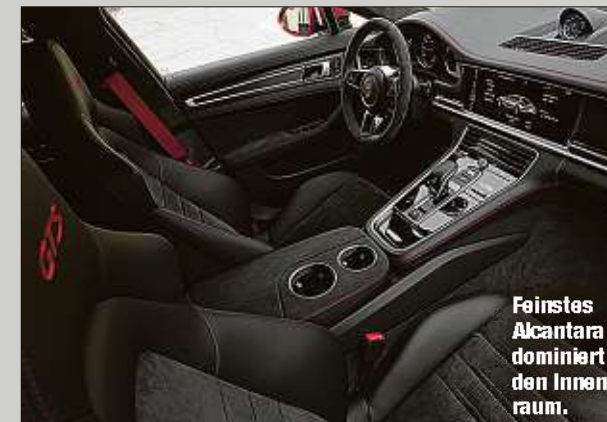
Feinstes Alcantara dominiert den Innenraum.

Mit acht Zylindern und einer bewusst sportlichen Ausprägung mit diversen optischen Differenzierungen setzt sich der GTS von seinen Brüdern ab. Leistungsmäßig fährt der GTS mit 460 PS leicht über dem 4S. Beim Drehmoment sind es 70 Newtonmeter mehr (620 Nm). Zu merken ist die höhere Leistung nicht, zumal der GTS von null auf 100 km/h nur 0,1 Sekunden (4,1 Sekunden) schneller beschleunigt und in der Spitze statt 289 km/h jetzt 292 km/h schafft.