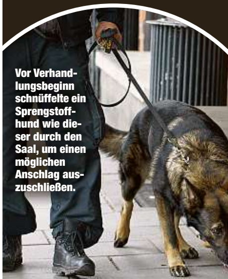
Vor Verhandlungsbeginn schnüffelte ein Sprengstoffhund wie dieser durch den Saal, um einen möglichen Anschlag auszuschließen.