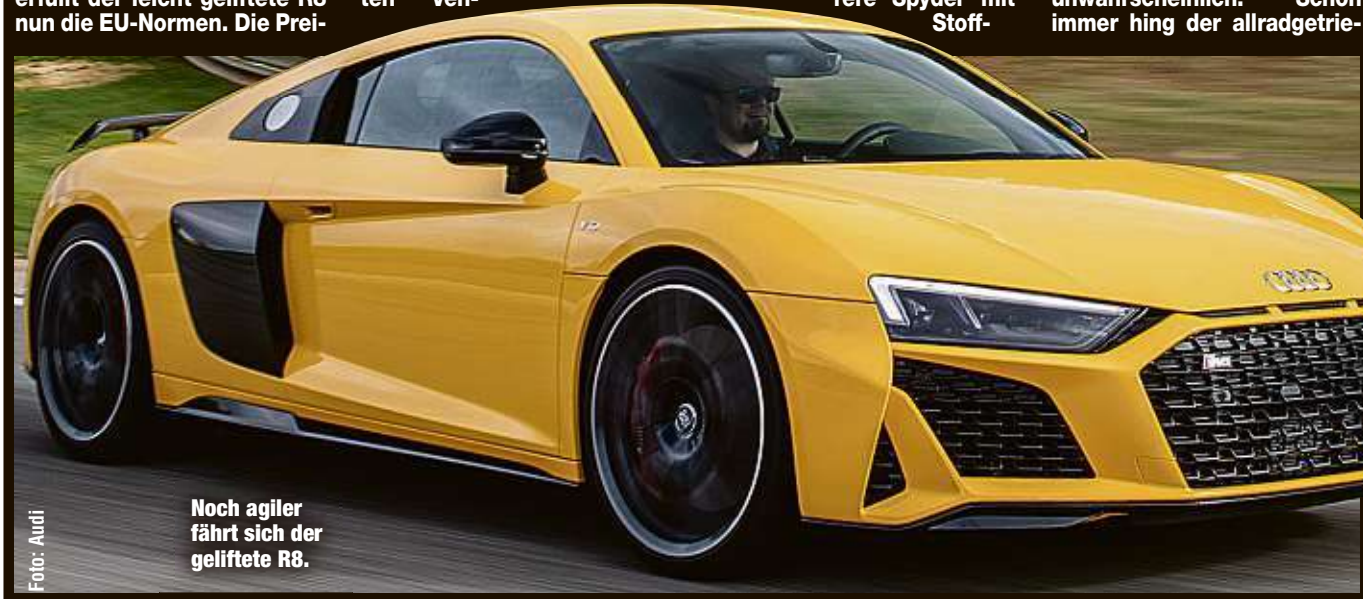
Noch agiler fährt sich der geliftete R8.

Am Asphalt hat der allradgetriebene R8 schon immer geklebt wie Kaugummi, jetzt wurde der Unterbau mit dem optional geregelten Dämpfersystem noch einmal präziser abgestimmt und gibt dem Fahrer mehr Rückmeldung über die Straße. Ein breiterer Kühlergrill und ein markanter Frontsplitter sowie die ovalen, oberarmdicken Endrohre kennzeichnen die Neuerungen. Innen dagegen ist alles beim Alten. Das heißt leider auch, dass für Fahrer über 1,90 Meter Körpergröße der R8 also weiterhin nicht erste Wahl sein wird.