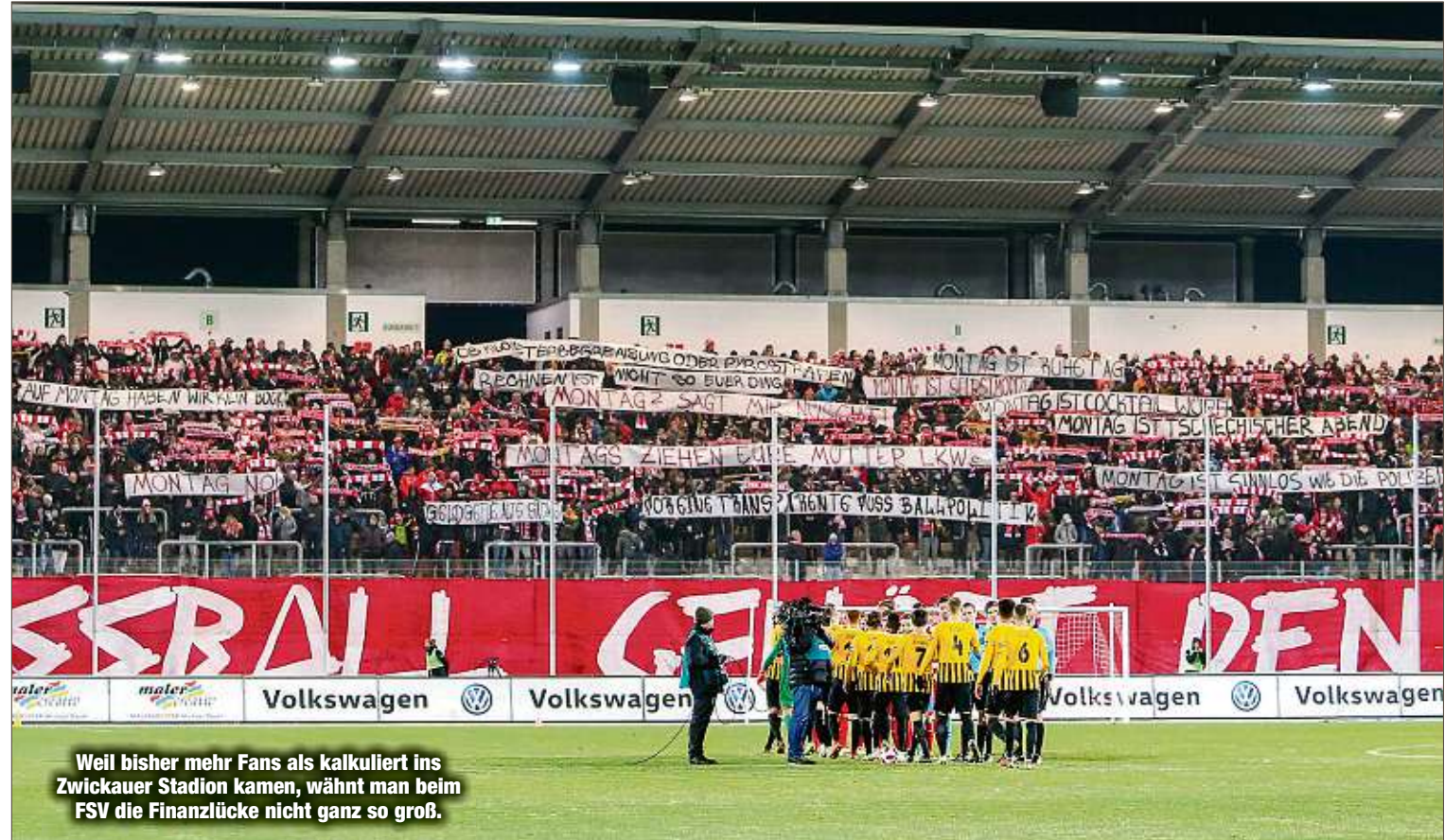
Weil bisher mehr Fans als kalkuliert ins Zwickauer Stadion kamen, wägt man beim FSV die Finanzlücke nicht ganz so groß.