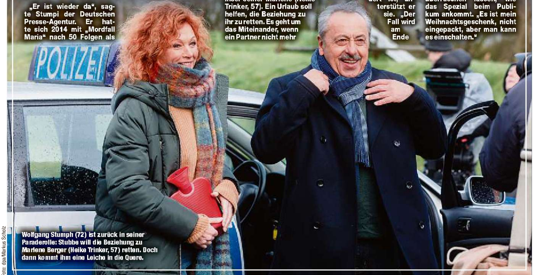
Wolfgang Stumph (72) ist zurück in seiner Paraderolle: Stubbe will die Beziehung zu Marlene Berger (Heike Trinker, 57) retten. Doch dann kommt ihm eine Leiche in die Quers.

geklärt“, weiß Stumph. Ob das auch für Stubbes Privatleben gilt, verrät er aber nicht. Ebenso wenig zur Zukunft seiner TV-Figur. „Ich lasse mir ein Türchen offen.“ Er will sich überraschen lassen, wie das Spezial beim Publikum ankommt. „Es ist mein Weihnachtsgeschenk, nicht eingepackt, aber man kann es einschalten.“