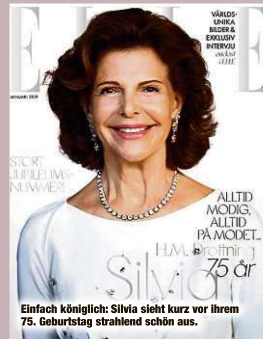
Einfach königlich: Silvia sieht kurz vor ihrem 75. Geburtstag strahlend schön aus.