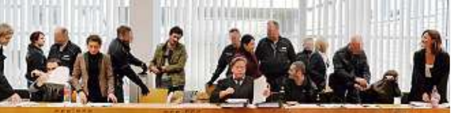
Volle Hütte im Amtsgericht: Im Saal 0.06 mussten gestern vier Angeklagte, vier Verteidiger sowie zwei Dolmetscherinnen und die Wachtmeister eng zusammenrutschen.