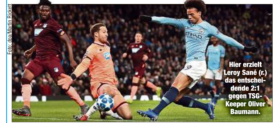
Hier erzielt Leroy Sané (r.) gegen TSG-Keeper Oliver Baumann.

„Er spielt leider nicht bei mir. Es war ein sehr starker Auftritt. Er ist unglaublich bei den Situationen Mann gegen Mann.“ Mit einem Lächeln im Gesicht verabschiedet sich Nagelsmann vom Europacup. „Losgelöst vom Punktekonto haben wir als Neuling außergewöhnliche Spiele abgeliefert“, sagte der 31-Jährige, der als Ziel für den Rest der Bundesliga-Saison den erneuten Einzug in die Königsklasse ausgerufen hat. „Es waren tolle Momente dabei für diesen Klub. Und ich hoffe, dass noch viele dazukommen.“