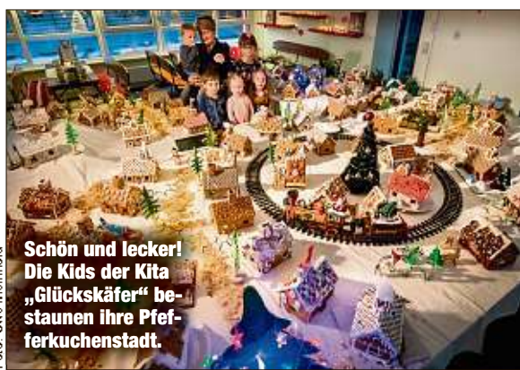
Schön und lecker! Die Kids der Kita „Glückskäfer“ bestaunen ihre Pfefferkuchenstadt.

Knusper, knusper, knäuschen, wer knuspert an meinem Häuschen? Für die Kids der Kindertagesstätte „Glückskäfer“ wurde ein Traum wahr: Sie durften gestern die größte und vielleicht auch einzige Pfefferkuchenstadt in Chemnitz bestaunen. Die Kita-Mitarbeiter planten die Errichtung des zuckersüßen Winterwunderlandes lange im Voraus: So schenkten sie 130 Familien Pfefferkuchenhäuschen, mit der Bitte, diese aufzubauen. Das Ergebnis: 72 Kita-Eltern machten mit und schufen für ihre Kinder eine Süßigkeitenarchitektur vom Feinsten. Einige der knusprigen Häuschen sind sogar beleuchtet. ISM