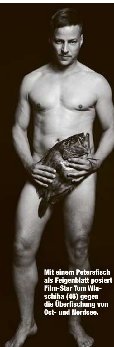
Mit einem Petersfisch als Feigenblatt posiert Film-Star Tom Wlaschiha (45) gegen die Überfischung von Ost- und Nordsee.

Schutz der Fischbestände. „Vor allem Deutschland positioniert sich gerne als fortschrittlich und nachhaltig, gehört aber zu den EU-Staaten, die die Ostsee am stärksten überfischen“, so Wlaschiha. „Die Fischereiminister müssen aufhören, die kurzfristigen Profite der lokalen Wirtschaft in den Vordergrund zu stellen zum Nachteil aller anderen Interessen, und sich stattdessen darauf konzentrieren, unsere Meere für die Zukunft gesund zu erhalten. Die EU-Minister haben ein Gesetz unterschrieben, das die Überfischung beenden soll, und nun ist es an der Zeit, dies umzusetzen“, drängt der Dresdner. KK