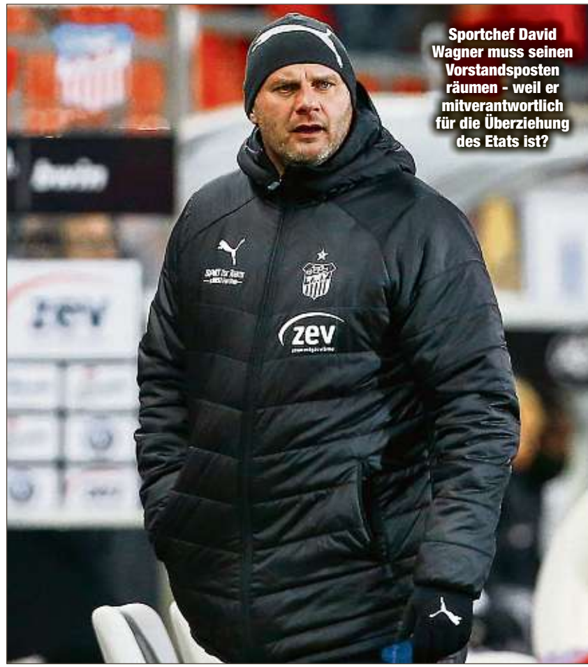
Sportchef David Wagner muss seinen Vorstandsposten räumen - weil er mitverantwortlich für die Überziehung des Etats ist?