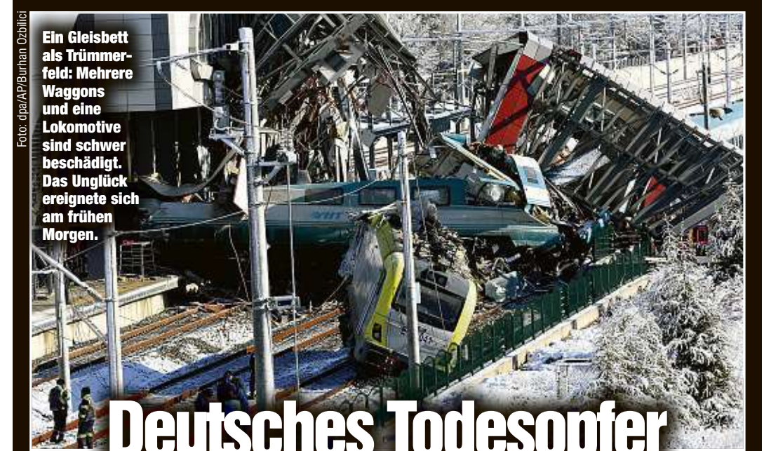
Ein Gleisbett als Trümmerfeld: Mehrere Waggons und eine Lokomotive sind schwer beschädigt. Das Unglück ereignete sich am frühen Morgen.

Das britische Parlament soll bis zum 21. Januar abstimmen. Einen ersten Versuch am 11. Dezember brach May im letzten Moment ab, weil sich eine deutliche Niederlage abzeichnete.