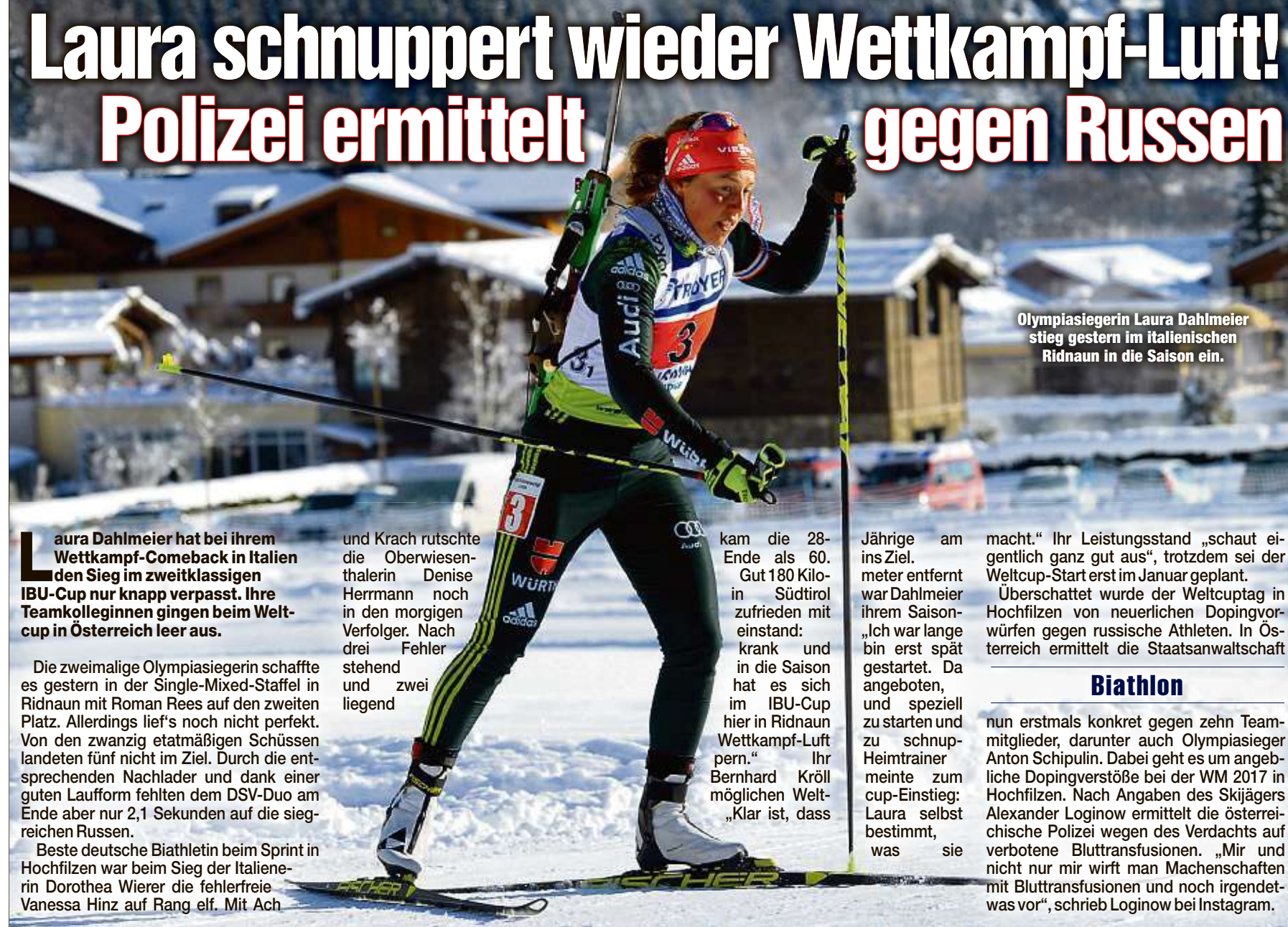
Olympiasiegerin Laura Dahlmeier stieg gestern im italienischen Ridnaun in die Saison ein.

Laura Dahlmeier hat bei ihrem Wettkampf-Comeback in Italien den Sieg im zweitklassigen IBU-Cup nur knapp verpasst. Ihre Teamkolleginnen gingen beim Weltcup in Österreich leer aus.