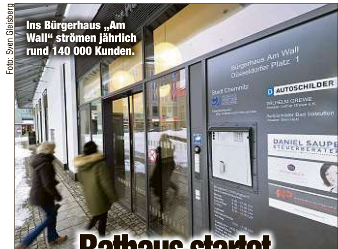
Ins Bürgerhaus „Am Wall“ strömen jährlich rund 140 000 Kunden.

Sortiment nehmen und die dazugehörigen Codes telefonisch durchgeben. Die Angestellte tat dies auch - am Ende war der Supermarkt um Guthabecodes im Wert von mehreren Tausend Euro ärmer. Die Ermittlungen laufen.