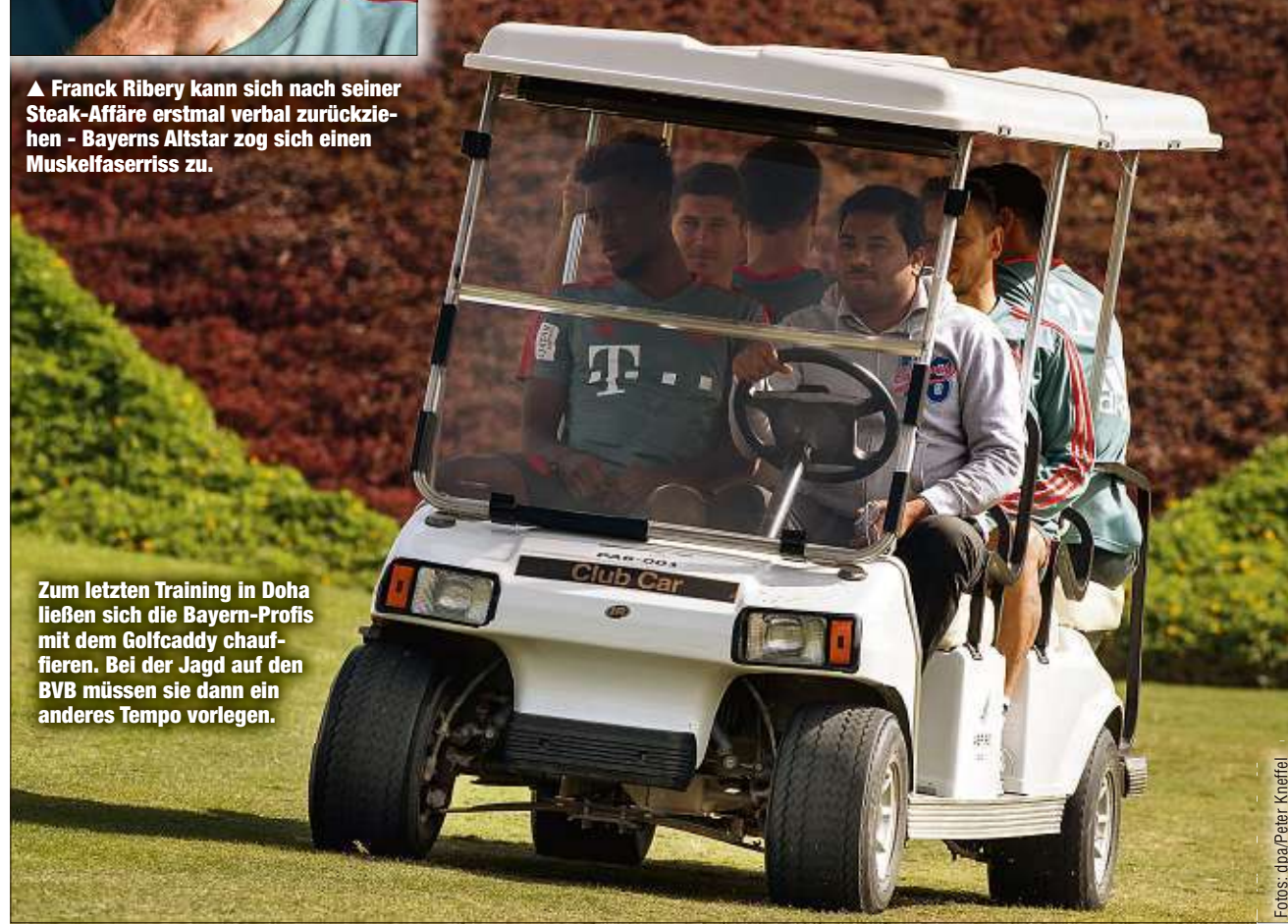
Zum letzten Training in Doha ließen sich die Bayern-Profis mit dem Golfcaddy chauffieren. Bei der Jagd auf den BVB müssen sie dann ein anderes Tempo vorlegen.