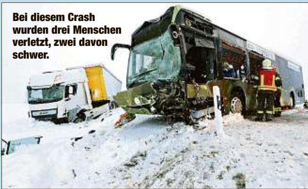
Bei diesem Crash wurden drei Menschen verletzt, zwei davon schwer.