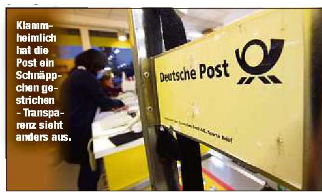
Klammheimlich hat die Post ein Schnäppchen gestrichen - Transparenz sieht anders aus.

BONN/DRESDEN - Da bleibt selbst leidgeprüften Kunden die Spucke weg: Mehr als das Vierfache - anders gesagt: plus 330 Prozent - muss neuerdings zahlen, wer mit der Deutschen Post/DHL Waren bis 500 Gramm ins Ausland schicken möchte. Bislang war dies mit dem sogenannten „Großbrief“ möglich - für erschwingliche 3,70 Euro. Auf der Firmen-Webseite ( www.deutschepost.com ) war dies auch gestern noch so vermerkt. Bloß: Tatsächlich wurde das An-