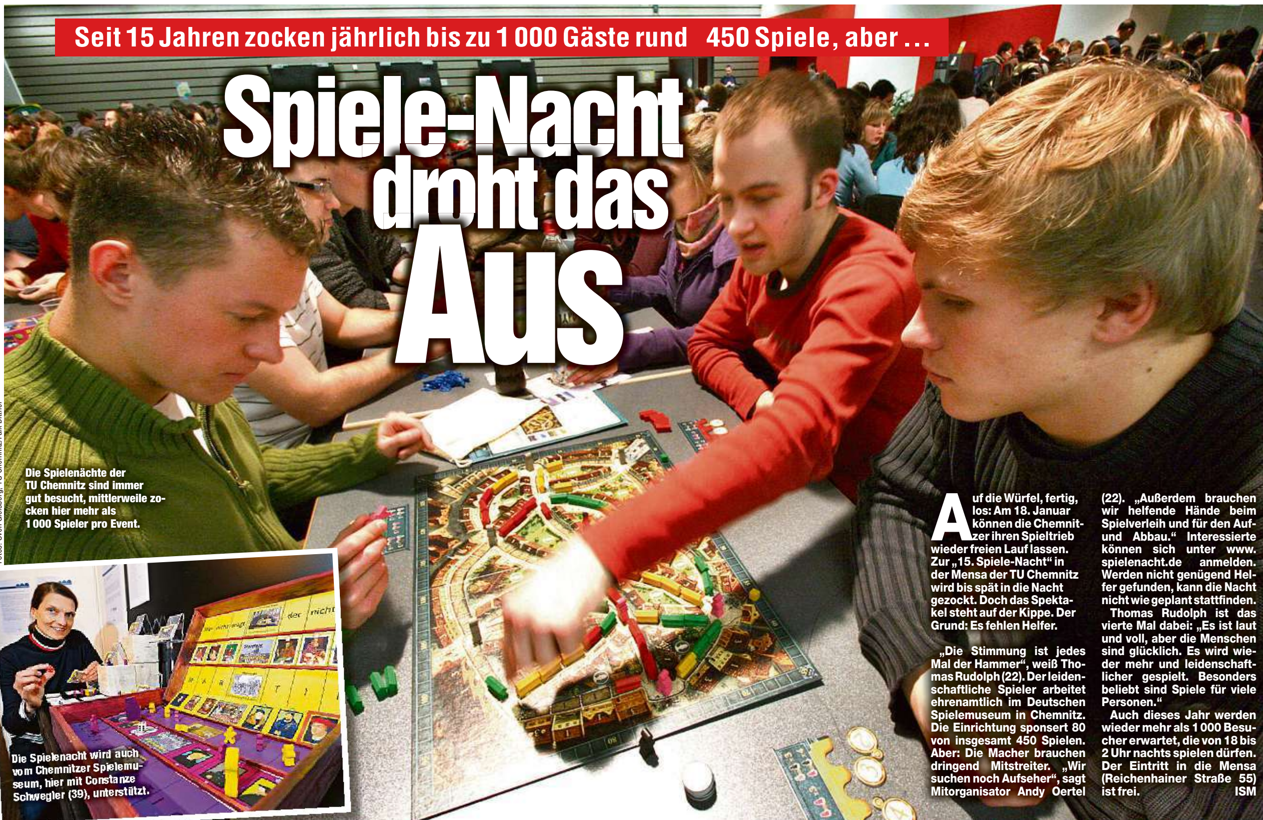
Die Spielenächte der TU Chemnitz sind immer gut besucht, mittlerweile zocken hier mehr als 1 000 Spieler pro Event.