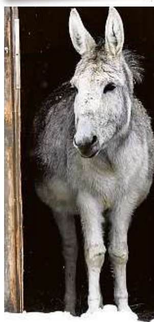
Wegen Schnebruchgefahr mussten Tierpark und Wildgatter gestern geschlossen bleiben.

Die Schneefälle haben Chemnitz ordentlich zugesetzt. Unter dem Wintereinbruch litten besonders Autofahrer und Nahverkehr. Aktuell besteht noch immer die Gefahr von herabfallenden Schneemassen von Bäumen.