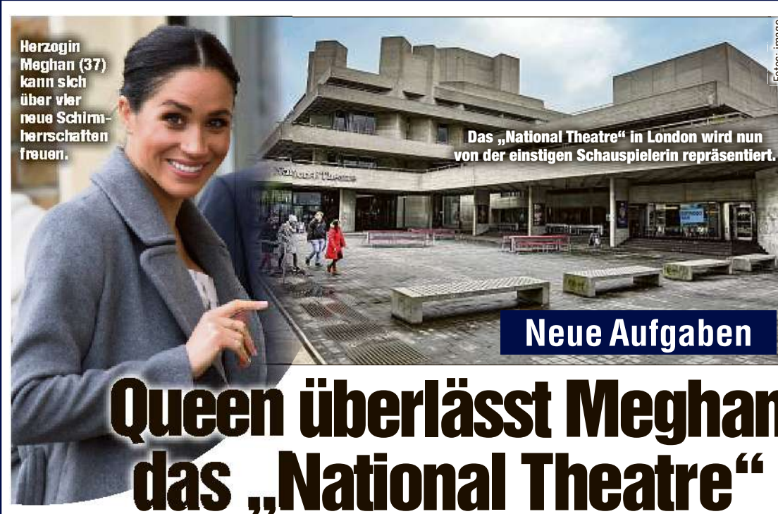
Herzogin Meghan (37) kann sich über vier neue Schirmherrschafter freuen.