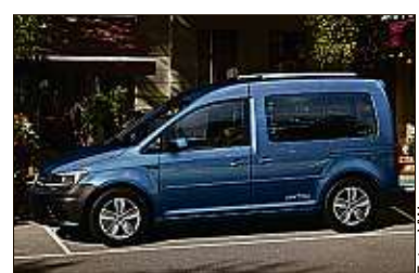
Der Caddy wird aufgewertet.

Mit City-Notbremssystem und aufgewerteter Optik wartet der VW Caddy als Sondermodell „Xtra“ auf. Zu Preisen ab 21 000 Euro verfügt der Hochdachkombi zudem unter anderem über Leichtmetallräder, silberne Dachreling und Klappstische an der Rückenlehne. Für den Antrieb stehen zwei 2,0-Liter-Diesels mit 55 kW/75 PS und 110 kW/150 PS sowie ein Erdgasmotor mit 1,4 Litern Hubraum und 81 kW/110 PS zur Wahl. Der Hersteller nennt einen Preisvorteil von bis zu 2 000 Euro.