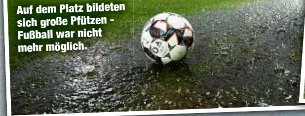
Auf dem Platz bildeten sich große Pfützen - Fußball war nicht mehr möglich.