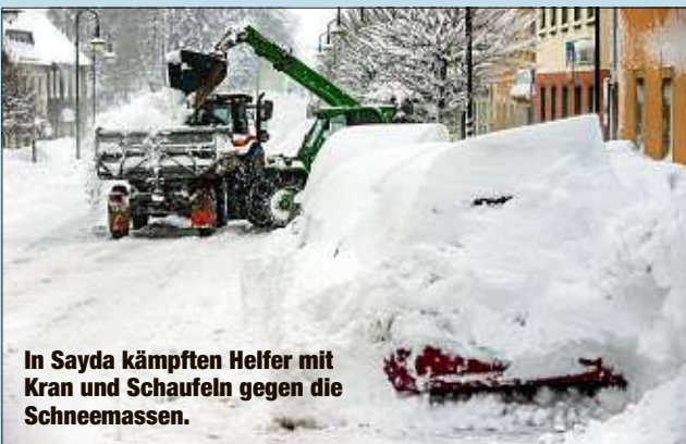
In Sayda kämpften Helfer mit Kran und Schaufeln gegen die Schneemassen.