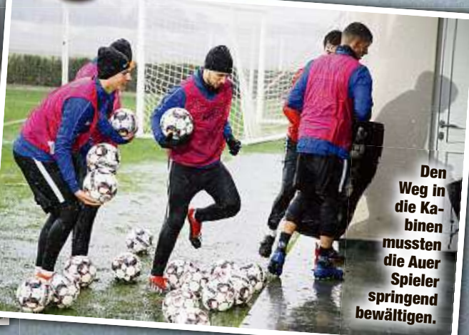
Den Weg in die Kabinen mussten die Auer Spieler springend bewältigen.