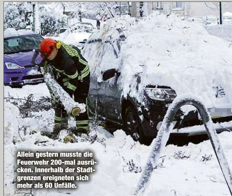
Allein gestern musste die Feuerwehr 200-mal ausrücken. Innerhalb der Stadtgrenzen ereigneten sich mehr als 60 Unfälle.

Mehr zum Thema Schnee-Chaos lesen Sie auf Seite 6. tgr