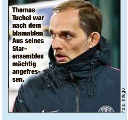
Thomas Tuchel war nach dem blamablen Aus seines Starensembles mächtig angegriffen.

Die erste Titel-Option ist damit für Tuchel dahin. „Wir haben kein Meisterschaftsspiel verloren, aber eine große Chance, eine Trophäe zu gewinnen“, witterte Tuchel und verpasste seinen Superstars einen Seitenhieb: „Wir spielten mit zu viel Selbstvertrauen, wir spielten nicht mit dem Hunger, um dieses Spiel zu Ende zu bringen.“ In der Enttäuschung suchte Tuchel einen Grund für die Pleite beim Schiedsrichter. Drei Elfmeter hatte Guingamp zugesprochen bekommen.