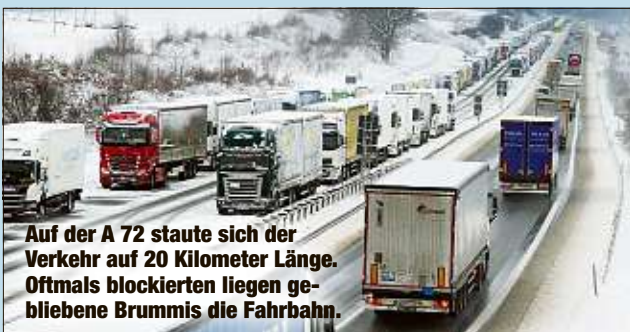
Auf der A72 staute sich der Verkehr auf 20 Kilometer Länge. Oftmals blockierten liegen gebliebene Brummis die Fahrbahn.