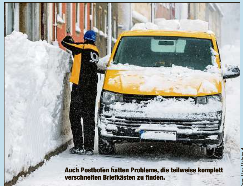
Auch Postboten hatten Probleme, die teilweise komplett verschneiten Briefkästen zu finden.