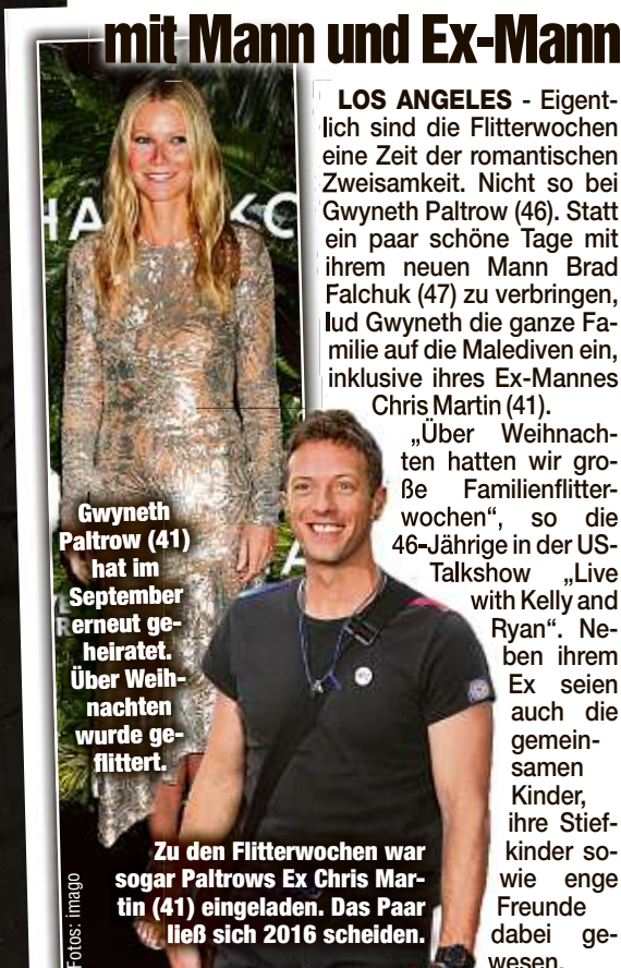
Gwyneth Paltrow (41) hat im September erneut geheiratet. Über Weihnachten wurde geflirtet.