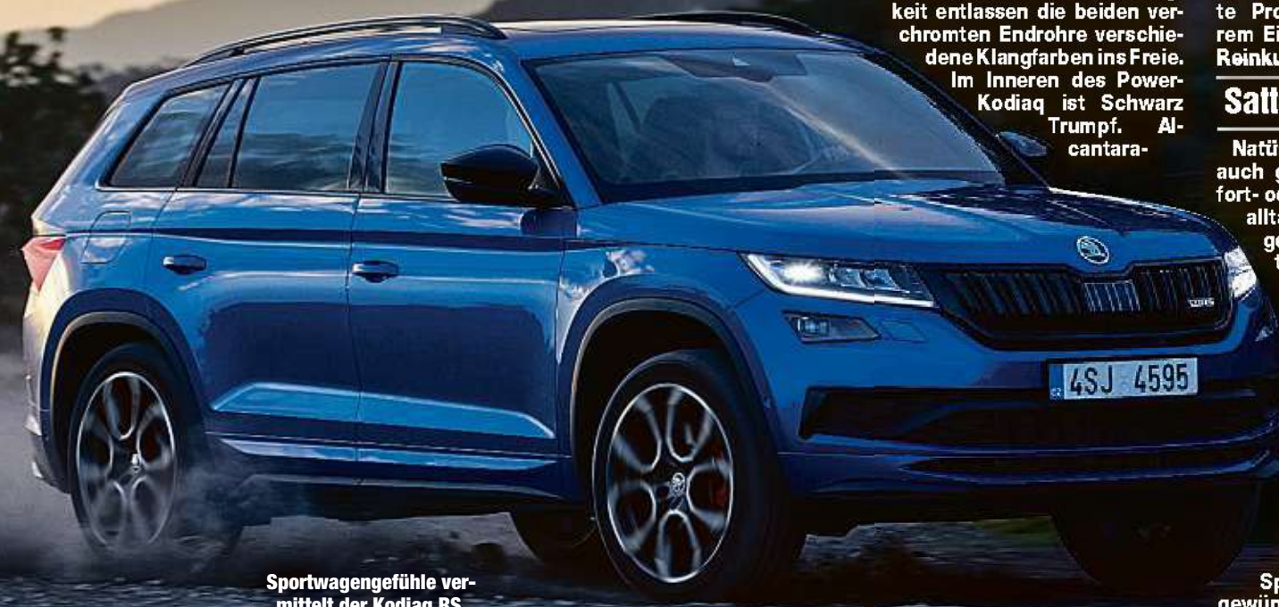
Sportwagengefühle vermittelt der Kodiaq RS.

Škoda krönt die SUV-Baureihe Kodiaq mit einer Sportversion und dem stärksten je in einem Škoda genutzten Diesel. Der Kodiaq RS bietet neben viel Auto, Spaß und Sport auch einen neuen Škoda-Sound.