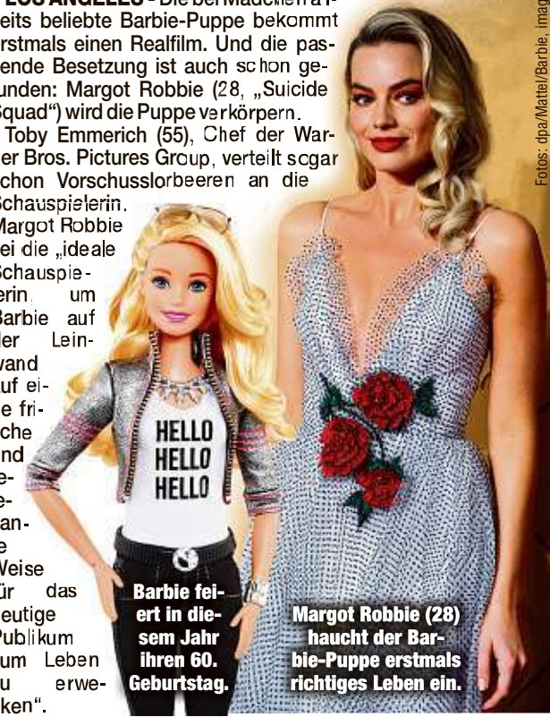
Barbie feiert in diesem Jahr ihren 60. Geburtstag.