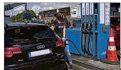
Insgesamt verteuerte sich das Tanken im vergangenen Jahr.

Die Kraftstoffpreise an den deutschen Tankstellen sind 2018 gegenüber dem Vorjahr deutlich gestiegen. Der Liter Super E10 kostete im Schnitt 1,428 Euro und damit 8,1 Cent mehr als 2017. Beim Diesel lag der Preisanstieg bei 12,2 Cent auf 1,283 Euro pro Liter. Teuerster Tag zum Tanken war 2018 der 11. November mit 1,550 für Super E10, besonders günstig war Super E10 am 15. März mit 1,301 Euro, der Dieselpreis erreichte seinen Tiefstand am 21. Februar mit 1,164 Euro.