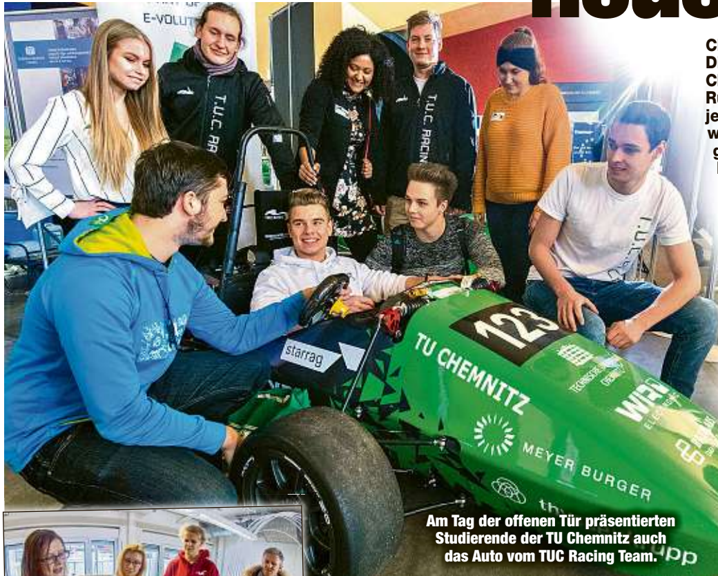
Am Tag der offenen Tür präsentierten Studierende der TU Chemnitz auch das Auto vom TUC Racing Team.