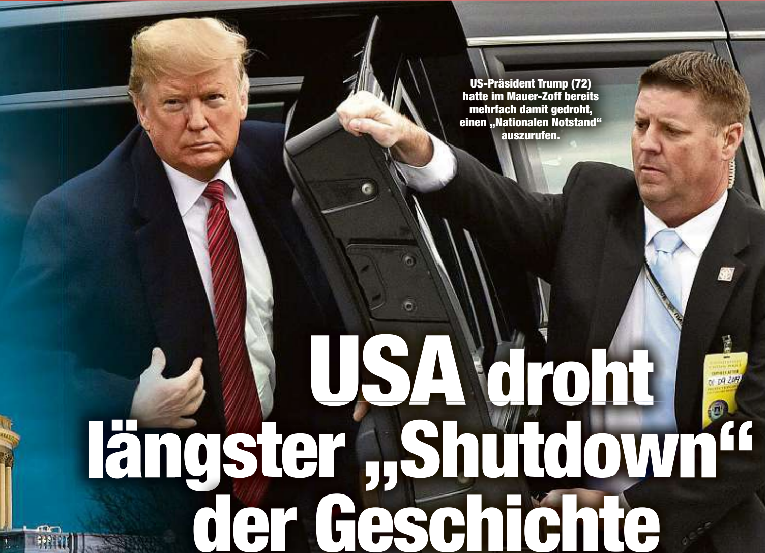
US-Präsident Trump (72) hatte im Mauer-Zoff bereits mehrfach damit gedroht, einen „Nationalen Notstand“ auszurufen.