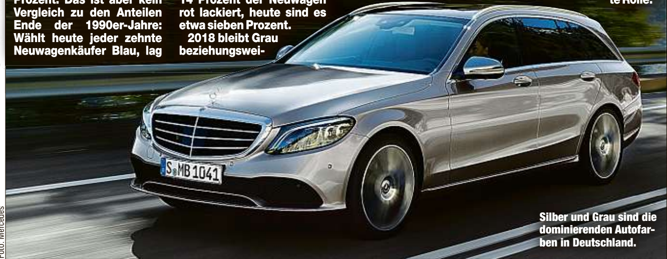
Silber und Grau sind die dominierenden Autofarben in Deutschland.

Wiederverkauf optimalen, neutralen Lackierung bestellt, ein Prozentpunkt mehr als 2017. Nach den Zahlen des VDA hat die Farbe ihren Höhepunkt in der Käufergunst aber offenbar hinter sich: Im Jahr 2004 war fast die Hälfte aller Neuwagen silber oder grau. Auf Platz 2 bleibt Schwarz mit einem leicht gesunkenen Anteil von 24,7 Prozent. Jedes fünfte neue Auto kommt in Weiß zu seinem Käufer, bunte Farben spielen eine sehr untergeordnete Rolle.