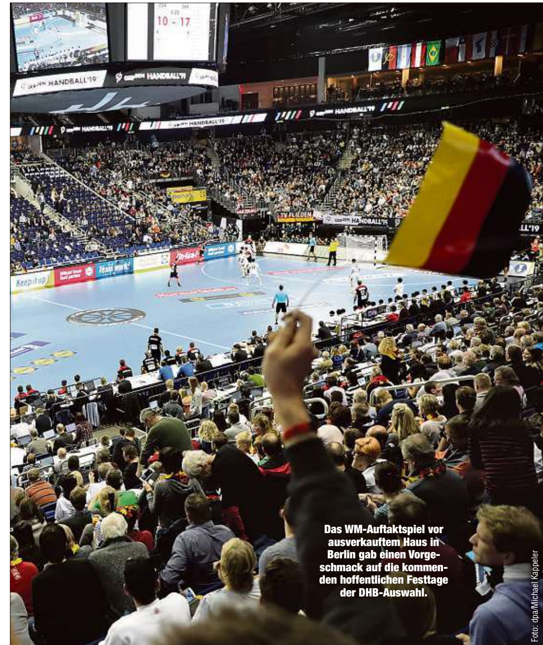
Das WM-Auftaktspiel vor ausverkauftem Haus in Berlin gab einen Vorgeschmack auf die kommenden hoffentlichen Festtage der DHB-Auswahl.