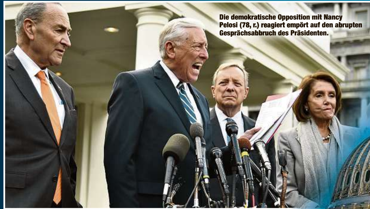
Die demokratische Opposition mit Nancy Pelosi (78, r.) reagiert empört auf den abrupten Gesprächsabbruch des Präsidenten.