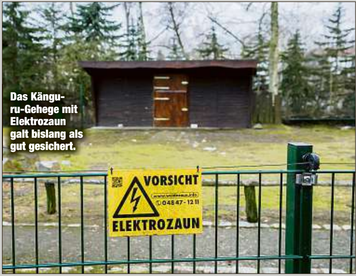
Das Känguru-Gehege mit Elektrozaun galt bislang als gut gesichert.