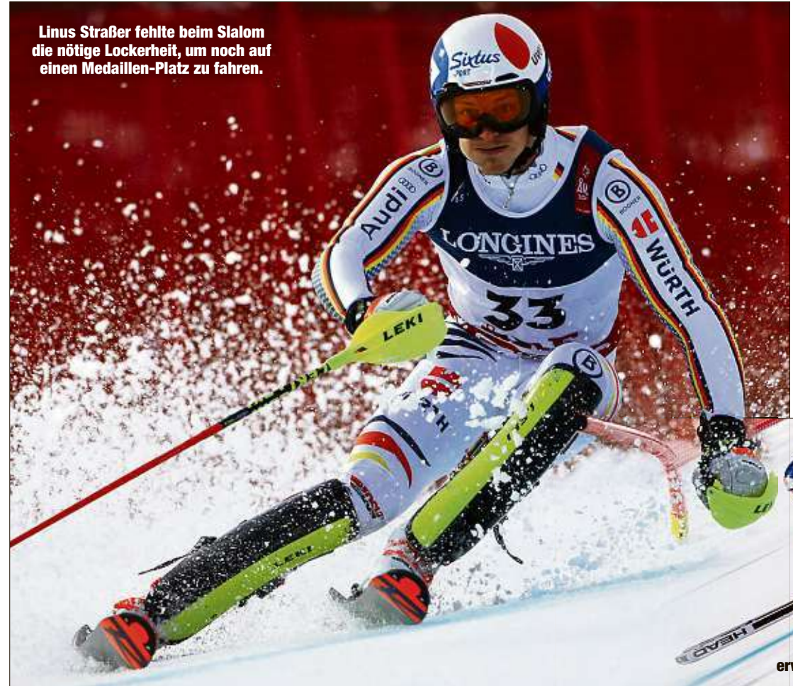
Linus Straßer fehlte beim Slalom die nötige Lockerheit, um noch auf einen Medaillen-Platz zu fahren.

ARE - Linus Straßer durfte zehn Minuten hoffen, dann zerplatzte sein plötzlicher Medaillentraum in der alpinen Kombination jäh. Der 26-Jährige zeigte bei der WM im schwedischen Are eine couragierte Abfahrt und war nah dran an einer großen Überraschung, doch ausgerechnet in seiner Spezialdisziplin Slalom glitt ihm Bronze aus der Hand: Am Ende fehlten 0,34 Sekunden.