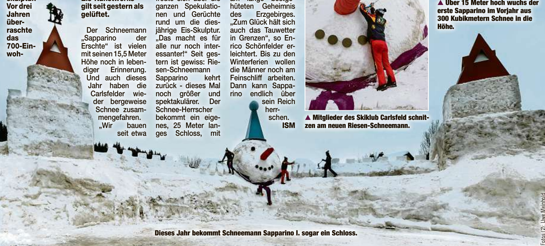
Dieses Jahr bekommt Schneemann Sapparino I. sogar ein Schloss.

zwölf Meter hohen Türmen. Das zehnköpfige Team schnitzte am Wochenende sieben Stunden am Stück am lange bestgüteten Geheimnis des Erzgebirges. „Zum Glück hält sich auch das Tauwetter in Grenzen“, so Enrico Schönfelder erleichtert. Bis zu den Winterferien wollen die Männer noch am Feinschliff arbeiten. Dann kann Sapparino endlich über sein Reich herrschen. ISM