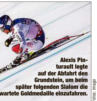
Alexis Pinturault legte auf der Abfahrt den Grundstein, um beim später folgenden Slalom die erwartete Goldmedaille einzufahren.