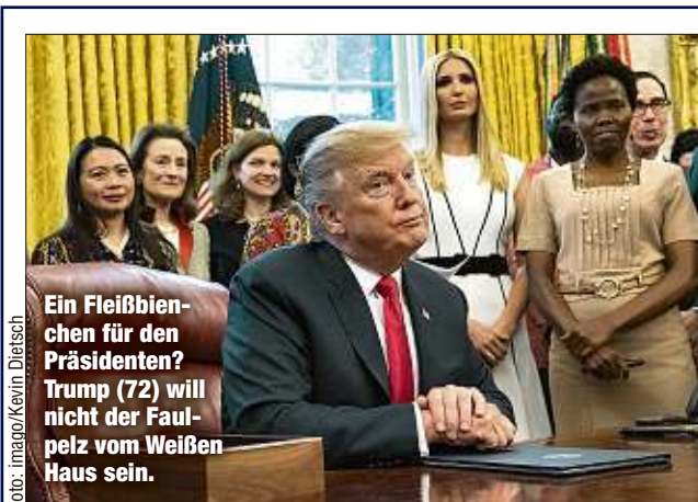
Ein Fleißbienen für den Präsidenten? Trump (72) will nicht der Faulpelz vom Weißen Haus sein.

sagte Klingbeil im ZDF. Für den Erhalt des Sozialstaats müsse man „auch Superreiche zur Verantwortung ziehen.“ Die Vermögenssteuer ist ein Punkt, über den wir als SPD nachdenken.“ Er beobachte, dass „die Kluft in diesem Land zwischen Arm und Reich“ auseinandergehe. Klingbeil wehrt sich gegen den Verdacht, die SPD wolle mit ihrem sozialpolitischen Vorstoß einen Bruch der großen Koalition provozieren.