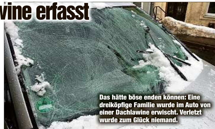
Das hätte böse enden können: Eine dreiköpfige Familie wurde im Auto von einer Dachlawine erwischt. Verletzt wurde zum Glück niemand.

berstraße (B101) in Richtung Annaberg-Buchholz. Als das Auto ein Haus passierte, löste sich eine Dachlawine und begrub das Auto. Die unter Schock stehende Familie wurde von Passanten befreit. Nach MOPO-Informationen betrug die Schneelast rund eine halbe Tonne. Lawensicherungen gab es am betreffenden Hausdach keine.