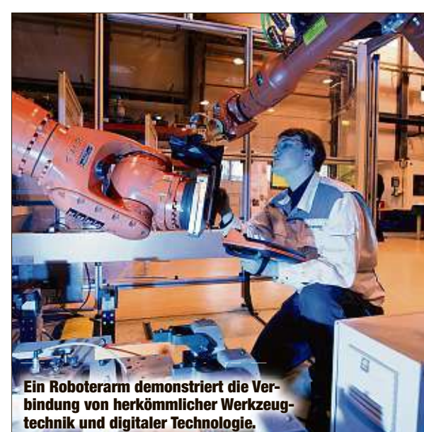
Ein Roboterarm demonstriert die Verbindung von herkömmlicher Werkzeugtechnik und digitaler Technologie.

Parallel gründete die Fraunhofer-Gesellschaft in Dresden das Zentrum für Kognitive Produktionssysteme, das auch in Chemnitz betrieben werden soll. Diese Systeme verknüpfen traditionelle und digital gesteuerte Fertigungsverfahren durch KI wechselseitig. TH