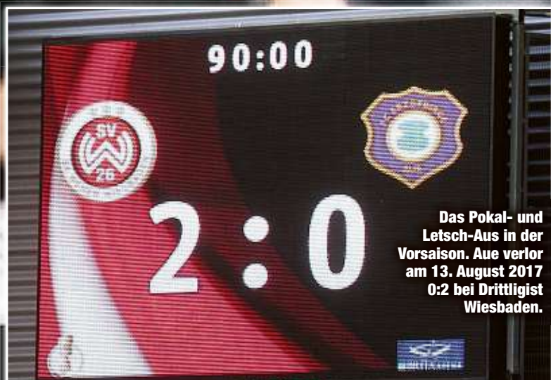
Das Pokal- und Letsch-Aus in der Vorsaison. Aue verlor am 13. August 2017 0:2 bei Drittligist Wiesbaden.