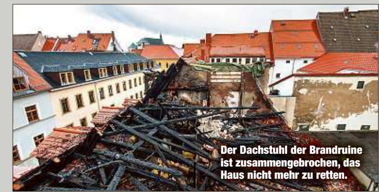
Der Dachstuhl der Brandruine ist zusammengebrochen, das Haus nicht mehr zu retten.

ist wegen der Brandschäden unbewohnbar. Ob es sich bei der geborgenen Leiche um die einzige Bewohnerin (74) des Hauses handelt, wird erst Ende der Woche zweifelsfrei geklärt sein. MS