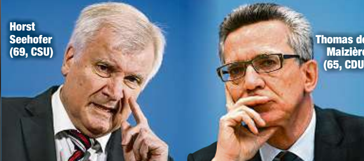
Horst Seehofer (69, CSU)