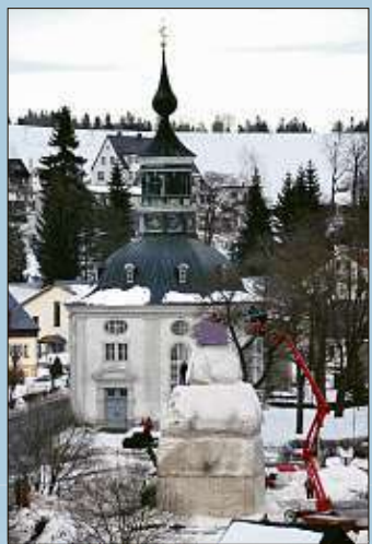
Über 15 Meter hoch wuchs der erste Sapparino im Vorjahr aus 300 Kubikmetern Schnee in die Höhe.