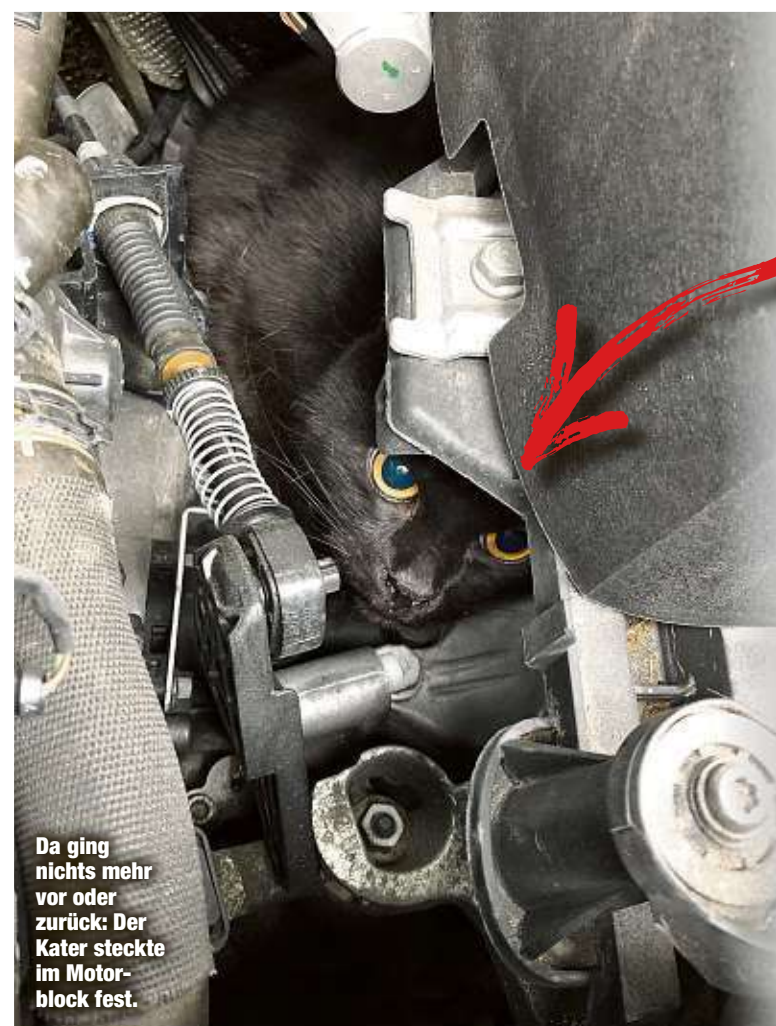
Da ging nichts mehr vor oder zurück: Der Kater steckte im Motorblock fest.

ZWICKAU - Was für ein Katzenjammer! Eileen Kuhn (45) von der Tierrettung Zwickau eilte mittags nach Mosel. Dort steckte ein Kater im Motorblock eines Kleinwagens fest.