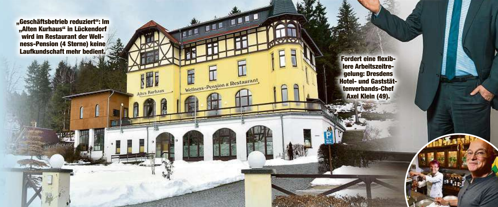
„Geschäftsbetrieb reduziert“: Im „Alten Kurhaus“ in Lückendorf wird im Restaurant der Wellness-Pension (4 Sterne) keine Laufkundschaft mehr bedient.

Das fordert auch der DEHOGA: „Wir wollen, dass Arbeitgeber und -nehmer anstatt starrer Tagesarbeitszeiten eine Wochenarbeitszeit von maximal 48 Stunden frei gestalten können“, so Klein. Das entspräche auch den europäischen Normen. tyx