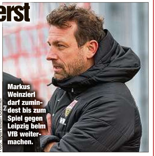
Markus Weinzierl darf zumindest bis zum Spiel gegen Leipzig beim VfB weitermachen.

Trotz aller Spekulationen im Umfeld des abstiegsbedrohten schwäbischen Bundesligisten, trotz der Gerüchte über Markus Gisdol und Jürgen Klinsmann und dem nächsten Tiefpunkt mit dem 0:3 in Düsseldorf darf Weinzierl vorerst weitermachen. Seine Zukunft beim VfB Stuttgart dürfte aber vom Auftritt gegen den Tabellenvierten RB Leipzig am Samstag abhängen - und so klingen Reschkes Worte fast wie ein Ultimatum. „Er wird gegen Leipzig auf der Bank sitzen - ohne Wenn und Aber“, sagte Reschke. „Unser aller Aufgabe ist es, die Mannschaft wieder in die Spur zu bringen. Wir dürfen uns jetzt nicht selbst zerfleischen.“ Nach der „heftigen und bitteren“ Pleite bei Fortuna Düsseldorf hatte Reschke geschwiegen - und die Gerüchte über eine Trennung von Weinzierl angeheizt.