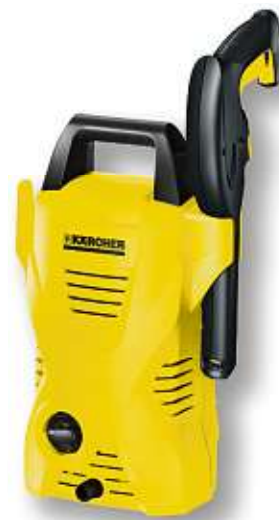
HOCHDRUCKREINIGER von KÄRCHER | K 2 Basic, max. 110 bar/1.400 Watt | Art.-Nr. 10346