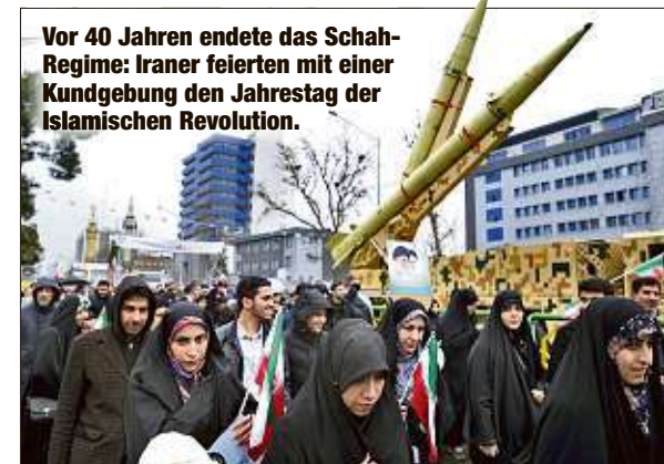
Zum Jubiläum versprach Präsident Ruhani (70) den Ausbau des iranischen Raketenprogramms. Vor 40 Jahren endete das Schah-Regime: Iraner feierten mit einer Kundgebung den Jahrestag der Islamischen Revolution.