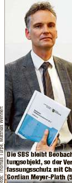
Die SBS bleibt Beobachtungsobjekt, so der Verfassungsschutz mit Chef Gordian Meyer-Plath (50).

DRESDEN - Seit 2017 beobachtet der sächsische Verfassungsschutz die Sächsische Begegnungsstätte (SBS) - sie soll der radikal-islamischen Muslimbruderschaft nahestehen. Nun kündigt die SBS an, alle Aktivitäten einzustellen. Doch stimmt das? „Durch die Schaffung von vermeintlich seriösen Angeboten für