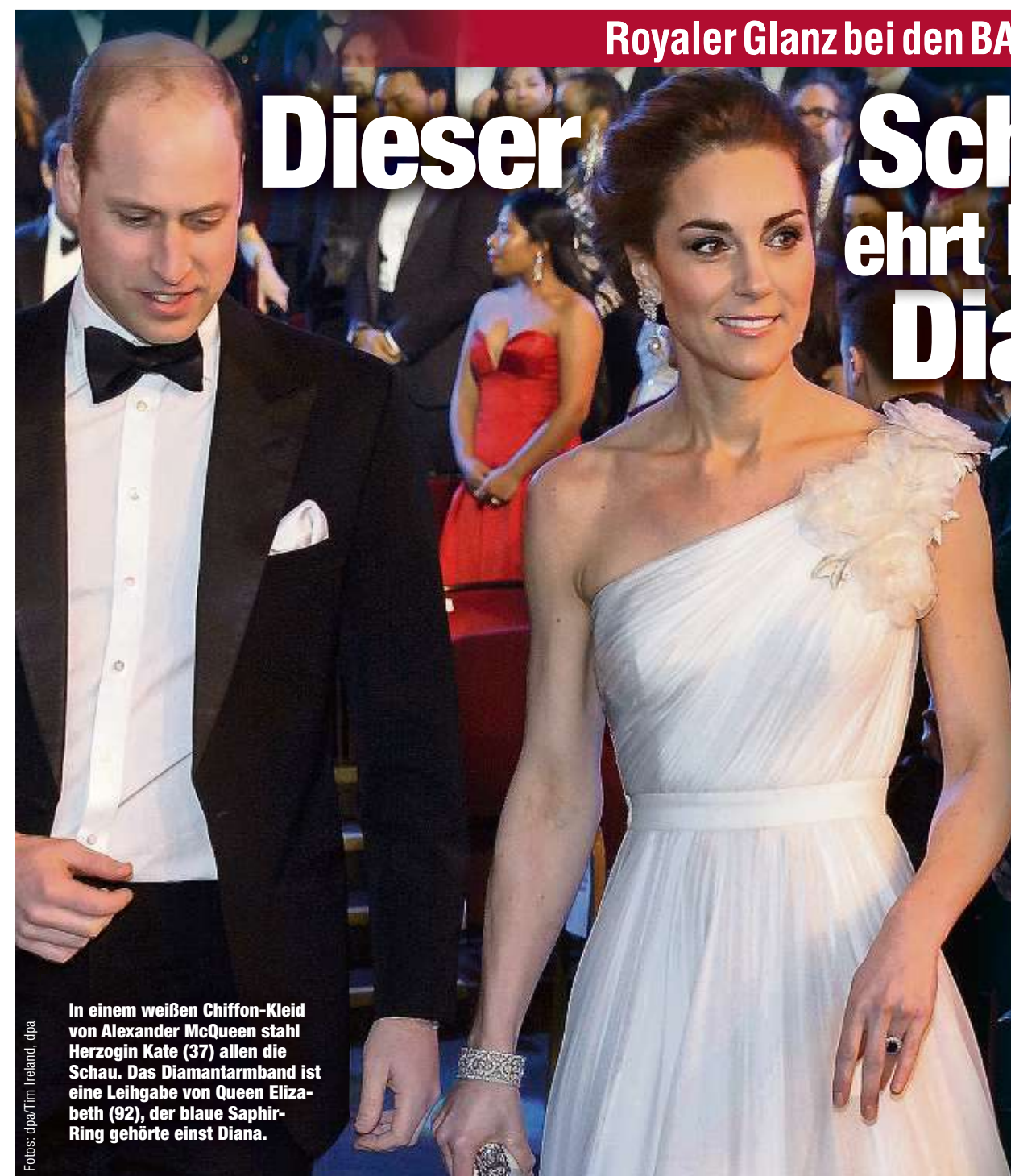
In einem weißen Chiffon-Kleid von Alexander McQueen stahl Herzogin Kate (37) allen die Schau. Das Diamantarmband ist eine Leihgabe von Queen Elizabeth (92), der blaue Saphir-Ring gehörte einst Diana.

LONDON - Was für ein royaler Auftritt der beiden Ehrengäste: Gemeinsam mit Ehemann Prinz William (36) besuchte Herzogin Catherine (37) in der Londoner Royal Albert Hall am Sonntag die 72. Verleihung der „British Academy of Film and Television Arts“-Awards - kurz BAFTA.