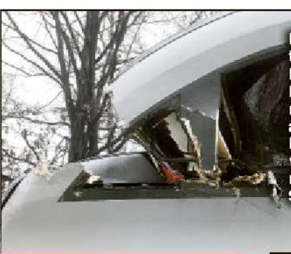
Der Baum zertrümmerte das Führerhaus. Der Lokführer rettete sich auf den Gang. Er kam leicht verletzt und mit einem Schock davon.