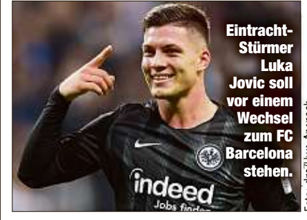
Eintracht-Stürmer Luka Jovic soll vor einem Wechsel zum FC Barcelona stehen.

Jovic nach Barcelona? FRANKFURT/M. - Eintracht Frankfurts Torjäger Luka Jovic steht angeblich vor einem Wechsel zum spanischen Spitzenklub FC Barcelona. Der Berater des 21-Jährigen habe mit den Katalanen bereits Einigkeit über einen Vertrag erzielt. Nun müsse Barcelona mit der Eintracht nur noch über die Ablösesumme