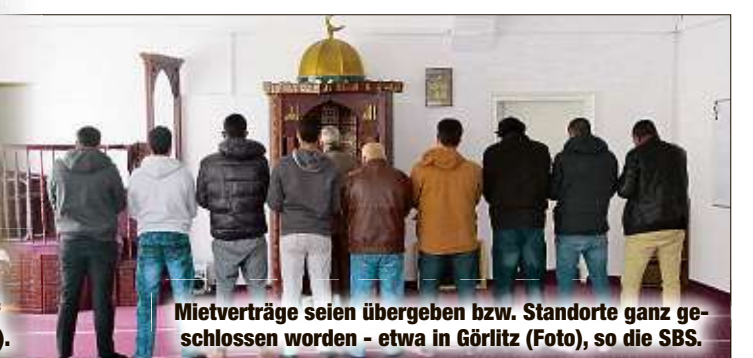
Mietverträge seien übergeben bzw. Standorte ganz geschlossen worden - etwa in Görlitz (Foto), so die SBS.