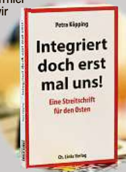
Integriert doch erst mal uns! Eine Streitschrift für den Osten

Zuvor hatte Hirte den Sozialdemokraten einen „falschen Ansatz“ und sogar „Larmoyanz“ in Sachen Ostdeutschland und Ostbürger attestiert. Er sagte unter anderem, es helfe nicht, nur herumzujammern, dass die Ostdeutschen zu kurz gekommen seien und deshalb mehr