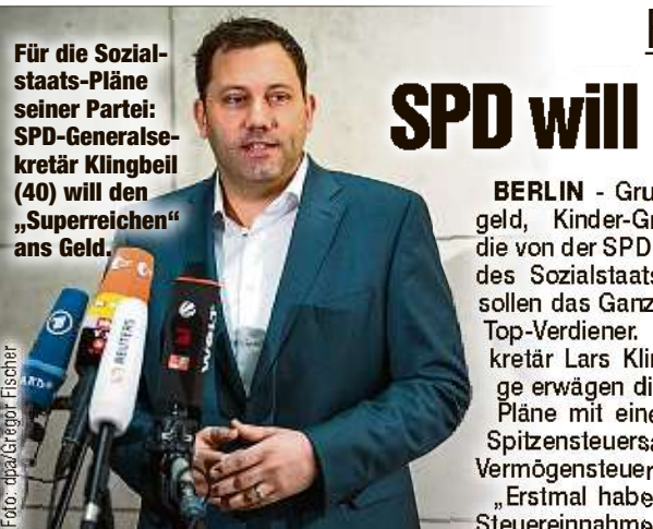
Für die Sozialstaats-Pläne seiner Partei: SPD-Generalsekretär Klingbeil (40) will den „Superreichen“ ans Geld.

FRAUENFELD - Mehr als 120 Stundenkilometer zu schnell ist ein Deutscher in der Schweiz mit seinem Auto in eine Polizeikontrolle geraten. Der 34-Jährige raste mit 249 Kilometern in der Stunde über eine Autobahn mit Tempolimit 120. Rasen ist in der Schweiz eine Straftat. Bei einer derartigen Geschwindigkeitsüberschreitung drohen ein bis vier Jahre Haft. Der Mann wurde vorläufig festgenommen und musste seinen Führerschein abgeben.