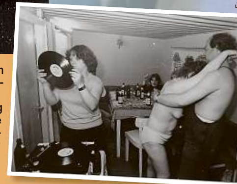
Auch das war ein Stück realsozialistische „Deutsche Heimat“.