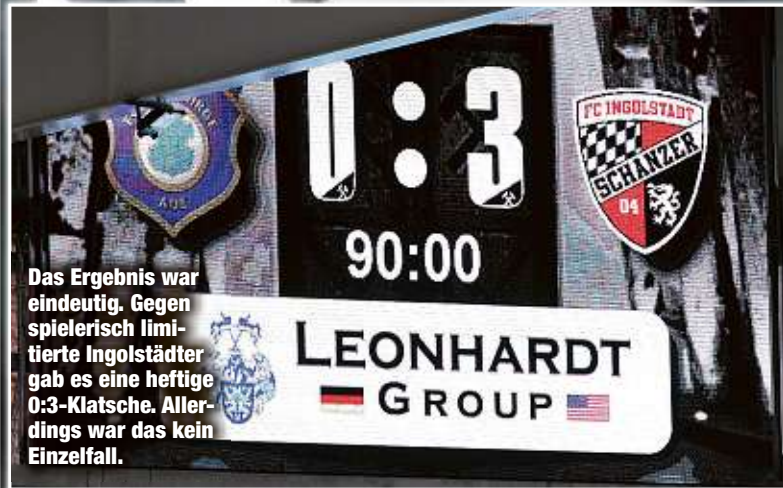
Das Ergebnis war eindeutig. Gegen spielerisch limitierte Ingolstädter gab es eine heftige 0:3-Klatsche. Allerdings war das kein Einzelfall.