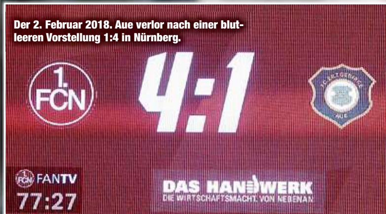
Der 2. Februar 2018. Aue verlor nach einer blutleeren Vorstellung 1:4 in Nürnberg.