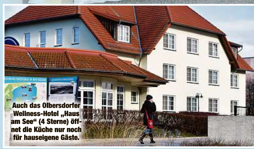
Auch das Oibersdorfer Wellness-Hotel „Haus am See“ (4 Sterne) öffnet die Küche nur noch für hauseigene Gäste.