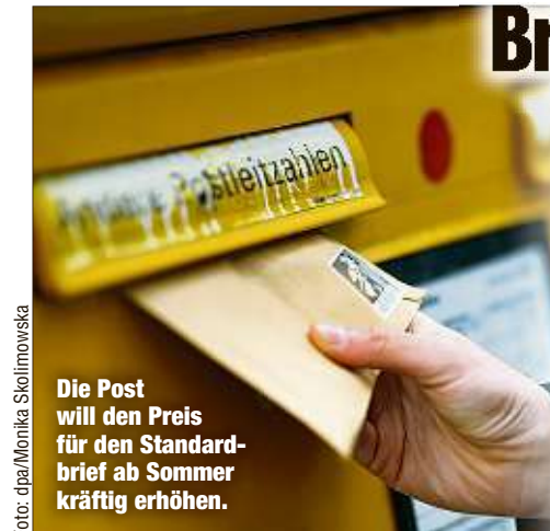
Die Post will den Preis für den Standardbrief ab Sommer kräftig erhöhen.

BONN - Das Briefporto wird in diesem Jahr aller Voraussicht nach teurer als bisher erwartet. Auf Basis einer Verordnung des Wirtschaftsministeriums soll es der Deutschen Post laut „FAZ“ ermöglicht werden, das Porto deutlich anzuheben. Branchenkreisen zufolge könnte das Porto für einen Standardbrief von aktuell 70 Cent auf 85 bis 90 Cent steigen. Der genaue Wert ist noch unklar