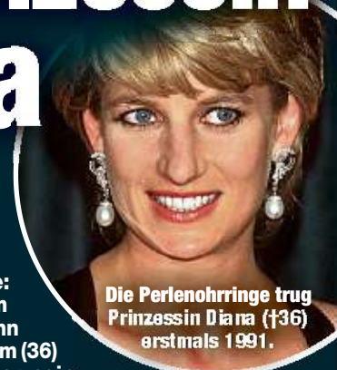
Die Perlenohrringe trug Prinzessin Diana (†36) erstmals 1991.

Kate zog dabei alle Blicke auf sich - sie trug legendäre Ohrhänge von Williams Mutter Lady Diana (†36). Eigentlich werden bei den BAFTAs die Stars aus Film und Fernsehen ausgezeichnet. Doch als das königliche Paar über den roten Teppich in den Saal schwebte, standen alle Gäste auf, es herrschte absolute Stille - ein Zeichen des Respekts. Für Kate schien diese Geste allerdings ungewohnt zu sein. Als sich die Herzogin von Cambridge auf ihren Platz in der ersten Reihe setzte, flüsterte sie: „Es ist so ruhig.“ William sagte leise: „Lass' uns schnell hinsetzen.“ Besonders rührend: Neben einem Kleid von Alexander McQueen trägt Kate Perlenohrringe ihrer verstorbenen Schwiegermutter Diana und ein Armband von Queen Elizabeth (92). Mehr royaler Glanz geht kaum!