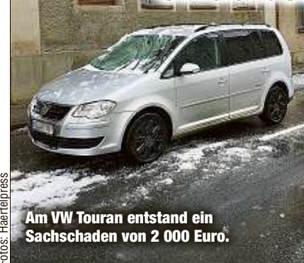
Am VW Touran entstand ein Sachschaden von 2 000 Euro.

SCHEIBENBERG - Glück im Unglück hatte eine Urlauberfamilie aus Güstrow. Eine Dachlawine erfasste ihren VW Touran während der Fahrt und begrub die Frontscheibe, Kühlerhaube und Dach. Keiner der drei Insassen wurde verletzt. Laut Polizei beträgt der entstandene Sachschaden 2 000 Euro. Der Unfall ereignete sich am Nachmittag in der Sil-