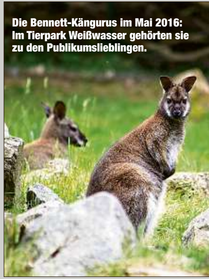
Die Bennett-Kängurus im Mai 2016: Im Tierpark Weißwasser gehörten sie zu den Publikumsbeliebten.