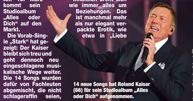
14 neue Songs hat Roland Kaiser (66) für sein Studioalbum „Alles oder Dich“ aufgenommen.