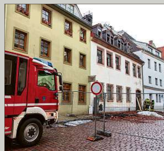
Weil immer noch Gebäudeteile abstürzen können, war die Akazienstraße auch gestern noch gesperrt.

FREIBERG - Einen Tag nach der tödlichen Brand-Katastrophe in der Altstadt wird deutlich: Das Gedächtnis der Stadt ist um Haaresbreite der Vernichtung entkommen.