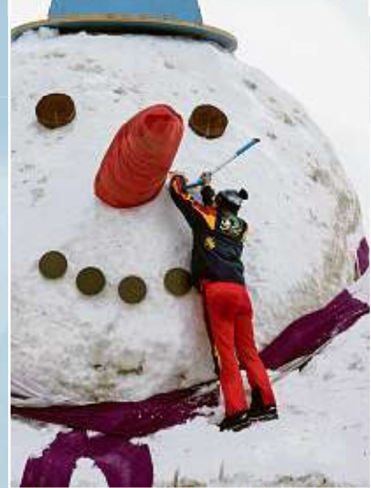
Mitglieder des Skiclub Carlsfeld schnitzen am neuen Riesen-Schneemann.