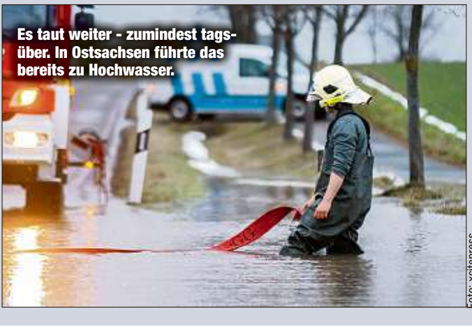
Es taut weiter - zumindest tagsüber. In Ostsachsen führte das bereits zu Hochwasser.

Tief „Uwe“ hat uns den Marsch geblasen - und das nicht zu knapp. Teilweise orkanartige Böen fegten in der Nacht zum Montag über Sachsen hinweg. Doch ab jetzt kommt Hoch „Dorit“ auf uns zu und verscheucht „Uwe“. „Das Wetter beruhigt sich“, so Jens Oehmichen (50) vom Wetterdienst in Leipzig. Es ist zwar heute noch bewölkt bei Temperaturen um die vier bis fünf Grad, auch in den Tiefländern. Das hält sich auch noch