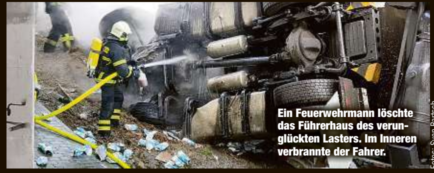
Ein Feuerwehrmann löschte das Führerhaus des verunglückten Lasters. Im Inneren verbrannte der Fahrer.

wurde verletzt ins Krankenhaus gebracht. Erst am Nachmittag gelang es, die verkohlte Leiche des Truckers aus dem Führerhaus zu bergen.