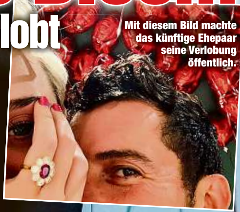
Mit diesem Bild machte das künftige Ehepaar seine Verlobung öffentlich.