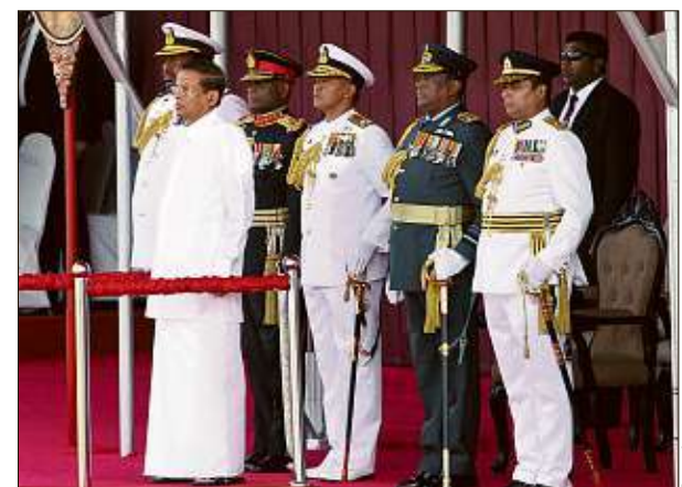
Präsident Maithripala Sirisena (67) hatte erst kürzlich angekündigt, demnächst wieder öfter hinrichten zu wollen.

Aktuell gibt es in Sri Lanka knapp 1300 Vergewaltiger, Mörder und Drogenhändler, die zur Todesstrafe verurteilt wurden. Seit 1976 hat das Land jedoch kein Todesurteil mehr vollstreckt.