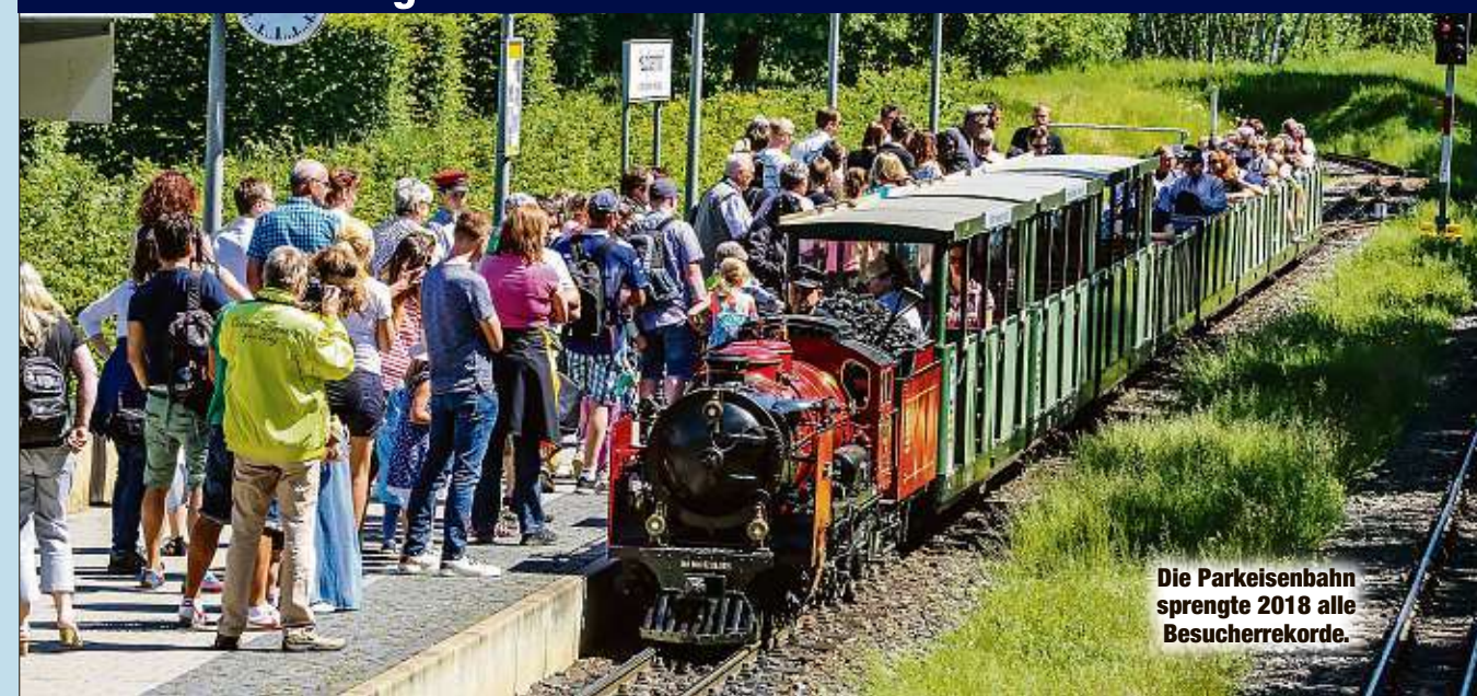
Die Parkeisenbahn sprengte 2018 alle Besucherrekorde.