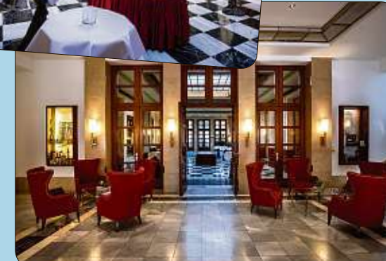
Klare Formen, zeitloser Glanz: die Hotel-Lobby im Bauhaus-Stil.