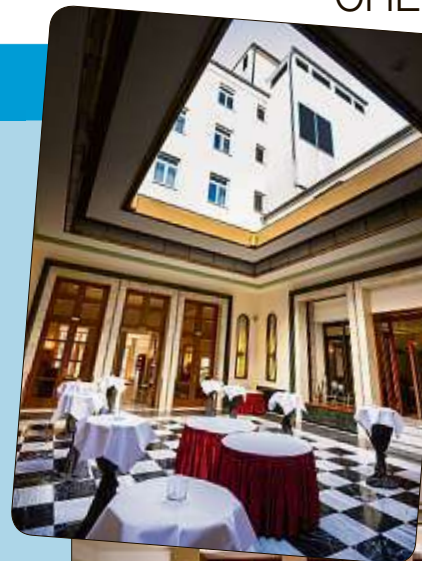
Ein seltener Anblick: Die mondäne Hotelhalle mit geöffnetem Glasdach.