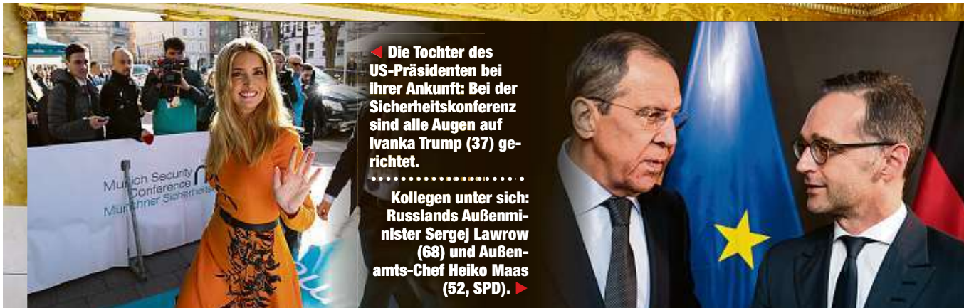
Die Tochter des US-Präsidenten bei ihrer Ankunft: Bei der Sicherheitskonferenz sind alle Augen auf Ivanka Trump (37) gerichtet.

MOSKAU - Kreml-Chef Wladimir Putin (66) hat sich bei einem Judotraining in Sotschi den Ringfinger an der rechten Hand verletzt. Sein Fingernagel riss ein. „Nicht so schlimm, wir sind doch keine Mädchen, weinen nicht“, meinte Putin scherzhaft und betonte, dass die russischen Frauen im Judo die besten seien.