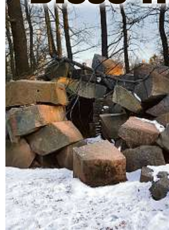
Früher dienten die Gänge vermutlich der Munitionsversorgung von Flugabwehrkanonen.

CHEMNITZ - Im Tierpark Chemnitz gibt es geheime „Gehege“, die im Lageplan nicht zu finden sind. Inmitten gemauerter Gänge hausen Insekten, Fledermäuse und Spinnen. Sie suchen während der Wintermonate ein ungestörtes Plätzchen. Besuchern bleibt dieses „Gehege“ aus Sicherheitsgründen verwehrt. Die Gänge befinden sich nahe der Steinböcke unter dem Huftierberg. Sie sind seit der Park-Eröffnung 1964 bekannt, wie die Stadt mitteilte. Vermutlich handelt es sich dabei um Wehrgänge, die zur Munitionsversorgung von Flugabwehrkanonen dienten. Mit der Zeit nisteten sich Spinnen, Insekten und Fledermäuse ein, um ungestört überwintern zu können. Die Tierpark-Mitarbeiter haben den Tunnel dafür mit Ziegelsteinen ausgestaltet. „Hier leisten wir einen wichtigen Beitrag zum Artenschutz einheimischer Tierarten“, so Zoopädagoge Jan Klösters (35). Für Besucher werden die Gänge allerdings nie zugänglich sein. Laut Stadt könne keine Sicherheit gewährleistet werden. „Letztlich wollen wir aber auch die Tiere, die dort überwintern, nicht stören.“ tgr