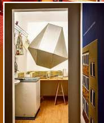
Mehr Ostalgie geht kaum: original DDR-Waschmaschine, eine Wabe vom Centrum-Warenhaus sowie das Modell der Prager Straße.