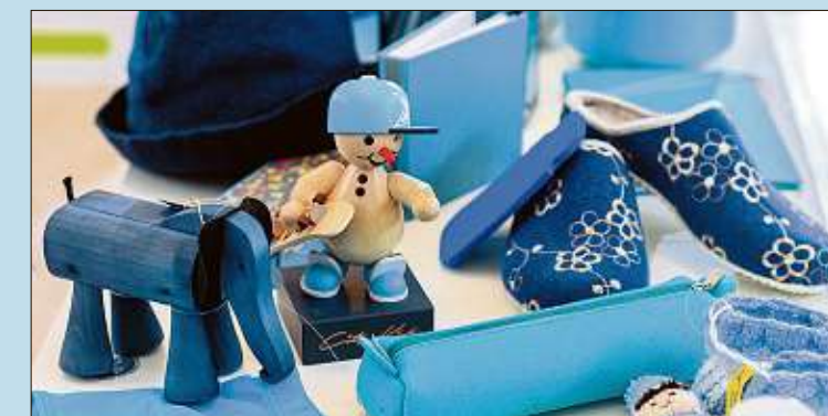
Robust und liebevoll: Die Kinderspielsachen der Firma „Holzspielzeug Lipkowsky“ aus Flöha.

tüfteln begann und groß rausgekommen ist“, erklärt Landratsamt-Sprecher André Kaiser. Auf „kuscheligen“ 100 Quadratmetern zeigen 60 Unternehmen ihre Produkte. Mit dabei ist beispielsweise die Wonneberger Manufaktur aus Mühlau. Sie präsentiert ihre ausgefallene Unterwäsche. „Sowas würde man vermutlich in Mittelsachsen nicht vermuten“, so Kaiser. Kinderaugen zum Leuchten bringt „Holzspielzeug Lipkowsky“ aus Flöha - mit lie-