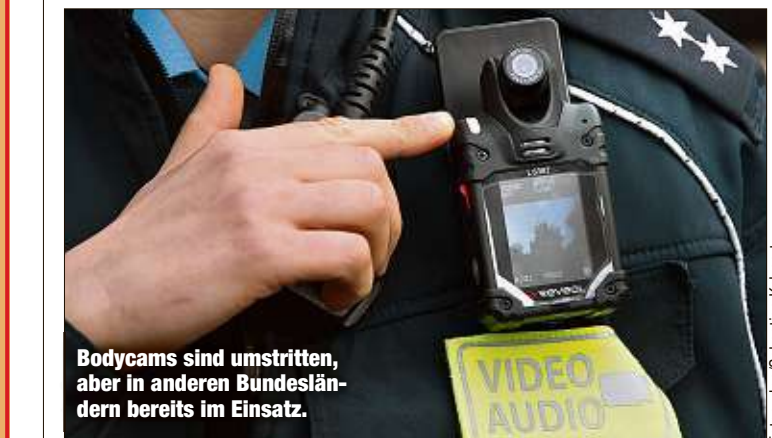
Bodycams sind umstritten, aber in anderen Bundesländern bereits im Einsatz.