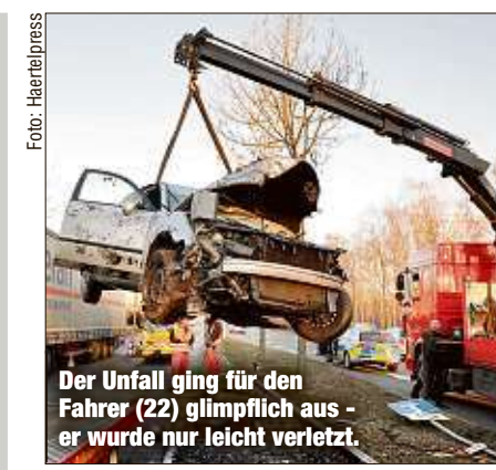
Der Unfall ging für den Fahrer (22) glimpflich aus - er wurde nur leicht verletzt.