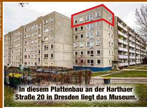
In diesem Plattenbau an der Harthaer Straße 20 in Dresden liegt das Museum.