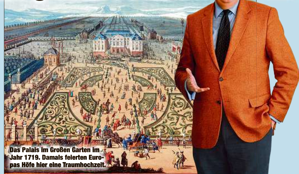
Das Palais im Großen Garten im Jahr 1719. Damals feierten Europas Höfe hier eine Traumhochzeit.