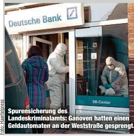
Spurensicherung des Landeskriminalamts: Ganoven hatten einen Geldautomaten an der Weststraße gesprengt.

Der Haupttäter war gut 1,70 Meter groß, schlank und dunkel gekleidet. Er sprach nicht deutsch. Spezialisten des Landeskriminalamtes sicherten am Morgen Spuren. Die Polizei sucht weitere Zeugen, ☎ 0371/3873448. bri