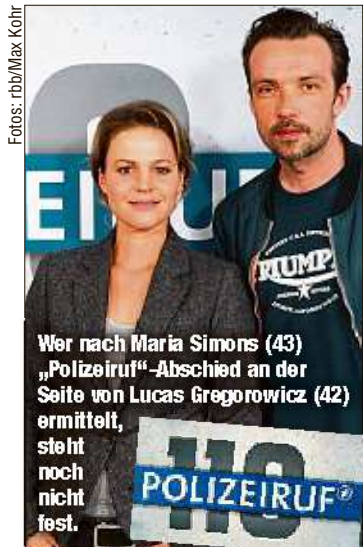
Wer nach Maria Simons (43) „Polizeiruf“ „Abschied an der Seite von Lucas Gregorowicz (42) ermittelt, steht noch nicht fest.

Schlagerstar Mary Roos will sich mit 70 nun mehr auf ihr Privatleben konzentrieren. Eine Option als Theaterschauspielerin hält sie sich aber offen.