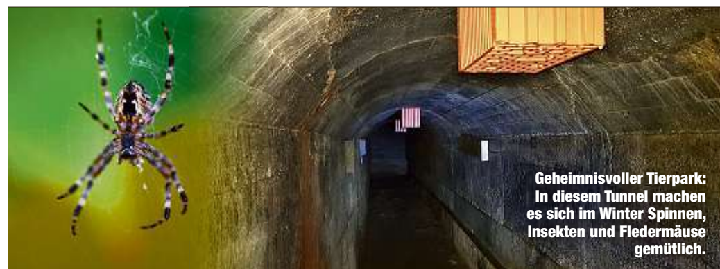
Geheimnisvoller Tierpark: In diesem Tunnel machen es sich im Winter Spinnen, Insekten und Fledermäuse gemütlich.