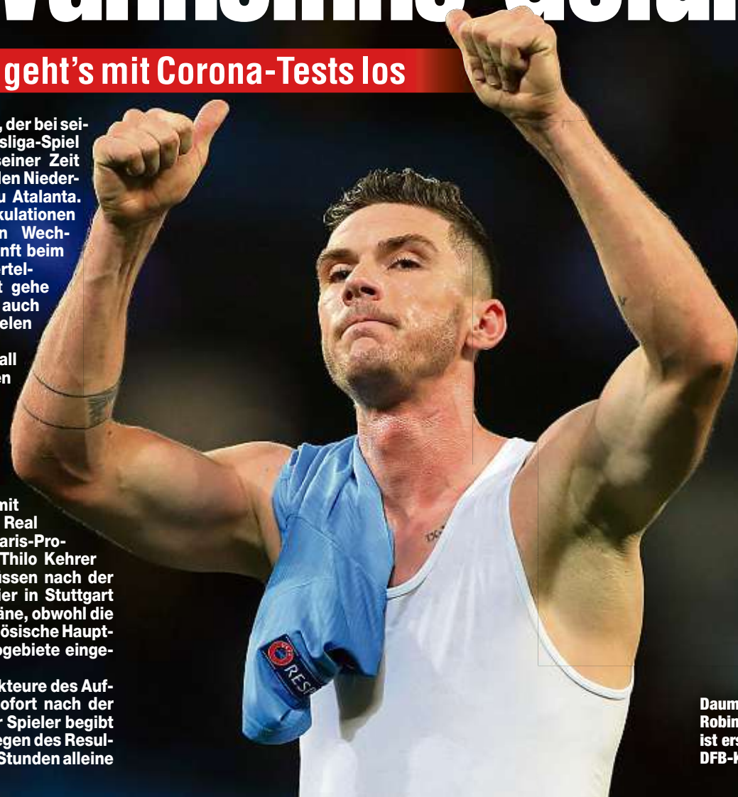
Daumen rauf! Robin Gosens ist erstmals im DFB-Kader dabei.

Wie alle anderen 19 Akteure des Aufgebots wird das Trio sofort nach der Anreise getestet. Jeder Spieler begibt sich dann bis zum Vorliegen des Resultats lediglich für einige Stunden alleine auf sein Hotelzimmer.