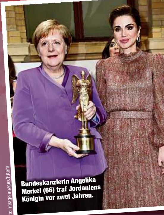
Bundeskanzlerin Angelika Merkel (66) traf Jordaniens Königin vor zwei Jahren.

Für ihr Engagement ist Rania vielfach ausgezeichnet worden. Im eigenen Land ist ihre Art allerdings nicht immer gern gesehen. Oft wird ihr aus konservativer Ecke vorgeworfen, sie gehe zu offensiv mit der eigenen politischen Meinung um. Und so sehr ihr elegantes Auftreten andernorts gefeiert wird - in Jordanien hält sich der Vorwurf, sie fröne in ihren Designerkostümen der „Verschwendungssucht auf Staatskosten“. Auch eine Frau, die das Wirtschaftsmagazin „Forbes“ einmal als eine der einflussreichsten der Welt listete, hat eben nicht nur Fürsprecher.