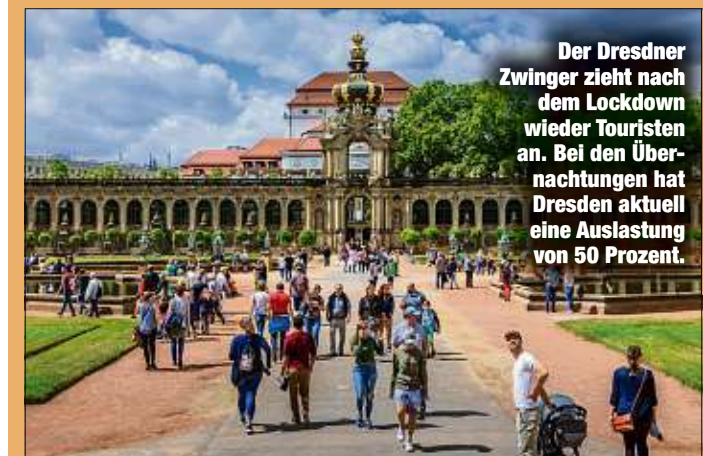
Der Dresdner Zwinger zieht nach dem Lockdown wieder Touristen an. Bei den Übernachtungen hat Dresden aktuell eine Auslastung von 50 Prozent.

Vor allem in den Städten liegen die Übernachtungszahlen noch weit hinter denen der Vorjahre zurück. Das Busgruppen-geschäft laufe nur zögerlich, zudem fehlen ausländische Touristen und Reisende im Zusammenhang mit größeren Events, Messen und Kongressen, so Hiebl.