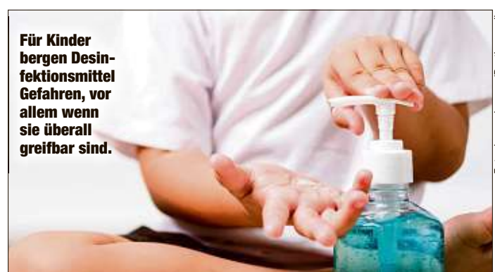
Für Kinder bergen Desinfektionsmittel Gefahren, vor allem wenn sie überall greifbar sind.

ten des Giftinformationszentrums (GGIZ). Deutlich häufiger als sonst läuten dort die Telefone. „Grundsätzlich passiert gerade mehr mit Desinfektionsmitteln, weil mehr davon vorhanden ist, aber auch weil in der, allgemeinen Rage‘ nicht sachgerecht