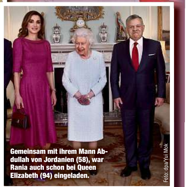
Gemeinsam mit ihrem Mann Abdullah von Jordanien (58), war Rania auch schon bei Queen Elizabeth (94) eingeladen.