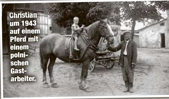
Christian um 1943 auf einem Pferd mit einem polnischen Gastarbeiter.