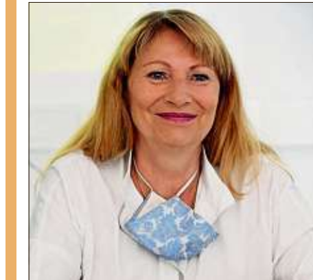
Will keine weiteren Verbote: Gesundheitsministerin Petra Köpping (62, SPD).

testete Menschen. Mit oder an Corona starben bislang 224 Personen. Sachsen hat das niedrige Infektionsgeschehen in den vergangenen Monaten stets als Grund für die Lockerungen angeführt und preschte bei einigen Punkten vor - etwa bei der Öffnung von Schulen, Kitas oder Gastronomiebetrieben. „Wir haben täglich unheimlich viel dazugelernt, das hilft uns jetzt“, sagte Köpping. Zudem wurden die Laborkapazitäten deutlich erhöht. Anfang April konnten täglich circa 4 000 Tests auf das Coronavirus durchgeführt werden, aktuell sind es rund 9 500 pro Tag.