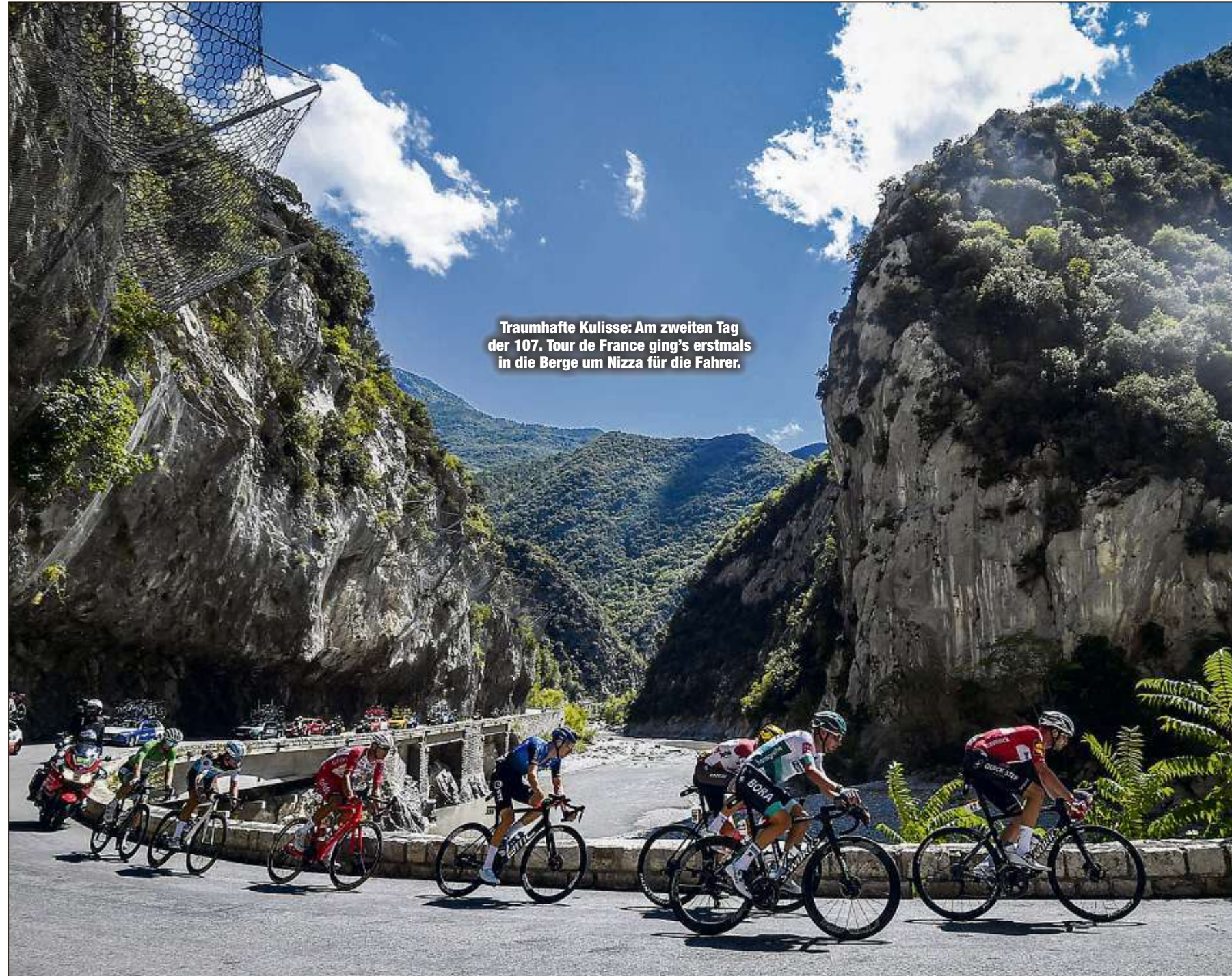
Traumhafte Kulisse: Am zweiten Tag der 107. Tour de France ging's erstmals in die Berge um Nizza für die Fahrer.