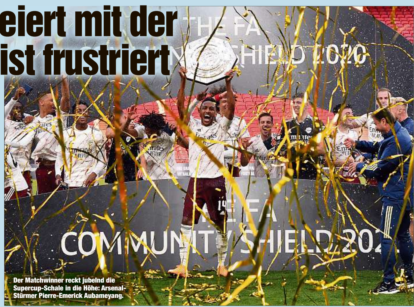
Der Matchwinner reckt jubelnd die Supercup-Schale in die Höhe: Arsenal-Stürmer Pierre-Emerick Aubameyang.

Aubameyang hatte Arsenal mit einem sehenswerten Distanzschuss früh in Führung gebracht (12.), der Japaner Takumi Minamino glich mit seinem ersten Pflichtspieltor für die Reds aus (73.).