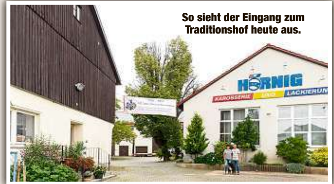
So sieht der Eingang zum Traditionshof heute aus.