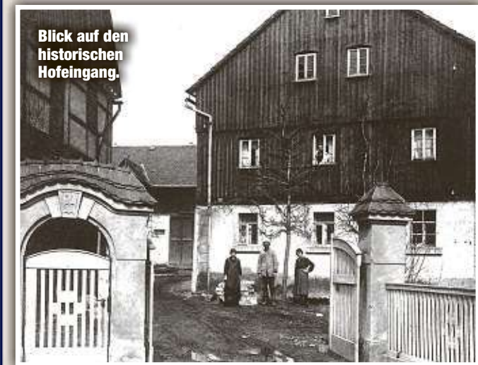
Blick auf den historischen Hofeingang.