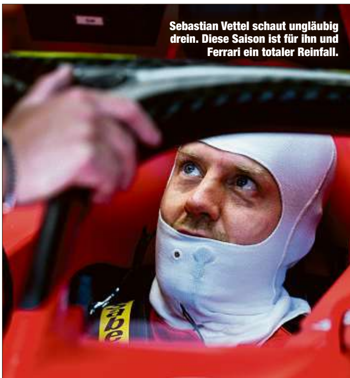
Sebastian Vettel schaut ungläubig drein. Diese Saison ist für ihn und Ferrari ein totaler Reifall.

Nächster WM-Lauf: Großer Preis von Italien am 6. September, 15.10 Uhr MESZ, in Monza