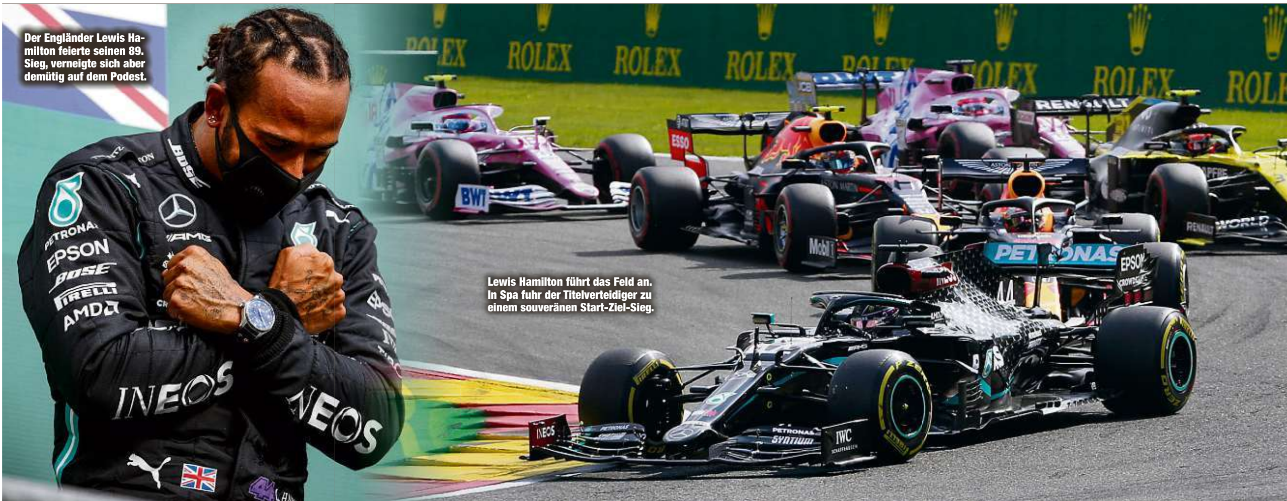
Der Engländer Lewis Hamilton feierte seinen 89. Sieg, verneigte sich aber demütig auf dem Podest.