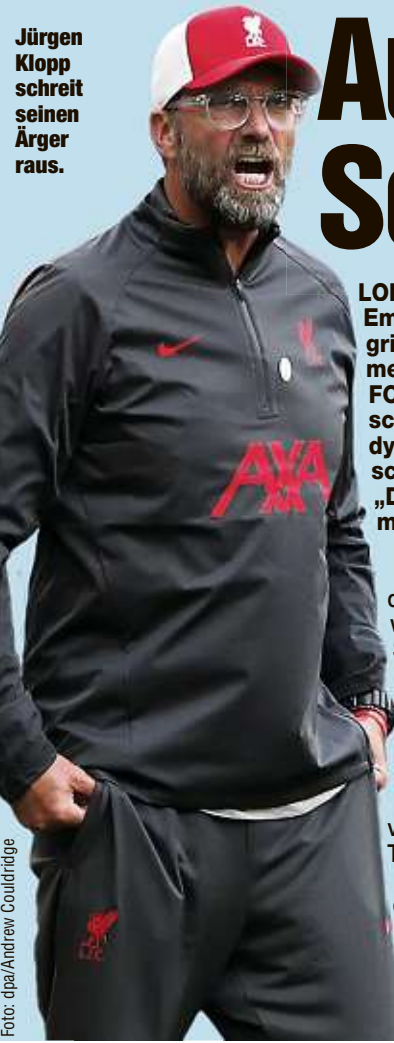
Jürgen Klopp schreit seinen Ärger raus.

das so kommt, kann es eine extrem spannende Zeit im Frauenfußball werden“, sagte Popp. Der bekennende BVB-Fan Popp plant allerdings keinen Wechsel. „Dass ich jetzt im neunten Jahr in Wolfsburg bin, spricht Bände. Mein Vertrag läuft bis 2023, davor will ich mich nicht verändern. Es ist nicht mein großer Traum, im Ausland spielen zu wollen“, sagte die 29-jährige Nationalspielerin.