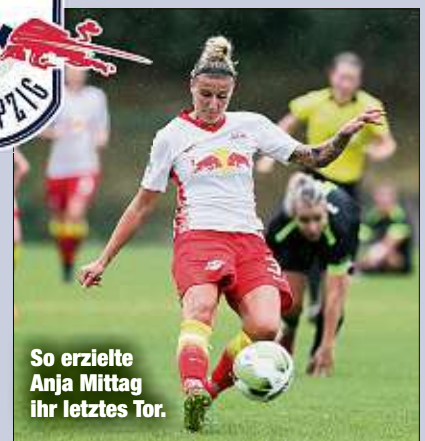
So erzielte Anja Mittag ihr letztes Tor.