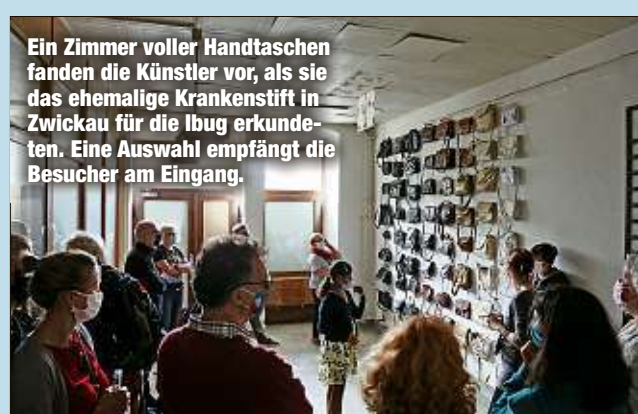
Ein Zimmer voller Handtaschen fanden die Künstler vor, als sie das ehemalige Krankentift in Zwickau für die Ibug erkundeten. Eine Auswahl empfängt die Besucher am Eingang.

dem Eigentümer des Gebäudes. „Aber es wird schwierig“, hieß es gestern. Das besondere Konzept der Industriearchitekturumgestaltung (Ibug) mit Künstlern aus der ganzen Welt hatte in den vergangenen Jahren ein immer breiteres Publikum für Street-Art begeistert. Bis zu 20000 Besucher - vom Kind bis zum Senior - waren zu den Festivals geströmt. Entsprechend reagierten die Fans auf die Beschränkungen: „Schade um die Mühe, die sich die Künstler gemacht haben, wenn es nur so wenige betrachten dürfen“, kommentierte eine enttäuschte Besucherin bei Facebook. Um das Festival überhaupt zu ermöglichen, war es dieses Jahr mit einer Summe von 85000 Euro gefördert worden - so viel wie noch nie. MS