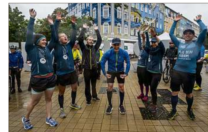
Der Verein „Lauf-KulTour“ sammelte Spenden für Menschen mit Muskeldystrophie, warb für „Chemnitz 2025“ und das Studien-Land Sachsen.