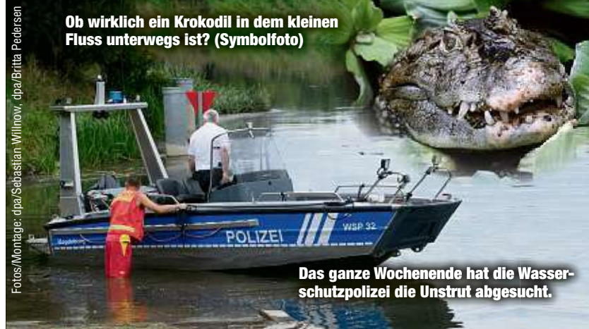
Ob wirklich ein Krokodil in dem kleinen Fluss unterwegs ist? (Symbolfoto)