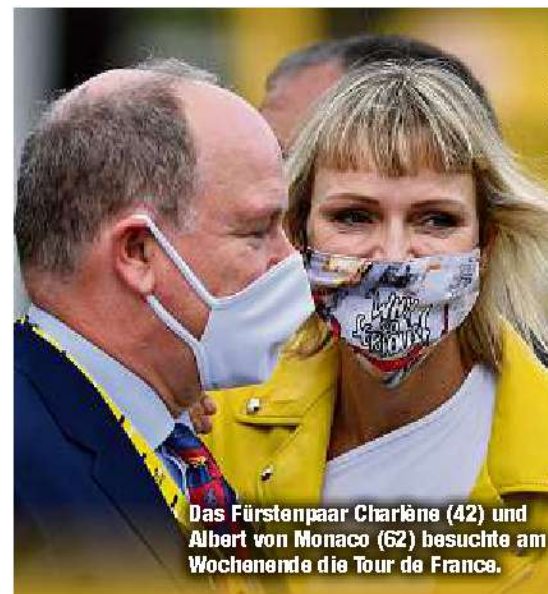
Das Fürstenpaar Charlene (42) und Albert von Monaco (62) besuchte am Wochenende die Tour de France.

SANTA BARBARA - Kehrt der verlorene Sohn bald zurück? Ja! Spätestens im kommenden Jahr will Prinz Harry (35) seiner Heimat einen Besuch abstatten. „Ich plane, auf jeden Fall zurückzukommen. Ich wäre schon da gewesen, wenn Covid es nicht vereitelt hätte“, zitiert der „Daily Mirror“ den Enkel der Queen (94). Ein Anlass könnte der Rugby League World Cup im Oktober 2021 sein, denn der Sport liegt dem Prinzen sehr am Herzen und sei immer eine Reise wert. Doch sicherlich kehren Harry, Meghan (39) und der kleine Archie (1) schon eher zurück. Schließlich soll am 1. Juli nächsten Jahres eine Statue zu Ehren von Prinzessin Diana (†36) enthüllt werden (MOPO berichtete). Ein Ereignis, das der Prinz wohl ebenfalls um keinen Preis verpassen will.