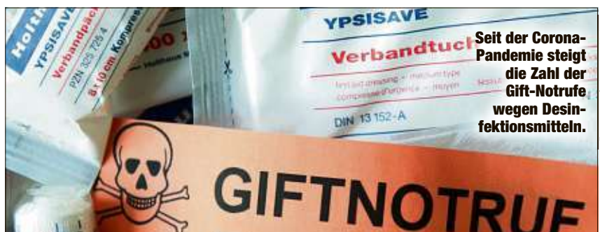
Seit der Corona-Pandemie steigt die Zahl der Gift-Notrufe wegen Desinfektionsmitteln.

Es gibt sie als Sprays, als Gele oder in flüssiger Form - Desinfektionsmittel sind seit der Corona-Pandemie aus unserem Alltag nicht mehr wegzudenken. Und das besorgt nicht nur Dermatologen, die vermehrt Handekzeme beobachten, sondern auch die Exper-