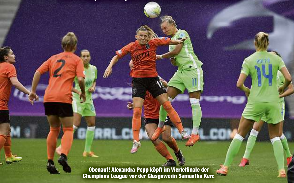
Obenauf! Alexandra Popp köpft im Viertelfinale der Champions League vor der Glasgowerin Samantha Kerr.