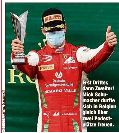
Erst Dritter, dann Zweiter! Mick Schumacher durfte sich in Belgien gleich über zwei Podestplätze freuen.

SPA - Zweites Rennen in Belgien, zweiter Podestplatz! Nach Platz drei am Sonnabend raste Mick Schumacher gestern in Spa im Sprint über 18 Runden auf Platz zwei.