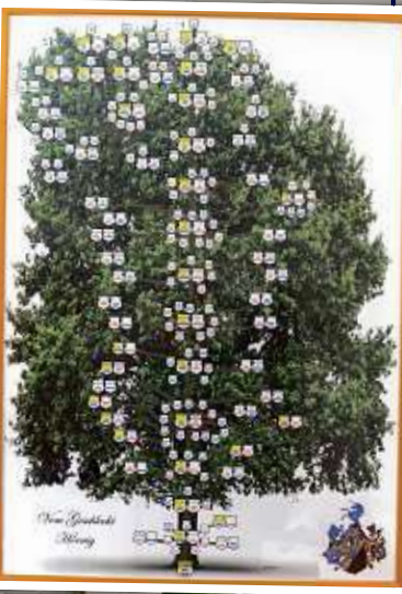
▲ Der Stammbaum der Familie reicht zurück bis ins Spätmittelalter, zeigt 14 Generationen mit ihren Verzweigungen.