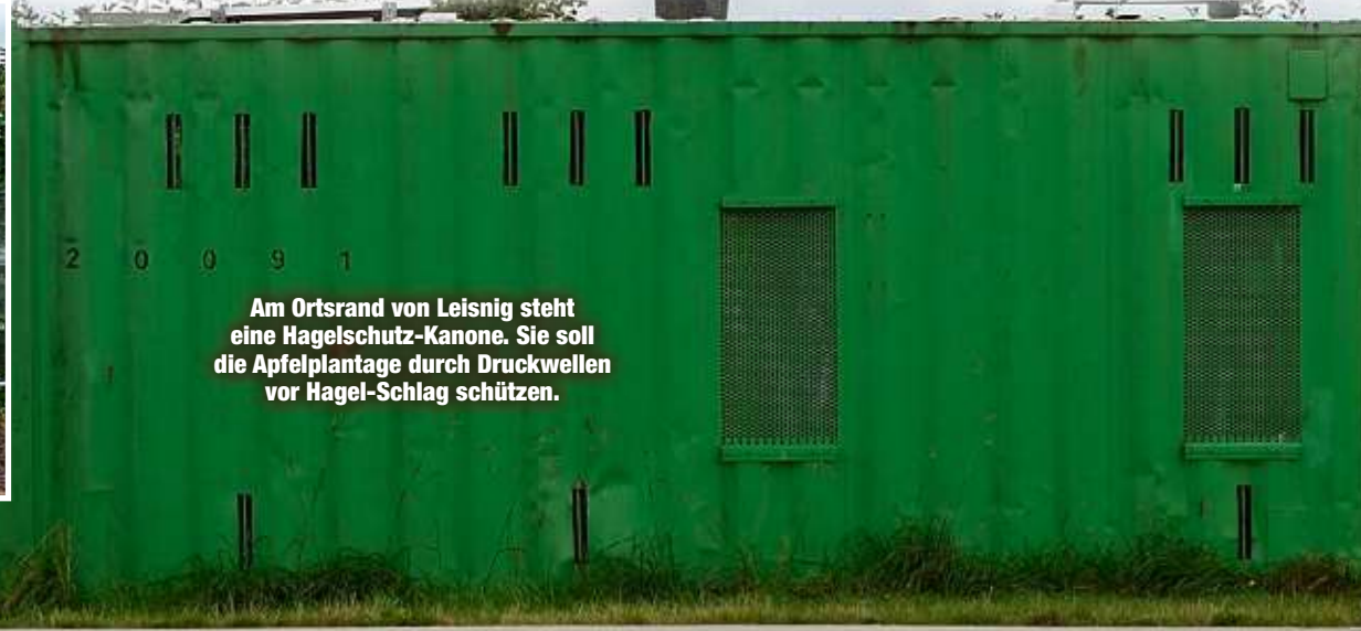
Am Ortsrand von Leisnig steht eine Hagelschutz-Kanone. Sie soll die Apfelplantage durch Druckwellen vor Hagel-Schlag schützen.