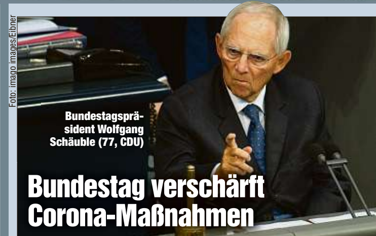
Bundestagspräsident Wolfgang Schäuble (77, CDU)

+++ NRW-Ministerpräsident Armin Laschet (59, CDU) hat die Karnevalisten zum Verzicht aufgerufen. „In diesem Corona-Jahr mussten und müssen wir alle auf Liebgewonnenes verzichten: Wenn Christen auf ein Osterfest in der Gemeinschaft, die Schützen auf ihr Schützenfest, Weintrinker auf ihr Weinfest, die Fußballfans auf ihre Stadionbesuche verzichten mussten, dann ist doch klar, dass auch der Karneval zur Disposition steht“, sagte er der „Bild am Sonntag“. Gleichzeitig wünscht sich der CDU-Politiker einheitliche Regeln, die auch vom Nachbarbundesland Rheinland-Pfalz und den Vereinen mitgetragen werden. „Dann werden die Menschen verstehen, dass wir mit dem Virus nicht so Karneval feiern können, wie es üblich war.“