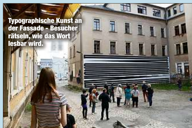
Typographische Kunst an der Fassade - Besucher rätseln, wie das Wort lesbar wird.