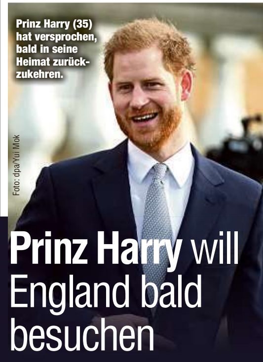
Prinz Harry (35) hat versprochen, bald in seine Heimat zurückzukehren.