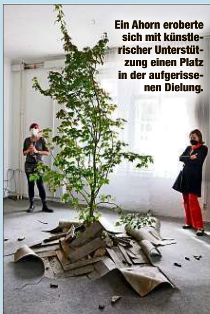
Ein Ahorn eroberte sich mit künstlerischer Unterstützung einen Platz in der aufgerissenen Diele.

ZWICKAU - „Ibug - das Festival für urbane Kunst“ war ein Festival mit Hindernissen: Bis zu einer halben Stunde Wartezeit nahmen am Wochenende rund 2000 Besucher in Kauf, um die umgestaltete Brache des ehemaligen königlichen Krankentifts anzuschauen.