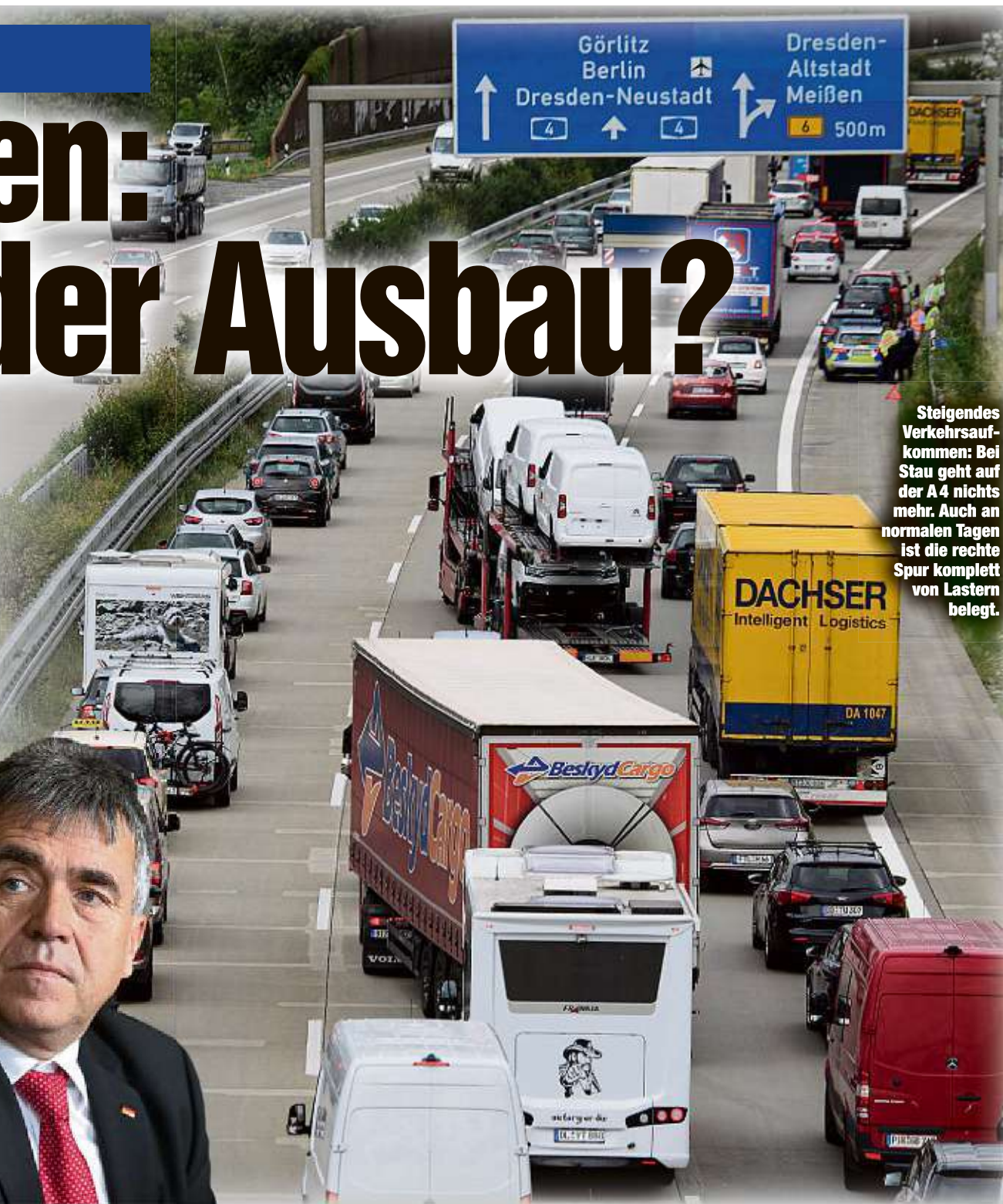
Steigendes Verkehrsaufkommen: Bei Stau geht auf der A 4 nichts mehr. Auch an normalen Tagen ist die rechte Spur komplett von Lastern belegt.