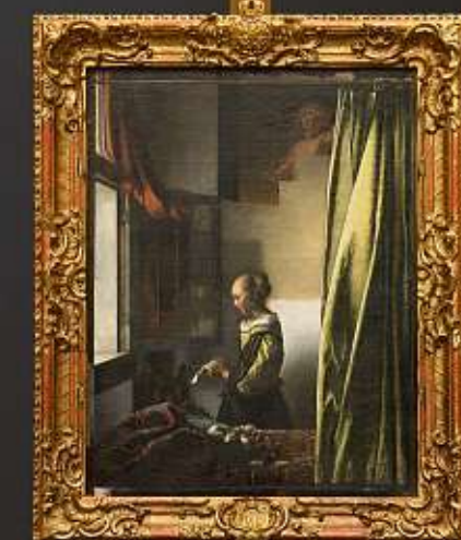
Das Gemälde „Brieflesendes Mädchen am offenen Fenster“ steht ab März 2021 im Zentrum der Ausstellung „Vermeer“.