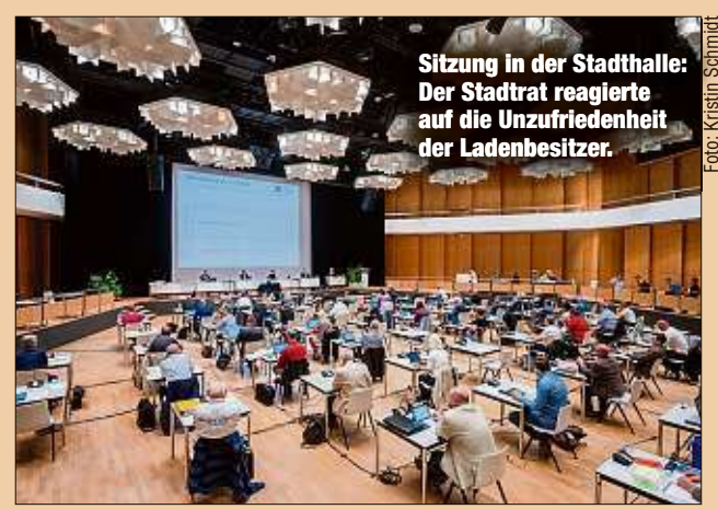
Sitzung in der Stadthalle: Der Stadtrat reagierte auf die Unzufriedenheit der Ladenbesitzer.

Zuerst war beschlossen worden, nur zwei verkaufsoffene Sonntage im November und Dezember zu ermöglichen. Diese sollten zudem nur für die Innenstadt