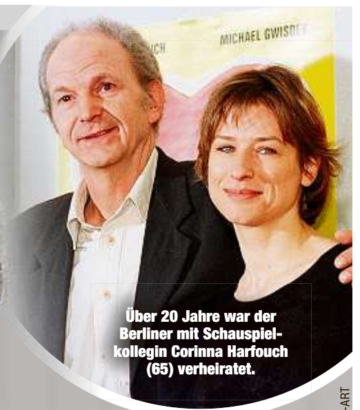
Über 20 Jahre war der Berliner mit Schauspielkollegin Corinna Harfouch (65) verheiratet.