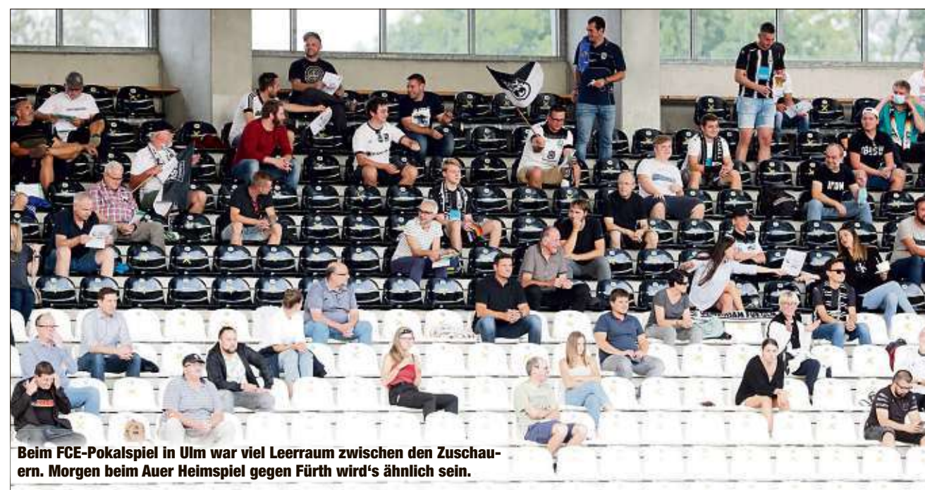
Beim FCE-Pokalspiel in Ulm war viel Leerraum zwischen den Zuschauern. Morgen beim Auer Heimspiel gegen Fürth wird's ähnlich sein.