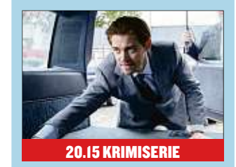
20.15 KRIMISERIE Prodigal Son Malcolm (Tom Payne) leidet unter Schlaflosigkeit und durchforstet sein Unterbewusstsein, um herauszufinden, was es mit dem „Mädchen in der Kiste“, an das er sich aus seiner Kindheit erinnert, auf sich hat.