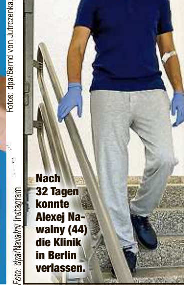
Nach 32 Tagen konnte Alexej Nawalny (44) die Klinik in Berlin verlassen.

BERLIN - Künstliches Koma, Beatmung und Sorge um Langzeitschäden: Nach 32-tägiger Behandlung ist der vergiftete russische Kremlkritiker Alexej Nawalny (44) aus der Berliner Charité entlassen worden. Der Gesundheitszustand Nawalneys habe sich „so weit gebessert, dass die akuten medizinischen Behandlung beendet werden konnte“. Die behandelnden Ärzte halten „aufgrund des bisherigen Verlaufs und des aktuellen Zustandes des Patienten