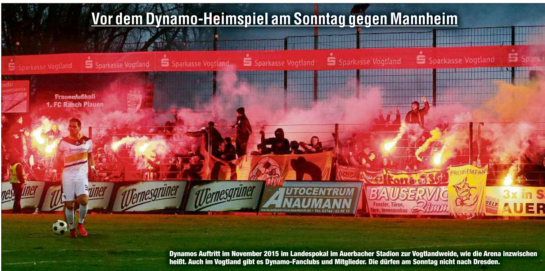
Dynamos Auftritt im November 2015 im Landespokal im Auerbacher Stadion zur Vogtlandweide, wie die Arena inzwischen heißt. Auch im Vogtland gibt es Dynamo-Fanclubs und Mitglieder. Die dürfen am Sonntag nicht nach Dresden.