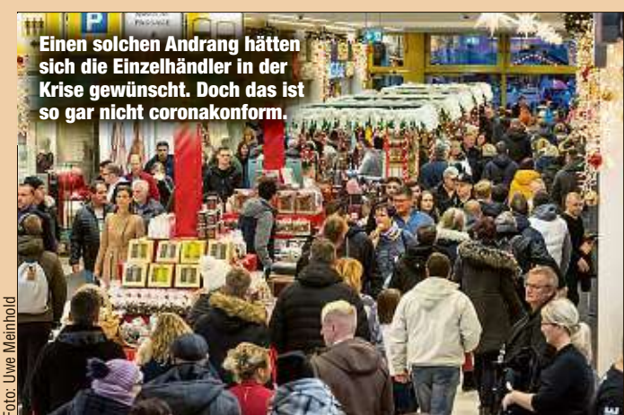
Einen solchen Andrang hätten sich die Einzelhändler in der Krise gewünscht. Doch das ist so gar nicht coronakonform.

Der lange Streit hat sich gelohnt: Drei verkaufsoffene Sonntage soll es nun in der Vorweihnachtszeit geben. Und zwar für das gesamte Stadtgebiet, nicht nur die Innenstadt. Mit dieser Entscheidung reagierte der Stadtrat auf die hitzige Diskussion der vergangenen Wochen.