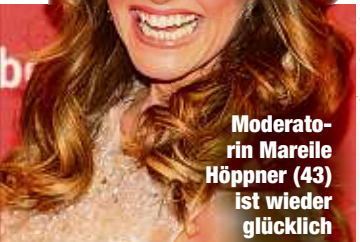
Moderatorin Mareile Höppner (43) ist wieder glücklich vergeben.