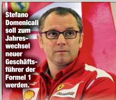
Stefano Domenicali soll zum Jahreswechsel neuer Geschäftsführer der Formel 1 werden.