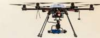
Die Zeichen stehen auf Digitalisierung: Eine Agrardrohne XR6 Geo-konzept fliegt über die Weinberge von Schloss Proschwitz.

heitsstress erkenne ich so deutlich früher, als wenn ich durch die Weinberge laufe“, erklärt der Winzer. „Wir müssen diese neuen Medien einfach nutzen. Ansonsten sind wir als Weinbaubetrieb irgendwann mal nicht mehr konkurrenzfähig.“