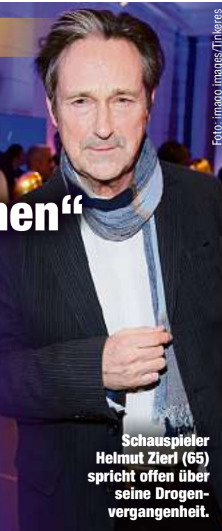
Schauspieler Helmut Zierl (65) spricht offen über seine Drogenvergangenheit.

normal“, erinnert sich Zierl an seine Zeit als Jugendlicher. Gegenüber „Bunte“ gestand er: „Der Tod war mein ständiger Begleiter.“ Doch warum legt Zierl diese Beichte erst jetzt ab? Grund dafür ist sein Buch „Follow the Sun“ (erscheint nächsten Mittwoch), in dem er seine Drogenerfahrungen aus dem Sommer 1971 aufarbeitet.