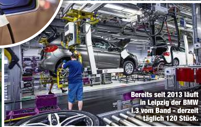
Bereits seit 2013 läuft in Leipzig der BMW i3 vom Band - derzeit täglich 120 Stück.