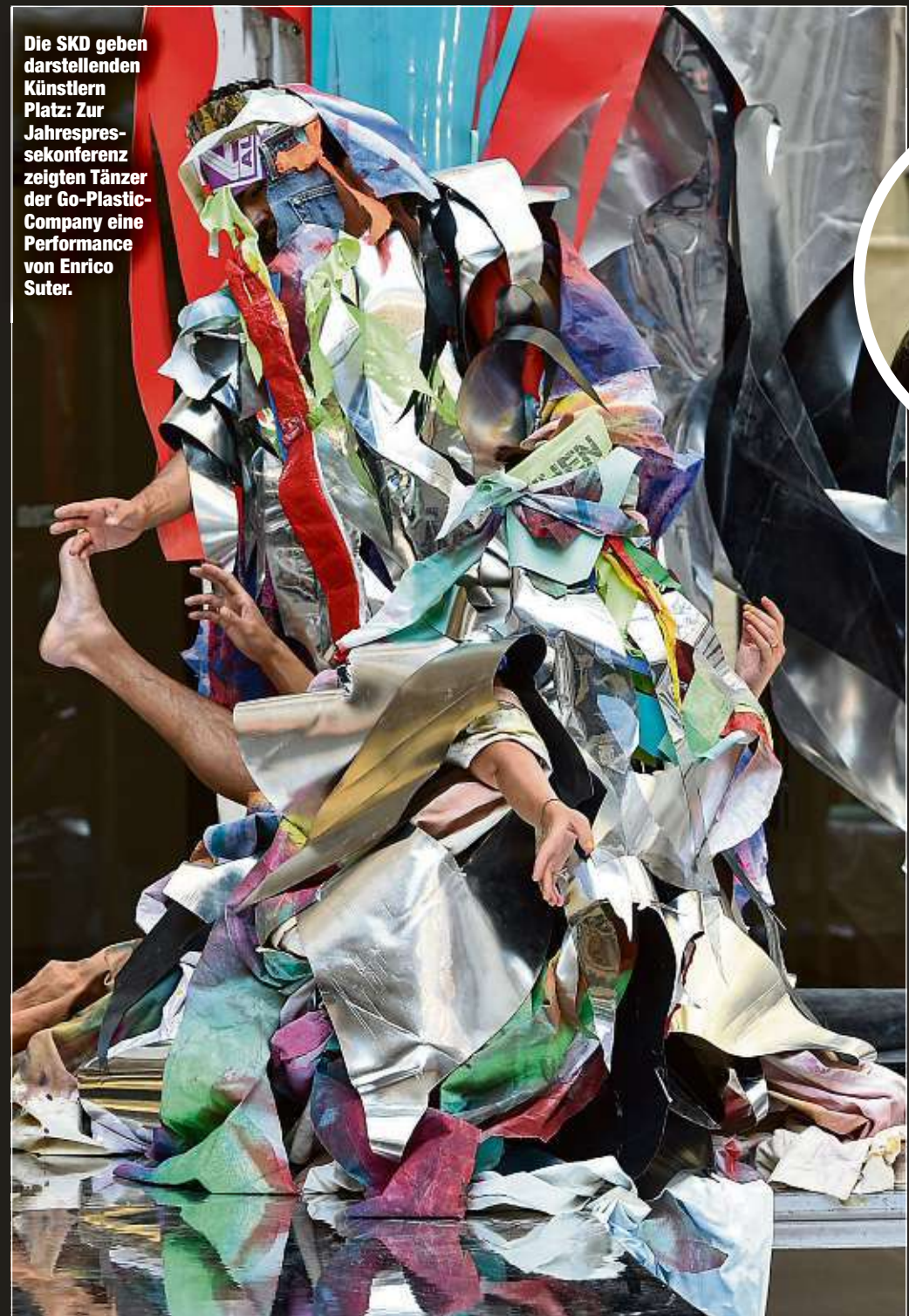
Die SKD geben darstellenden Künstlern Platz: Zur Jahrespressekonzferenz zeigten Tänzer der Go-Plastic-Company eine Performance von Enrico Suter.

spektakulärsten Ausstellungen der SKD-Geschichte, die man trotz Corona-Beschränkungen nicht verschieben konnte: „Das ist eine Once-In-A-Lifetime-Erfahrung, so etwas gibt es nur einmal.“ Ebenso einmalig ist das Projekt „Träume von Freiheit - Romantik in Russland und Deutschland“. Eröffnet wird die Schau als internationale Kooperation bereits im Dezember in der Staat-