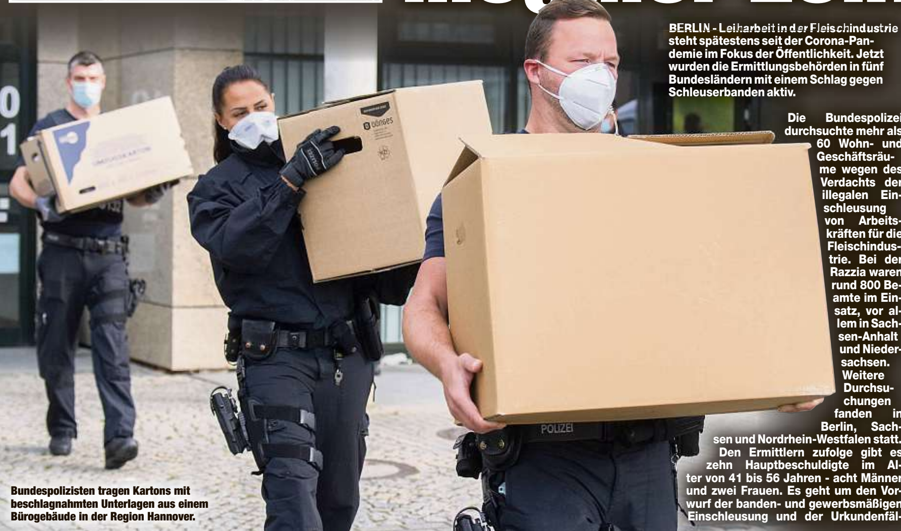
Bundespolizisten tragen Kartons mit beschlagnahmten Unterlagen aus einem Bürogebäude in der Region Hannover.

BERLIN - Leiharbeit in der Fleischindustrie steht spätestens seit der Corona-Pandemie im Fokus der Öffentlichkeit. Jetzt wurden die Ermittlungsbehörden in fünf Bundesländern mit einem Schlag gegen Schleuserbanden aktiv.