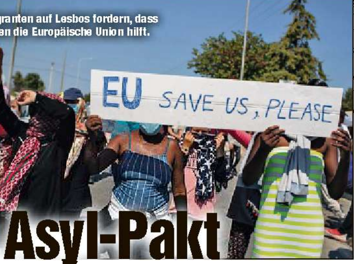
Migranten auf Lesbos fordern, dass ihnen die Europäische Union hilft.

Die von ihrer Behörde vorgelegten Vorschläge seien pragmatisch und realistisch und sähen ein „faires und angemessenes Gleichgewicht zwischen