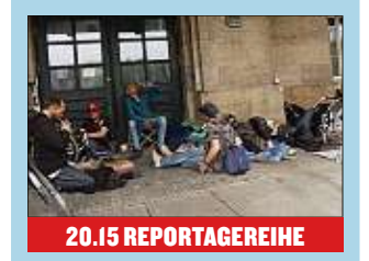
20.15 REPORTAGEREIHE Hartes Deutschland - Leben im Brennpunkt Ost- und Süddeutschland wird von Crystal Meth regelrecht überschwemmt. Der Alltag der Suchtkranken ist von Hoffnungslosigkeit geprägt.