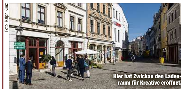
Hier hat Zwickau den Ladenraum für Kreative eröffnet.