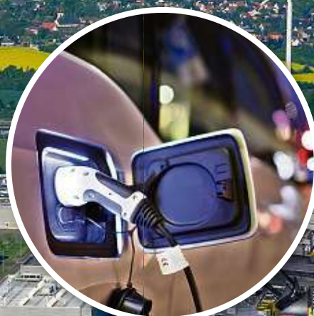
Stromstecker statt Zapfpistole - das Symbol der automobilen Zukunft.

Michael Kretschmer (45, CDU). „Die Entscheidung unterstreicht einmal mehr die Vorreiterrolle des Freistaates bei der Elektromobilität.“ BMW hat den Angaben zufolge bislang mehr als zwei Milliarden Euro in das Werk in Leipzig mit derzeit 5 400 Stammitarbeitern investiert.