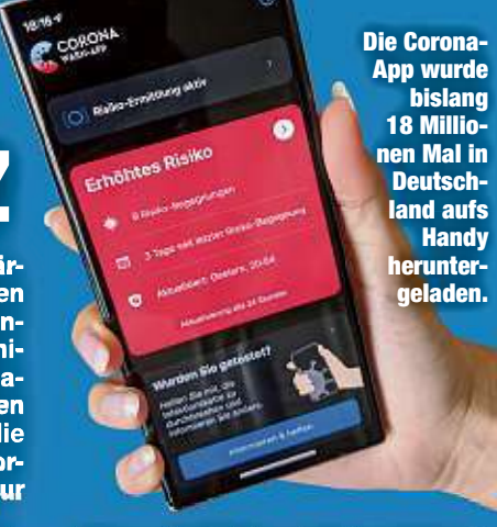
Die Corona-App wurde bislang 18 Millionen Mal in Deutschland aufs Handy heruntergeladen.

Spahn sagte bei einer Zwischenbilanz 100 Tage nach dem Start der Corona-App, bisher hätten fast 5000 Nutzer