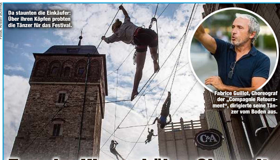
Da staunten die Einkäufer: Über ihren Köpfen probten die Tänzer für das Festival.