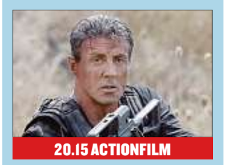
20.15 ACTIONFILM The Expendables 3 Barney Ross (Sylvester Stallone) soll einen Waffendeal verhindern. Doch dann stellt sich heraus, dass der skrupellose Waffenlieferant der todegläubige Expendables-Mitgründer Conrad Stonebanks ist.

20.15 HD 2 Nord bei Nordwest Frau Irmelr. Kriminalfilm (D 2019) Mit Hinnerk Schönemann, Henny Reents, Marleen Lohse Regie: F. Herzogenrath 8-187-927 21.45 Panorama Magazin 349-182 22.15 Tagesthemen Moderation: Pinar Atalay 112-095 22.50 Nuhr im Ersten Show Mod.: Dieter Nuhr 8-932-144 23.35 Inas Nacht Talkshow. Zu Gast: Jorge González, Birgit Schrowange, „Das Lumpenpack“. Mit Ina Müller 2-027-927 0.35 Nachtmagazin 5-302-336 0.55 HD 2 Nord bei Nordwest Kriminalfilm (D 2019) Mit H. Schönemann 6-546-458 2.25 Tagesschau 91-349-212 2.30 HD 2 Der Chinese (1/2) Thriller (D/A/S 2011) Mit Suzanne von Borsody, Michael Nyqvist, Claudia Michelsen. Regie: Peter Keglevic 2-366-038 4.00 Nuhr im Ersten Show Nur aus Berlin 7-160-748 4.45 Deutschlandbilder Kamerafahrt 7-372-748 4.55 Tagesschau 15-538-545