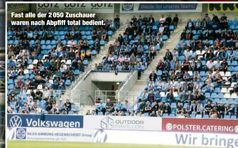
Fast alle der 2050 Zuschauer waren nach Abpfiff total bedient.

Volkswagen OUTDOOR PAVILLION POLSTER.CATERING Wir bringen