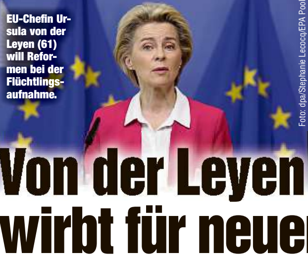
EU-Chefin Ursula von der Leyen (61) will Reformen bei der Flüchtlingsaufnahme.