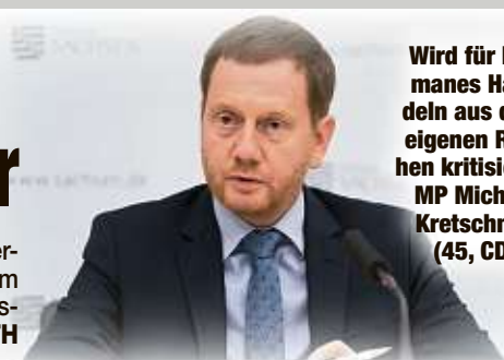
Wird für humanes Handeln aus den eigenen Reihen kritisiert: MP Michael Kretschmer (45, CDU).

jedoch solle Sachsen bitte erspart bleiben, heißt es. Dem MP lag das Schreiben gestern noch nicht vor. TH