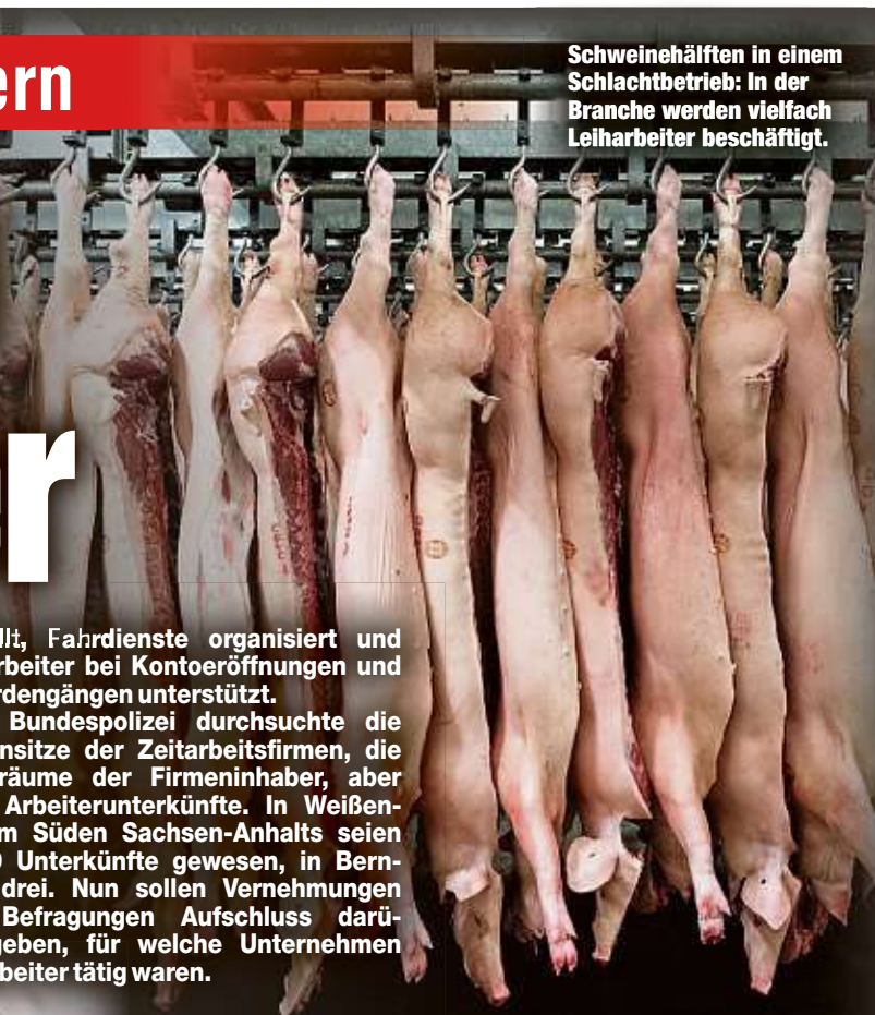
Schweinehälften in einem Schlachtbetrieb: In der Branche werden vielfach Leiharbeiter beschäftigt.

gestellt, Fahrdienste organisiert und die Arbeiter bei Kontoeröffnungen und Behördengängen unterstützt. Die Bundespolizei durchsuchte die Firmensitze der Zeitarbeitsfirmen, die Wohnräume der Firmeneinhaber, aber auch Arbeiterunterkünfte. In Weissenfels im Süden Sachsen-Anhalts seien es 49 Unterkünfte gewesen, in Bernburg drei. Nun sollen Vernehmungen und Befragungen Aufschluss darüber geben, für welche Unternehmen die Arbeiter tätig waren.