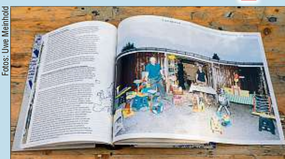
▲ Im Buch gibt es Einblicke in Chemnitzer Garagen, die 2025 eine besondere Rolle spielen sollen.