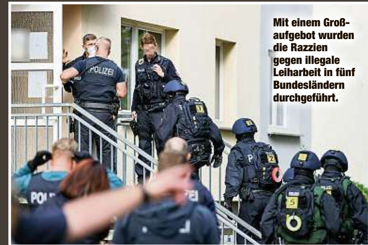
Mit einem Großaufgebot wurden die Razzien gegen illegale Leiharbeit in fünf Bundesländern durchgeführt.