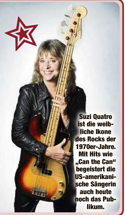
Suzi Quatro ist die weibliche Ikone des Rocks der 1970er-Jahre. Mit Hits wie „Can the Can“ begeistert die US-amerikanische Sängerin auch heute noch das Publikum.