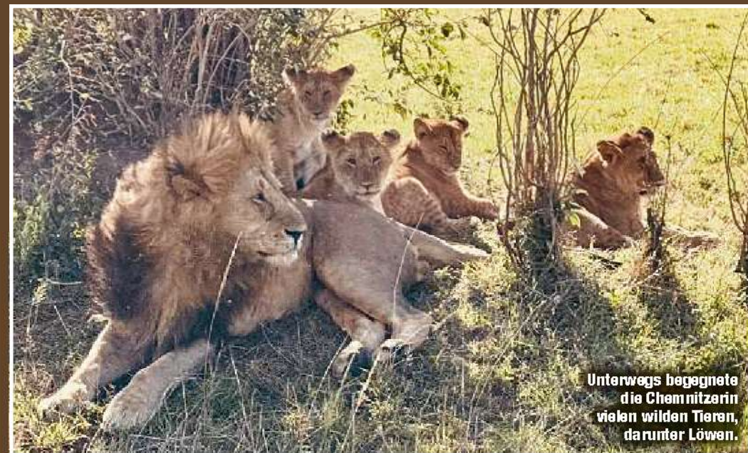
Unterwegs begegnete die Chemnitzerin vielen wilden Tieren, darunter Löwen.

Auf ihrer Fahrradreise durch Afrika forderte sich die Chemnitzerin Anne-Kathrin Kuntzsch (37) selbst heraus: Zwischen Regen, Sand und wilden Tieren legte sie für den guten Zweck 500 Kilometer in fünf Tagen zurück.