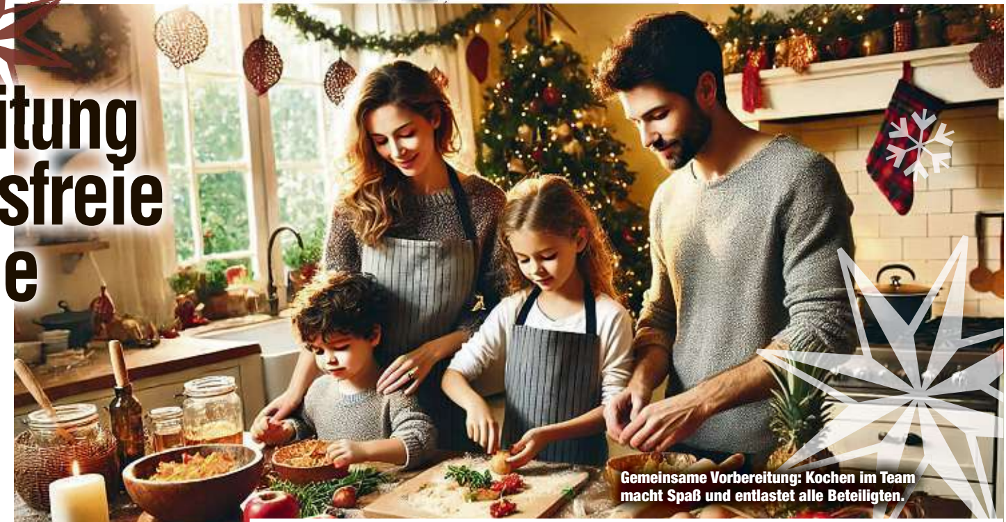
Gemeinsame Vorbereitung: Kochen im Team macht Spaß und entlastet alle Beteiligten.