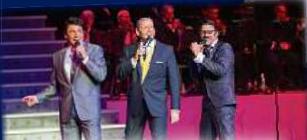
Bei „Sinatra & Friends“ geht's mit viel Musik zurück in die glamouröse Ära der 1960er-Jahre.