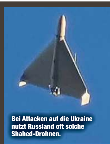
Bei Attacken auf die Ukraine nutzt Russland oft solche Shahed-Drohnen.

Auch die Ukraine griff Ziele im Reich von Wladimir Putin (72) an. Nach Angaben des Verteidigungsministeriums in Moskau hat die russische Luftabwehr in der Nacht 39 Drohnen über sieben Regionen abgewehrt.