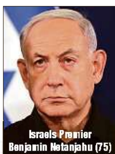
Israels Premier Benjamin Netanjahu (75)

TEL AVIV - Israels Ministerpräsident Benjamin Netanjahu (75) hat eine Waffenruhe mit der libanesischen Hisbollah-Miliz angekündigt. Noch am gestrigen Abend sollte sein Kabinett den Schritt bestätigen. Die Stunden vor der Vereinbarung waren geprägt von den bislang heftigsten Luftangriffen auf Libanons Hauptstadt Beirut.