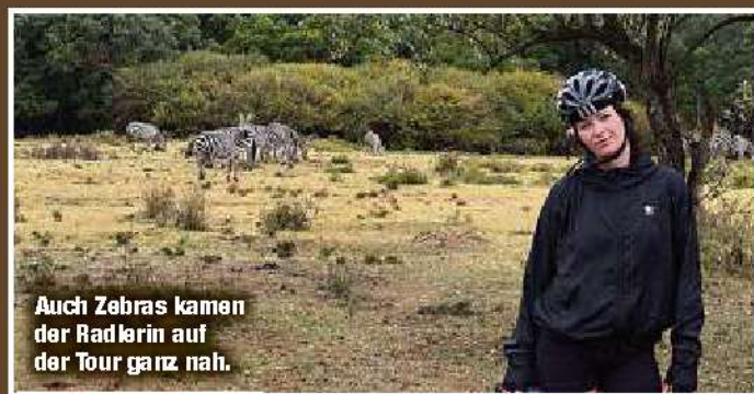
Auch Zebras kamen der Radlerin auf der Tour ganz nah.

„Ich muss tatsächlich gestehen, dass ich die ersten zwei Tage nicht so richtig wusste, ob ich das wirklich schaffe“, so