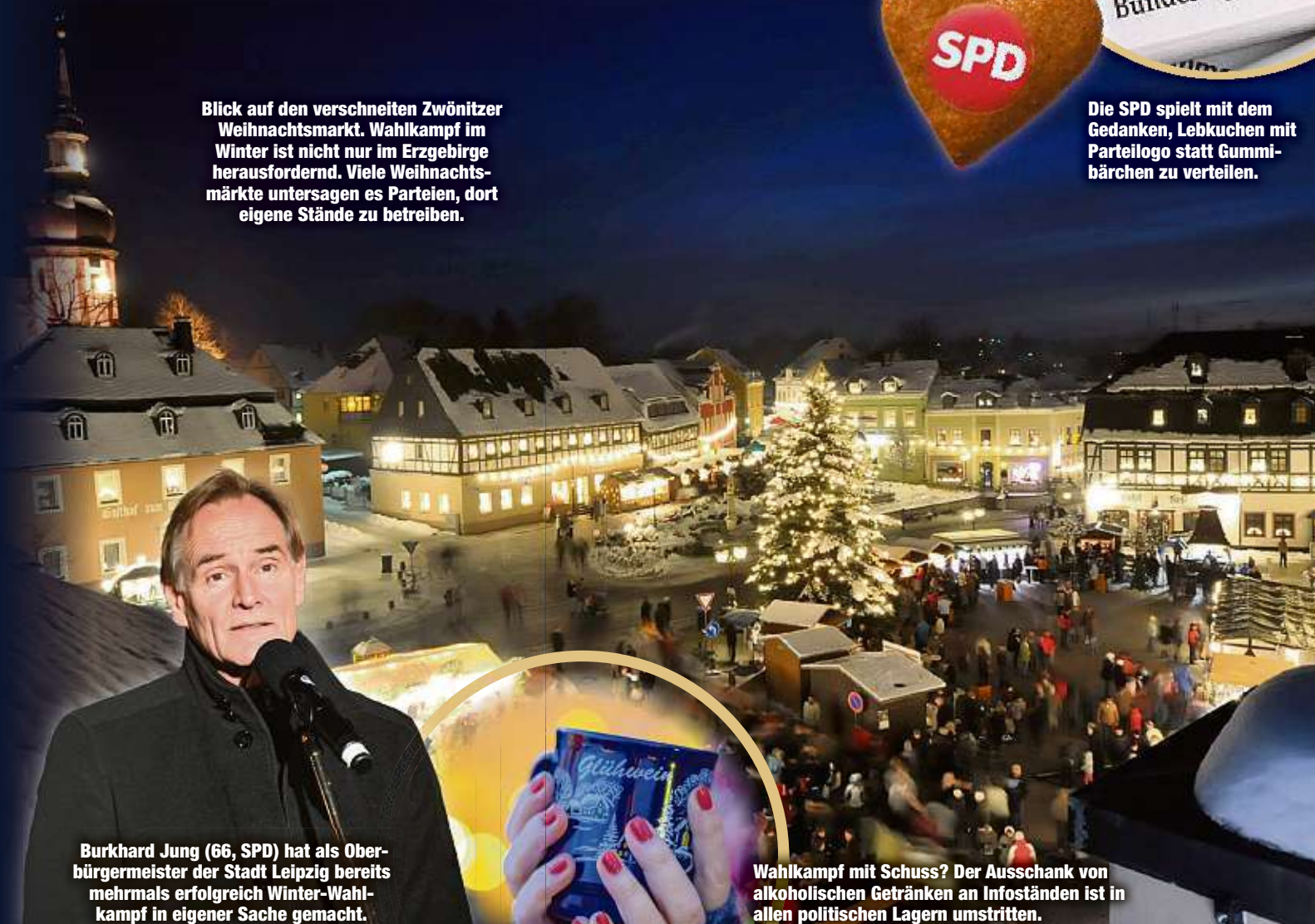
Burkhard Jung (66, SPD) hat als Oberbürgermeister der Stadt Leipzig bereits mehrmals erfolgreich Winter-Wahlkampf in eigener Sache gemacht.

Blick auf den verschneiten Zwönitzer Weihnachtsmarkt. Wahlkampf im Winter ist nicht nur im Erzgebirge herausfordernd. Viele Weihnachtsmärkte untersagen es Parteien, dort eigene Stände zu betreiben.