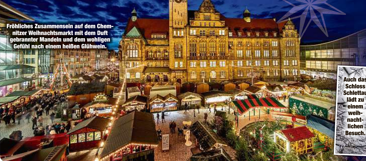
Fröhliches Zusammensein auf dem Chemnitzer Weihnachtsmarkt mit dem Duft gebrannter Mandeln und dem wohligen Gefühl nach einem heißen Glühwein.

Auch das Schloss Schlettau lädt zu einem weihnachtlichen Besuch.