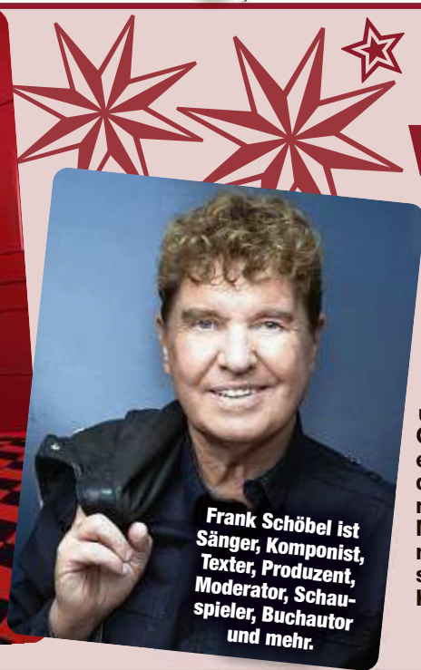
Frank Schöbel ist Sänger, Komponist, Texter, Produzent, Moderator, Schauspieler, Buchautor und mehr.