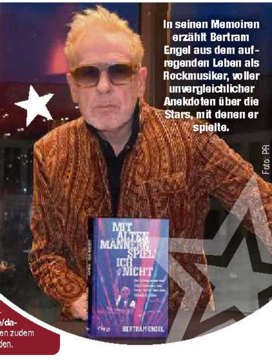
In seinen Memoiren erzählt Bertram Engel aus dem aufregenden Leben als Rockmusiker, voller unvergleichlicher Anekdoten über die Stars, mit denen er spielte.

schrift und Ihre Telefonnummer an. Die Gewinner werden benachrichtigt. Viel Glück! sale