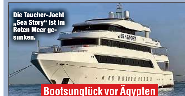
Die Taucher-Jacht „Sea Story“ ist im Roten Meer gesunken.