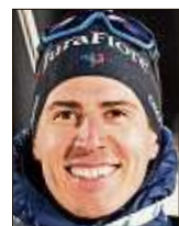
Quentin Fillon Maillet

Der Weltverband IBU erhofft sich durch die Maßnahme hingegen mehr Spannung, vor allem für Millionen Fernsehzuschauer. Die Idee: Wenn die Top-Athleten erst später im Wettbewerb starten, bleiben die TV-Fans länger beim Rennen dabei, um ihre Lieblinge zu sehen. Mehr TV-Zeit bringt wohl bessere Vermark-