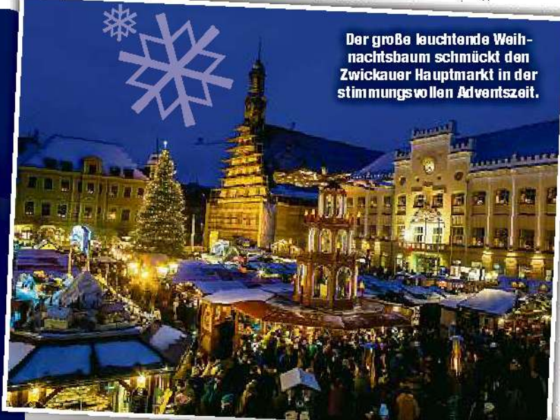
Der große leuchtende Weihnachtsbaum schmückt den Zwickauer Hauptmarkt in der stimmungsvollen Adventszeit.