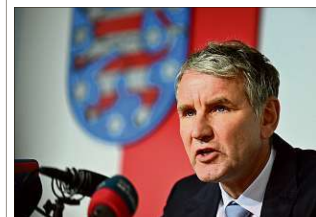
AFD-Landes-Chief Björn Höcke (52) bleibt in Thüringen.