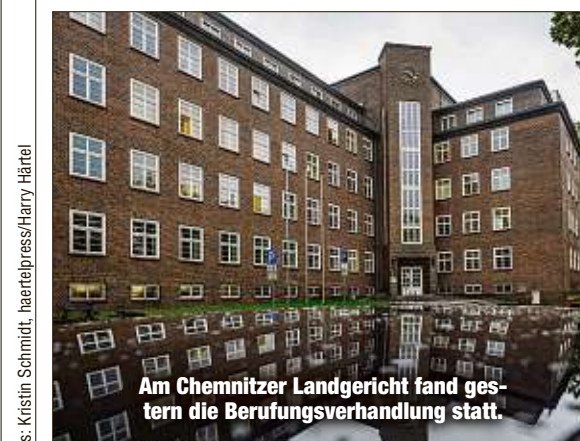
Am Chemnitzer Landgericht fand gestern die Berufungsverhandlung statt.