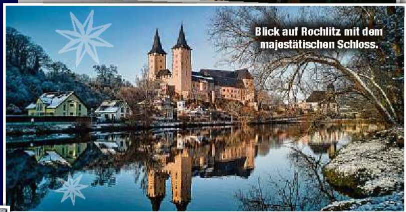
Blick auf Rochlitz mit dem majestätischen Schloss.