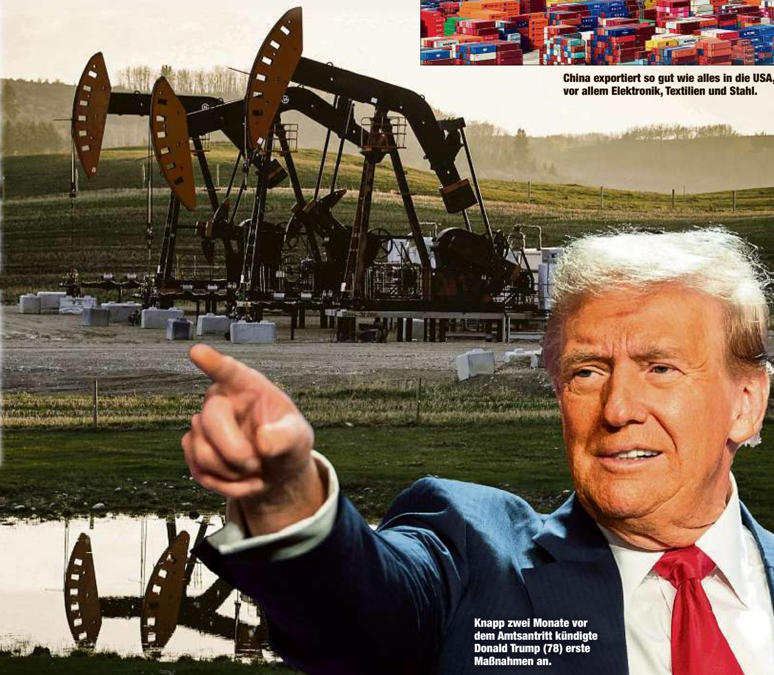
Knapp zwei Monate vor dem Amtsantritt kündigte Donald Trump (78) erste Maßnahmen an.