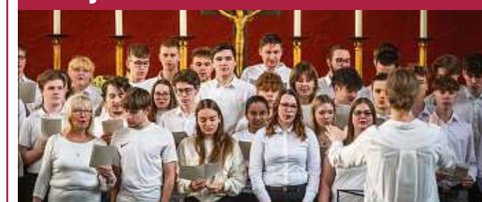
Schüler des BSZ für Wirtschaft II nahmen gestern das Lied in der Kreuzkirche auf dem Kaßberg auf.