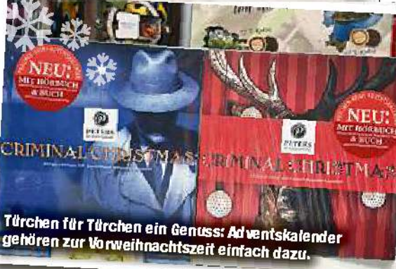
Türchen für Türchen ein Genuss: Adventskalender gehören zur Vorweihnachtszeit einfach dazu.

Wer bei ihr einkauft, findet neben den Adventska-