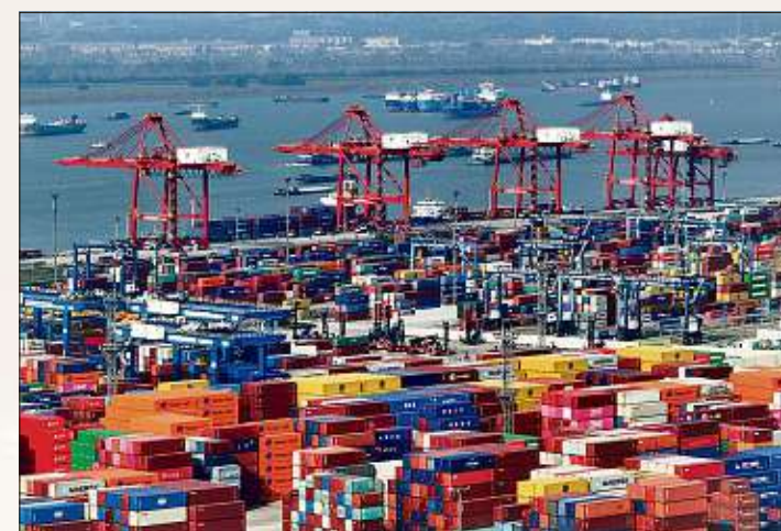
China exportiert so gut wie alles in die USA, vor allem Elektronik, Textilien und Stahl.

Kanadas wichtigstes Exportprodukt in die USA ist Erdöl. Die Zölle darauf dürften für US-Verbraucher an der Tankstelle spürbar sein.