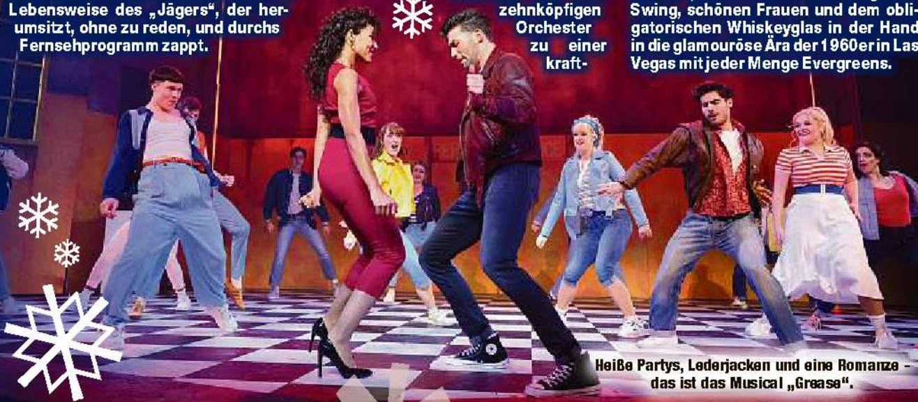
Heiße Partys, Lederjacken und eine Romanze - das ist das Musical „Grease“.

Teilnahmeberechtigt sind nur Personen über 18 Jahre. Der Rechtsweg ist ausgeschlossen. Bitte nehmen Sie unsere Hinweise zum Datenschutz unter www.abo-mopo.de/datenschutz zur Kenntnis, die wir Ihnen zudem jederzeit auf Wunsch per Post zusenden.