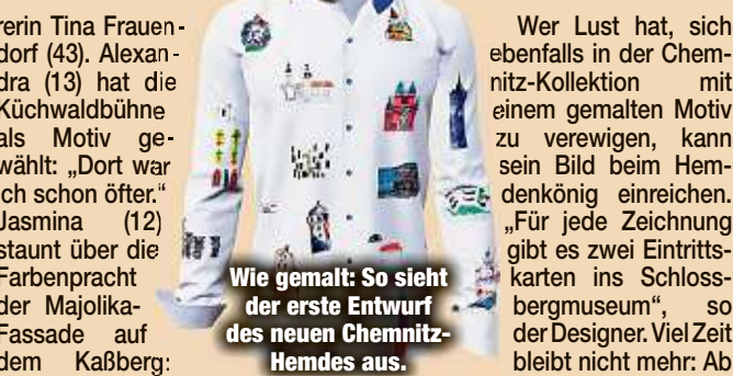
Wie gemalt: So sieht der erste Entwurf des neuen Chemnitz-Hemdes aus.