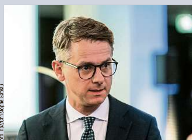
CDU-Generalsekretär Carsten Linnemann (47)

In den Stunden zuvor flog Israels Luftwaffe besonders schwere Angriffe auf Ziele im Herzen der Hauptstadt sowie in Vororten. Auch die Hisbollah-Miliz feuerte vom Libanon aus weiter Raketen auf Israel. Premier Netanjahu sagte in seiner Ansprache dazu lediglich: „In Beirut bebte die Erde.“