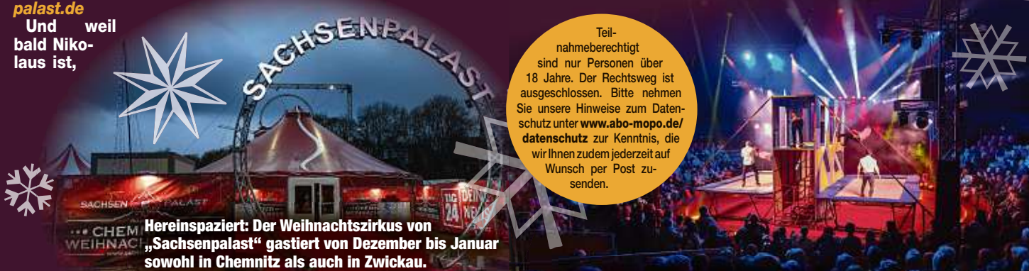
Hereinspaziert: Der Weihnachtszirkus von „Sachsenpalast“ gastiert von Dezember bis Januar sowohl in Chemnitz als auch in Zwickau.

Teilnahmeberechtigt sind nur Personen über 18 Jahre. Der Rechtsweg ist ausgeschlossen. Bitte nehmen Sie unsere Hinweise zum Datenschutz unter www.abo-mopo.de/datenschutz zur Kenntnis, die wir Ihnen zudem jederzeit auf Wunsch per Post zusenden.