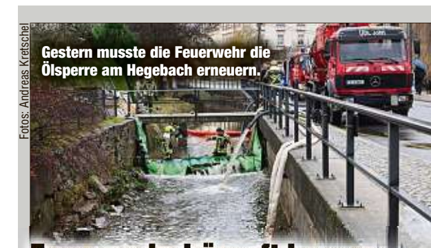
Gestern musste die Feuerwehr die Ölsperre am Hegebach erneuern.