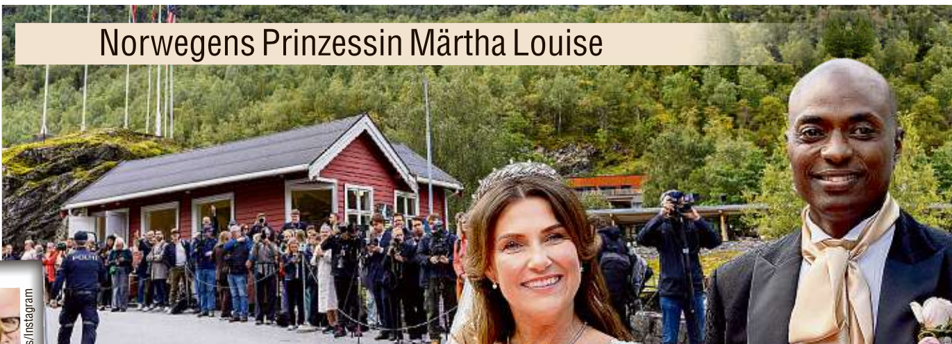
Die Feier am norwegischen Geirangerfjord war kostspielig und glamourös, zog Dutzende Schaulustige an.