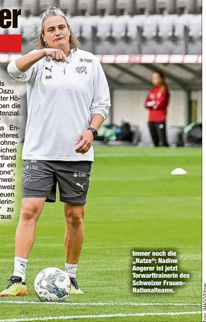
Immer noch die „Nätze“: Nadine Angerer ist jetzt Torwarttrainerin des Schweizer Frauen-Nationalteams.