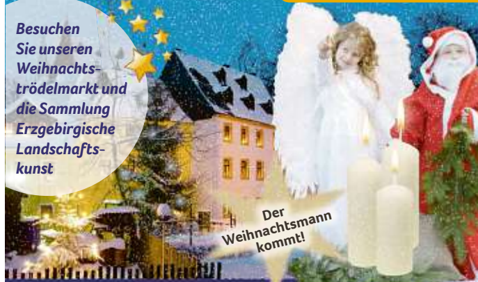
Der Weihnachtsmann kommt!

Besuchen Sie unseren Weihnachts-trödelmarkt und die Sammlung Erzgebirgische Landschaftskunst