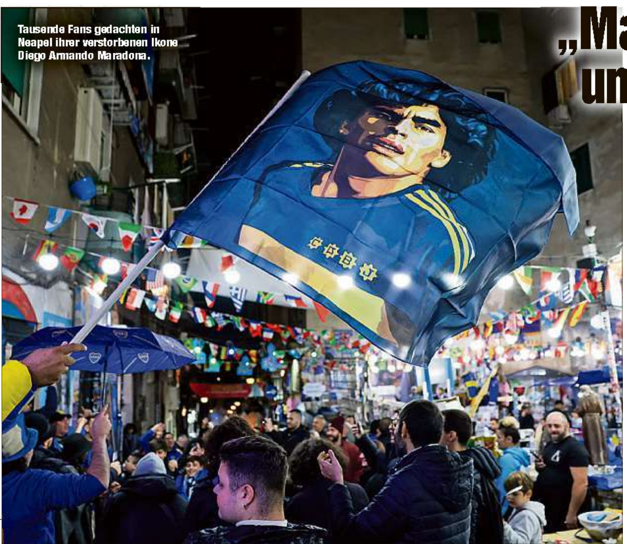
Tausende Fans gedachten in Neapel ihrer verstorbenen Ikone Diego Armando Maradona.