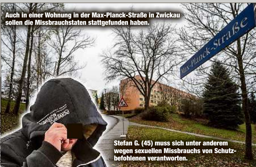
Auch in einer Wohnung in der Max-Planck-Straße in Zwickau sollen die Missbrauchstaten stattgefunden haben.