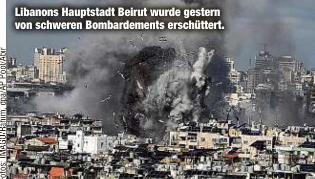
Libanons Hauptstadt Beirut wurde gestern von schweren Bombardements erschüttert.