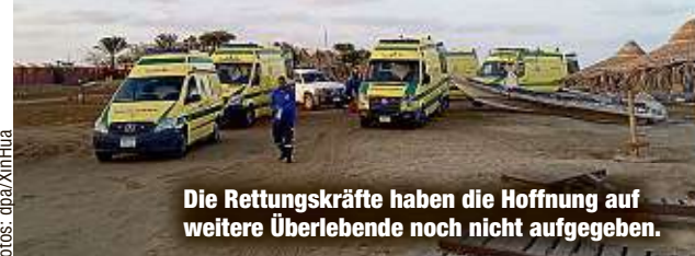
Die Rettungskräfte haben die Hoffnung auf weitere Überlebende noch nicht aufgegeben.

Nach einer mehr als eintägigen Suche unter anderem mit Hubschraubern und einer Fregatte des ägyptischen Militärs wurden laut Hanafi gestern neun Menschen vermisst. Die „Sea Story“ war etwa 80 Kilometer vor der Küste nahe Marsa Alam bei starkem Wellengang gekentert und dann gesunken.