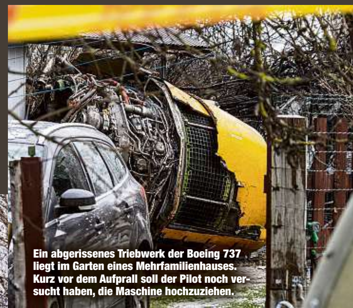
Ein abgerissenes Triebwerk der Boeing 737 liegt im Garten eines Mehrfamilienhauses. Kurz vor dem Aufprall soll der Pilot noch versucht haben, die Maschine hochzuziehen.

Nach dem Absturz eines in Leipzig gestarteten Frachtflugzeugs in Litauen haben die Ermittler gestern den Flugdatenschreiber (FDR) und den Cockpit Voice Recorder (CVR) aus den Trümmern geborgen. Anhand der dort gesicherten Daten erhoffen sich die Ermittler eine baldige Aufklärung der Unfallursache.