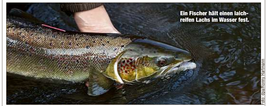
Ein Fischer hält einen laichreifen Lachs im Wasser fest.