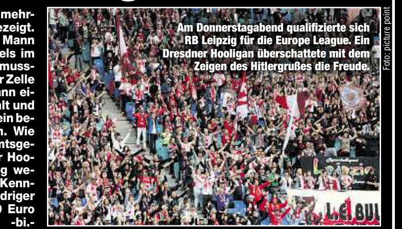
Am Donnerstagabend qualifizierte sich RB Leipzig für die Europa League. Ein Dresdner Hooligan überschattete mit dem Zeigen des Hitlergrußes die Freude.

Der aus dem Dynamo-Spektrum stammende und seit langem in der „Gewalttäter Sport“ registrierte 29-Jährige war in der zweiten Halbzeit auf einen Zaun geklettert und hatte mehrfach den Hitlergruß gezeigt. Polizisten nahmen den Mann noch während des Spiels im Stadion fest. Die Nacht musste der Betrunkene in der Zelle verbringen. Gestern dann einigten sich Staatsanwalt und Ermittlungsrichter auf ein beschleunigtes Verfahren. Wie die Morgenpost vom Amtsgericht erfuhr, wurde der Hooligan bereits am Mittag wegen Verwendens von Kennzeichen verfassungswidriger Organisationen zu 780 Euro Strafe verurteilt. -bi-