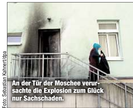
An der Tür der Moschee verursachte die Explosion zum Glück nur Sachschaden.

So habe der Täter weitermachen wollen. Fahnder fanden in dessen Wohnung weitere Sprengsätze. „Die Materialien dafür bestellten Sie nach den Taten an Moschee und ICC.“ Das Urteil ist noch nicht rechtskräftig. Die Verteidiger von Nino K. kündigten an, in Revision zu gehen. sts