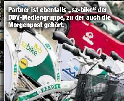
Partner ist ebenfalls „sz-bike“ der DDV-Mediengruppe, zu der auch die Morgenpost gehört.

Beginnen wird die Zukunft der Dresdner Mobilität mit der Eröffnung des ersten Mobilitätspunktes am Pirnaischen Platz am 21. September. Im nächsten Jahr folgen Bahnhof Mitte, Wasaplatz, Fetscherplatz, Altpieschen und der P+R Parkplatz in Prohlis. Bis 2022 sollen 28 Standorte fertig sein, bis 2024 möglichst viele der insgesamt geplanten 76 Mobilitätspunkte.