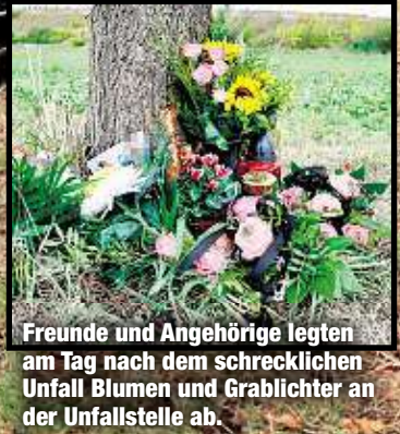
Freunde und Angehörige legten am Tag nach dem schrecklichen Unfall Blumen und Grablichter an der Unfallstelle ab.