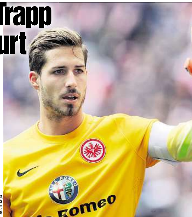
Hallo, ich bin zurück! Kevin Trapp trägt wieder das Eintracht-Trikot.

Trainer Thomas Tuchel zuletzt nur dritte Wahl war. „Es ist uns gelungen, eine Ikone nach Frankfurt zurückzuholen. Ich freue mich, dass er da ist, dass er uns zusätzlich Sicherheit gibt“, so Coach Adi Hütter.