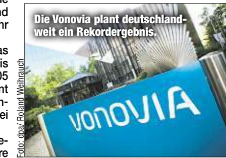
Die Vonovia plant deutschlandweit ein Rekordergebnis.