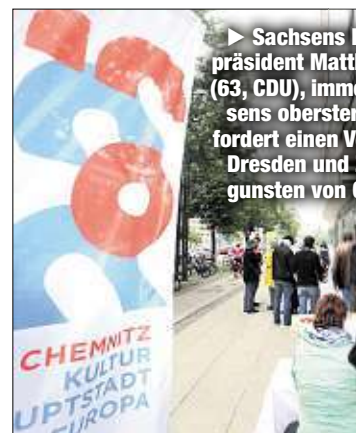
Auch Chemnitz will Kulturhauptstadt werden. Um das zu befördern, gab es im Mai ein Picknick an der Brückenstraße.

Momentan kämpfen neben Dresden auch Chemnitz und Zittau um den Titel Kulturhauptstadt Europa 2025. Doch vor dem Hintergrund der Krawalle in Chemnitz spricht sich Sachsens Landtagspräsident Matthias Röbber (63, CDU) jetzt dafür aus, nur noch Chemnitz zu unterstützen. So solle das angeschlagene Image der Stadt verbessert werden. Doch das kommt in Dresden gar nicht gut an. „Am Ende wird eine europäische Jury darüber entscheiden, welches Konzept überzeugt. Erfahrungsgemäß spielt es für diese Entscheidung keine