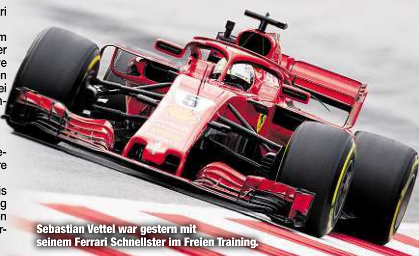
Sebastian Vettel war gestern mit seinem Ferrari Schnellster im Freien Training.

posten. Ericssons Sauber wurde schwer beschädigt, er selbst konnte aber ohne größere Verletzungen aus dem Cockpit klettern. Perfekt! Auch 2019 findet der Große Preis von Deutschland auf dem Hockenheimring statt. Termin ist der 28. Juli. Darauf einigten sich die Streckenbetreiber mit dem Formel-1-Eigner Liberty Media.