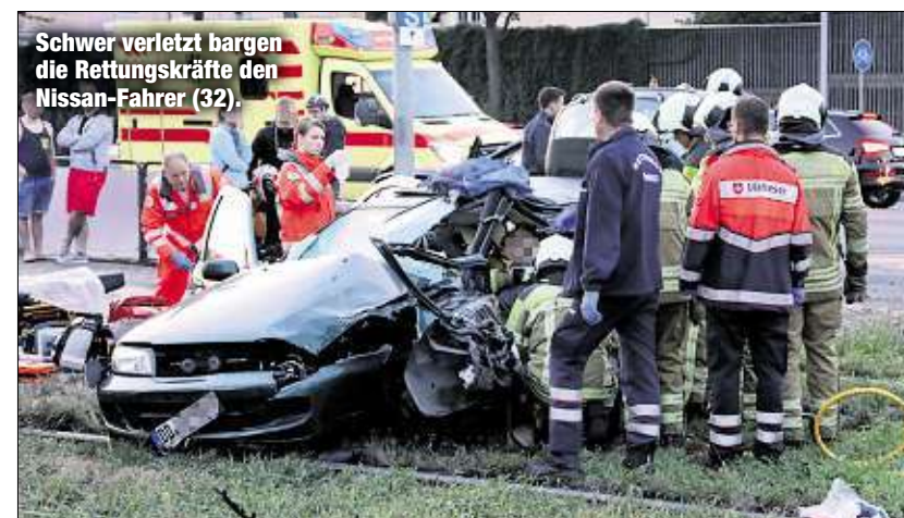
Schwer verletzt bargen die Rettungskräfte den Nissan-Fahrer (32).