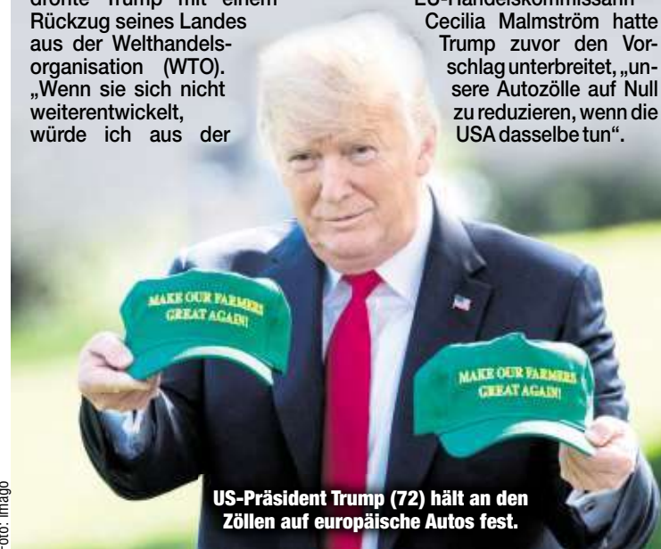
US-Präsident Trump (72) hält an den Zöllen auf europäische Autos fest.

EU-Handelskommissarin Cecilia Malmström hatte Trump zuvor den Vorschlag unterbreitet, „unsere Autozölle auf Null zu reduzieren, wenn die USA dasselbe tun“.