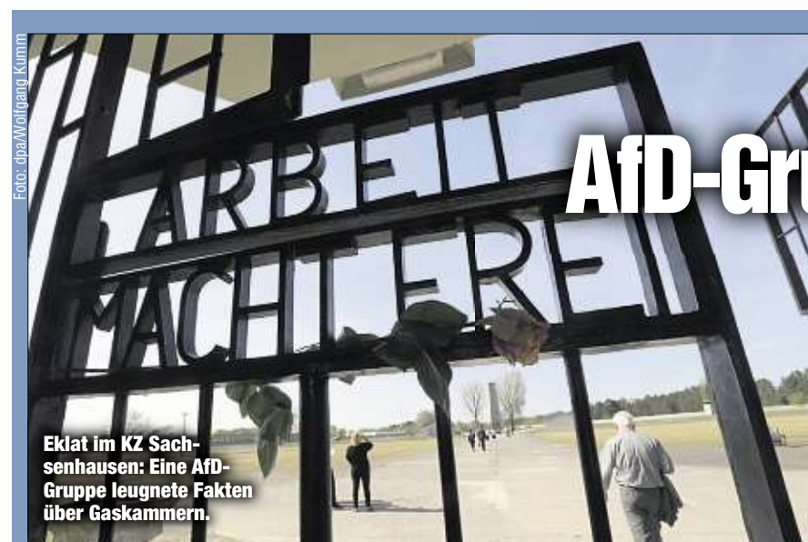
Eklat im KZ Sachsenhausen: Eine AfD-Gruppe leugnete Fakten über Gaskammern.

Der Finanzexperte Brinkhaus hatte der Funke Mediengruppe zuvor erklärt: „Ja, es ist richtig: Ich habe für die anstehende Wahl des Vorsitzenden der CDU/CSU-Bundestagsfraktion mein Interesse angemeldet. Das sollte in einer Demokratie kein ungewöhnlicher Vorgang sein.“ Mehrere CDU-Politiker um den Bundestagsabgeordneten Brinkhaus fordern eine Ablösung Kauders.