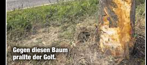
Gegen diesen Baum prallte der Golf.

de erst eine Lehre begonnen hatte. Wieso Lea die Kontrolle über das Fahrzeug verlor, steht noch nicht fest. „Wir ermitteln zur Unfallursache und werden dabei auch prüfen, ob unangepasste Geschwindigkeit eine Rolle gespielt hat“, sagt Sprecher Laske. Nach MOPO-Informationen hatte Lea bereits mit 17 Jahren den Führerschein erworben. tyx