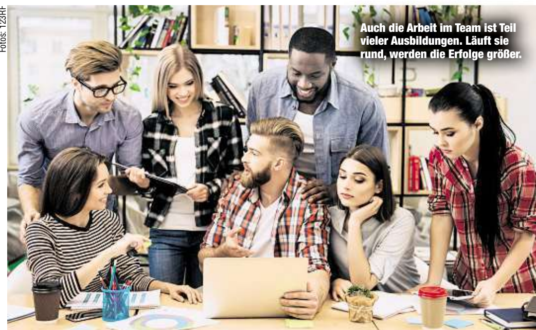
Auch die Arbeit im Team ist Teil vieler Ausbildungen. Lläuft sie rund, werden die Erfolge größer.