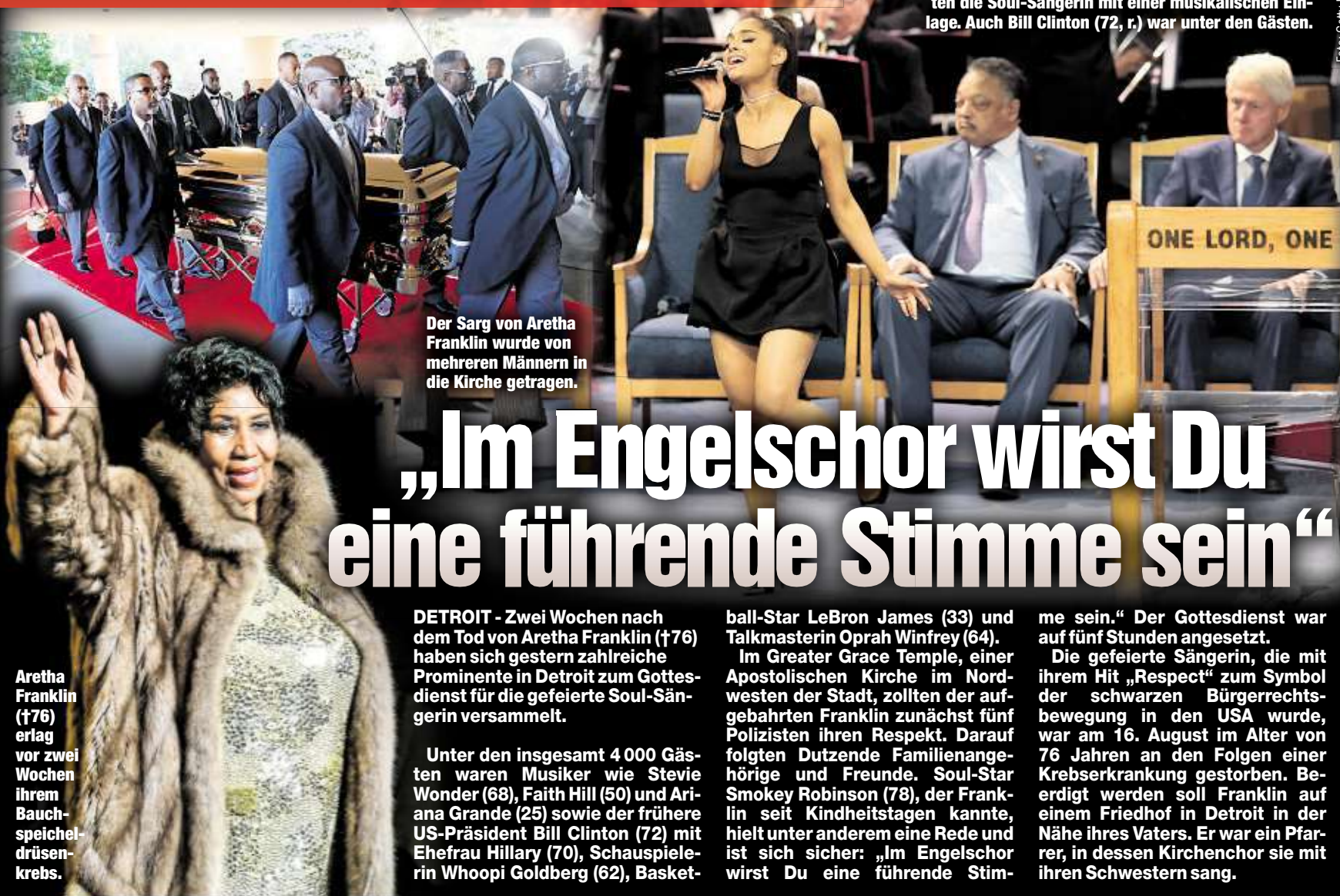
Zahlreiche Stars, darunter Ariane Grande (25), ehrten die Soul-Sängerin mit einer musikalischen Einlage. Auch Bill Clinton (72, r.) war unter den Gästen.