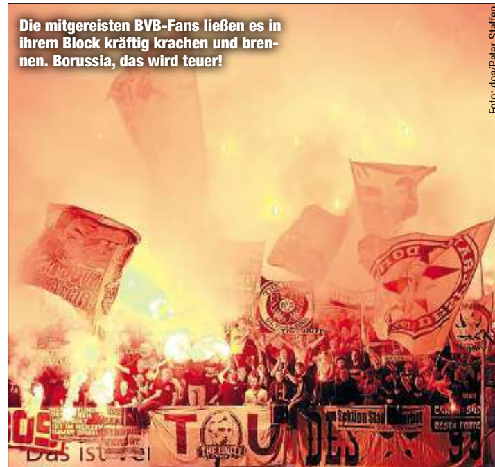
Die mitgereisten BVB-Fans ließen es in ihrem Block kräftig krachen und brennen. Borussia, das wird teuer!