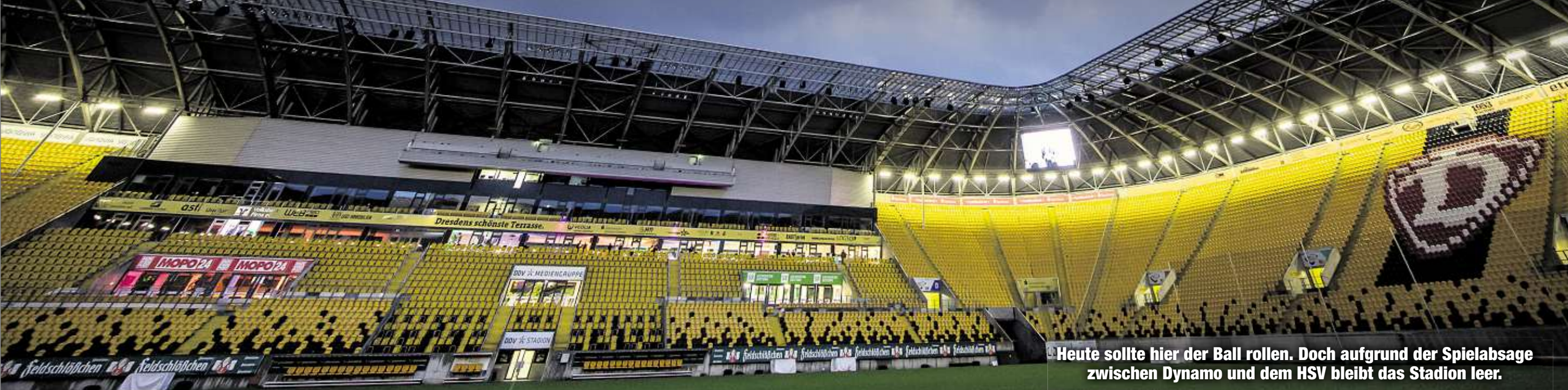
Heute sollte hier der Ball rollen. Doch aufgrund der Spielabsage zwischen Dynamo und dem HSV bleibt das Stadion leer.