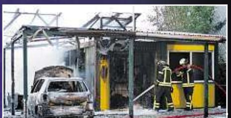
Die Flammen sind gelöscht, doch Werkstatt und Büro des Autohandels sind abgebrannt. Auch ein VW Polo erlitt Totalschaden.

Bei einem Großbrand ist gestern in Leipzig ein Autohandel zerstört worden. Kurz nach 5 Uhr schossen plötzlich Flammen aus dem Werkstattbereich des ANAS-Gebrauchtwagenhandels an der Ludwig-Hupfeld-Straße. Kurz darauf brannten auch der Bürocontainer, ein Carport und ein Fahrzeug lichterloh. Die Feuerwehr rückte schnell an und konnte die Flammen binnen einer Stunde löschen. Doch die Schadensbilanz ist verheerend: Büro und Werkstatt brannten komplett aus, ebenso ein Auto. Acht weitere Fahrzeuge wurden durch das Feuer schwer beschädigt. Brandursachenermittler der Leipziger Kriminalpolizei nahmen im Laufe des Tages ihre Arbeit auf. „Brandstiftung kann nicht ausgeschlossen werden“, sagte Polizei-Sprecherin Maria Braunsdorf. -bi-