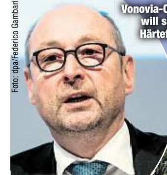
Vonovia-Chef Rolf Buch (53) will sich stärker um Härtefälle kümmern.