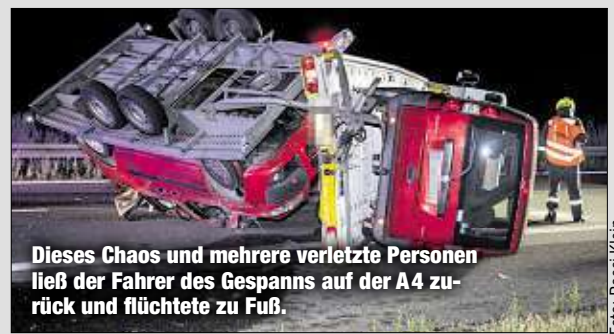
Dieses Chaos und mehrere verletzte Personen ließ der Fahrer des Gespanns auf der A4 zurück und flüchtete zu Fuß.

Dubioser Unfall auf der Autobahn 4 zwischen Uhyast am Taucher und Salzenforst! Der Fahrer eines Fiat Ducato mit Anhänger (beladen mit zwei Fiat Diablo) war Richtung Görlitz unterwegs. Er geriet ins Schleudern, kippte nach links um. „Ein gerade überholender Nissan Note eines 28-Jährigen wurde dabei seitlich getroffen und verunfallte“, so ein Polizeisprecher. Dabei verletztten sich die Beifahrerin (28) und zwei Kleinkinder (1, 3) schwer. Sie kamen in eine Klinik. Der mutmaßliche Unfallverursacher floh zu Fuß von der Unfallstelle. Hubschrauber (mit Wärmebildkamera) und Fährtenhunde suchten ihn vergeblich. Der Sachschaden lag bei mehreren zehntausend Euro. Die Autobahn war viele Stunden gesperrt. tyx