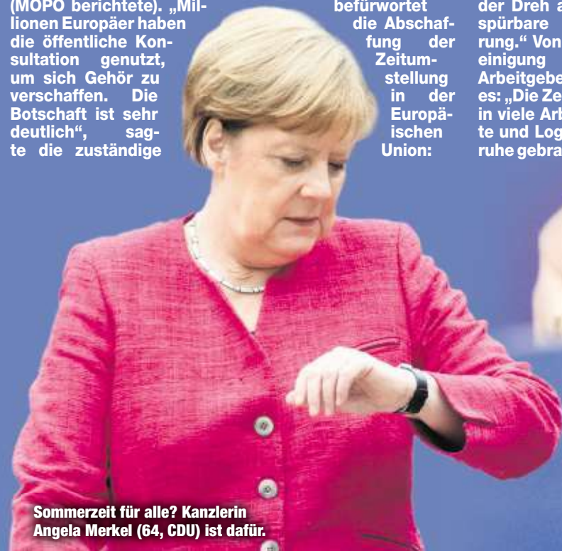
Sommerzeit für alle? Kanzlerin Angela Merkel (64, CDU) ist dafür.