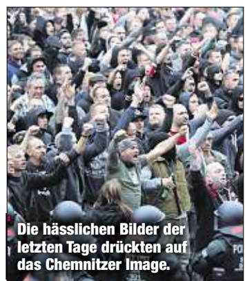
Die hässlichen Bilder der letzten Tage drückten auf das Chemnitzer Image.

Momentan kämpfen neben Dresden auch Chemnitz und Zittau um den Titel Kulturhauptstadt Europa 2025. Doch vor dem Hintergrund der Krawalle in Chemnitz spricht sich Sachsens Landtagspräsident Matthias Röbber (63, CDU) jetzt dafür aus, nur noch Chemnitz zu unterstützen. So solle das angeschlagene Image der Stadt verbessert werden. Doch das kommt in Dresden gar nicht gut an. „Am Ende wird eine europäische Jury darüber entscheiden, welches Konzept überzeugt. Erfahrungsgemäß spielt es für diese Entscheidung keine