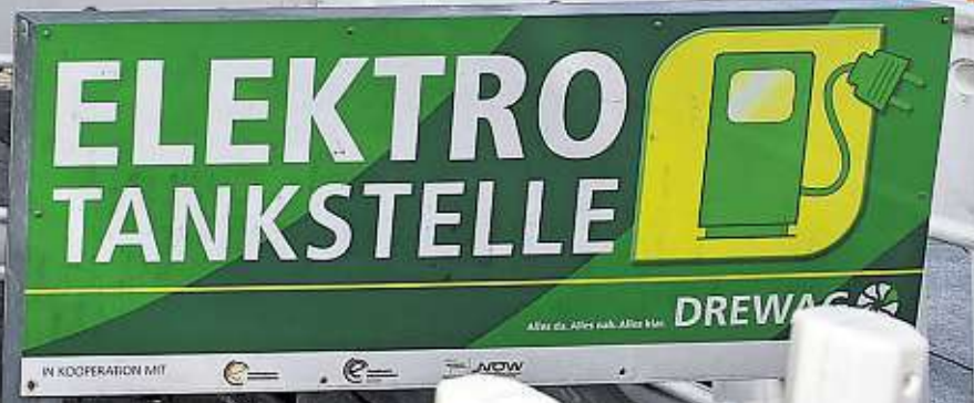
IN KOOPERATION MIT DREWAG