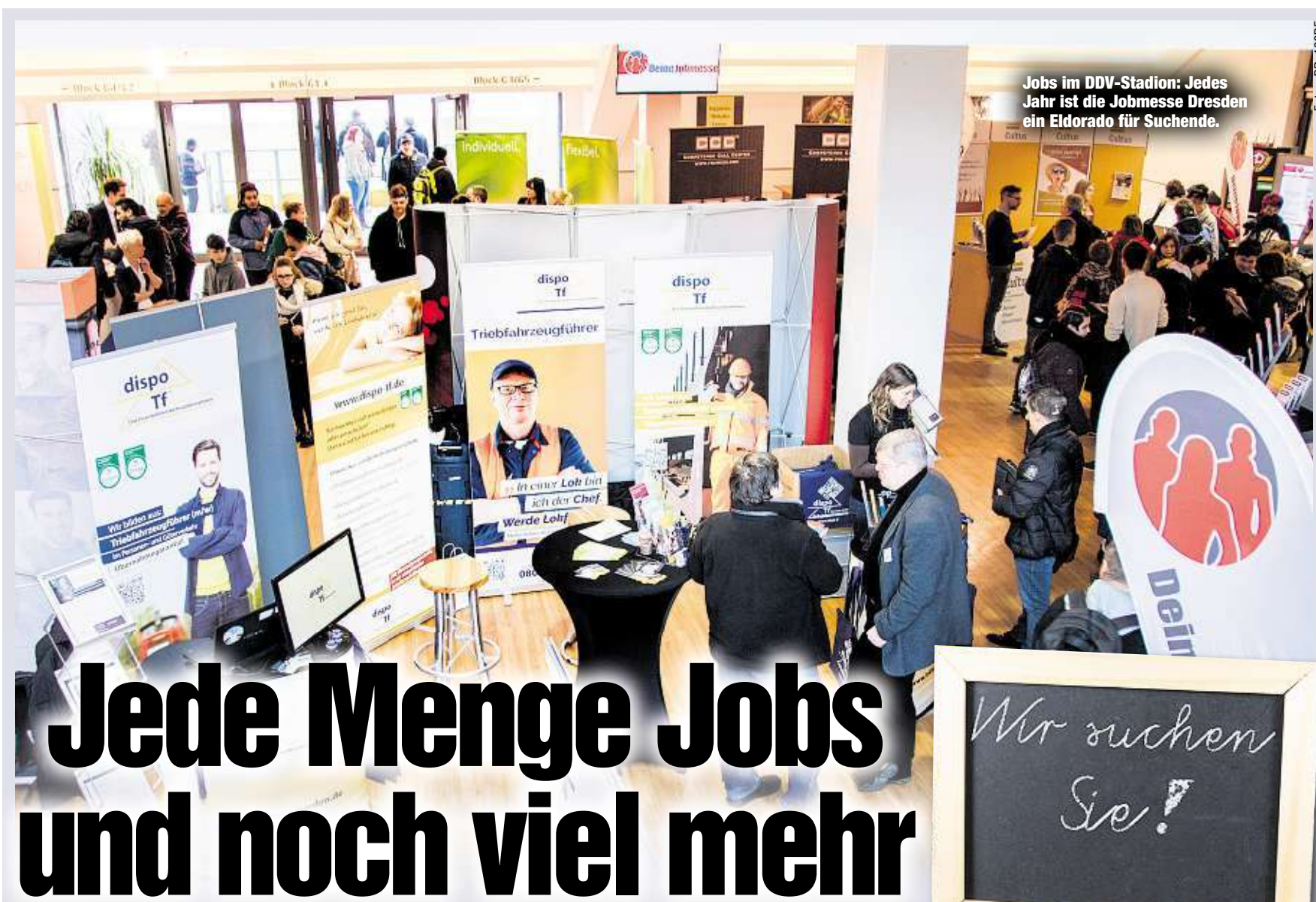
Jobs im DDV-Stadion: Jedes Jahr ist die Jobmesse Dresden ein Eldorado für Suchende.