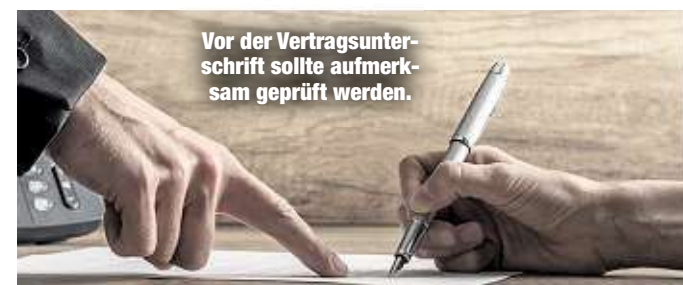
Vor der Vertragsunterschrift sollte aufmerksam geprüft werden.