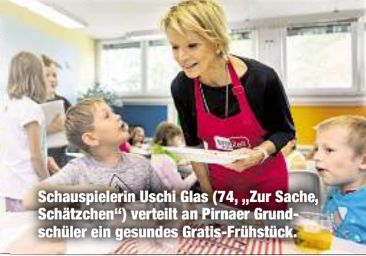
Schauspielerin Uschi Glas (74, „Zur Sache, Schätzchen“) verteilt an Pirnaer Grundschulern ein gesundes Gratis-Frühstück.

Vor zehn Jahren rief Uschi Glas den Verein „brotZeit“ ins Leben. Er spendiert Kindern aus sozial benachteiligten Familien ein kostenloses Schul-Frühstück. Ab sofort muss auch in Pirna kein Schüler mehr mit knurrendem Magen lernen. Sie dürfen sich an einem Buffet mit Milch, Müsli, Obst, Brot, Wurst, Käse, Marmelade und Joghurt stärken. Pirnaer Seniorinnen betreuen das Frühstück. KK