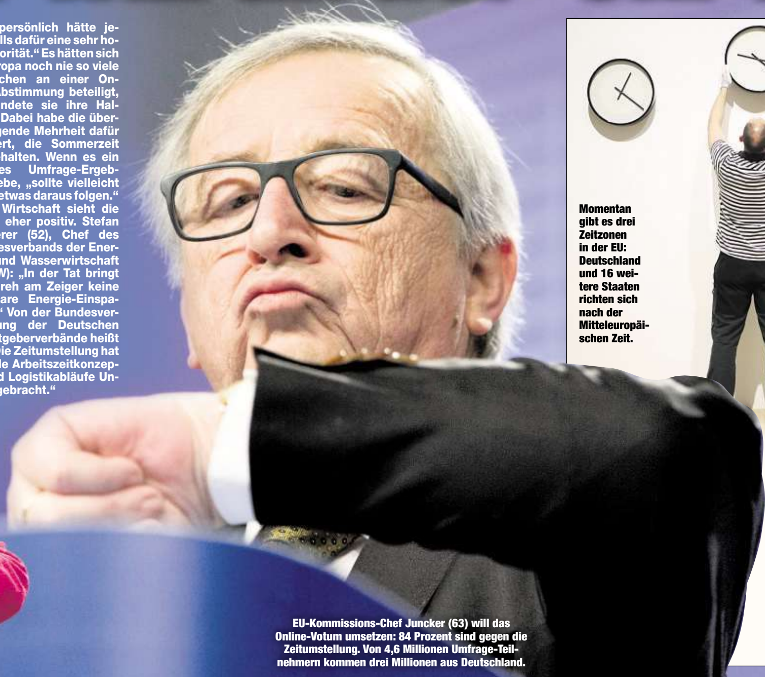
EU-Kommissions-Chef Juncker (63) will das Online-Votum umsetzen: 84 Prozent sind gegen die Zeitumstellung. Von 4,6 Millionen Umfrage-Teilnehmern kommen drei Millionen aus Deutschland.