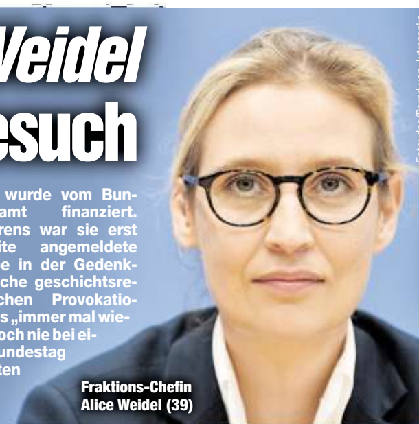
Fraktions-Chefin Alice Weidel (39)