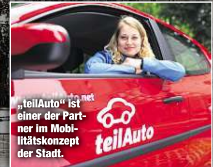
„teilAuto“ ist einer der Partner im Mobilitätskonzept der Stadt.