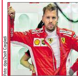
Sebastian Vettel schaute gestern nach dem Training enttäuscht drein.

Nach dem Malheur auf dem Marina Bay Street Circuit musste der Ferrari-Star im gestrigen zweiten Training seinen Wagen mit defekter