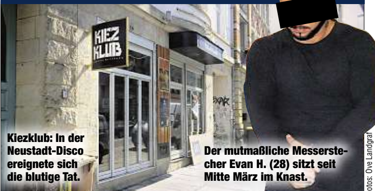
Kiezklub: In der Neustadt-Disco ereignete sich die blutige Tat.