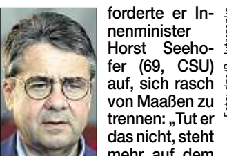
Sigmar Gabriel (59)

Ex-Außenminister Sigmar Gabriel (59, SPD) warnt andernfalls vor einem Bruch der GroKo. Im „Spiegel“-Interview