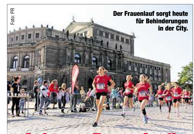
Der Frauenlauf sorgt heute für Behinderungen in der City.

„Wir werden weiterhin geduldet“, so der Steinmetz. Mit einem verschmitzten Lächeln fügt er hinzu: „Dadurch, dass die ganzen Baracken weg sind, ist meine Firma viel besser sichtbar, meine Werbung wird plötzlich erkannt.“ DiHe