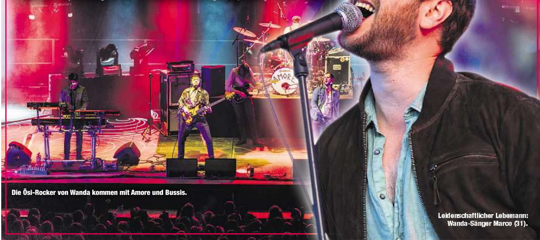
Die Ösi-Rocker von Wanda kommen mit Amore und Bussis.