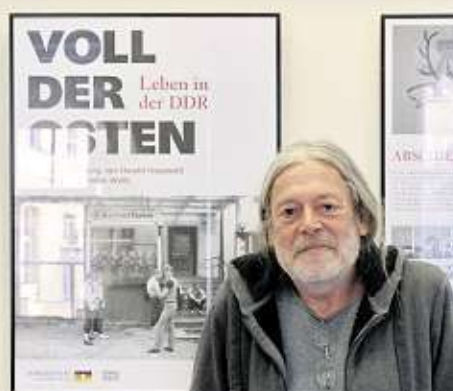
Fotograf und DDR-Chronist Harald Hauswald (64).

„Voll der Osten. Leben in der DDR“ heißt die Schau mit seinen Arbeiten, die Anfang des Jahres erstmals in Berlin ausgestellt wurde. Eine Auswahl der Werke ist ab Montag auch in Hauswalds Radebeuler Heimat zu sehen, im Foyer der Landesbühnen Sachsen. Zur Ausstellungseröffnung um 19 Uhr unterhält sich der Fotograf in einem Podiumsgespräch mit dem Historiker Stefan Wölle, der auch die Begleittexte verfasst hat, sowie Skisprung-Legende Jens Weißflog. Die Schau ist bis zum 25. November zu sehen.