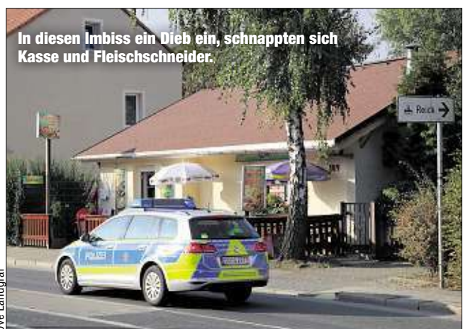
In diesen Imbiss ein Dieb ein, schnappten sich Kasse und Fleischschneider.

ein rattenscharfes elektronisches Schneidemesser sowie die Registrierkasse des Imbisses. Wie viel Bargeld darin steckte, darüber schwieg sich die Polizei aus. Die Schadenshöhe steht angeblich noch nicht fest. Anzeige und Ermittlungen laufen.