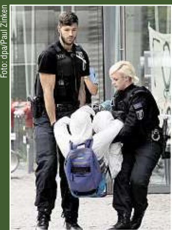
Ein Besetzer der NRW-Landesvertretung wird von Beamten herausgetragen.

schaftsinteressen. Der Energie-Konzern RWE sei eine Gefahr für den Wald und für das Klima weltweit.