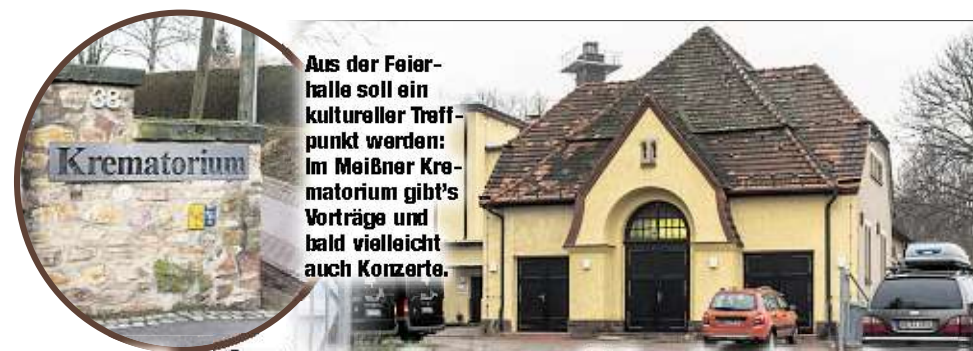
Aus der Feierhalle soll ein kultureller Treffpunkt werden: Im Meißner Krematorium gibt's Vorträge und bald vielleicht auch Konzerte.