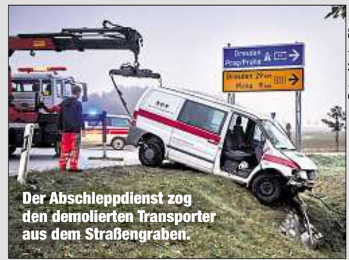
Der Abschleppdienst zog den demolierten Transporter aus dem Straßengraben.

Hatte er den Kreisverkehr einfach übersehen? Ein Mercedes-Fahrer (55) war mit seinem Kleintransporter auf der Bundesstraße 172 zwischen Königstein und Struppen unterwegs. Am Abzweig nach Leupoldshain fuhr er allerdings nicht um die Insel, sondern darüber hinweg. In der