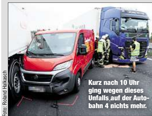
Kurz nach 10 Uhr ging wegen dieses Unfalls auf der Autobahn 4 nichts mehr.

Vier Stunden später krachten gleich vier Fahrzeuge auf der Autobahn 4 kurz hinter der Anschlussstelle Wilsdruff zusammen. Eine BMW-Fahrerin (44) wechselte wegen Staus von der rechten auf die mittlere Spur. Dort war jedoch bereits ein Sattelzug nicht mehr bremsen, fuhr in den Unfall hinein. Dabei schob er den Ducato wieder nach rechts direkt in einen weiteren Laster. Der Ducato-Fahrer (36) wurde leicht verletzt, der Sachschaden ging aber in die Zehntausende. eho