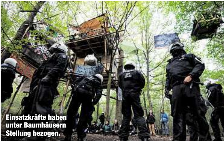
Einsatzkräfte haben unter Baumhäusern Stellung bezogen.