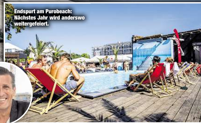
Endspurt am Purobeach: Nächstes Jahr wird anderswo weitergefeiert.