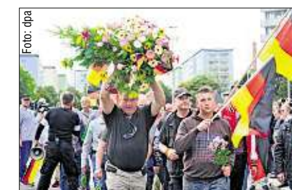
Am „Trauermarsch“ nahmen am 27. August mehr als 6000 Menschen teil.