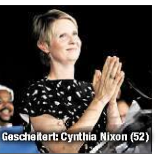
Gescheitert: Cynthia Nixon (52)

hat die Unterstützung großer Geldgeber und Verbände. Er