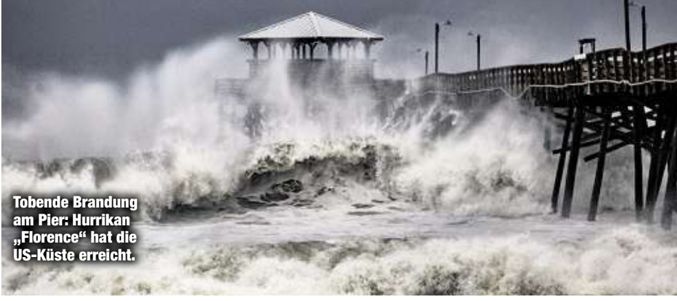
Tobende Brandung am Pier: Hurrikan „Florence“ hat die US-Küste erreicht.

rence“ an der US-Küste wütet, kämpft Südostasien mit einem noch gewaltigeren Sturm. Supertaifun „Mangkhut“, der bislang stärkste in dieser Saison, soll die Philippinen heute erreichen. Allerdings hat die Ostküste der USA eine teurere und besser ausgebaute Infrastruktur als Südostasien, daher werden die Kosten des Schadens in den USA höher sein. Zudem liegen 17 Atomkraftwerke in Florence' Einzugsgebiet.