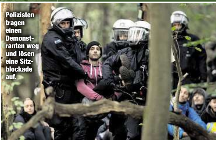
Polizisten tragen einen Demonstranten weg und lösen eine Sitzblockade auf.