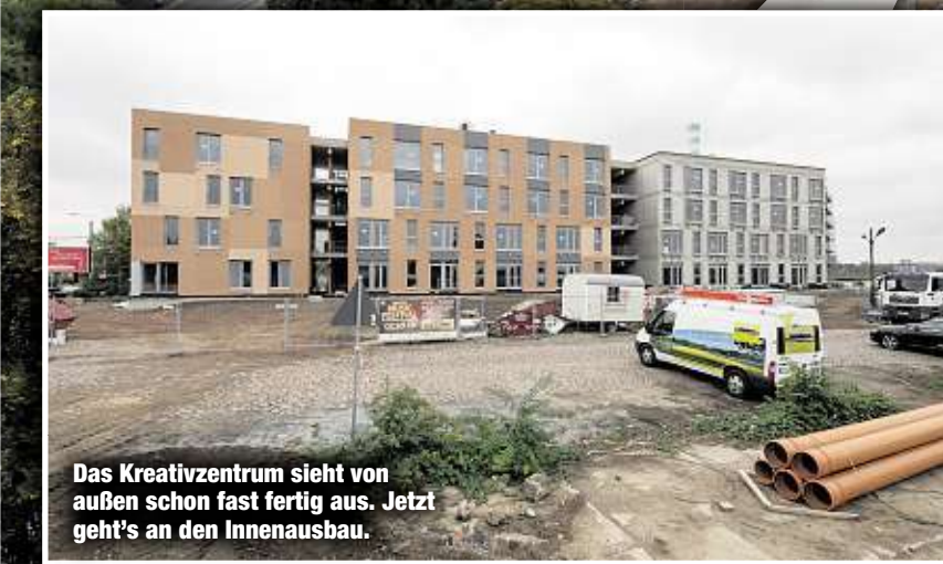
Das Kreativzentrum sieht von außen schon fast fertig aus. Jetzt geht's an den Innenausbau.