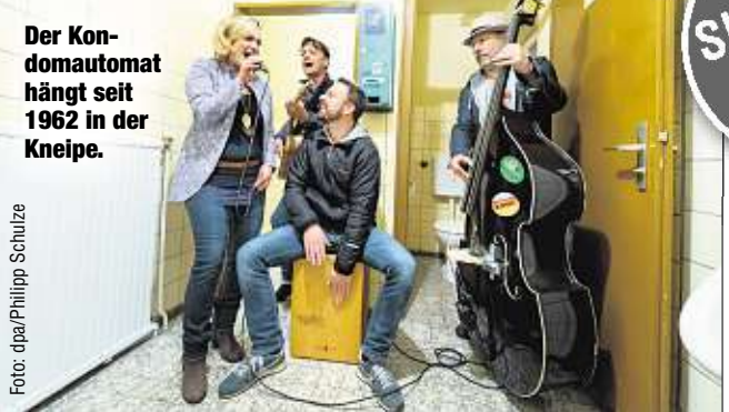
Der Kondomautomat hängt seit 1962 in der Kneipe.

GROSS THONDORF - In Niedersachsen ist in den vergangenen zehn Jahren jede dritte Kneipe verschwunden. Die Gründe sind vielfältig: Stammgäste bleiben aus, veränderte Ausgegessenheiten, Bürokratie. Ein 400-Seelen-Dorf weiß genau, wie es Leben in die Bude bringt. Ganz einfach: Dort wird regelmäßig der Geburtstag des einzigen Kondomautomaten in der Dorfgaststätte „Eichenquelle“ gefeiert - so auch am vergangenen Wochenende. Mit Rockmusik und Poetry Slam ging's auf der Herrentoilette hoch her.