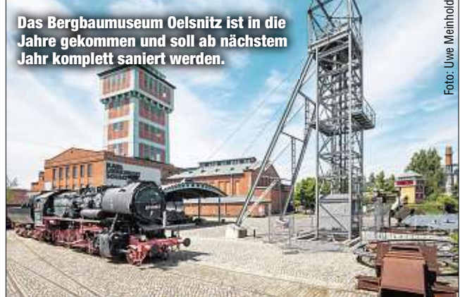
Das Bergbaumuseum Oelsnitz ist in die Jahre gekommen und soll ab nächstem Jahr komplett saniert werden.

(40): „Auch während der notwendigen Schließung bieten wir weiterhin Veranstaltungen an.“ Das Programm ist unter bergbaumuseum-oelsnitz.de zu finden. Der gesamte Umbau wird bis 2023 dauern. „Dann können unsere Besucher den Steinkohlebergbau als spannende Multi-Media-Inszenierung erleben“, so Museums-Chef Färber. Die neue Ausstellung setzt schon bei der Entstehung der Steinkohle an: Ein Highlight wird ein begehrter Steinkohle-Wald. MS