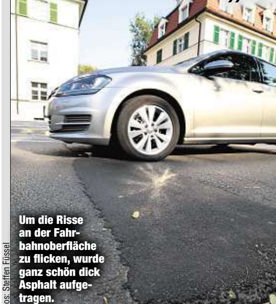
Um die Risse an der Fahrbahnoberfläche zu flicken, wurde ganz schön dick Asphalt aufgetragen.

Huch, wo kommt denn diese Huckelpiste plötzlich her? An der Teplitzer Straße in Strehlen ließ die Stadt gerade erst den Asphalt reparieren. Über das „holprige Ergebnis“ wundern sich jetzt Autofahrer.