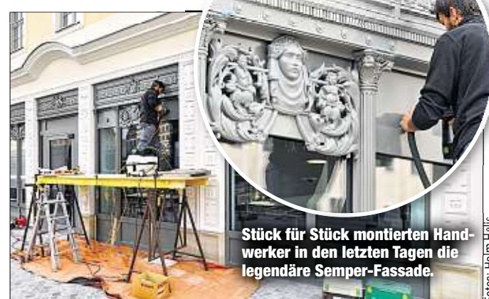
Stück für Stück montierten Handwerker in den letzten Tagen die legendäre Semper-Fassade.