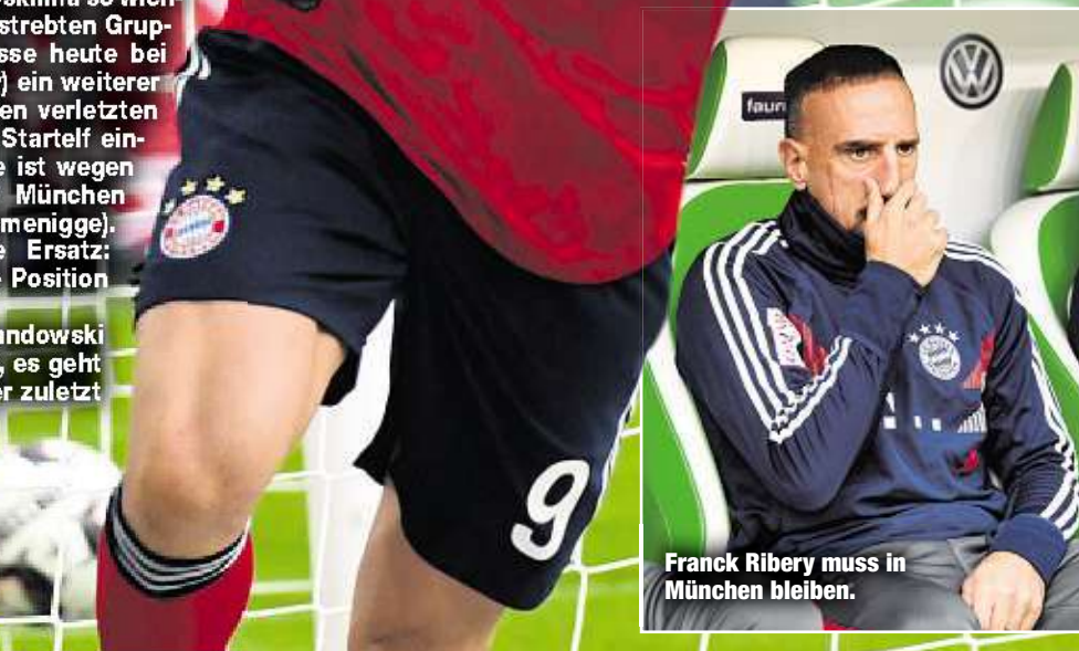
Franck Ribery muss in München bleiben.