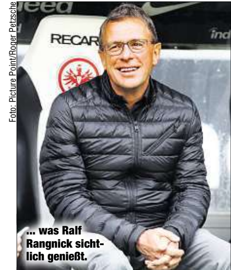
... was Ralf Rangnick sichtlich genießt.