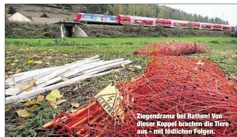
Zieldrama bei Rathen! Von dieser Koppel brachen die Tiere aus - mit tödlichen Folgen.