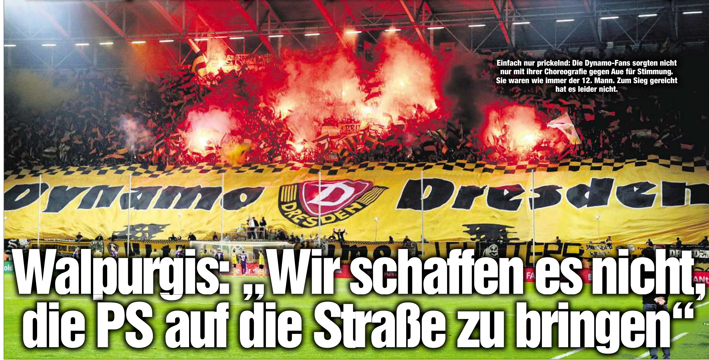
Einfach nur prickelnd: Die Dynamo-Fans sorgten nicht nur mit ihrer Choreografie gegen Aue für Stimmung. Sie waren wie immer der 12. Mann. Zum Sieg gereicht hat es leider nicht.