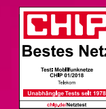
Laut CHIP Mobilfunknetztest, Heft 01/2018

Jetzt vorbestellen: das intelligente HUAWEI Mate20 Pro mit weltweit erster mobiler Dual KI und überragender Akkulaufzeit!