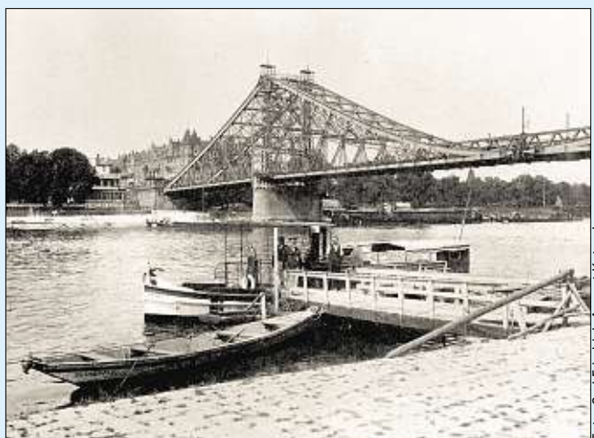
Dieses Foto zeigt Brücke und Fähre um 1890. Das Blaue Wunder wurde 1893 fertig.

Übrigens: Auch bei der vom Stadtrat geforderten Fähre in Pieschen gibt es Neuigkeiten. „Es liegt ein Entwurf vor über mögliche Anlegepunkte der Fähre, den unsere Verkehrsplaner erarbeitet haben. Aktuell ist nun das Umweltamt am Zug. Das Amt schaut sich Auswirkungen auf die Umwelt, schützenswerte Pflanzen und Tiere an.“