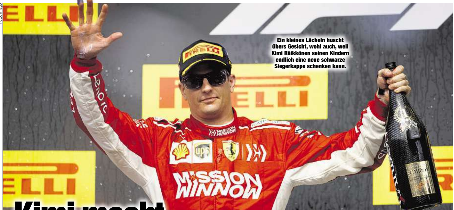
Ein kleines Lächeln huscht übers Gesicht, wohl auch, weil Kimi Räikkönen seinen Kindern endlich eine neue schwarze Siegerkappe schenken kann.