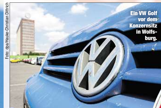
Ein VW Golf vor dem Konzernsitz in Wolfsburg.