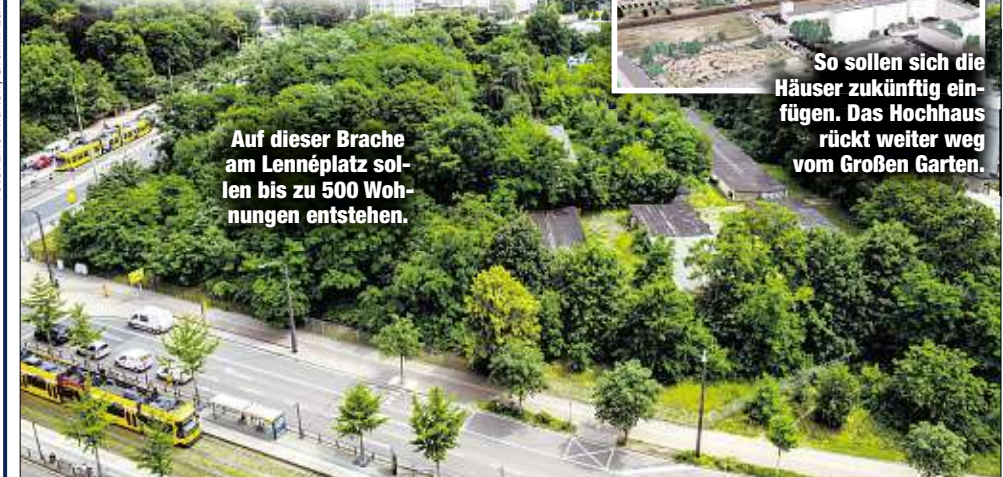
Auf dieser Brache am Lennéplatz sollen bis zu 500 Wohnungen entstehen.