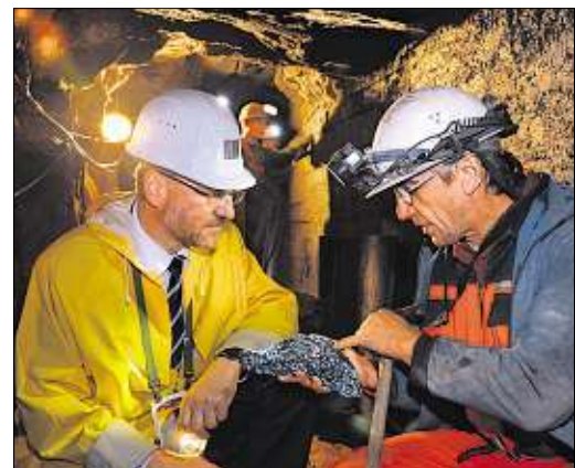
Experten bei Probebohrungen unter Zinnwald: Die Vorräte sind größer als angenommen.

Bacanora-Chef Peter Secker sieht sich bestätigt, dass Zinnwald eines der fortgeschrittensten Lithium-Projekte in Europa sei. Dank der strategisch günstigen Lage im Zentrum der Batterie- und Automobilindustrie könne Zinnwald ein größerer Lieferant für Europas schnell wachsende Elektroauto- und Energiespeicherindustrie werden. „Wir sind sehr daran interessiert, das Projekt umzusetzen“, so Secker. Die endgültige Machbarkeitsstudie soll im 2. Quartal 2019 vorliegen. Dann kann die Entscheidung fallen, ob tatsächlich ein Bergwerk gebaut wird. Zuletzt wurde dem Unternehmen ein weiteres Schürfgelände genehmigt, nämlich 295 Hektar in Falkenhain bei Zinnwald. Zudem bohrt Lithium Australia in Sadisdorf. mor