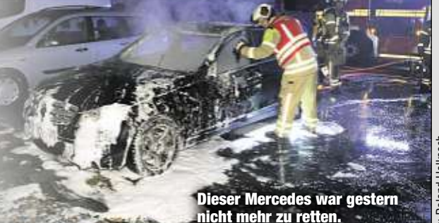
Dieser Mercedes war gestern nicht mehr zu retten.

von dem Wagen nur noch ein dampfendes Wrack übrig. Die Hitze des Brandes war so heftig, dass auch ein daneben abgestellter Ford noch beschädigt wurde. Der Gesamtschaden war gestern allerdings noch nicht beziffert. Die Kriminalpolizei hat die Ermittlungen wegen Brandstiftung aufgenommen. eho