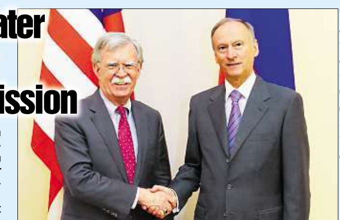
Bolton (69, l.) und Patruschew (67): Der Amerikaner gilt als treibende Kraft hinter Trumps Rückzugsankündigung beim INF-Vertrag.

MOSKAU - Die Welt ist in Angst vor einem neuen nuklearen Wettrüsten: Nach dem angekündigten Ausstieg der USA aus dem wichtigen Atomwaffen-Abbrüstungsabkommen von 1987 (INF-Vertrag) hat US-Sicherheitsberater John Bolton (69) mit seinem russischen Kollegen Nikolai Patruschew (67) in Moskau gesprochen. Bolton legte den Russen die Strategie von US-Präsident Donald Trump (72) dar. Details wurden zunächst nicht bekannt. In dem Abkommen geht