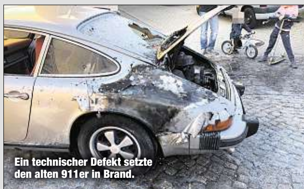
Ein technischer Defekt setzte den alten 911er in Brand.