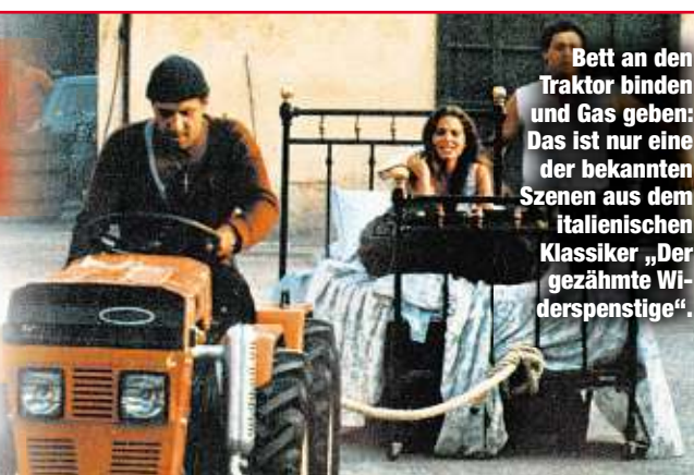
Bett an den Traktor binden und Gas geben: Das ist nur eine der bekannten Szenen aus dem italienischen Klassiker „Der gezähmte Widerspenstige“.

mit den beiden Hauptdarstellern. Morgen erhalten Sie beim Zeitungshändler Ihres Vertrauens Morgenpost und „Den gezähmten Widerspenstigen“ als DVD-Filmbeilage. Im Doppelpack für schlappe 3,80 Euro! Ohne Filmscheibe kostet die MOPO wie gewohnt 90 Cent.