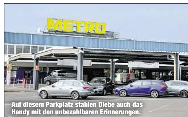
Auf diesem Parkplatz stahlen Diebe auch das Handy mit den unbezahlbaren Erinnerungen.