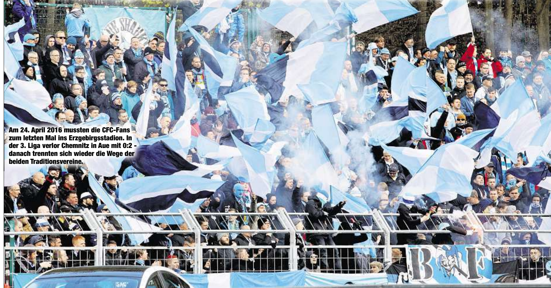
Am 24. April 2016 mussten die CFC-Fans zum letzten Mal ins Erzgebirgsstadion. In der 3. Liga verlor Chemnitz in Aue mit 0:2 - danach trennten sich wieder die Wege der beiden Traditionsvereine.