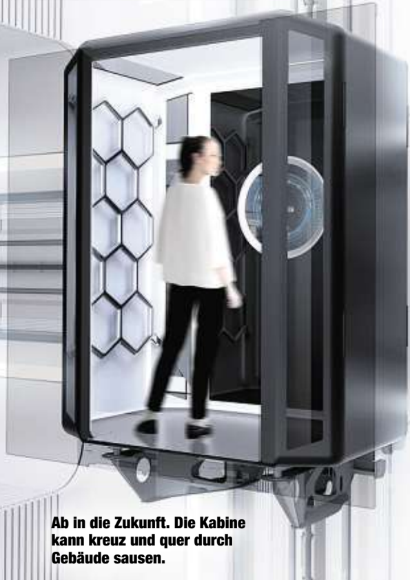
Ab in die Zukunft. Die Kabine kann kreuz und quer durch Gebäude sausen.

Jetzt gewannen die Dresdner für den Entwurf den Internationalen Designpreis Baden-Württemberg. Bereits im Februar wurde die Kabine mit dem German Design Award ausgezeichnet.