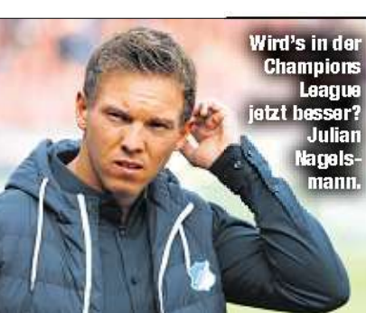
Wird's in der Champions League jetzt besser? Julian Nagelsmann.