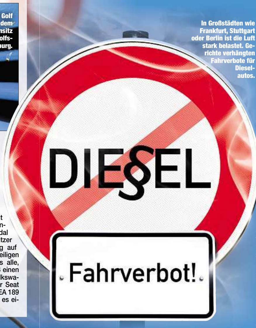
In Großstädten wie Frankfurt, Stuttgart oder Berlin ist die Luft stark belastet. Gerichte verhängten Fahrverbote für Dieselaautos.

helfen, bei Prozessen gegen Unternehmen leichter zu ihrem Recht zu kommen. Tausende vom Diesel-Skandal betroffene VW-Besitzer haben damit Hoffnung auf Schadensersatz. Beteiligten können sich kostenlos alle, die ab November 2008 einen Diesel der Marken Volkswagen, Audi, Skoda oder Seat mit Motoren des Typs EA 189 gekauft haben, für die es einen Rückruf gab.