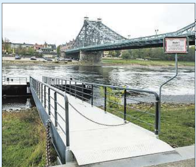
Fährt bald wieder eine Fähre zwischen Loschwitz und Blasewitz?