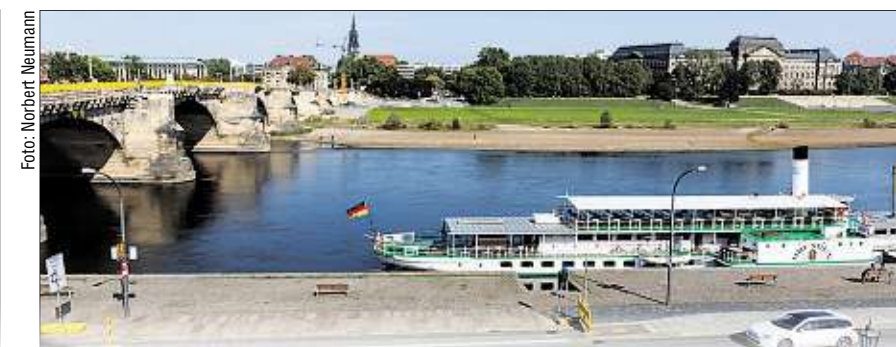
Wegen der Nähe zu den Filmnächten am Elbufer dürfen aber kaum Wohnungen entstehen.