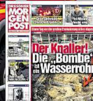
Dieses stillgelegte Wasserrohr sorgte beinahe für eine Massenevakuierung.

die Evakuierung geplant. Ab 11 Uhr sollte dann mit dem Abtragen der letzten Schicht und der Entschärfung der „Bombe“ begonnen werden. Doch bevor es so weit kam, wurde bei den Vorbereitungen am Montag offensichtlich, dass hier der Fall anders als befürchtet sei: „Wir stießen auf Bodenmaterial, das mit dem Zweiten Weltkrieg nichts zu tun hatte“, so Scherf. Tatsächlich kam kurz