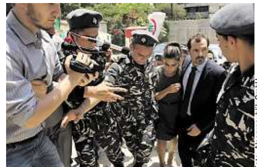
Toni (Adel Karam) und seine Frau Shirine auf dem Weg ins Gericht. Ihr Streit mit Yasser hat einen Aufstand ausgelöst.

Eine Posse mit ernststen Folgen: Beschimpfungen, dann Gewalt. Schließlich stehen sich die beiden unversöhnlich vor Gericht gegenüber. In der Stadt kommt es zu Unruhen. Es geht nicht nur um verletzten Stolz. Es sind die Wunden der Vergan-