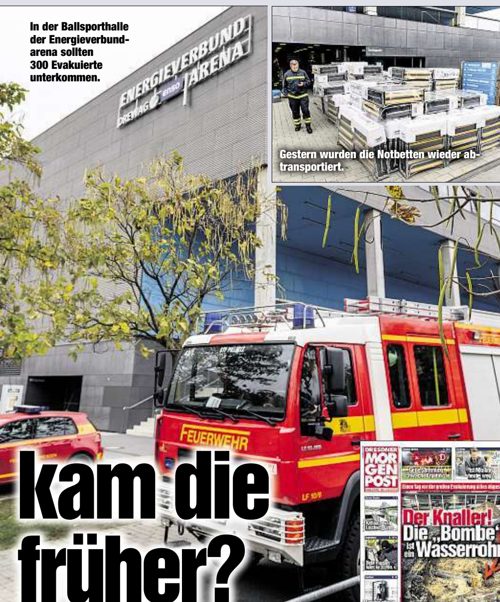
In der Ballsporthalle der Energieverbund-arena sollten 300 Evakuierte unterkommen.

gehege hieß das: Am Montag hatten Arbeiter damit begonnen, Boden über der Fundstelle abzutragen. Zwei Meter waren vorgesehen. Etwa 50 Zentimeter Deckschicht sollten über der Bombe liegen bleiben - weiter vorzudringen wäre vor der Evakuierung zu riskant gewesen. Die Fundstelle mit der letzten, dünnen Deckschicht hätte die ganze Nacht bewacht werden sollen. Für gestern ab 7 Uhr war