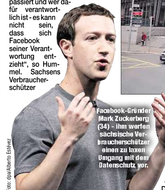
Facebook-Gründer Mark Zuckerberg (34) - ihm werfen sächsische Verbraucherschützer einen zu laxen Umgang mit dem Datenschutz vor.

haben deshalb Klage am Landgericht Berlin eingereicht. Deren Ziel: Bevor Facebook in seinen Datenschutzregularien nicht die Vorgaben der DSGVO umsetzt,