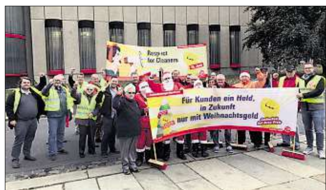
Weil sie ihre Liebsten beschenken wollen: 23 Gebäudereiniger aus Sachsen, Sachsen-Anhalt und Thüringen demonstrierten gestern für Weihnachtsgeld.