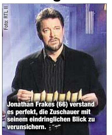
Jonathan Frakes (66) verstand es perfekt, die Zuschauer mit seinem eindringlichen Blick zu verunsichern.

MÜNCHEN - Wurde die Frau wirklich bei lebendigem Leib begraben? Und konnte ein Maler den Tod eines Modells voraussehen? Bei „X-Factor“ ging es um übernatürliche Geschichten. Der Zuschauer musste entscheiden: wahr oder falsch? 20 Jahre nach ihrem Ende kommt die kultige Mystery-Reihe nun zurück. Aber: Moderator Jonathan Frakes (66) ist nicht mehr mit dabei. Die beiden neuen Folgen präsentiert nun der gebürtige Braunschweiger Detlef Bothe (53), der im James-Bond-Streifen „Spectre“ (2015) einen Fiesling spielte. RTL II zeigt die zehn neuen Geschichten am 4. November ab 18.15 Uhr.