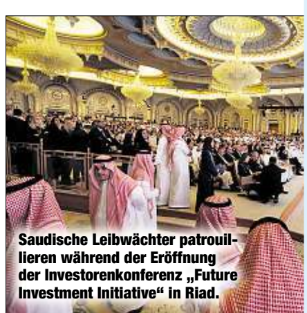
Saudische Leibwächter patrouillieren während der Eröffnung der Investorenkonferenz „Future Investment Initiative“ in Riad.