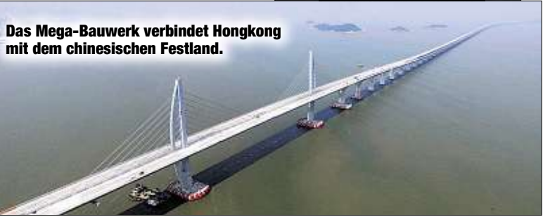
Das Mega-Bauwerk verbindet Hongkong mit dem chinesischen Festland.

kere Integration in die Volksrepublik und möchten lieber ihre Inselanlage bewahren.