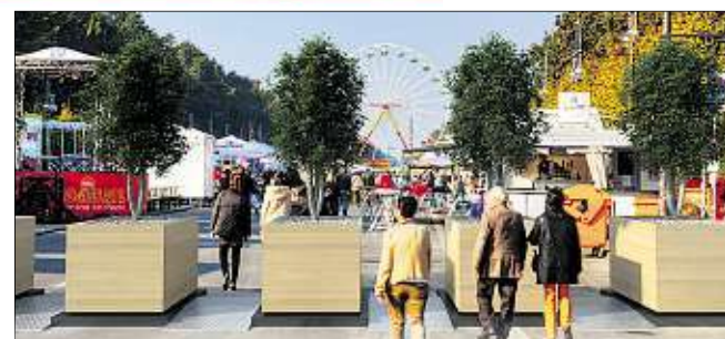
Der Kauf dieser je zwei Tonnen schweren Stahl-Sperren wurde vertagt.