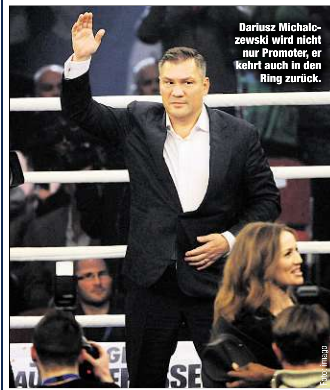
Dariusz Michalczewski wird nicht nur Promoter, er kehrt auch in den Ring zurück.

Der heute 50-Jährige Michalczewski hatte in den 90er Jahren großen Anteil am Boxboom in Deutschland und war selbst Weltmeister im Halbschwer- und im Cruisergewicht. Von seinen 50 Kämpfen gewann er 48.