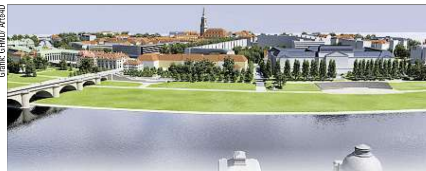
Die Areale links und rechts der Augustusbrücke sollen bebaut werden.

Büros oder Ateliers entstehen. Aktuell gibt es fünf Entwürfe, wie das Areal zukünftig aussehen könnte. Im Februar 2019 soll ein Sieger bekannt gegeben werden. Die bisherigen Entwürfe wurden nur nicht öffentlich gezeigt. DiHe