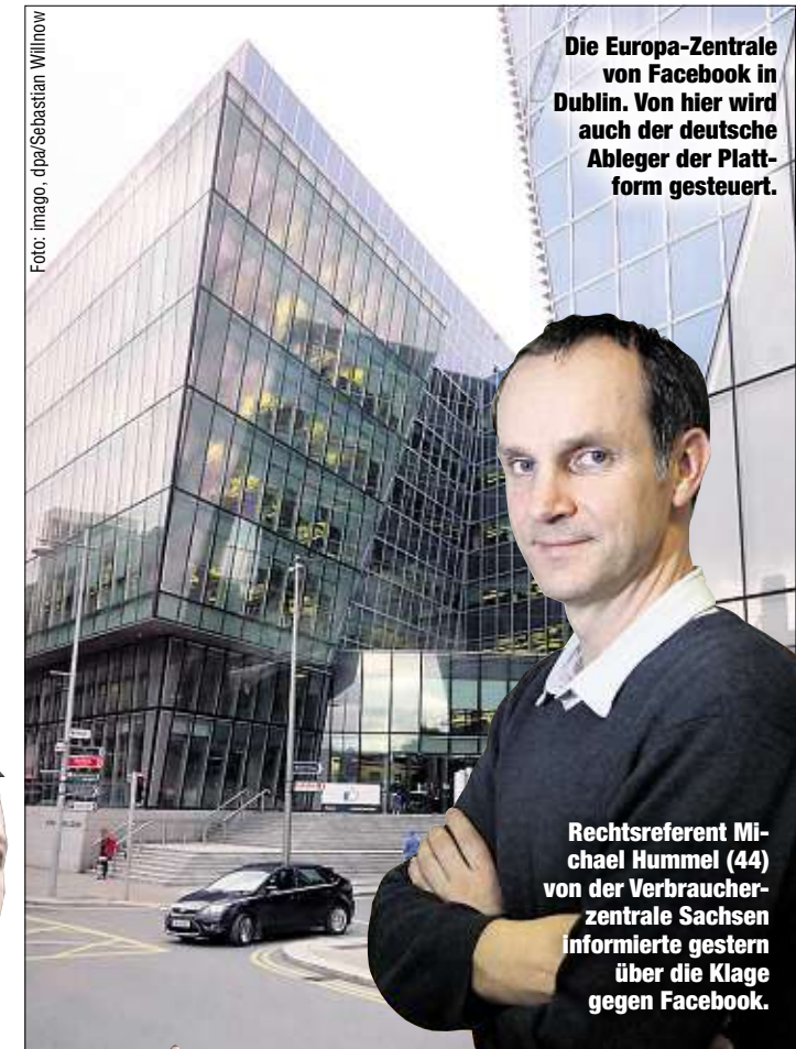
Die Europa-Zentrale von Facebook in Dublin. Von hier wird auch der deutsche Ableger der Plattform gesteuert.