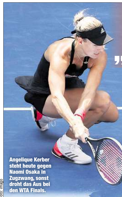
Angelique Kerber steht heute gegen Naomi Osaka in Zugzwang, sonst droht das Aus bei den WTA Finals.