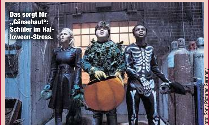
Das sorgt für „Gänsehaut“-Schüler im Halloween-Stress.