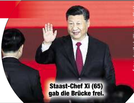
Staat-Chef Xi (65) gab die Brücke frei.