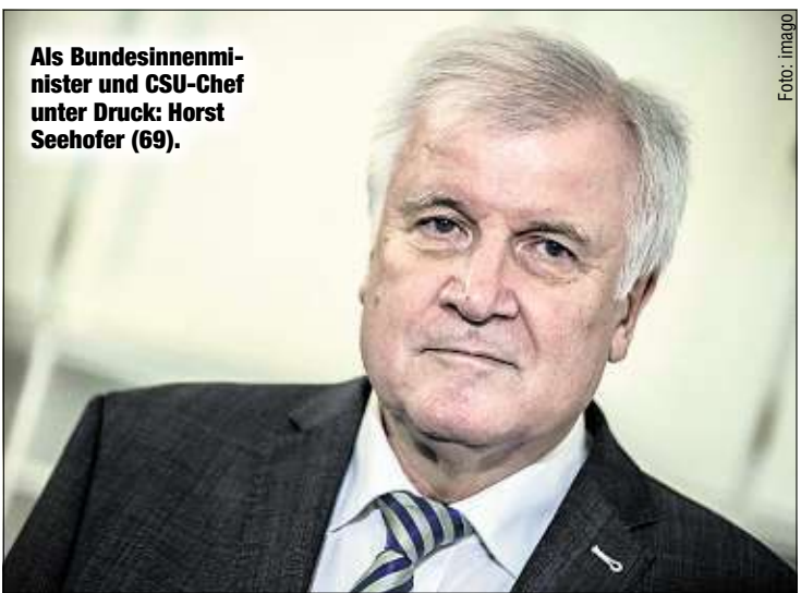
Als Bundesinnenminister und CSU-Chef unter Druck: Horst Seehofer (69).

BERLIN - Die von Bundesinnenminister Horst Seehofer (69, CSU) Mitte Juni verfügte Wiedereinreiseperrre für abgelehnte Asylbewerber an der deutsch-österreichischen Grenze hat bislang kaum Wirkung gezeigt. Demnach hat es bislang erst drei Zurückweisungen solcher Asylbewerber gegeben, berichtet die Funke Medien-gruppe. Das Ministerium hatte mit rund 100 Fällen im Monat gerechnet. Tatsächlich seien es bis zum 17. Oktober insgesamt 89 Migranten gewesen. Davon hatten nur drei bereits einen Asylantrag gestellt. Alle übrigen 86 wären auch vor dem Erlass schon abgewiesen worden. Seehofer hatte es im Sommer als „Skandal“ bezeichnet, dass Menschen mit Einreiseperrre trotzdem einreisen könnten - und einen Masterplan für eine neue Asylpolitik vorgelegt.