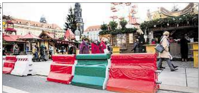
Im letzten Jahr schützten bunt beklebte Betonklötze den Weihnachtsmarkt.