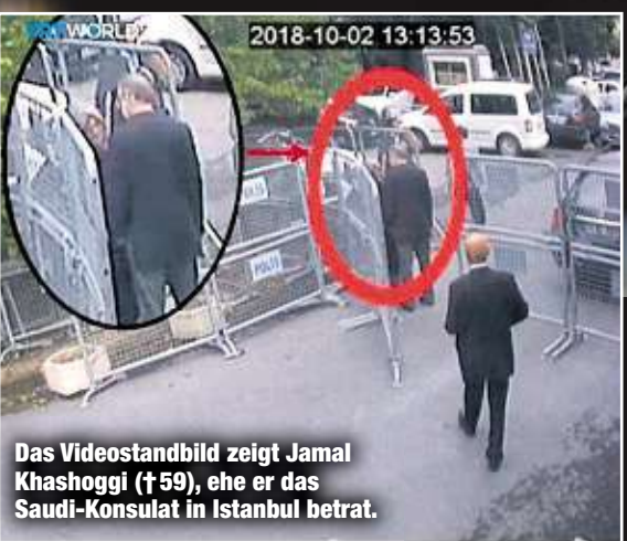
Das Videostandbild zeigt Jamal Khashoggi (†59), ehe er das Saudi-Konsulat in Istanbul betrat.