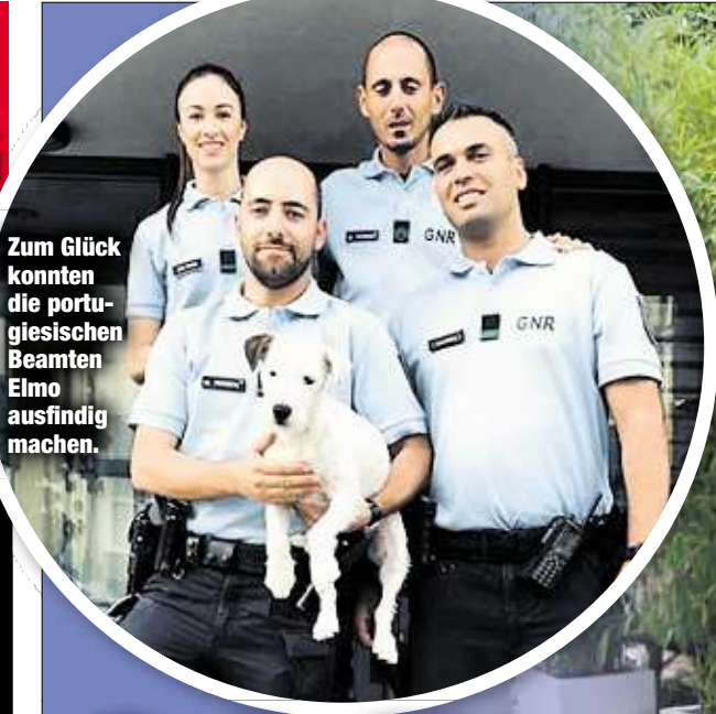
Zum Glück konnten die portugiesischen Beamten Elmo ausfindig machen.