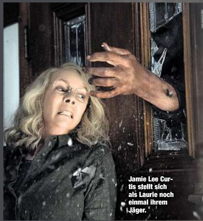
Jamie Lee Curtis stellt sich als Laurie noch einmal ihrem Jäger.