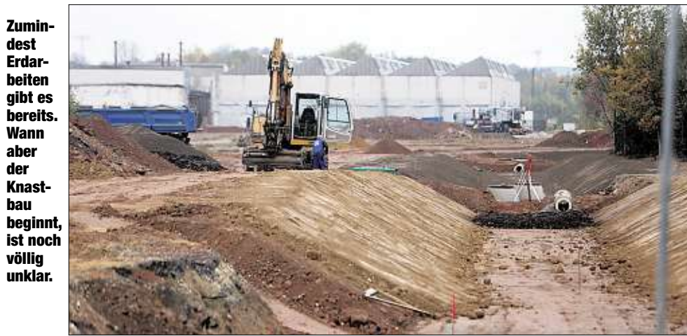
Zumindest Erdarbeiten gibt es bereits. Wann aber der Knastbau beginnt, ist noch völlig unklar.