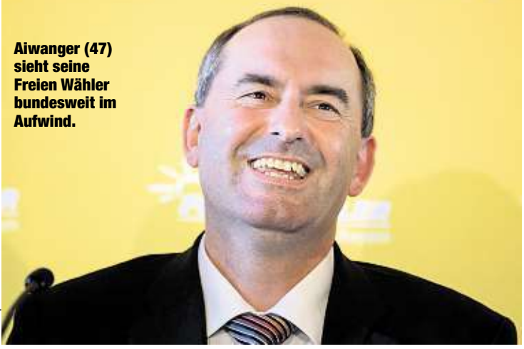
Aiwanger (47) sieht seine Freien Wähler bundesweit im Aufwind.

MÜNCHEN - Nach dem Erfolg bei der Bayern-Wahl will der Chef der Freien Wähler, Hubert Aiwanger (47), seine Partei auch auf Bundesebene etablieren. Sollte die Große Koalition in Berlin vorzeitig scheitern, könnten die Freien Wähler die 5-Prozent-Hürde überwinden, ist Aiwanger überzeugt. Wenn seine Partei genügend Zeit für einen guten Wahlkampf hätte, könnte sie das in den Bundestag tragen. Bei der letzten Bundestagswahl im September 2017 kamen die Freien Wähler - wie schon 2013 - auf 1,0 Prozent. Zunächst aber wollen die Freien Wähler am kommenden Sonntag in Hessen wieder punkten. Seine Partei setze auf alle Wähler, die unzufrieden mit den etablierten Parteien seien und für die die AfD keine Alternative sei, so Aiwanger. Allerdings spielen die Freien Wähler in Umfragen zur Landtagswahl in Hessen bislang kaum eine Rolle.