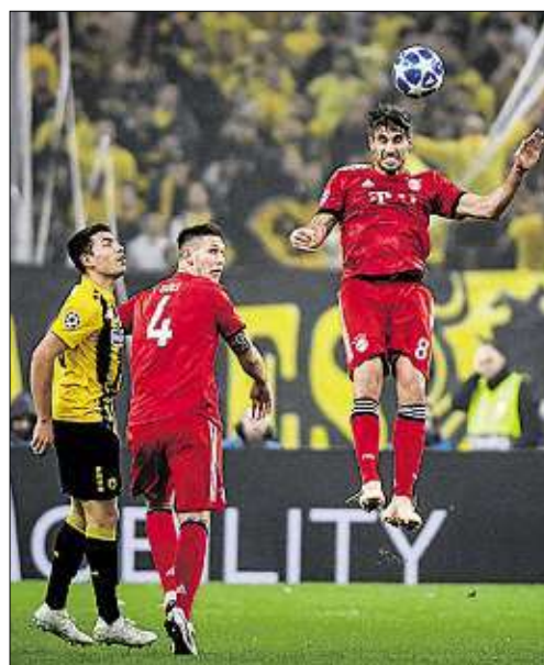
Javi Martinez (r.) erzielt das 1:0 für die Bayern beim Sieg in Athen.

Athen - Der FC Bayern München ist nach turbulenten Tagen auch in der Champions League wieder in Schwung gekommen. Der deutsche Rekordmeister setzte durch das 2:0 (0:0) beim AEK Athen dank der Tore von Javi Martinez (61.) und Robert Lewandowski (63.) den Aufwärtstrend fort.