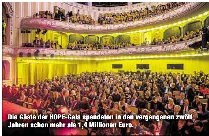
Die Gäste der HOPE-Gala spendeten in den vergangenen zwölf Jahren schon mehr als 1,4 Millionen Euro.