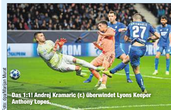
Das 1:1! Andrej Kramaric (r.) überwindet Lyons Keeper Anthony Lopes.