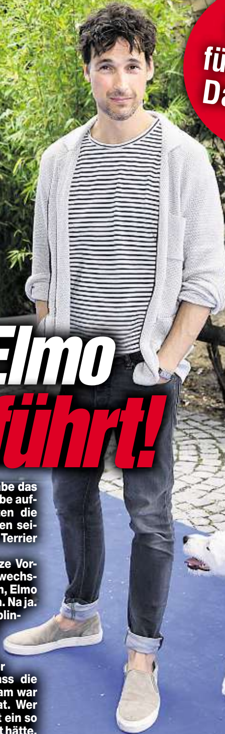
Florian David Fitz (43) und sein Hund Elmo sind ein Herz und eine Seele. Umso größer war für den Schauspieler der Schock, als sein Russell Terrier verschwand.