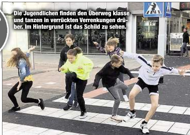
Die Jugendlichen finden den Überweg klasse und tanzen in verrückten Verrenkungen drüber. Im Hintergrund ist das Schild zu sehen.