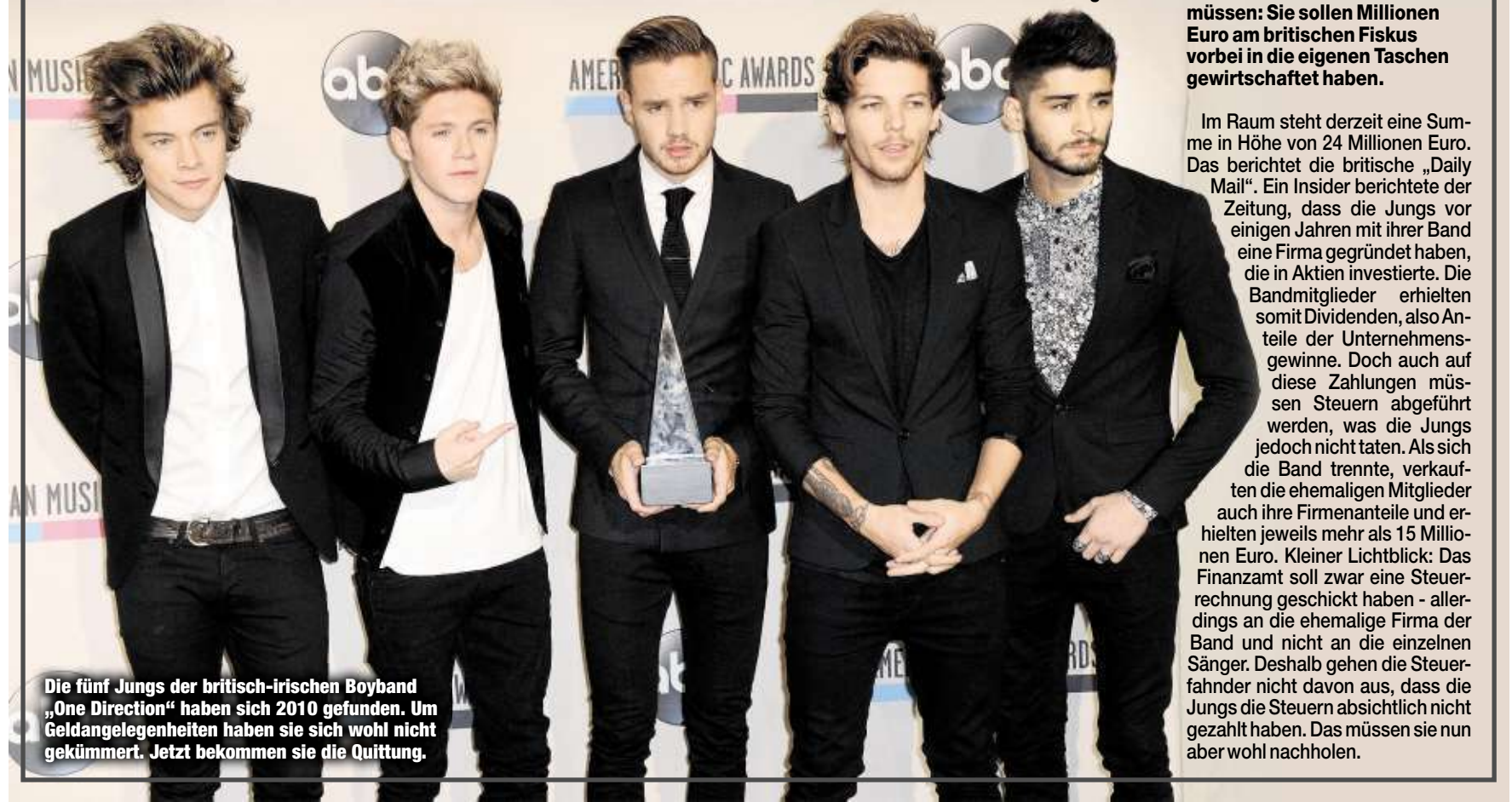
Die fünf Jungs der britisch-irischen Boyband „One Direction“ haben sich 2010 gefunden. Um Geldangelegenheiten haben sie sich wohl nicht gekümmert. Jetzt bekommen sie die Quittung.

Vor über zwei Jahren zog sich die Boyband „One Direction“ aus der Öffentlichkeit zurück. Die Jungs wollten eine Pause einlegen. Ob