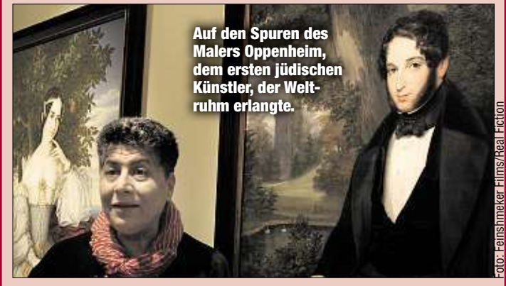
Auf den Spuren des Malers Oppenheim, dem ersten jüdischen Künstler, der Welt- ruhm erlangte.