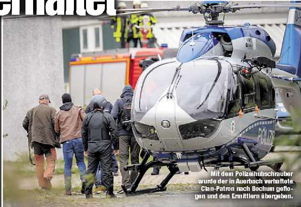
Mit dem Polizeihubschrauber wurde der in Auerbach verhaftete Clan-Patron nach Bochum geflogen und den Ermittlern übergeben.

Die Brüder waren von den Drogenfahndern zuvor wochenlang observiert, ihre Telefone abgehört worden. Dabei gelang es den Ermittlern laut Schütte auch, fünf Kilo Marihuana aus dem Verkehr zu ziehen, die für Abnehmer in Sachsen bestimmt waren. Zudem sollen die Brüder auch größere Mengen Kokain nach Auer-