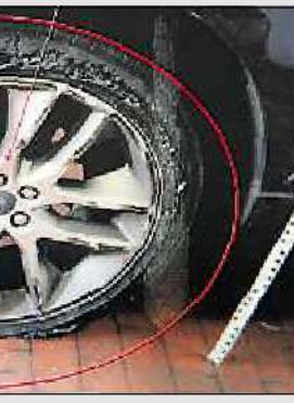
Der demolierte Reifen des Ford Edge.

Im Juni übernahm der mehrfach Vorbestrafte in Plauen einen geklauten Ford Edge, sollte