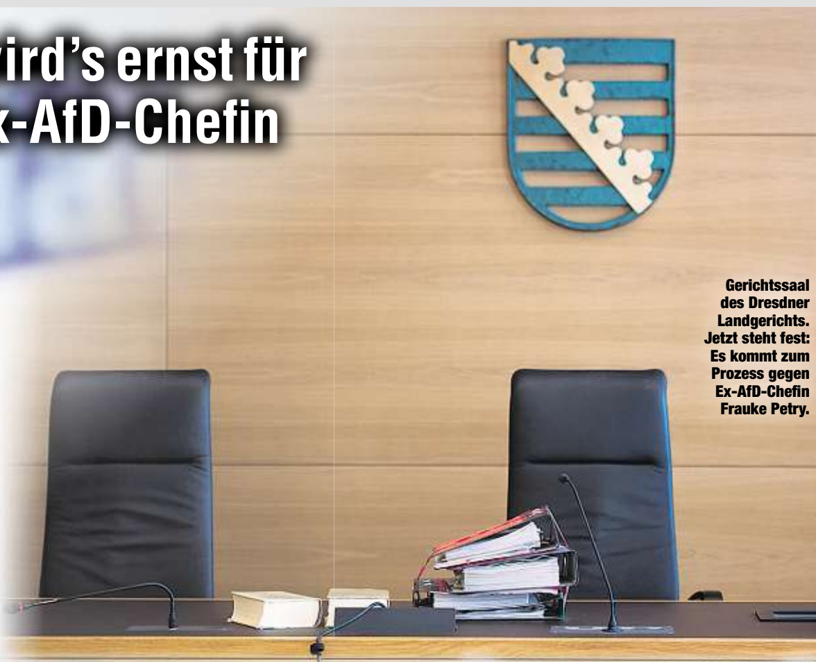
Gerichtssaal des Dresdner Landgerichts. Jetzt steht fest: Es kommt zum Prozess gegen Ex-AfD-Chefin Frauke Petry.