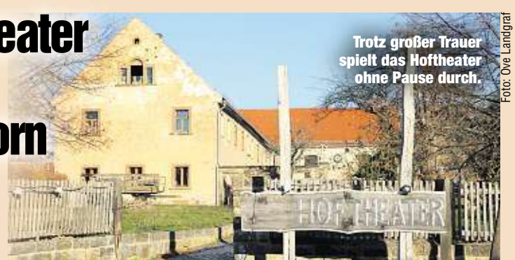
Trotz großer Trauer spielt das Hoftheater ohne Pause durch.