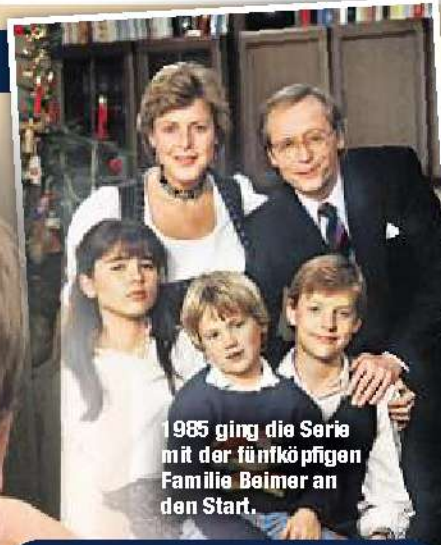
1985 ging die Serie mit der fünfköpfigen Familie Beimer an den Start.

Sonntag ohne Lindenstraße nicht vorstellen!“, schreibt ein Facebook-Nutzer. Sogar eine Petition zum Erhalt der Serie ist wenige Stunden nach der Schock-Nachricht bereits online.