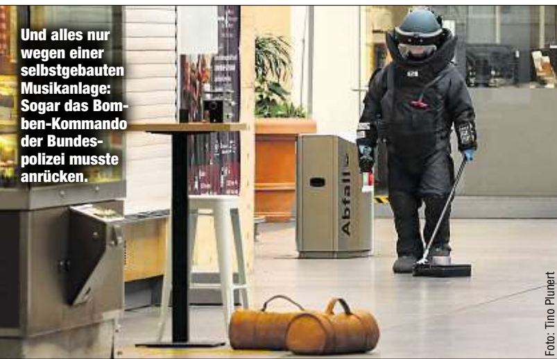
Und alles nur wegen einer selbstgebauten Musikanlage: Sogar das Bomben-Kommando der Bundespolizei musste anrücken.

Tresen (Morgenpost berichtete) werden beispielsweise ausgebaut, um Erleichterung zu verschaffen. Die Idee, ein kleines niedrigwassertaugliches Schiff zu kaufen, „ist nicht vom Tisch“, gestaltet sich aufgrund der wirtschaftlichen Lage aber gerade als schwierig. am