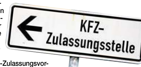
Zwei Tage lang konnte zum Beispiel die Zulassungsstelle nicht öffnen.

stellen in Glauchau, Werdau und Zwickau. Zudem die fünf Bürgerservicestellen des Landkreises Zwickau. Auch dort funktionierte der Zugriff auf die Daten der Kfz-Zulassung nicht. Wann dort wieder alles läuft, blieb gestern unklar. Das Landratsamt war nicht zu erreichen. mor