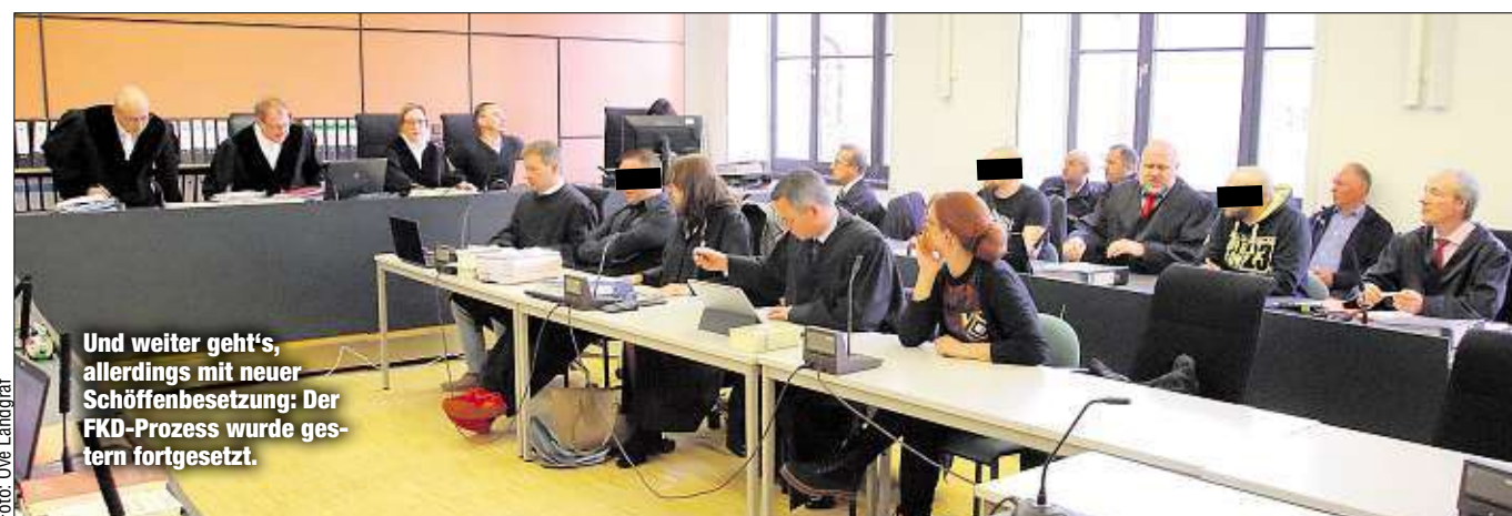
Und weiter geht's, allerdings mit neuer Schöffenbesetzung: Der FKD-Prozess wurde gestern fortgesetzt.