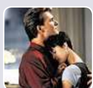
20.15 Uhr, SuperRTL

Ein Klassiker! Patrick Swayze versucht in Ghost - Nachricht von Sam (1990) als Geist den Mord an ihm selbst aufzuklären und seine Freundin Molly zu beschützen. Hilfe bekommt er dabei von Geisterbeschwörerinnen Oda Mae (Whoopi Goldberg). Ein Film der Kategorie „Muss man mal gesehen haben“, auch wenn er schon ein paar Jahre auf dem Buckel hat.