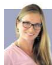
Von Nadine Steinmann