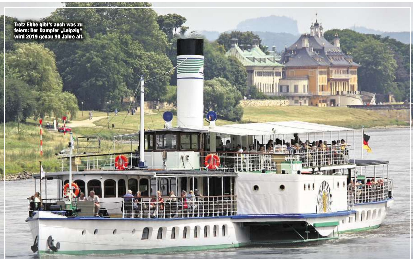
Trotz Ebbe gibt's auch was zu feiern: Der Dampfer „Leipzig“ wird 2019 genau 90 Jahre alt.