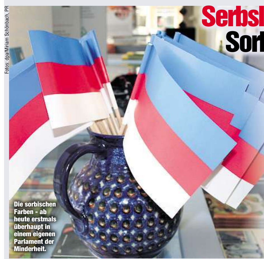
Die sorbischen Farben - ab heute erstmals überhaupt in einem eigenen Parlament der Minderheit.