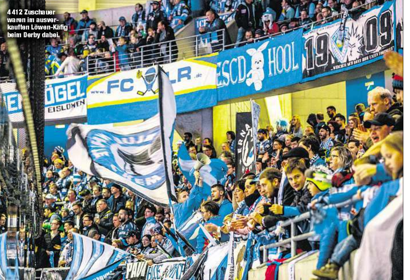
4 412 Zuschauer waren im ausverkauften Löwen-Käfig beim Derby dabei.