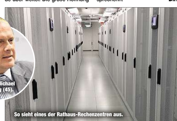
So sieht eines der Rathaus-Rechenzentren aus.