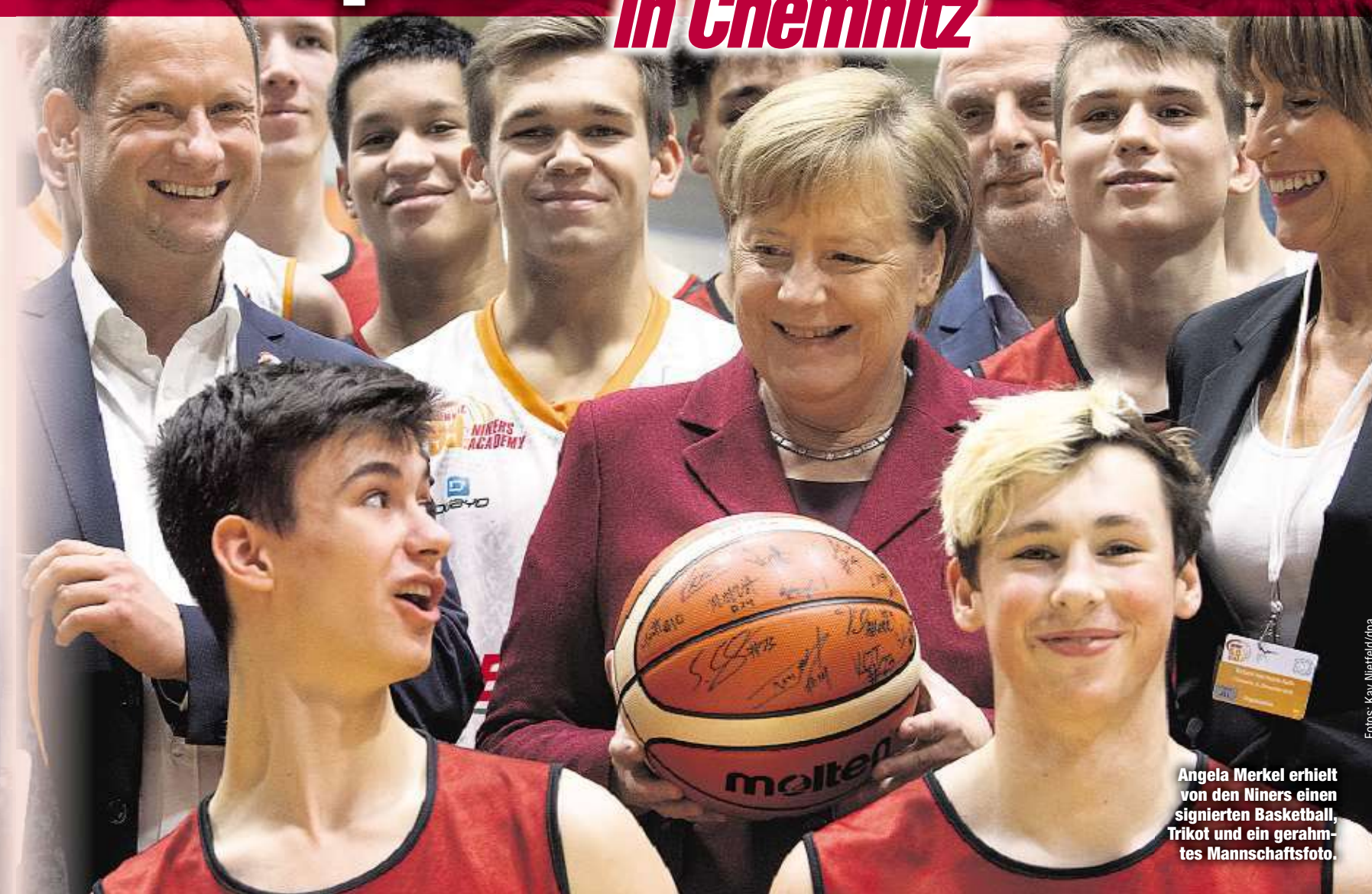
Angela Merkel erhielt von den Ninern einen signierten Basketball, Trikot und ein gerahmtes Mannschaftsfoto.