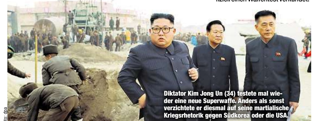
Diktator Kim Jong Un (34) testete mal wieder eine neue Superwaffe. Anders als sonst verzichtete er diesmal auf seine martialische Kriegsrhetorik gegen Südkorea oder die USA.

unklar. Dennoch könnte der Test zu neuen internationalen Spannungen führen, bislang reagierte das Weiße Haus zurückhaltend. Es ist das erste Mal seit Beginn der vorsichtigen diplomatischen Annäherung zwischen Nordkorea und den USA, dass Pjöngjang offiziell einen Waffentest verkündet.