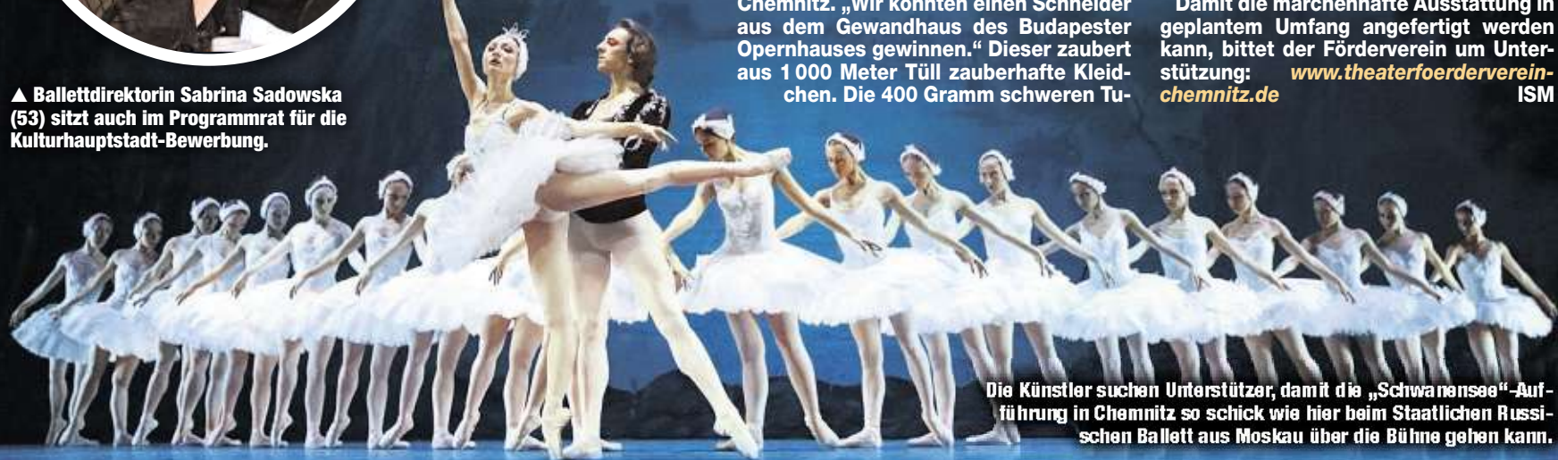
Die Künstler suchen Unterstützer, damit die „Schwanensee“-Aufführung in Chemnitz so schick wie hier beim Staatlichen Russischen Ballett aus Moskau über die Bühne gehen kann.