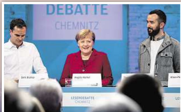
120 Leser und Bürger kamen zur Diskussionsrunde in die gut abgeschottete Hartmannfabrik. Vier Chemnitzer diskutierten mit Merkel auf dem Podium.