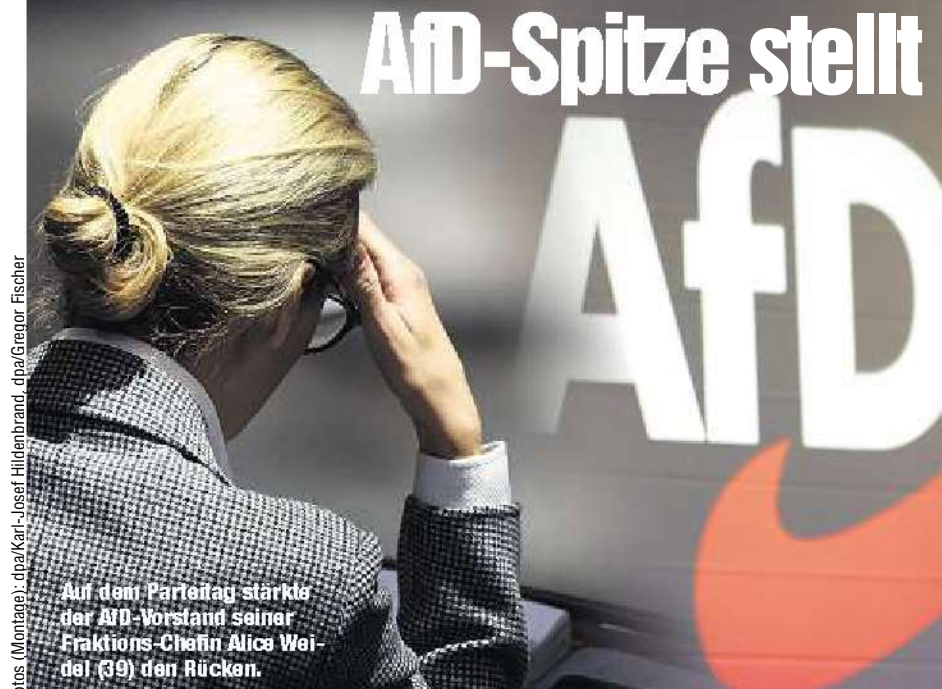
Auf dem Parteitag stärkte der AfD-Vorstand seiner Fraktions-Chefin Alice Weidel (39) den Rücken.

MAGDEBURG - In der Affäre um illegale Parteispenden aus dem Ausland hat sich die AfD-Spitze geschlossen hinter ihre Fraktions-Chefin gestellt. „Der Bundesvorstand sieht keinerlei Verschulden bei Frau Dr. Alice Weidel“, hieß es in einer knappen Erklärung gestern vom Bundesparteitag in Magdeburg.