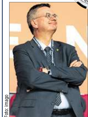
Reinhard Grindel hat Verständnis für die vielen leeren Plätze in Leipzig.

Zuschauer, das ist das, was RB Leipzig bei vergleichbaren Spielen auch hat“, sagte Grindel. Der ebenfalls schleppend angelaufene Ticketverkauf für das letzte Gruppenspiel in der Nations League am Montag in Gelsenkirchen gegen Holland zog an den letzten Tagen deutlich an, verriet Grindel. Er hofft sogar auf ein nahezu ausverkauftes Schalke-Stadion (54 700 Plätze).