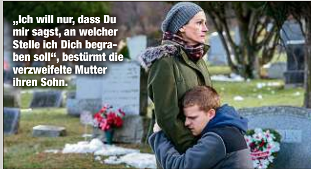
„Ich will nur, dass Du mir sagst, an welcher Stelle ich Dich begraben soll“, bestürmt die verzweifelte Mutter ihren Sohn.

„Ben Is Back“ ist die Geschichte einer Mutter, die um ihren drogensüchtigen Sohn kämpft. Eigentlich ist der 19-jährige Ben (Lucas Hedges) in einer Klinik auf Drogenentzug, doch Weihnachten taucht er unerwartet zu Hause auf. Seine Mutter Holly (Julia Roberts) kann es kaum fassen. Doch sie hat auch Angst, dass ihr Sohn einen Rückfall erleiden könnte. Die nächsten 24 Stunden werde sie ihn keinen Moment aus den Augen lassen, droht sie. Die ganze Familie ist besorgt. Und tatsächlich: Was als Mutter-Sohn-Drama beginnt, wird immer mehr zum Thriller, der in die düstere Drogenwelt führt. Ben wird mit Dealern und Süchtigen aus seiner Vergangenheit konfrontiert. Verzweifelt bleibt