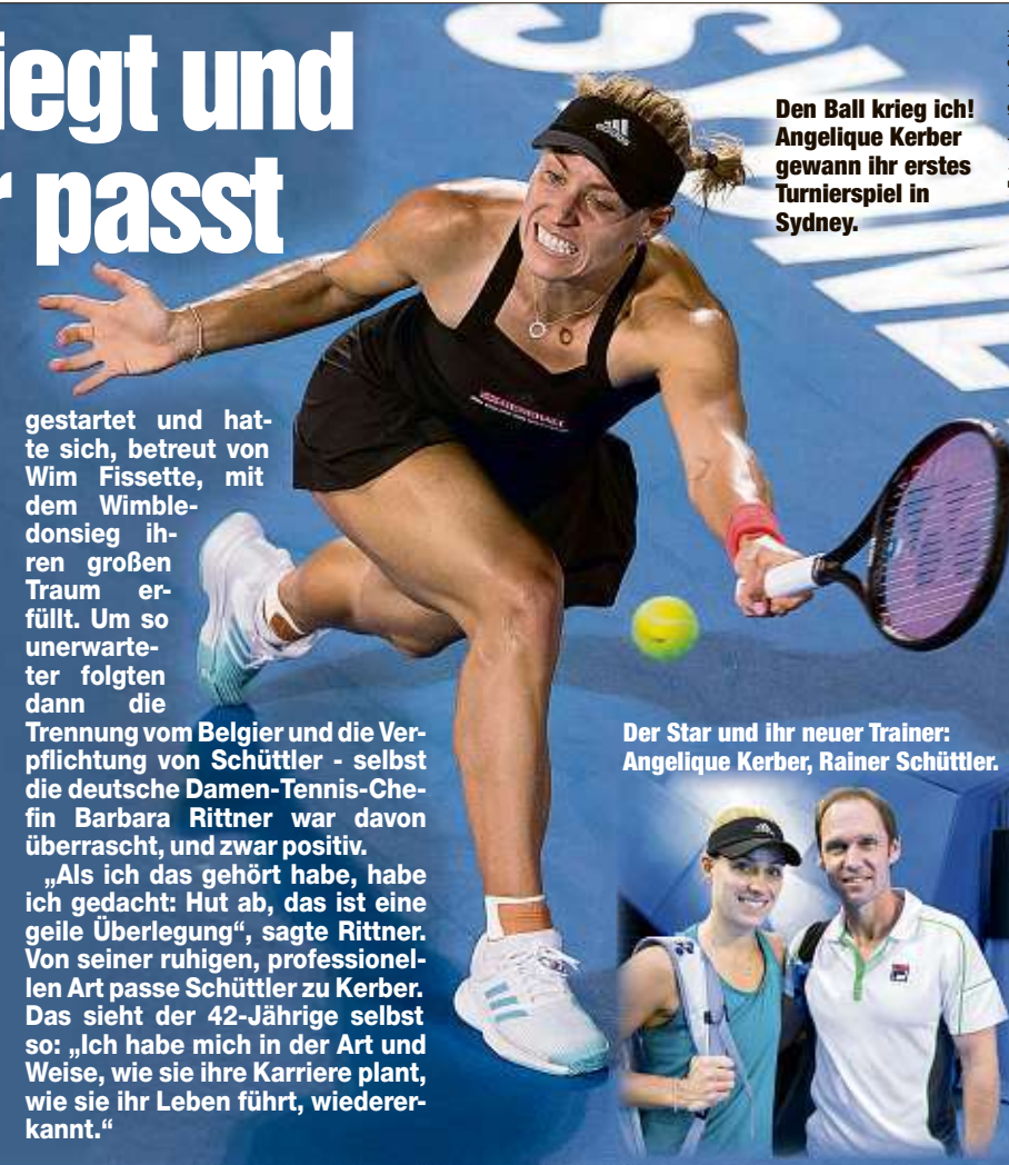
Den Ball krieg ich! Angelique Kerber gewann ihr erstes Turnierspiel in Sydney.

gestartet und hatte sich, betreut von Wim Fissette, mit dem Wimbledon Sieg ihren großen Traum erfüllt. Um so unerwarteter folgten dann die Trennung vom Belgier und die Verpflichtung von Schüttler - selbst die deutsche Damen-Tennis-Chefin Barbara Rittner war davon überrascht, und zwar positiv. „Als ich das gehört habe, habe ich gedacht: Hut ab, das ist eine geile Überlegung“, sagte Rittner. Von seiner ruhigen, professionellen Art passe Schüttler zu Kerber. Das sieht der 42-Jährige selbst so: „Ich habe mich in der Art und Weise, wie sie ihre Karriere plant, wie sie ihr Leben führt, wiedererkannt.“