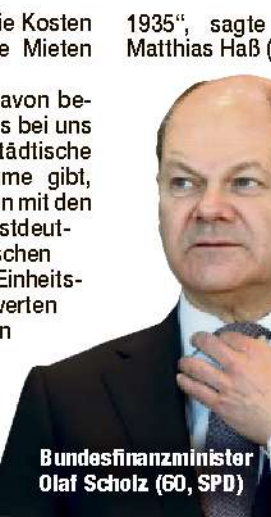
Bundesfinanzminister Olaf Scholz (60, SPD)