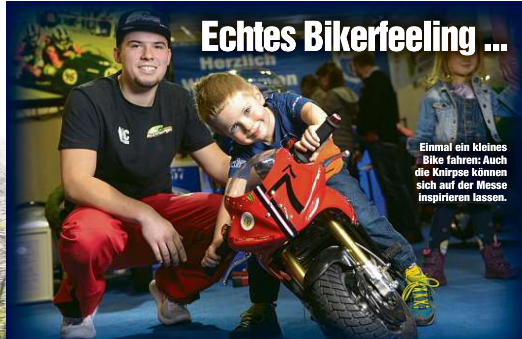
Einmal ein kleines Bike fahren: Auch die Knirpse können sich auf der Messe inspirieren lassen.

... vermittelt die Bühnenshow zur SachsenKrad. Aber nicht nur Show, News und Action bestimmen die Dresdner Motorradmesse. An allen drei Messetagen werden um 16.30 Uhr hochwertige Preise auf der Messebühne Halle 4 verlost - darunter Motorsport-Tickets, Motorrad-Wochenenden, Sicherheitstrainings, Tattoo-Gutscheine und tolle Sachpreise. Die Losabschnitte erhalten Besucher mit Erwerb einer Eintrittskarte an der Kasse.