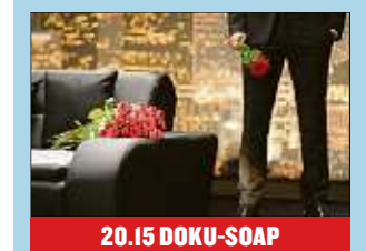
20.15 DOKU-SOAP Der Bachelor Zwei Gruppendates mit dem neuen Bachelor stehen diesmal am: Im Fitnessstudio...