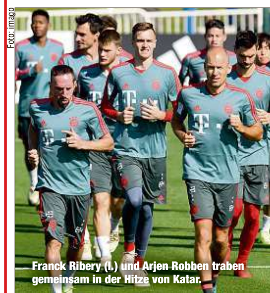
Franck Ribery (l.) und Arjen Robben traben gemeinsam in der Hitze von Katar.