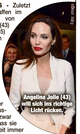
Angelina Jolie (43) will sich ins richtige Licht rücken.

Wie ein Insider „RadarOnline“ verraten hat, plant Angelina, in einem großen TV-Interview über die Ehe mit Brad auspacken - und zwar schonungslos. Dass sie in der Öffentlichkeit immer als die „Böse“ dargestellt werde, ginge ihr gehörig gegen den Strich. Ob sie mit solch einem Auftritt ihr Image aufpolieren kann, ist allerdings fraglich.