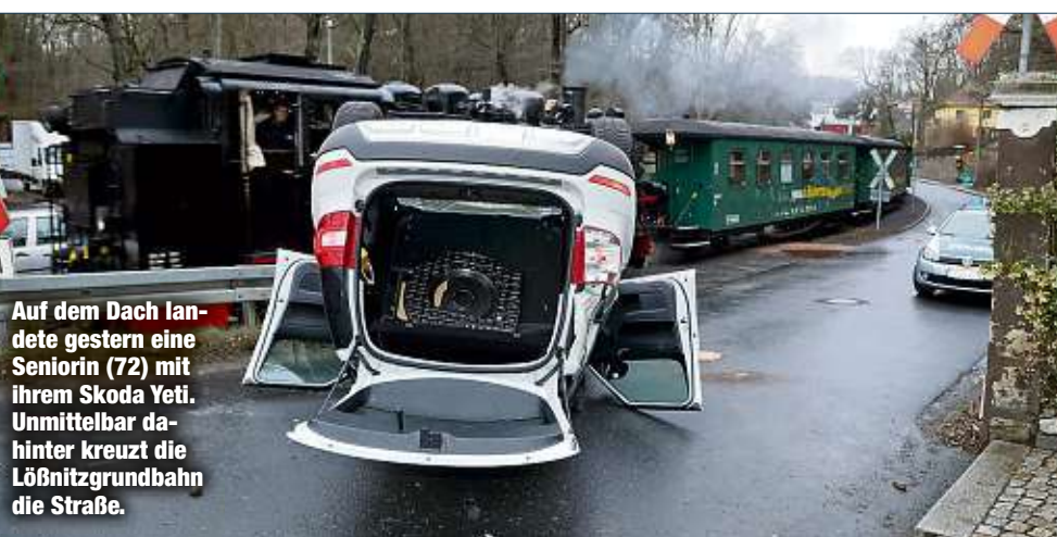
Auf dem Dach landete gestern eine Seniorin (72) mit ihrem Skoda Yeti. Unmittelbar dahinter kreuzt die Löbnitzgrundbahn die Straße.