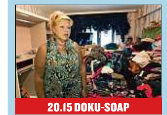
20.15 DOKU-SOAP Die Wollnys - Eine schrecklich große Familie! Silvias alter Schrank muss dringend ausgemistet werden...