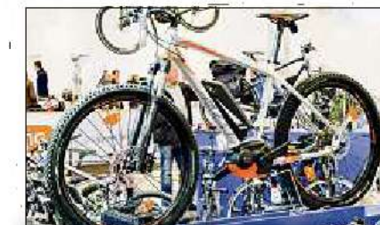
Schnellig und auf dem neuesten Stand: Auf den e-bike-days können sich die Gäste über Trends und Technik informieren.

Sausen wie der Wind - und das mit weniger Anstrengungen? Elektroräder machen's möglich. Nicht ohne Grund sind sie nach wie vor das größte Wachstumsegment der Fahrradwirtschaft. Deshalb auch finden parallel zur Motorradmesse die nunmehr 8. e-bike-days statt. Die Ausstellung in Halle 2 zeigt zahlreiche Facetten der E-Mobilität im Zweiradbereich, aktuelle Innovationen und die neuen Modelle der Saison.