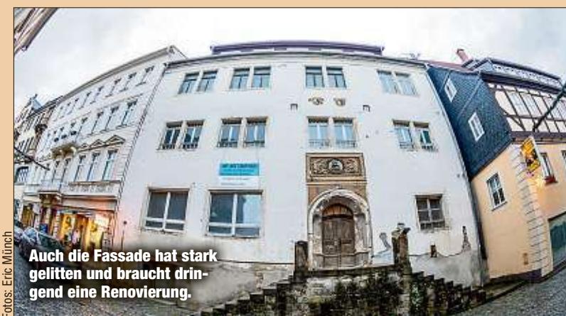
Auch die Fassade hat stark gelitten und braucht dringend eine Renovierung.