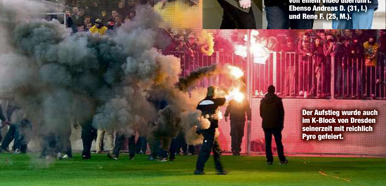
Der Aufstieg wurde auch im K-Block von Dresden seinerzeit mit reichlich Pyro gefeiert.