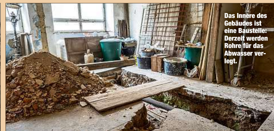
Das Innere des Gebäudes ist eine Baustelle: Derzeit werden Rohre für das Abwasser verlegt.

Im Internet sammelt Bauherr Fritz Reimann jetzt Spenden