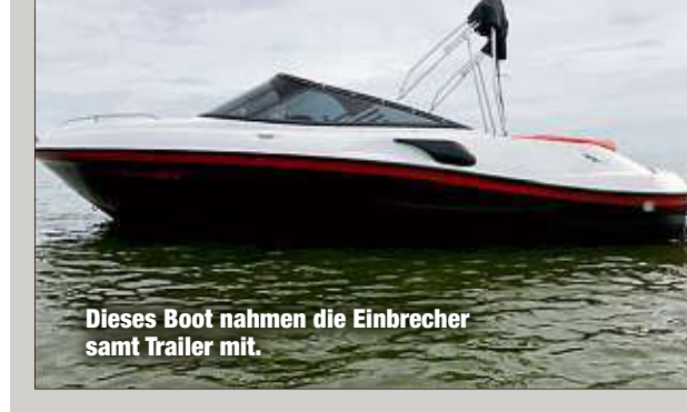
Dieses Boot nahmen die Einbrecher samt Trailer mit.

„Leinen los!“, dachten sich offenbar Diebe an der Kauschaer Straße (Torna), als sie ein rund sieben Meter langes Motorboot samt Trailer (Anhängen) von einem umzäunten, abgeschlossenen Grundstück klawten. Offenbar kamen die „Seemänner“ auf leisen Sohlen. „Es