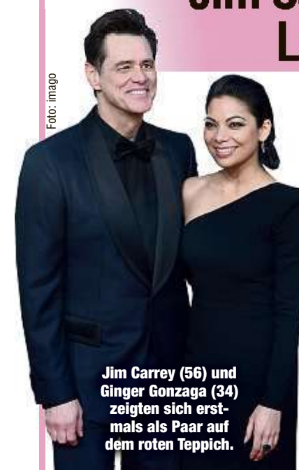
Jim Carrey (56) und Ginger Gonzaga (34) zeigten sich erstmals als Paar auf dem roten Teppich.

LOS ANGELES - Die beiden kamen aus dem Strahlen gar nicht mehr heraus: Bei der Verleihung der Golden Globes präsentierte US-Star Jim Carrey (56) überglücklich die neue Frau an seiner Seite: seine Schauspiel-Kollegin Ginger Gonzaga (34). Kennengelernt haben sich die beiden am Set der Serie „Kidding“. Nun sind sie auch privat unzertrennlich. „Sie ist unglaublich und eine großartige Person“, schwärmte Carrey von der 34-Jährigen. Seit dem Selbstmord seiner Ex-Freundin im September 2015 hatte er sich aus der Öffentlichkeit zurückgezogen. Damals wurde er indirekt für deren Tod mit verantwortlich gemacht, musste sich vor Gericht verantworten. Nun hat er sein unverwechselbares Lachen zurück.