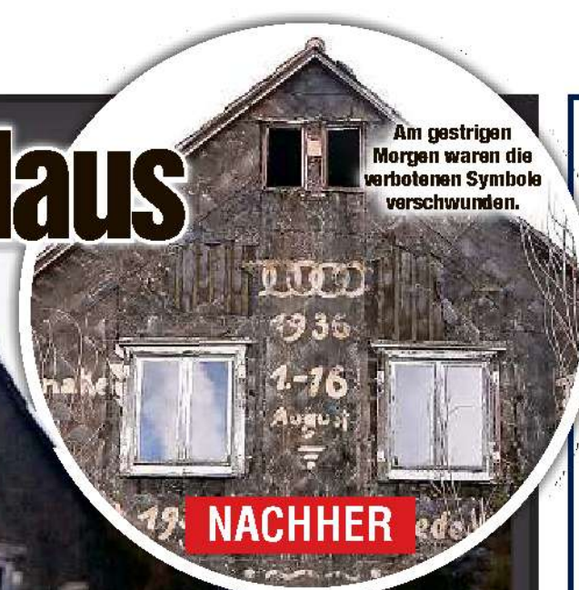
Am gestrigen Morgen waren die verbotenen Symbole verschwunden.

Das Dresdner Nazi-Haus rief die Polizei auf den Plan. Links und rechts der olympischen Ringa sowie im Dachgiebel prangten Hakenkreuze.