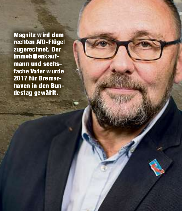
Magnitz wird dem rechten AfD-Flügel zugerechnet. Der Immobilienkäufer und sechsfache Vater wurde 2017 für Bremerhaven in den Bundestag gewählt.