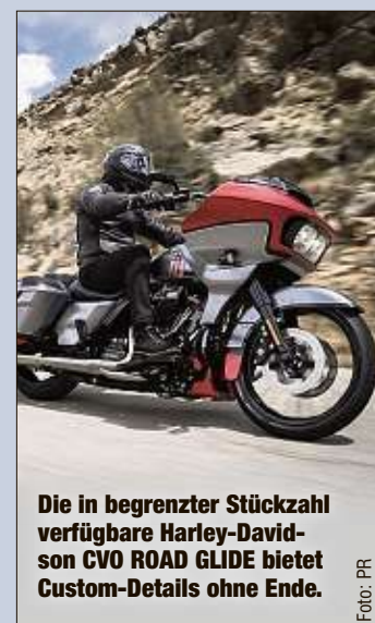
Die in begrenzter Stückzahl verfügbare Harley-Davidson CVO ROAD GLIDE bietet Custom-Details ohne Ende.

eBike Dresden GmbH Ruscher Sagarder Weg 1 01109 Dresden Tel.: 0351 88814380 Fax: 0351 88814381 E-Mail: info@eBike-Dresden.com Web: www.ebike-dresden.com Halle 2 Stand A 15 Elektrofahrräder sowie