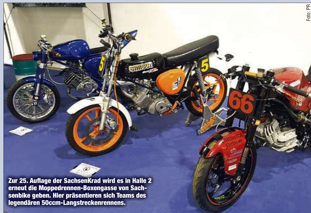
Zur 25. Auflage der SachsenKrad wird es in Halle 2 erneut die Mopedrennen-Boxengasse von Sachsenbike geben. Hier präsentieren sich Teams des legendären 50ccm-Longstreckenrennens.

Schniebel Trading Pfarrgasse 1 01920 Elstra Tel.: 035793 395190 Fax: 035793 395191 E-Mail: matthias@schniebel.com Web: www.schniebel.com Halle 3 Stand C 1 Sammelmodelle, Modellfahrzeuge