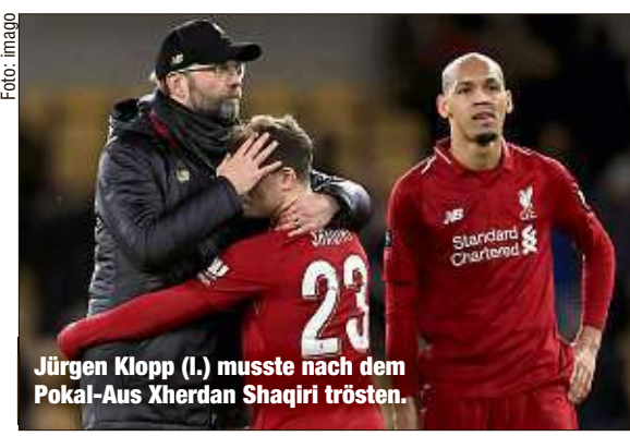
Jürgen Klopp (l.) musste nach dem Pokal-Aus Xherdan Shaqiri trösten.