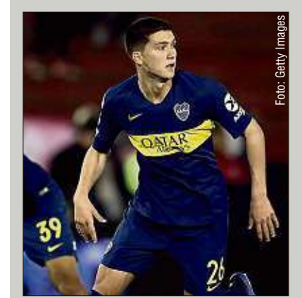
Borussia Dortmund ist an einer Verpflichtung des Argentiniers Leonardo Balerdi interessiert.

Der 1,88 Meter große Balerdi absolvierte bislang fünf Pflichtspiele für Boca und stand zweimal für die argentinische „U20“-Nationalmannschaft auf dem Platz. Er gilt als großes Abwehrtalent mit guter Übersicht und ist auch im defensiven Mittelfeld einsetzbar.