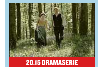
20.15 DRAMASERIE Outlander Gerade als Jamie (Sam Heughan) und Claire (Caitriona Balfe) nach Schottland zurückreisen wollen...