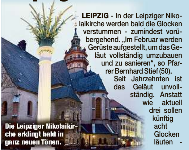
Die Leipziger Nikolaikirche erklingt bald in ganz neuen Tönen.