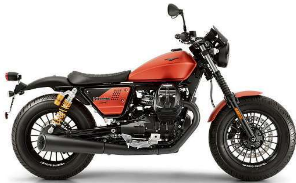
Die Moto Guzzi V9 Bobber Sport ist eine echte Italienerin und Hommage an die legendären Bobber - die einzigartigen Rennmaschinen der 1940-er und 50-er Jahre.