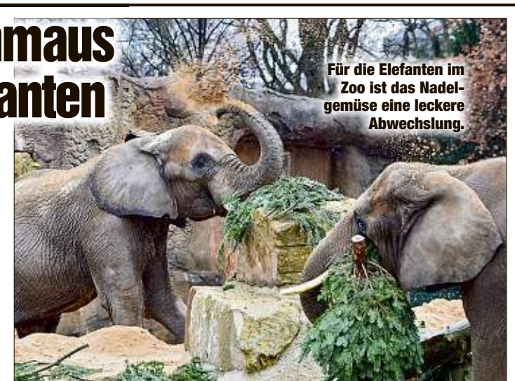
Für die Elefanten im Zoo ist das Nadelgemüse eine leckere Abwechslung.

Gestern gab es lecker WTC-Tanne für die Elis im Zoo. Das Mega-Bäumchen war zuvor in „handliche“ Stücke zerlegt worden. Drumbo, Mogli und Callboy Tembo ließen es sich auch sogleich schmecken. Nur Sawu zog bei dem schlechten Wetter das Heu im Afrikahaus vor.