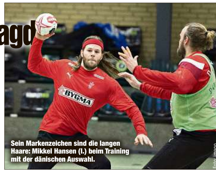
Sein Markenzeichen sind die langen Haare: Mikkel Hansen (l.) beim Training mit der dänischen Auswahl.

baller 2011 und 2015, spielt aktuell für Paris Saint-Germain. „Wir wollen unseren Fans endlich den Titel schenken und unseren WM-Fluch besiegen. Meine Spieler sind heiß“, verrät Trainer Nikolaj Jacobsen. Der Meistermacher des Bundesligisten Rhein-Neckar Löwen steht aber auch gehörig unter Druck. Die handballverrückten Dänen erwarten die Teilnahme an