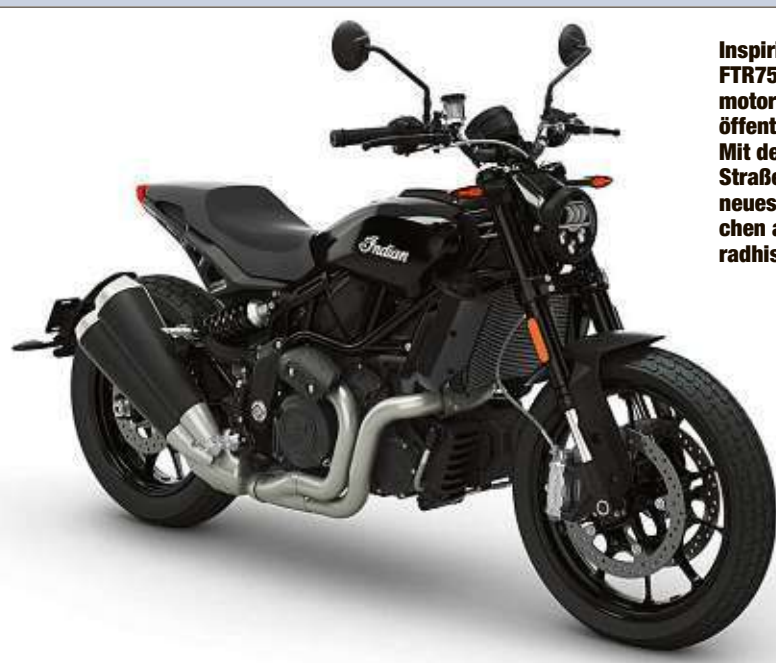
Inspiziert vom Racing-Bike FTR750, dreht das Serienmotorrad FTR 1200 nun auf öffentlichen Straßen auf. Mit dem Flat Tracker für die Straße schreibt Indian ein neues Kapitel in der rühmreichen amerikanischen Motorradhistorie.

Motorradhaus Zehren GmbH Meißner Str. 22 01665 Diera-Zehren Tel.: 035247 50250 Fax: 035247 50252 E-Mail: info@motorradhaus-zehren.de