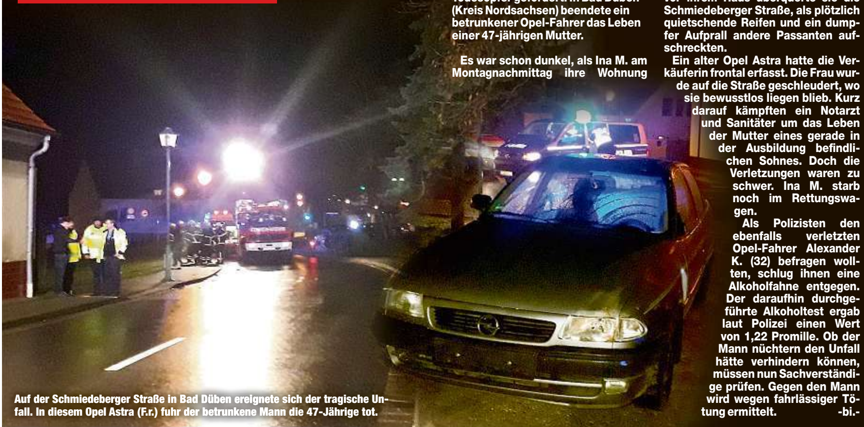
Auf der Schmiedeberger Straße in Bad Dübén ereignete sich der tragische Unfall. In diesem Opel Astra (F.r.) fuhr der betrunkene Mann die 47-Jährige tot.

BAD DÜBEN - Alkohol im Straßenverkehr hat in Sachsen erneut ein Todesopfer gefordert. In Bad Dübén (Kreis Nordsachsen) beendete ein betrunkenen Opel-Fahrer das Leben einer 47-jährigen Mutter.