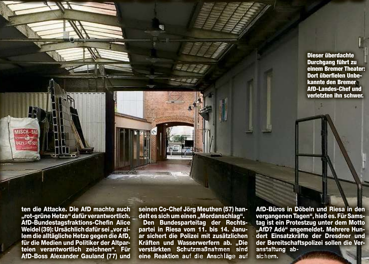
Dieser überdachte Durchgang führt zu einem Bremer Theater: Dort überfielen Unbekannte den Bremer AfD-Landes-Chef und verletzten ihn schwer.

Zwei Handwerker entdeckten den am Boden liegenden Magnitz und riefen einen Rettungswagen. Die Ermittler gehen von einer politisch motivierten Tat aus. Die Bremer Polizei bildete eine Sonderkommission. Auch das Bundeskriminalamt (BKA) ermittelt. Nach Angaben der Bremer AfD waren die Angreifer verummumt. Im Krankenhaus sagte Magnitz, ein Passant habe ihn „gerettet“ und ihm später den Tathergang geschildert. Er selbst könne sich nicht an Details erinnern. Das Opfer hat zahlreiche Prellungen und Platzwunden. Der Rechtspopulist sagte: „Was hier passiert ist, das darf man, ohne zu dramatisieren, als Mordanschlag bezeichnen.“ Er habe früher zwar gelegentlich Drohungen erhalten, diese seien aber nie sehr konkret gewesen. Politiker aller Parteien verurteil-