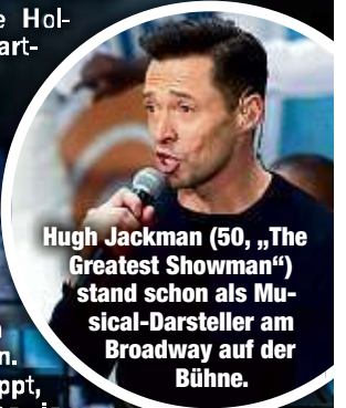
Hugh Jackman (50, „The Greatest Showman“) stand schon als Musical-Darsteller am Broadway auf der Bühne.

LOS ANGELES - Swing ist genau sein Ding, und deshalb will Robbie Williams (44) ein drittes Album dieser Art veröffentlichen. Dafür holt er sich auch einige Hollywood-Stars als Duett-Partner ins Boot. Wie der „Mirror“ berichtet, sollen unter anderem Hugh Jackman (50), Catherine Zeta-Jones (49), Reese Witherspoon (42) und Sacha Baron Cohen (47) mit dabei sein - alles Stars, die bereits auch in ihren Filmen selbst gesungen haben. Und dass diese Kombi klappt, hat Robbie schon 2001 bewiesen: Damals trällerte er gemeinsam mit Nicole Kidman (51) den Sinatra-Song „Somethin' stupid“ und landete glatt einen Nummer-eins-Hit.