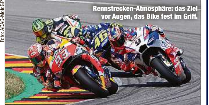
Rennstrecken-Atmosphäre: das Ziel vor Augen, das Bike fest im Griff.