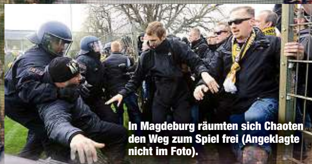
In Magdeburg räumten sich Chaoten den Weg zum Spiel frei (Angeklagte nicht im Foto).