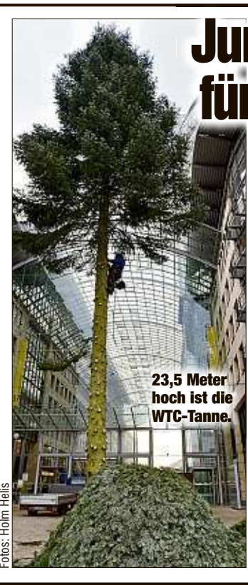
23,5 Meter hoch ist die WTC-Tanne.

Gestern gab es lecker WTC-Tanne für die Elis im Zoo. Das Mega-Bäumchen war zuvor in „handliche“ Stücke zerlegt worden. Drumbo, Mogli und Callboy Tembo ließen es sich auch sogleich schmecken. Nur Sawu zog bei dem schlechten Wetter das Heu im Afrikahaus vor.