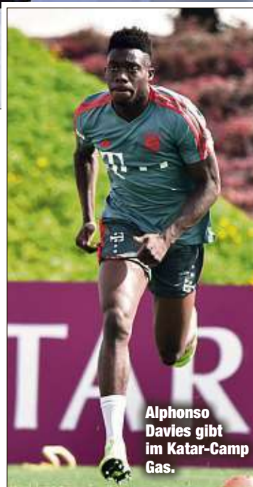
Alphonso Davies gibt im Katar-Camp Gas.

Das soll sich bald ändern. „Phonzy“, das Ausnahmetalent, kommt mit der Empfehlung von acht Toren und zehn Vorlagen in 31 Spielen der abgelaufenen MLS-Saison.