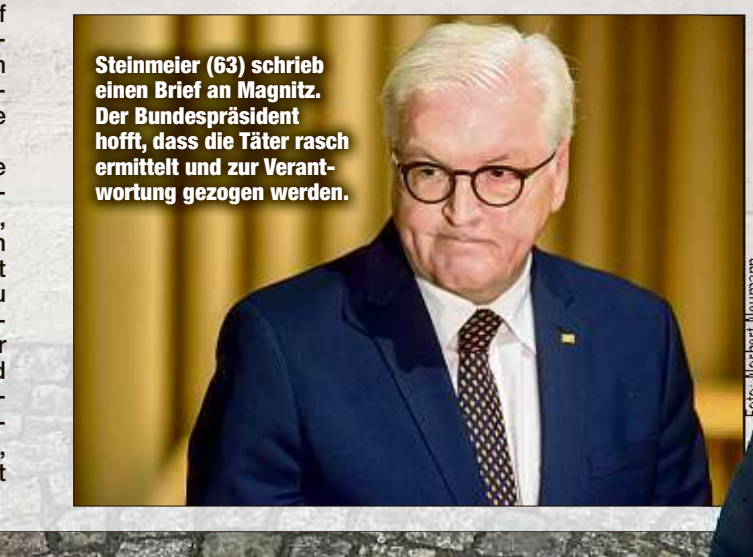
Steinmeier (63) schrieb einen Brief an Magnitz. Der Bundespräsident hofft, dass die Täter rasch ermittelt und zur Verantwortung gezogen werden.