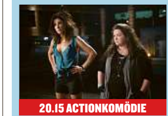
20.15 ACTIONKOMÖDIE Taffe Mädels Die überkorrekte FBI-Agentin Sarah (Sandra Bullock, l.) und die unkonventionelle Bostoner Polizistin Shannon (Melissa McCarthy)...