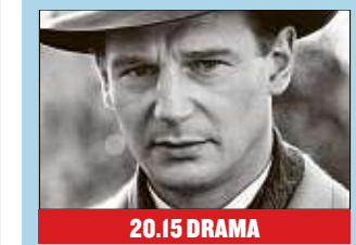
20.15 DRAMA Schindlers Liste Oskar Schindler (Liam Neeson) beschäftigt 1939 in seiner Fabrik in Krakau viele jüdische Zwangsarbeiter...