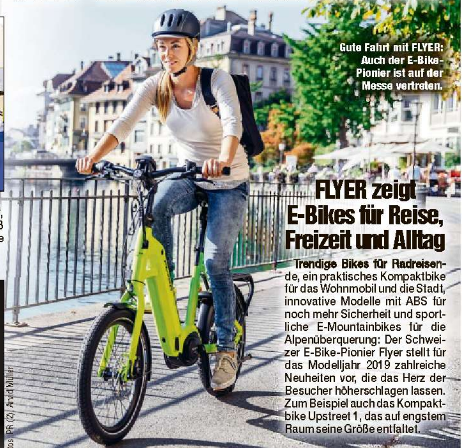
Gute Fahrt mit FLYER: Auch der E-Bike-Pionier ist auf der Messe vertreten.