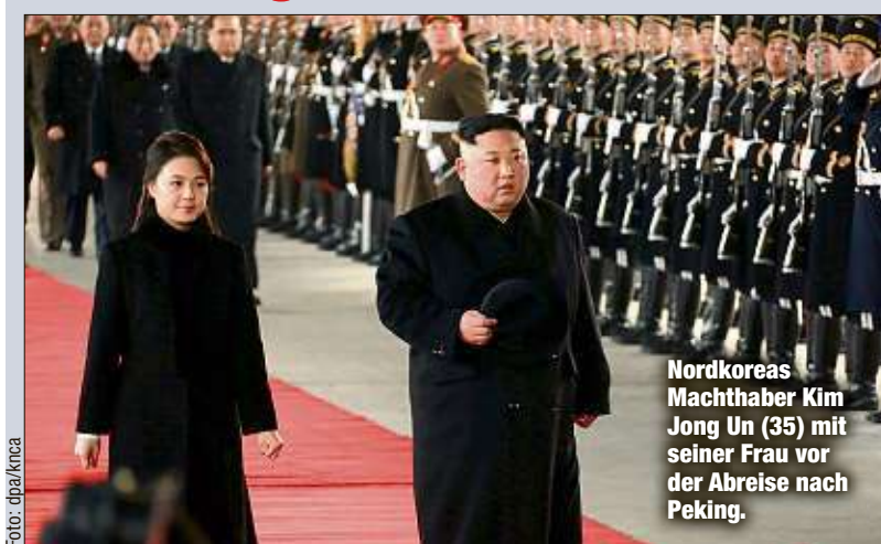
Nordkoreas Machthaber Kim Jong Un (35) mit seiner Frau vor der Abreise nach Peking.

PEKING - Nordkoreas Machthaber Kim Jong Un (35) ist zu einem überraschenden Besuch in China eingetroffen. Bei seiner vierten Visite bei dem großen Nachbarn will sich Kim mit Chinas Staats- und Parteichef Xi Jinping (65) vor seinem geplanten zweiten Gipfeltreffen mit US-Präsident Donald Trump (72) abstimmen. Der Besuch erfolgt vor dem Hintergrund der stockenden Verhandlungen zwischen den USA und Nordkorea über eine atomare Abrüstung des isolierten stalinistischen Staates, der unter massiven internationalen Sanktionen leidet. Nachdem ein mysteriöser Sonderzug über die Grenze bei Dandong nach China gefahren war, bestätigten beide Regierungen den Besuch. Nordkoreas Machthaber feierte gestern auch Geburtstag. Es wird angenommen, dass er 35 Jahre alt wurde. Sein Geburtsjahr ist unklar.