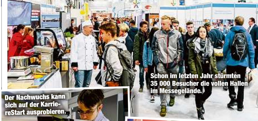
Schon im letzten Jahr stürmten 35 000 Besucher die vollen Hallen im Messegelände.