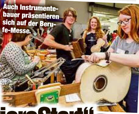
Auch Instrumentenbauer präsentieren sich auf der Berufsmesse.