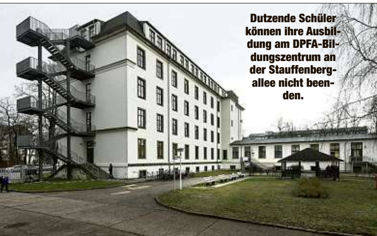
Dutzende Schüler können ihre Ausbildung am DPFA-Bildungszentrum an der Stauffenbergallee nicht beenden.

Aufregung am Bildungszentrum Dresden an der Stauffenbergallee! Dutzende Schüler können dort ihre bereits begonnene Ausbildung nicht beenden, müssen die Schule wechseln.