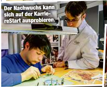
Der Nachwuchs kann sich auf der KarriereStart ausprobieren.