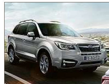
Der Forester wird aufgewertet.

Zum Modelljahr 2019 hat Subaru das Ausstattungsangebot für den Forester umgestrickt. Mit der künftig mindestens 32 000 Euro teuren Basisversion Active+ steigt der Einstiegspreis zwar, im Gegenzug erhält der Kunde dafür diverse Komfort Extras, darunter 2-Zonen-Klimaautomatik, Rückfahrkamera und das Sicherheitspaket Eyesight mit Kollisionsverhinderer und Spurhalteassistent.