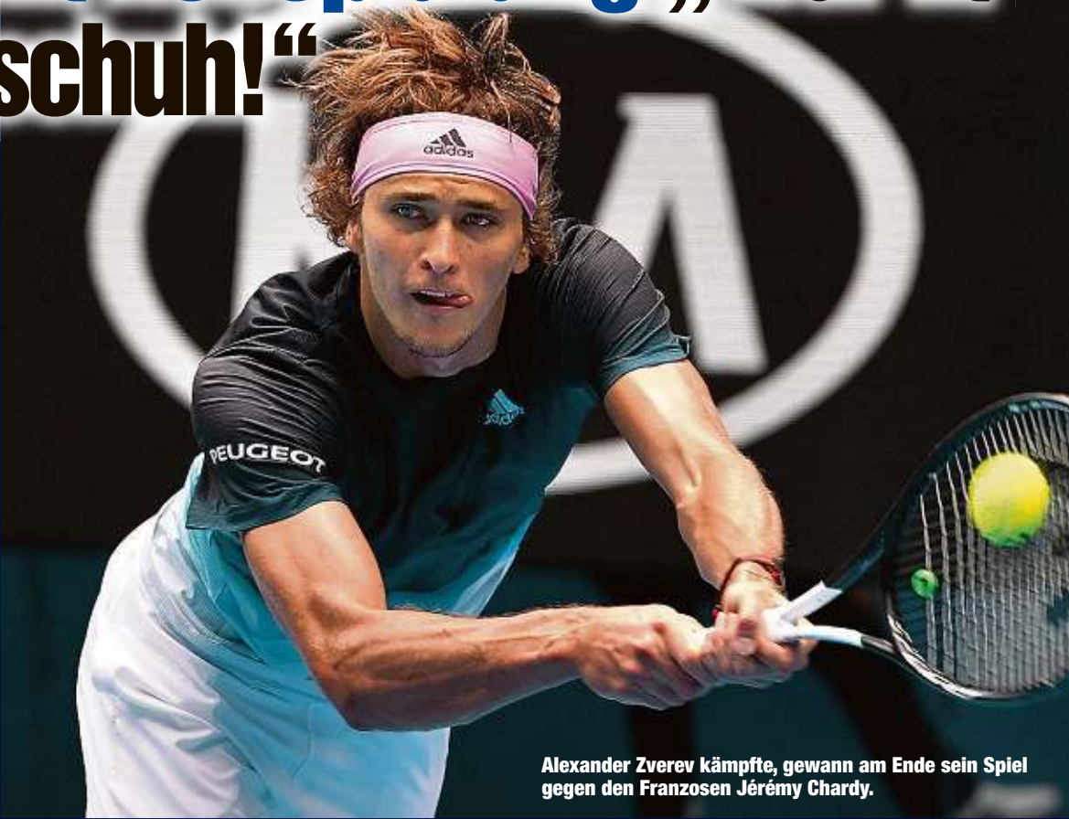
Alexander Zverev kämpfte, gewann am Ende sein Spiel gegen den Franzosen Jérémy Chardy.