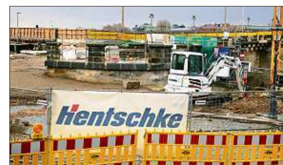
Die Hentschke Bau GmbH aus Bautzen hat der AfD großzügig Geld gespendet.

Insgesamt am meisten Spenden bekam die CDU mit 35 Millionen Euro, gefolgt von der FDP mit 15 Mio. Euro. Die AfD erhielt insgesamt 6,8 Mio. Euro Spenden. mor