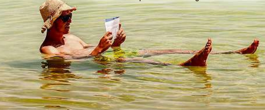
Das Tote Meer zwischen Israel, Westjordanland und Jordanien. Baden in dem salzigen Gewässer ist gut bei Hautkrankheiten. Die Kulturgeschichte rund um das Tote Meer soll im Herbst im smac lebendig werden.