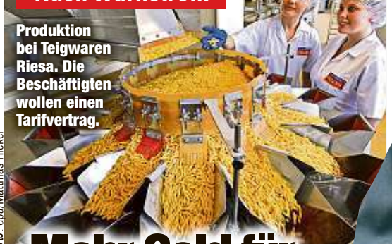
Produktion bei Teigwaren Riesa. Die Beschäftigten wollen einen Tarifvertrag.