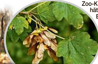
Der Verzehr von Bergahorn-Früchten wurde den Tieren zum Verhängnis.

„In den Früchten des Bergahorns hat sich durch den heißen Sommer mehr Gift eingelagert als sonst“, erklärte der Kurator. Als die Tiere Muskelzittern bekamen und zusammenbrachen, war's schon zu spät. „Die beiden Kühe starben, den Hirsch mussten wir am Tag darauf einschläfern“, so Hendel. Der Kurator plant, noch in diesem Jahr wieder Davidshirsche nach Dresden zu holen. tnl