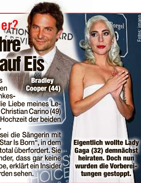
Bradley Cooper (44)

Laut der Zeitschrift „Life & Style“ sei die Sängerin mit dem ganzen Trubel um ihren Film „A Star Is Born“, in dem sie mit Cooper ein Liebespaar spielt, total überfordert. Sie habe solch einen vollen Terminkalender, dass gar keine Zeit für die Hochzeitsplanungen bleibe, erklärt ein Insider dem Blatt. Nur eine Ausrede? Wir werden sehen.