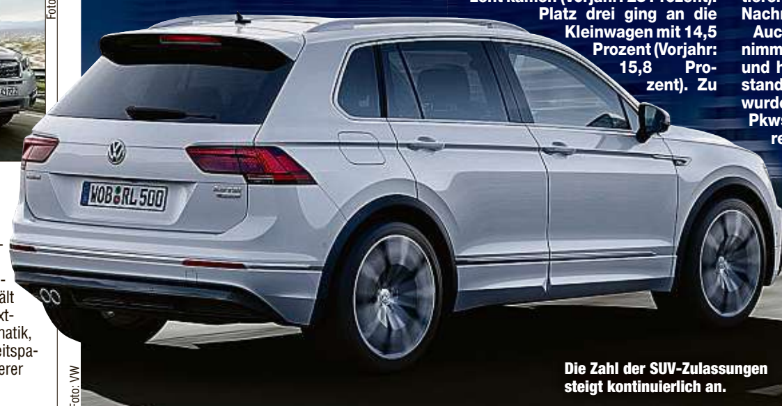
Die Zahl der SUV-Zulassungen steigt kontinuierlich an.

Auch die Zahl der Cabrios nimmt kontinuierlich ab und hat 2018 einen neuen Tiefstand erreicht. Deutschlandweit wurden lediglich 75 469 offene Pkws neu zugelassen. Erfolgreichstes Modell war das Mini Cabrio mit 8632 Neuzulassungen. Im Vorjahrlag die Zahl der neuen Cabrios noch bei 83 598 Einheiten.