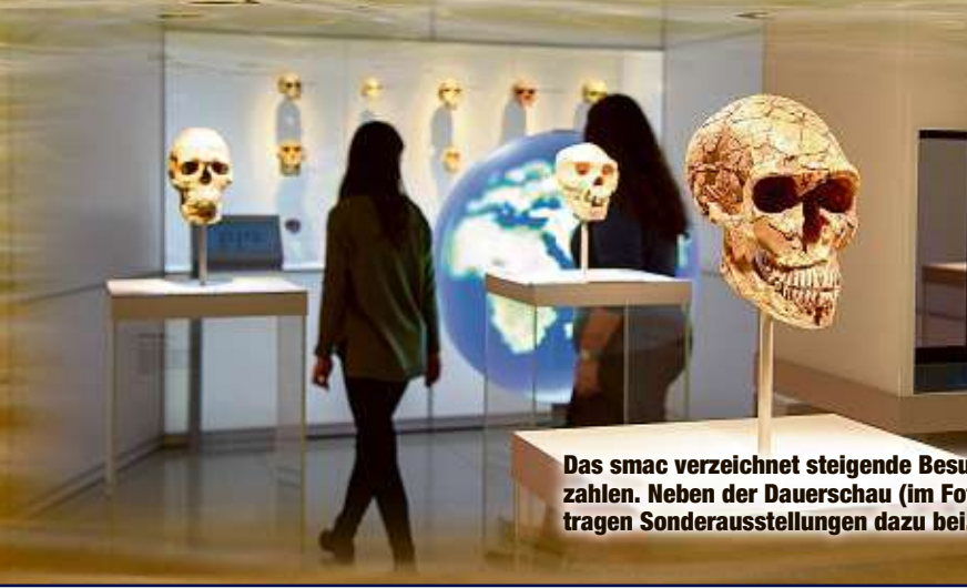
Das smac verzeichnet steigende Besucherzahlen. Neben der Dauerschau (im Foto) tragen Sonderausstellungen dazu bei.