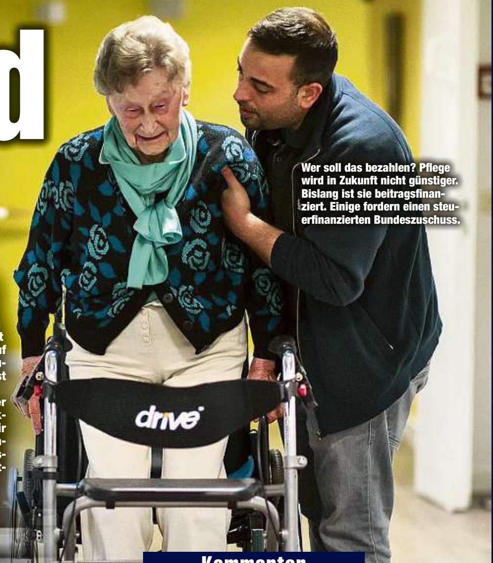
Wer soll das bezahlen? Pflege wird in Zukunft nicht günstiger. Bislang ist sie beitragsfinanziert. Einige fordern einen steuerfinanzierten Bundeszuschuss.