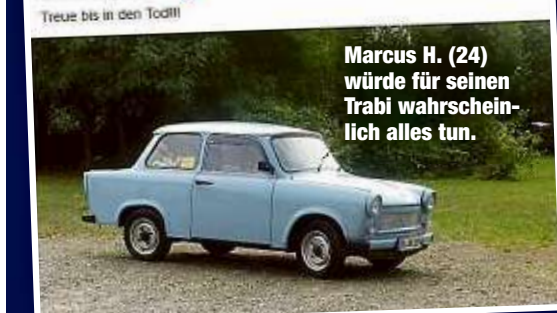
Marcus H. (24) würde für seinen Trabi wahrscheinlich alles tun.

Hätte das mal der einschlägig polizeibekannt Diab und Betrüger (35) gewusst, der sich um 0,30 Uhr an den Wagen im Niedersel-dewitzer Weg schlich.