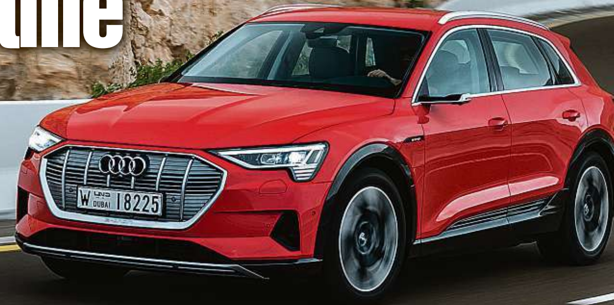
Audi feiert Premiere bei den reinen Elektroautos.

Motoren: zwei Asynchron-Elektromotoren, vorderer E-Motor: Leistung 125 kW/175 PS, Drehmoment 247 Nm, hinterer E-Motor: Leistung 140 kW/190 PS, Drehmoment: 314 Nm, Boost-Modus: Leistung 300 kW/409 PS, Drehmoment: 664 Nm, 0-100 km/h: 5,7 s im Boost-Modus, Spitze: 200 km/h, Batteriekapazität: 95 kWh, Reichweite nach WLTP: ca. 400 km, Ladezeit: ca. 8,5 h (11 kW), ca. 30 min (150 kW), CO 2 -Ausstoß: 0, Effizienzklasse A+, Preis: ab 79 900 Euro