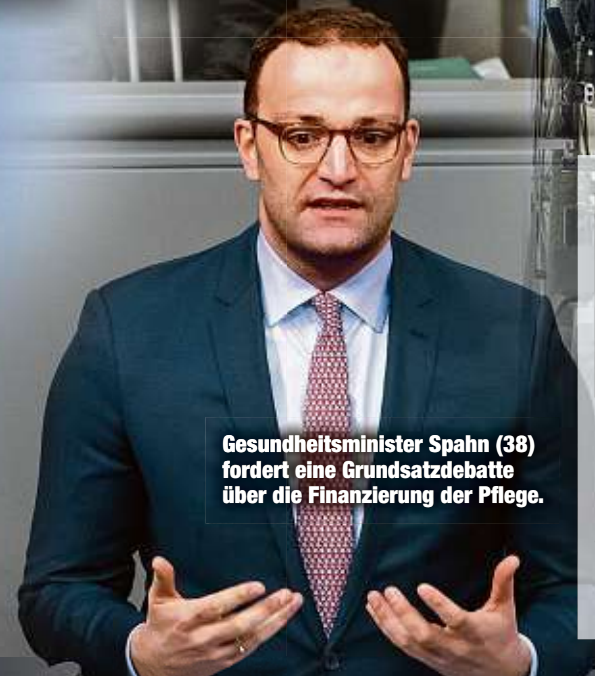
Gesundheitsminister Spahn (38) fordert eine Grundsatzdebatte über die Finanzierung der Pflege.