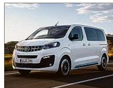
Der neue Zafira bietet neun Personen Platz.

Die neue Generation des Opel Zafira ist kein Kompakt-Van mehr. Im Februar kommt die vierte Auflage des traditionsreichen Modells als ausgewachsener Bus für bis zu neun Passagiere auf den Markt. Die technische Basis stammt von den Konzerngeschwistern Peugeot Traveller und Citroën Spacetourer. Preise nannte der Hersteller noch nicht.