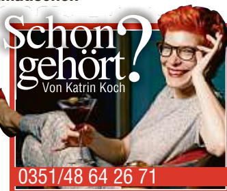
Schon gehört? Von Katrin Koch