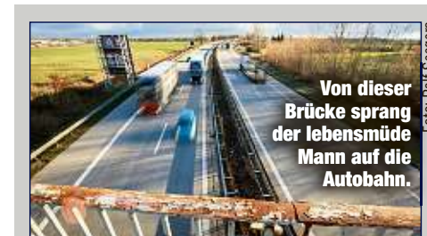
Von dieser Brücke sprang der lebensmüde Mann auf die Autobahn.