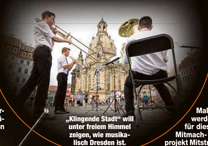
„Klingende Stadt“ will unter freiem Himmel zeigen, wie musikalisch Dresden ist.

Schlemmers 1922 uraufgeführtem „Triadischen Ballett“ erwiesen. Die zwei für den 7. und 8. Juni um jeweils 20 Uhr im Schauspielhaus geplanten Vorstellungen waren schnell ausverkauft. Vor wenigen Tagen wurde eine zusätzliche dritte angekündigt, am 8. Juni um 16 Uhr. „Für die gab es eine Warteliste, die Hälfte der Karten ist schon weg“, sagt Künanz. Trotz des vorhandenen Runs werde es darüber hinaus