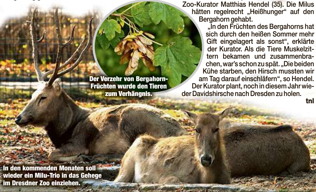
In den kommenden Monaten soll wieder ein Milu-Trio in das Gehege im Dresdner Zoo einziehen.