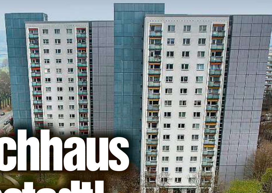
Das hätte das erste WID-Hochhaus sein können. Die Pläne wurden im Rat gestoppt.

WID-Chef Steffen Jäckel (49) äußerte sich nicht. Fakt ist: Die Wid hat, um weitere Kosten zu sparen, einen Planungsstopp für den Bau verhängt.