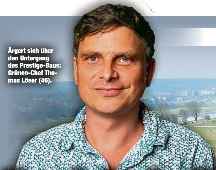
Ärgert sich über den Untergang des Prestige-Baus: Grünen-Chef Thomas Löser (46).