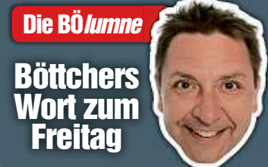
Die Bö lurnne Böttchers Wort zum Freitag

der Teilnehmer so anschau, fürchte ich, selbst bald dran zu sein.