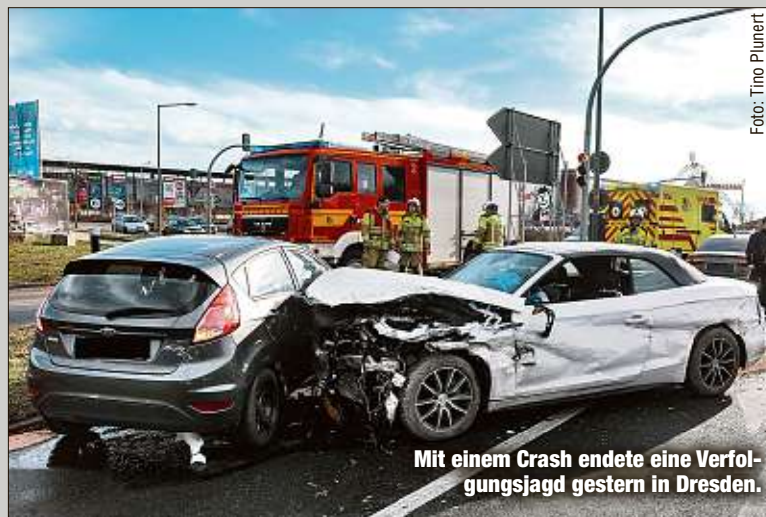
Mit einem Crash endete eine Verfolgungsjagd gestern in Dresden.

Ähnlich irre verhielt sich am Sonntag ein Simson-Fahrer (15) in Zittau: Am Nachmittag lieferte er sich 20 Minuten lang eine Verfolgungsjagd quer durch die Stadt. Mehrfach mussten Passanten in Sicherheit springen, auch ein Streifenwagen ging bei der Jagd zu Bruch. In Zittau ging der Bundespolizei noch ein weiterer Amok-Fahrer (22) ins Netz: Der hatte sich vergangenen Mittwochabend in einem VW Passat ohne Zulassung eine Jagd mit der Polizei geliefert, konnte zunächst nach Polen