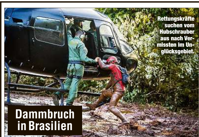
Rettungskräfte suchen vom Hubschrauber aus nach Vermissten im Unglücksgebiet.