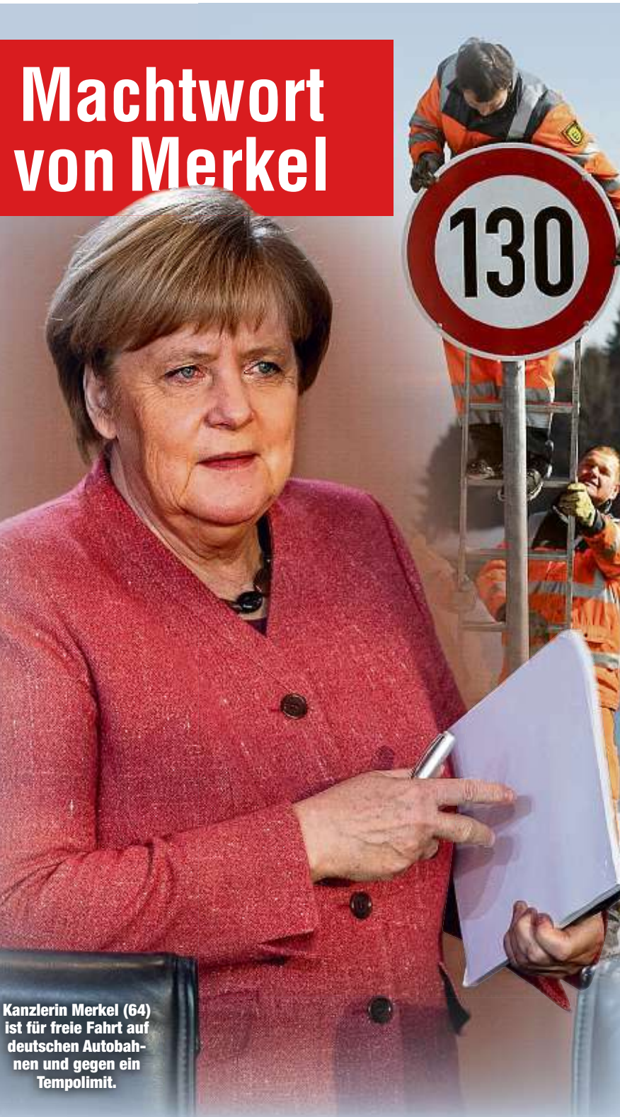
Kanzlerin Merkel (64) ist für freie Fahrt auf deutschen Autobahnen und gegen ein Tempolimit.