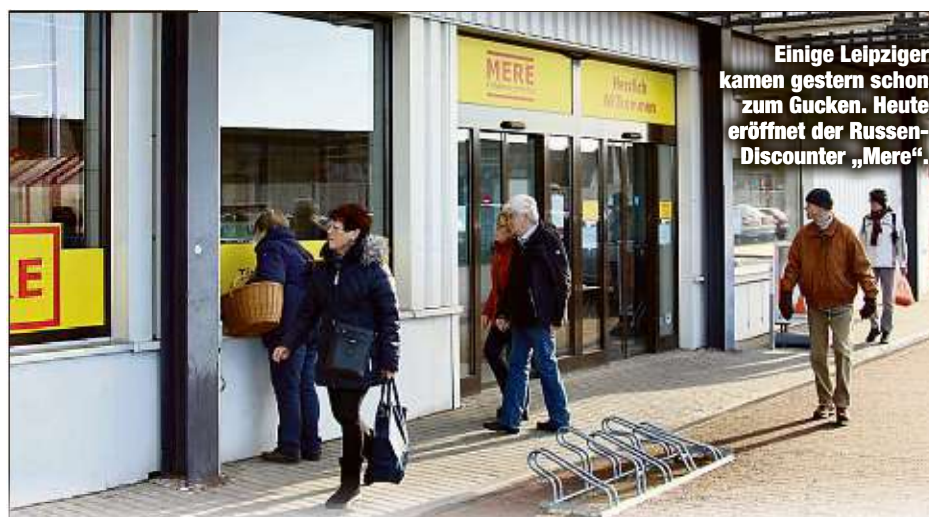
Einige Leipziger kamen gestern schon zum Gucken. Heute eröffnet der Russen-Discounter „Mere“.

Schöne neue Lausitz: Ein regelrechtes Radwege-Raster soll die Region noch attraktiver machen. Ebenso ein Fernradweg - hier ein Foto vom Radweg am Bärwalder See.