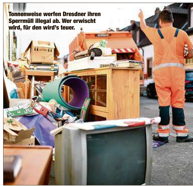
Tonnenweise werfen Dresdner ihren Sperrmüll illegal ab. Wer erwischt wird, für den wird's teuer.