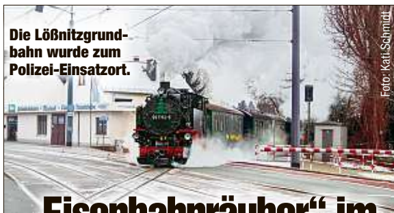
Die Löbnitzgrundbahn wurde zum Polizei-Einsatzort.

genau dieser Wagen vor der Polizei in Schwarzkollm. Der Fahrer konnte entkommen, das Auto blieb da. Im Kofferraum fand die Polizei eine Sauerstoffflasche, zwei Äxte und zwei Paar Handschuhe, vermutlich für Einbrüche gedacht. eho