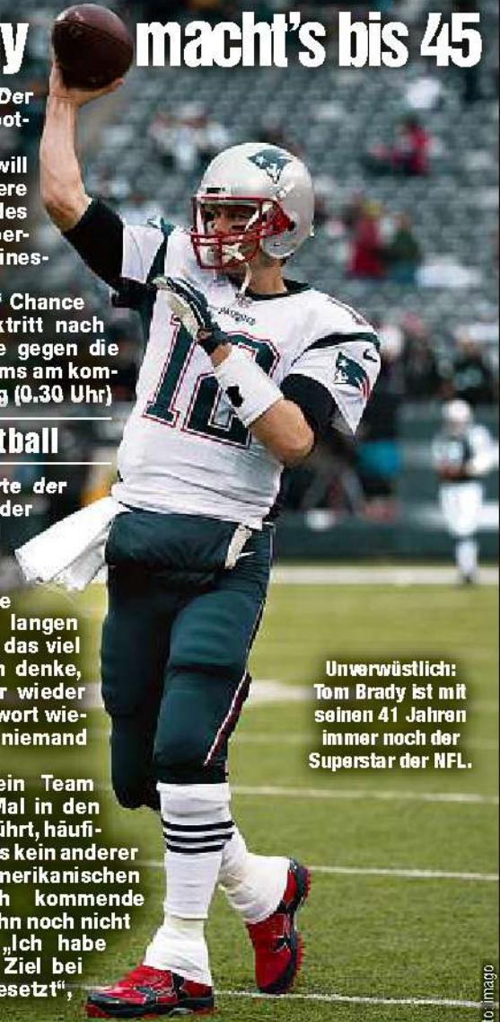
Unverwundlich: Tom Brady ist mit seinen 41 Jahren immer noch der Superstar der NFL.

Brady hat sein Team zum neunten Mal in den Super Bowl geführt, häufiger schaffte dies kein anderer Spieler der amerikanischen Profiliga. Auch kommende Saison soll für ihn noch nicht Schluss sein. „Ich habe mir selbst das Ziel bei 45 (Jahren) gesetzt“, sagte Brady.