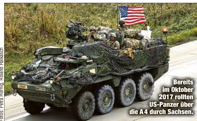
Bereits im Oktober 2017 rollten US-Panzer über die A4 durch Sachsen.

In der Nacht vom 30. zum 31. Januar wird der erste Konvoi auf dem Truppenübungsplatz Oberlausitz erwartet - hier wird