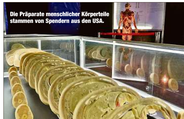
Die Präparate menschlicher Körperteile stammen von Spendern aus den USA.