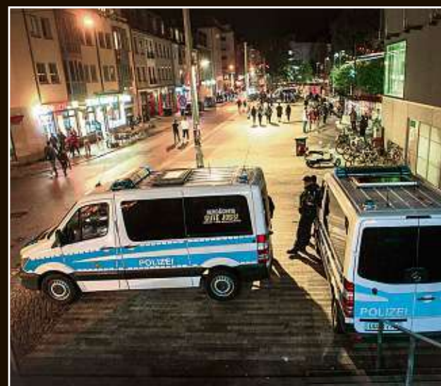
2018 rückte die Polizei zu 30 Großbesätzen in die Neustadt aus.