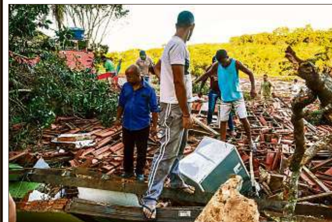
Bewohner der Katastrophengebiet suchen in den Schlammmassen nach ihren Habseligkeiten.

Wie es genau zu der Katastrophe kam, war zunächst unklar. Der TÜV Süd hatte die Dämme im vergangenen Jahr geprüft, wie das Unternehmen in München auf Anfrage bestätigte. „Wir werden die Ermittlungen vollumfänglich unterstützen und den Ermittlungsbehörden alle benötigten Unterlagen zur Verfügung stellen.“ Die Staatsanwaltschaft leitete eine Untersuchung ein, um die Verantwortlichen für das Unglück zu ermitteln.