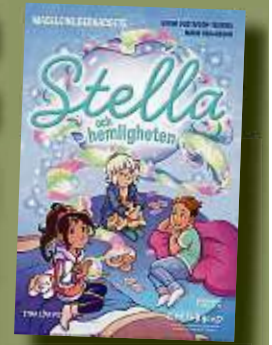
Das Buch „Stella och hemligheten“ erscheint Anfang Juni im Verlag Bonnier Carlsen.

STOCKHOLM - Ihr Herzenswunsch geht endlich in Erfüllung. Nachdem Prinzessin Madeleine von Schweden (36) bereits seit Jahren davon träumt, ein Kinderbuch zu veröffentlichen, ist es im Juni endlich soweit: Ihr Buch mit dem Titel „Stella och hemligheten“ (deutsch: Stella und das Geheimnis) erscheint. Madeleine sei sehr aufgeregt, ihren Fans endlich ein Buch zu präsentieren, das Kindern hoffentlich zeigt „wie wichtig es ist, für sich selbst einzustehen“, schreibt die Königstochter zu einem Instagram-Foto des Buchcovers.