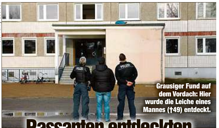
Grausiger Fund auf dem Vordach: Hier wurde die Leiche eines Mannes (†49) entdeckt.