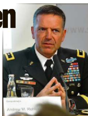
US-General Andrew M. Rohling bemüht sich um Transparenz bei den Truppenbewegungen.

übernimmt. Alle Kettenfahrzeuge werden mit der Bahn transportiert. Die Soldaten fliegen meist nach Polen. In die andere Richtung hätte der Transport bereits problemlos geklappt. Im September ist dann die nächste Rotation zurück geplant. Mit der Operation „Atlantic Resolve“ soll die US-Armee die NATO-Alliierten in Osteuropa stärken.