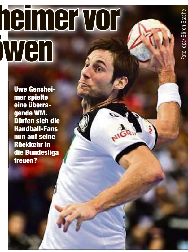
Uwe Gensheimer spielte eine überragende WM. Dürfen sich die Handball-Fans nun auf seine Rückkehr in die Bundesliga freuen?

weisende Entscheidung für die Rhein-Neckar Löwen. Die Rückkehr des Weltklasse-Linksaußen zu seinem Heimatverein hatte sich schon seit Monaten angedeutet. Gensheimer spielt aktuell noch für den französischen Spitzenklub Paris Saint-Germain. Seine Ehefrau und der gemeinsame Sohn sind von der französischen Hauptstadt aber schon wieder in die Region Mannheim umgezogen. „Uwe würde sehr gerne wieder für die Löwen spielen“, hatte sein Berater Uli Roth zuletzt gesagt. Zunächst wollte der DHB-Kapitän aber noch die Heim-WM abwarten. Nach dem Ende des Turniers und dem vierten Platz mit unserer Auswahl scheint der Zeitpunkt für die Bekanntgabe des Wechsels nun gekommen.