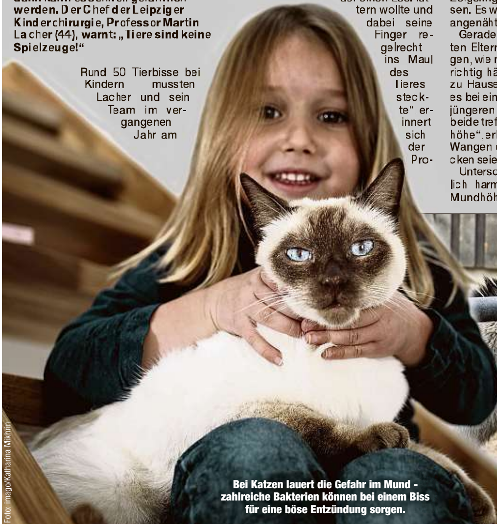
Bei Katzen lauert die Gefahr im Mund - zahlreiche Bakterien können bei einem Biss für eine böse Entzündung sorgen.

deres Spektrum von seltenen Bakterien auf, weiß Lacher. „Ein besonders hohes Infektionsrisiko besteht bei Bissverletzungen durch Katzen.“ Etwa jeder zweite Katzenbiss führt zu einer Infektion, die unbehandelt zu einer lebensgefährlichen Blutvergiftung führen kann. Kinderchirurg Lacher sieht vor allem die Eltern in der Pflicht, ihre Kinder zu sensibilisieren: „Tiere sind keine Spielzeuge - die Kleinen sollten wissen, wie und wann man sich einem Tier nähert und wann besser nicht.“ -bi.-