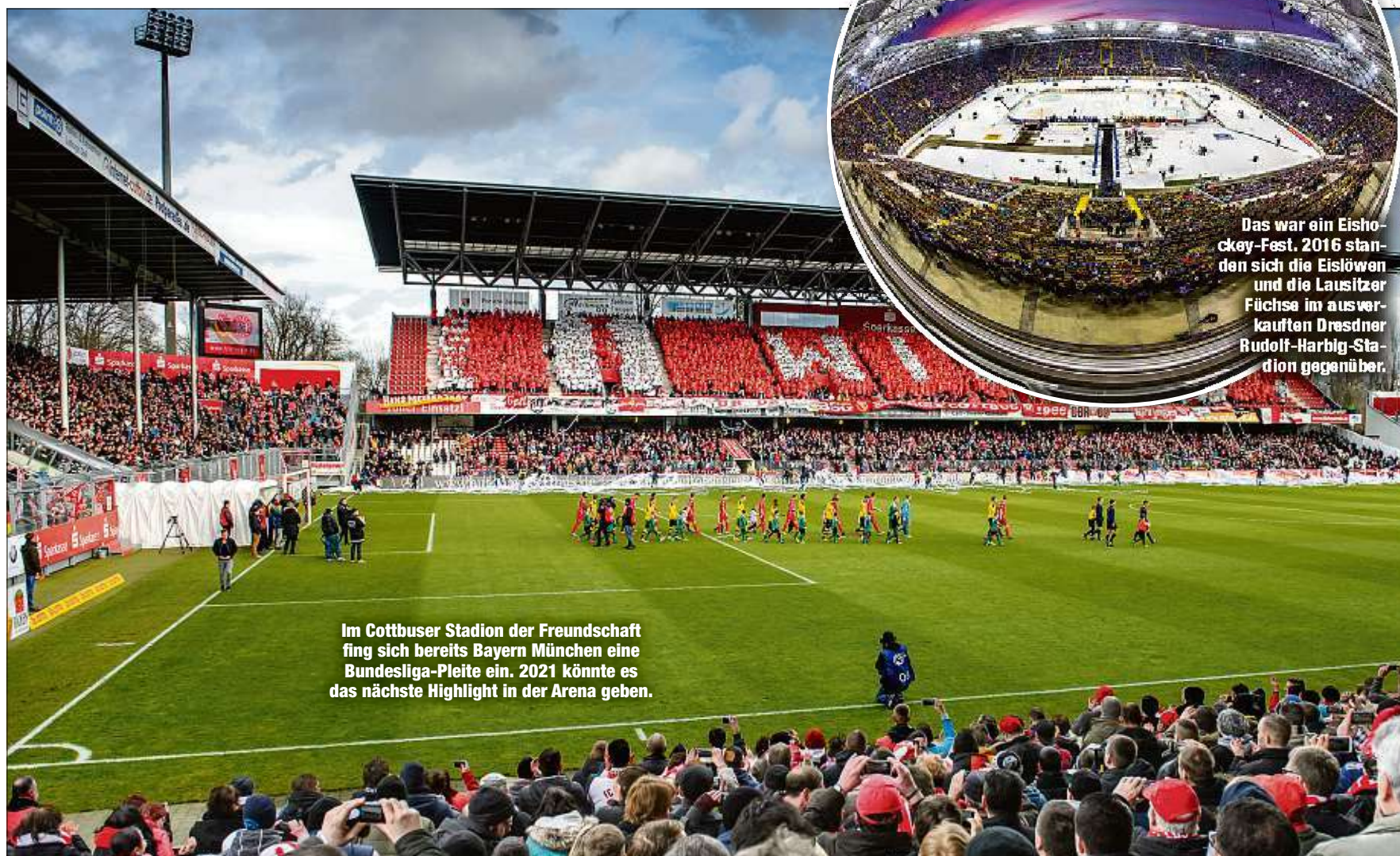
Im Cottbuser Stadion der Freundschaft fing sich bereits Bayern München eine Bundesliga-Pleite ein. 2021 könnte es das nächste Highlight in der Arena geben.

mien sind ja in den Verträgen fixiert, aber ab und an lege ich aus meiner privaten Tasche etwas in die Mannschaftskasse und auch der eine oder andere Sponsor - die Spieler freut es.“ Erfolg zahlt sich eben aus - für beide Seiten. Immerhin füllt das Team mit seiner Leistung auch den Fuchsbau jedesmal sehr, sehr ordentlich. Der Zuschauer-schnitt liegt derzeit bei 2434 Fans. Und dass, wo nur maximal 2979 reinpassen ... elu