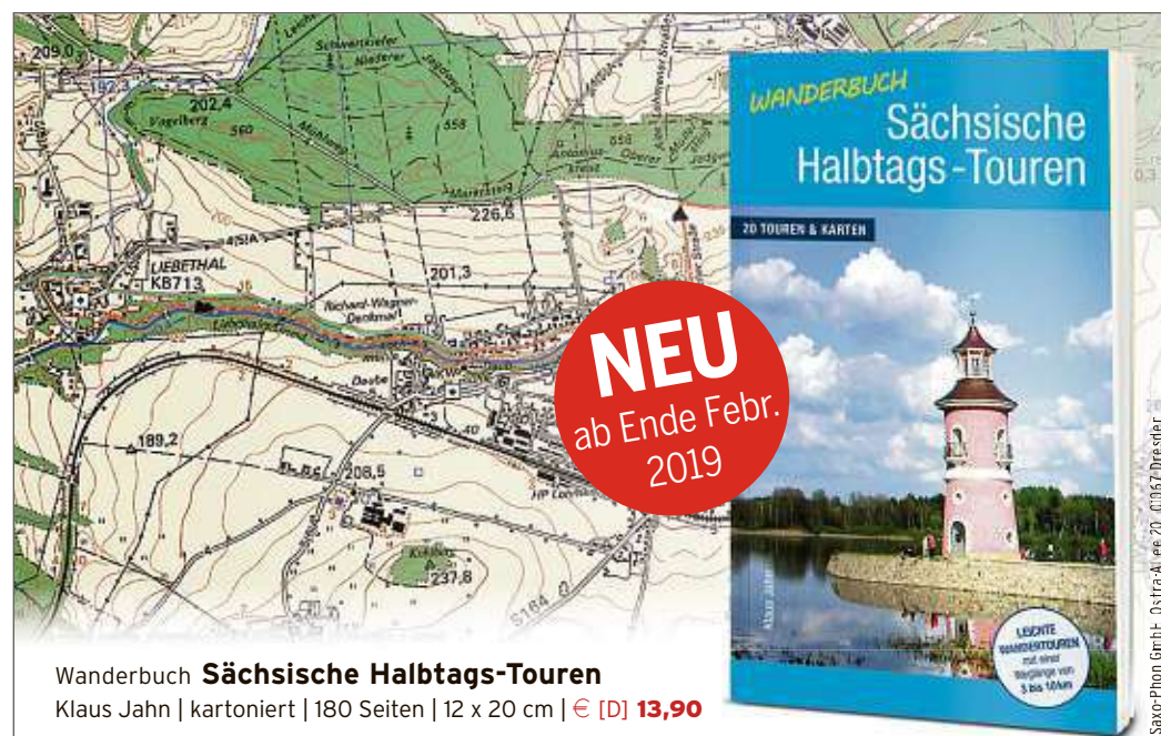
Wanderbuch Sächsische Halbtags-Touren Klaus Jahn | kartoniert | 180 Seiten | 12 x 20 cm | € [D] 13,90

Grenzen überwinden Vielfalt gestalten Helfen Sie uns dabei! Mit Ihrer Spende helfen Sie uns, ein leereswertes und gleichberechtigtes Miteinander der verschiedenen Kulturen hier in Dresden aktiv zu gestalten. www.auslaenderrat.de Ausländerrat Dresden e.V.