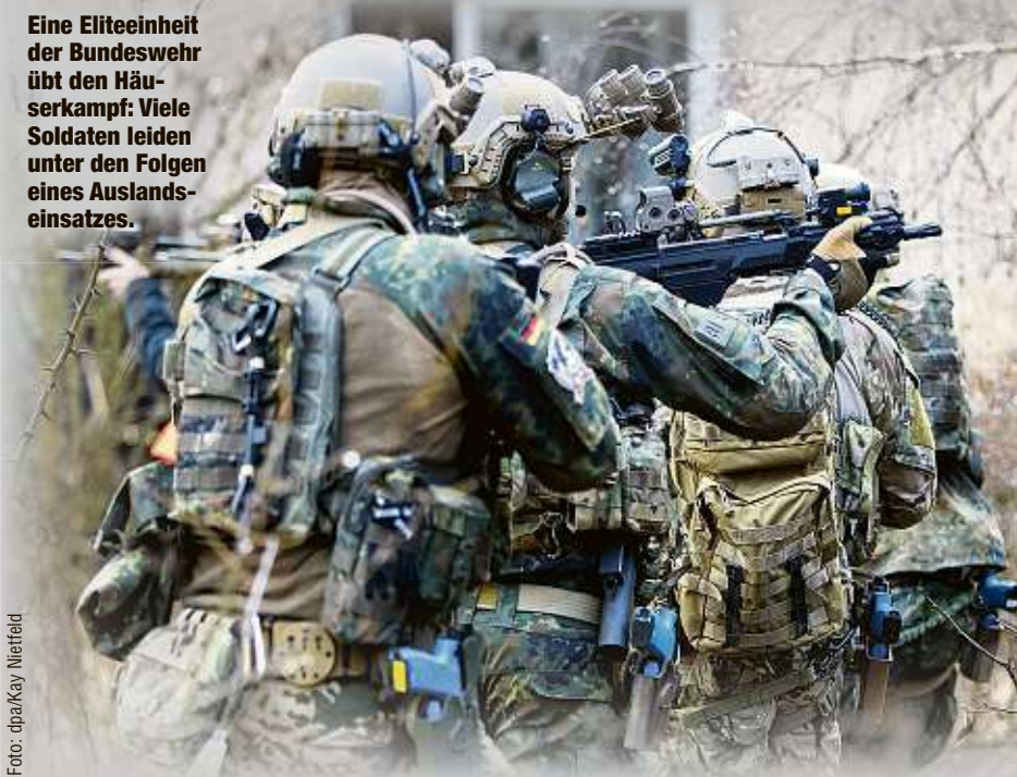
Eine Eliteeinheit der Bundeswehr übt den Häuserkampf: Viele Soldaten leiden unter den Folgen eines Auslandseinsatzes.