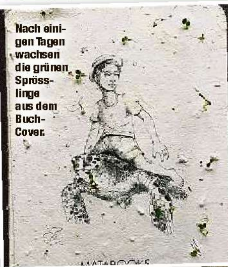
Nach einigen Tagen wachsen die grünen Sprosslinge aus dem Buch-Cover.