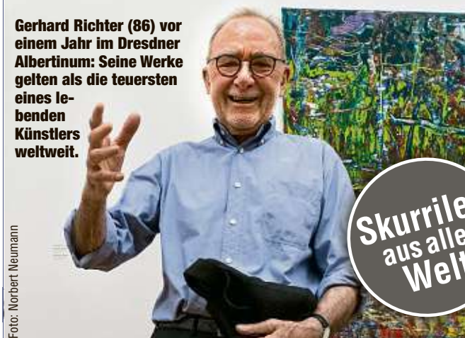
Gerhard Richter (86) vor einem Jahr im Dresdner Albertinum: Seine Werke gelten als die teuersten eines lebenden Künstlers weltweit.