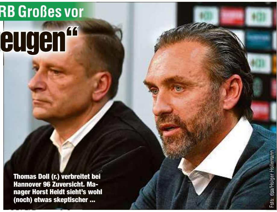
Thomas Doll (r.) verbreitet bei Hannover 96 Zuversicht. Manager Horst Heldt sieht's wohl (noch) etwas skeptischer ...

Beim Kellerkind 96 will er schnell eine „Aufbruchstimmung erzeugen. Nicht mit Parolen, sondern mit Arbeit und Zuversicht“ will der Nachfolger von André Breitenreiter die Niedersachsen nach acht Spielen ohne Sieg aus der Krise führen. Doll hat 15 Spiele Zeit für die „Mission Klassenerhalt“. Sein Debüt auf der 96-Bank feiert er am Freitagabend gegen den RB Leipzig. „Jetzt werden wir die Trainingseinheiten so planen, dass wir mit einer anderen Zuversicht und einem anderen Gesicht ins Spiel reingehen.“