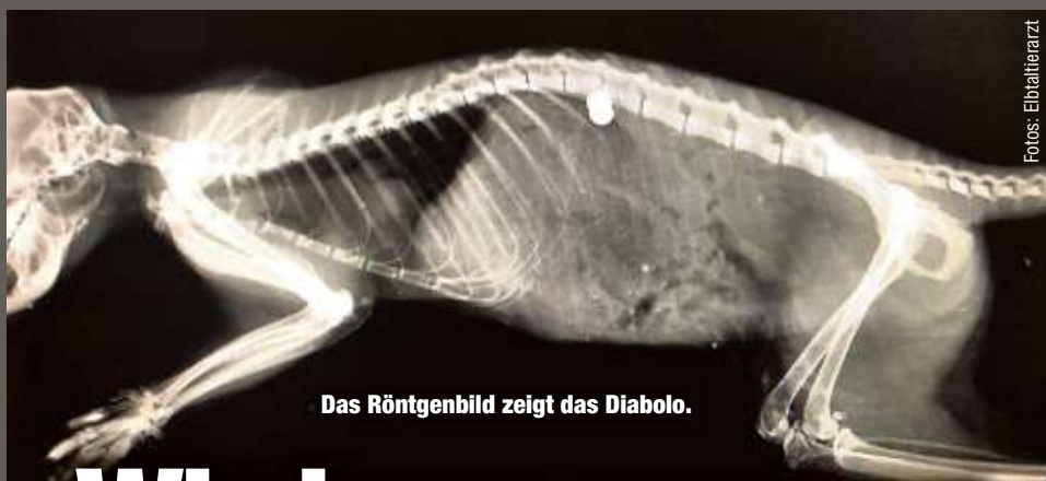
Das Röntgenbild zeigt das Diabolo.