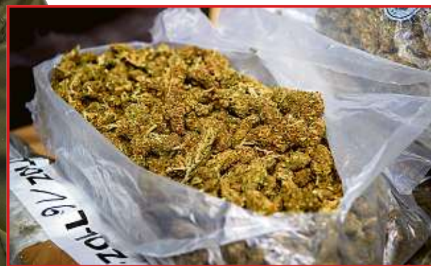
Marihuana verscherbelte der Dealer kiloweise.

Unklar ist auch, ob es im sächsischen Maßregelvollzug überhaupt Therapiemöglichkeiten für so betagte „Junkies“ gibt. „Notfalls muss für ihn ein spezielles Konzept erstellt werden“, erklärte der Richter schon mal vorsorglich. Der Prozess wird fortgesetzt. sts