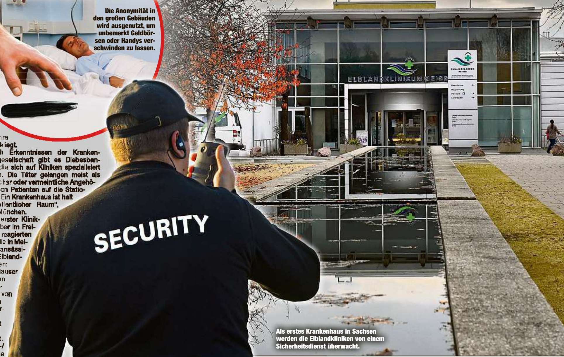
Als erstes Krankenhaus in Sachsen werden die Elblandkliniken von einem Sicherheitsdienst überwacht.

Als erster Klinikbetreiber im Freistaat reagierten jetzt die in Meibßen ansässigen Elblandkliniken: Ihre Häuser werden neuerdings von einem Sicherheitsdienst überwacht. -bi./dpa