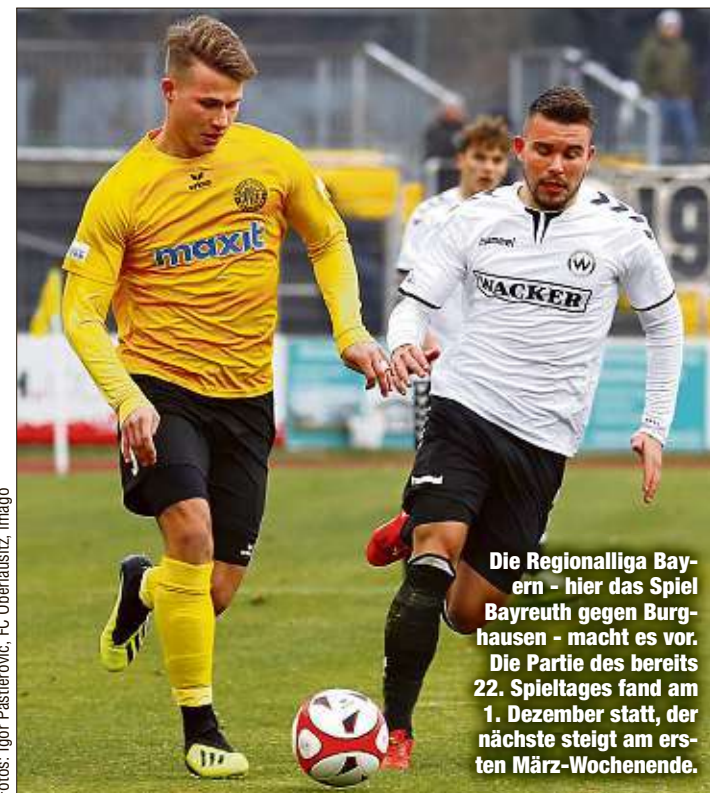
Die Regionalliga Bayern - hier das Spiel Bayreuth gegen Burg-hausen - macht es vor. Die Partie des bereits 22. Spieltages fand am 1. Dezember statt, der nächste steigt am ersten März-Wochenende.