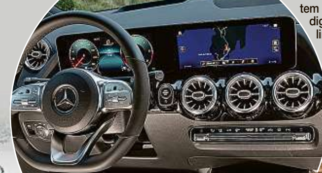
Auch das Cockpit wurde von der A-Klasse übernommen.

bewahrt. Das äußere Erscheinungsbild gleicht im Wesentlichen der Silhouette des Vorgängers, wobei die bislang scharfen seitlichen Falze weggeschliffen wurden. Innen ist dagegen alles anders.