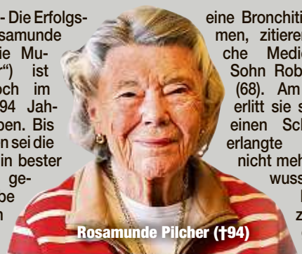
Rosamunde Pilcher (†94)