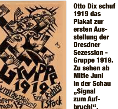
Otto Dix schuf 1919 das Plakat zur ersten Ausstellung der Dresdner Sezession - Gruppe 1919. Zu sehen ab Mitte Juni in der Schau „Signal zum Aufbruch!“.

Mauerfall vor 30 Jahren. Das Stadtmuseum versammelt zudem sowjetisches Spielzeugdesign und Klassiker der DDR aus Kunststoff zu einer deutsch-sowjetischen „Konferenz der Plastiktiere“. hn