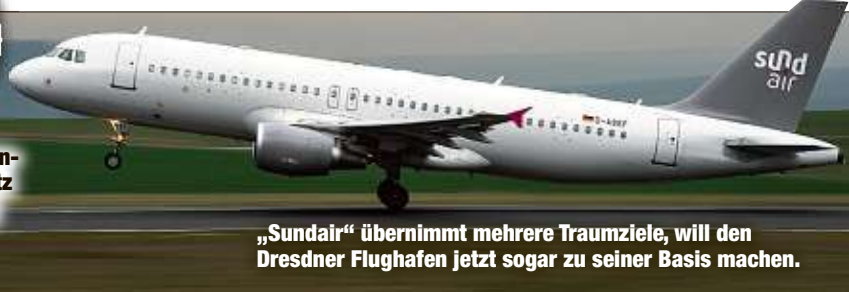
„Sundair“ übernimmt mehrere Traumziele, will den Dresdner Flughafen jetzt sogar zu seiner Basis machen.

wird zur neuen Basis“, teilte eine Sprecherin mit. „Sundair wird ab Sommer vier frühere Germania-Ziele anfliegen und dafür sorgen, dass Urlauber aus Dresden und dem Um-