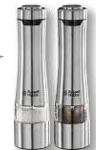
EDELSTAHL SALZ- UND PFEFFERMÜHLE „CLASSICS“ von RUSSELL HOBBS elektr., 2er-Set, mit Beleuchtung, Mahlgrad einstellbar, Batterien nicht enthalten Art.-Nr. 27242