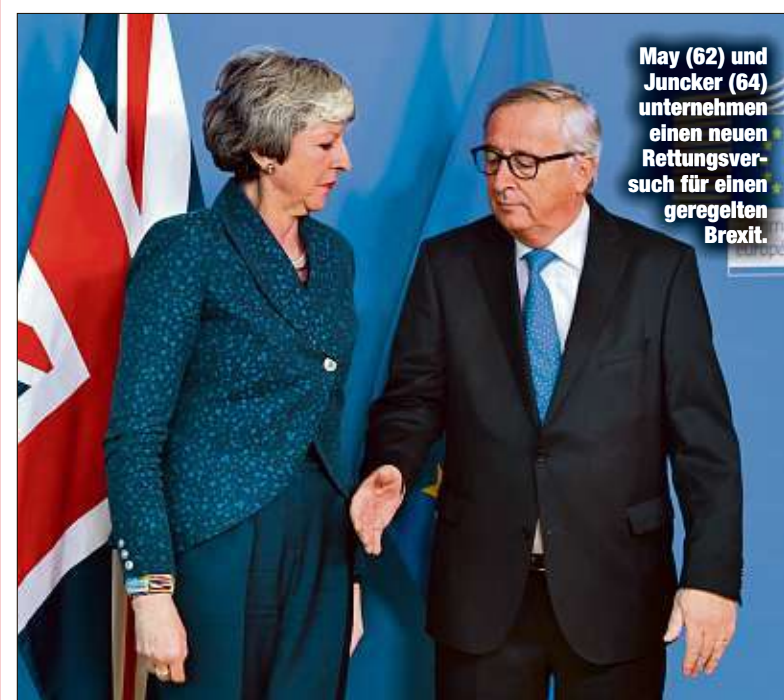
May (62) und Juncker (64) unternehmen einen neuen Rettungsversuch für einen geregelten Brexit.