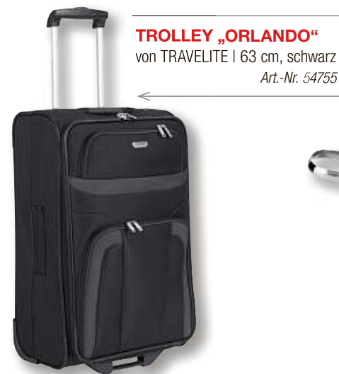
TROLLEY „ORLANDO“ von TRAVELITE | 63 cm, schwarz Art.-Nr. 54755