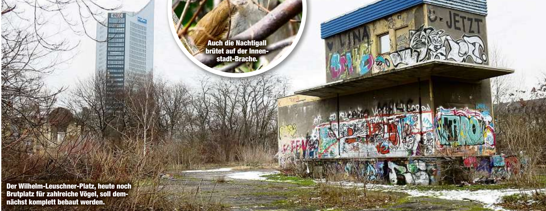
Der Wilhelm-Leuschner-Platz, heute noch Brutplatz für zahlreiche Vögel, soll demnächst komplett bebaut werden.

Brutplätze seit Jahren dokumentiert. Bereits 2016 wies der NABU die Stadtplaner auf die Nistflächen hin und bat um Berücksichtigung beim Architektenwettbewerb. Über den jetzigen Bau-Entwurf ist Sievert entsetzt: „Die Naturschutz-Kriterien spielten beim Wettbewerb keine Rolle - alles soll bebaut werden.“ Der NABU sieht darin einen eklatanten Verstoß gegen das Bundesnaturschutzgesetz. Gemeinsam mit dem BUND will der Verein dagegen vorgehen. „Notfalls auch vor Gericht“, so Sievert. Denn Leipzig hat laut NABU-Dokumentation seit Ende 2016 bereits rund 85 Hektar an Lebensraum für Singvögel und Insekten verloren, weil grüne Oasen Bauvorhaben weichen mussten. -bi-