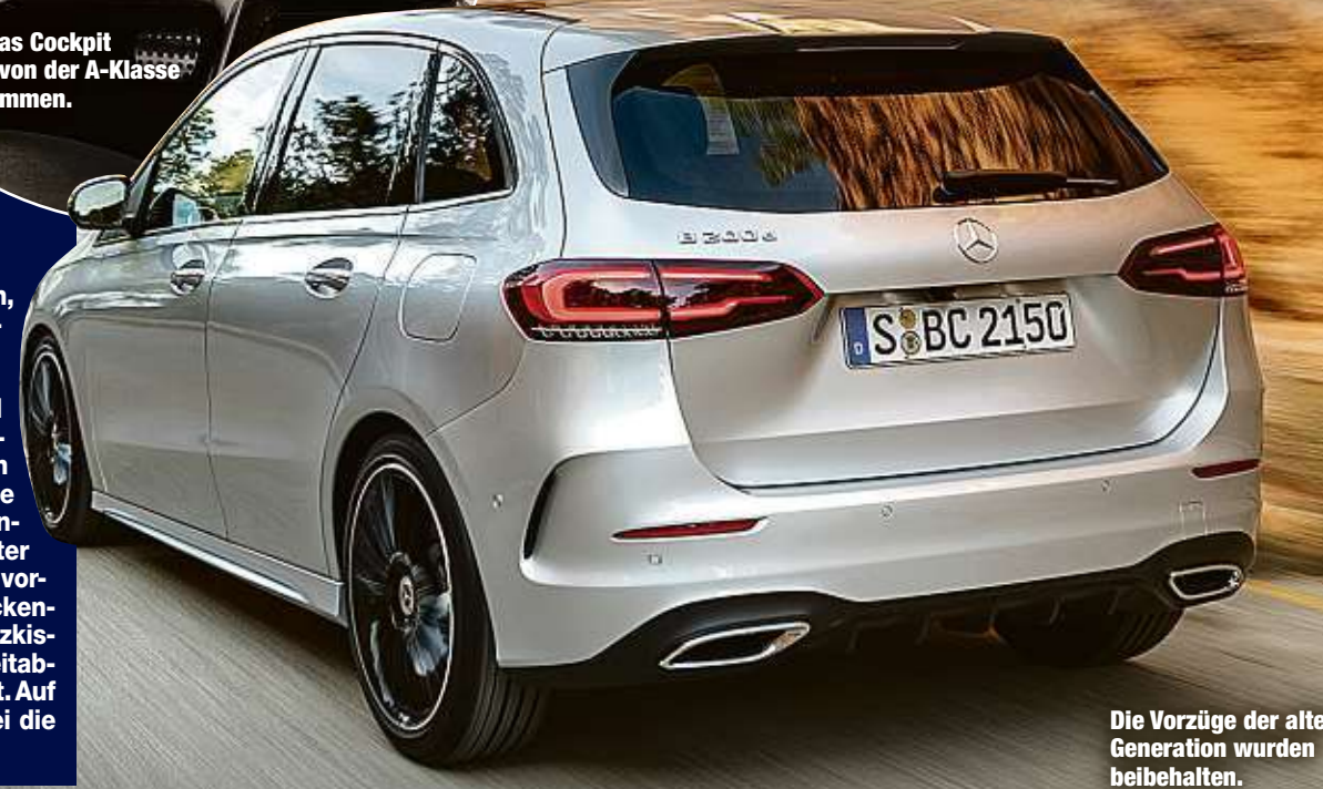
Die Vorzüge der alten Generation wurden beibehalten.

Für besondere Wellness soll ein System sorgen, das nunmehr auch in einem Mercedes-Kompaktmodell zu haben ist. Es nutzt Funktionen von Klimaanlage oder Sitzsteuerung und erzeugt je nach Laune der Mitfahrer spezielle Licht- und Musikstimmung. Wird das Programm „Freude“ gewählt, beginnt der Sitz mit einer gezielten Massage und wählt eine im Rhythmus passende Musik. Ist sich der Fahrer nicht über seine momentane Laune sicher, werden Verkehrslage, Wetter oder Fahrdauer analysiert und eine Stimmung vorgeschlagen. Ein weiteres Programm soll Rückenschmerzen bei längeren Fahrten vorbeugen. Sitzkissen und -lehnen werden dabei in bestimmten Zeitabständen um wenige Millimeter oder Grad verstellt. Auf dem rechten der beiden Monitore können dabei die Bemühungen der Elektronik verfolgt werden.