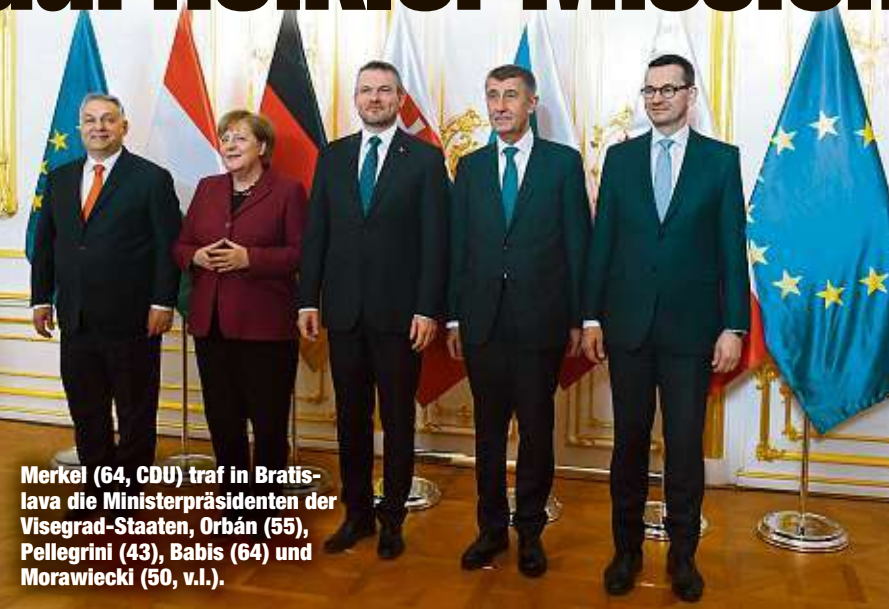
Merkel (64, CDU) traf in Bratislava die Ministerpräsidenten der Visegrad-Staaten, Orbán (55), Pellegrini (43), Babis (64) und Morawiecki (50, v.l.).

BRATISLAVA - Es war eine schwierige Reise. Doch selbst bei der Flüchtlingspolitik gab es freundliche Worte: Deutschland und die vier Visegrad-Staaten Polen, Ungarn, Tschechien und die Slowakei wollen nach jahrelangen Zwistigkeiten wieder enger zusammenarbeiten. Besonders auffällig war bei dem Treffen die Verständigung auf ein gemeinsames Entwicklungsprojekt in Marokko zur Bekämpfung von Fluchtursachen, zumal die Vierergruppe bisher die Flüchtlingspolitik von Bundeskanzlerin Angela Merkel (64, CDU) vehement ablehnte und sich einem Verteilungsschlüssel von Flüchtlingen in der EU widersetzt. Merkel sagte in der slowakischen Hauptstadt Bratislava bei einer gemeinsamen Pressekonferenz mit den Regierungs-Chefs der Gruppe, für sie sei das ein Beispiel, dass man auch in diesem Bereich enger zusammenarbeiten wolle.