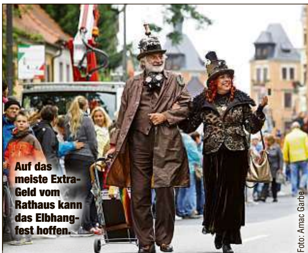
Auf das meiste Extrageld vom Rathaus kann das Elbhängfest hoffen.