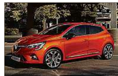
Völlig neu kommt der Clio im Sommer auf den Markt.

Nach sieben Jahren Bauzeit bringt Renault im Sommer einen neuen Clio an den Start. Außerlich bleibt der fünfte Clio dem Stil seines 2012 lancierten Vorgängers treu, unter dem Blechkleid des Fünftürers ist aber alles neu. Noch keine Informationen gibt es zu den Motoren. Ob es wie im aktuellen Clio einen Diesel geben wird, ist ebenso unklar. Die Preise dürften wie gehabt bei rund 13 000 Euro starten.