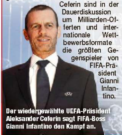
Der wiedergewählte UEFA-Präsident Aleksander Ceferin sagt FIFA-Boss Gianni Infantino den Kampf an.

Die starken Männer der Europäischen Fußball-Union wurden in Rom per Akklamation in ihren Ämtern für vier Jahre bestätigt - und der gemeinsame Kontrahent war nicht schwer zu erkennen. „Wir werden den Fußball schützen vor Projekten, bei denen es noch viele Fragen gibt“, sagte Ceferin und fügte an: „Ein Anführer ohne Zweifel ist ein irreführender und gefährlicher Anführer.“ Grindel und Ceferin sind in der Dauerdiskussion um Milliarden-Offerten und internationale Wettbewerbsformate die größten Gegenspieler von FIFA-Präsident Gianni Infantino.