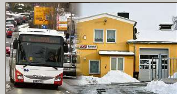
Solche Busse wurden über Nacht an dieser KVG-Filiale Opfer von Dieseldieben.

nicht zu dem Vorfall äußern, auch nicht, ob es deshalb zu Einschränkungen im Verkehr kam. eho