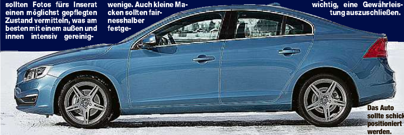
Das Auto sollte schick positioniert werden.

Beim Verkauf sollte man stets auf einen richtigen Kaufvertrag bestehen. Erst wenn der volle Kaufpreis bezahlt ist, sollte man Schlüssel und Papiere aushändigen. Um späteren Ärger zu vermeiden, ist es wichtig, eine Gewährleistung auszuschließen.