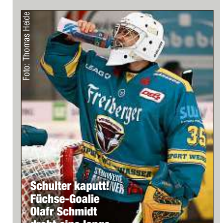
Schulter kaputt! Füchse-Goalie Olaf Schmidt droht eine lange Zwangspause.