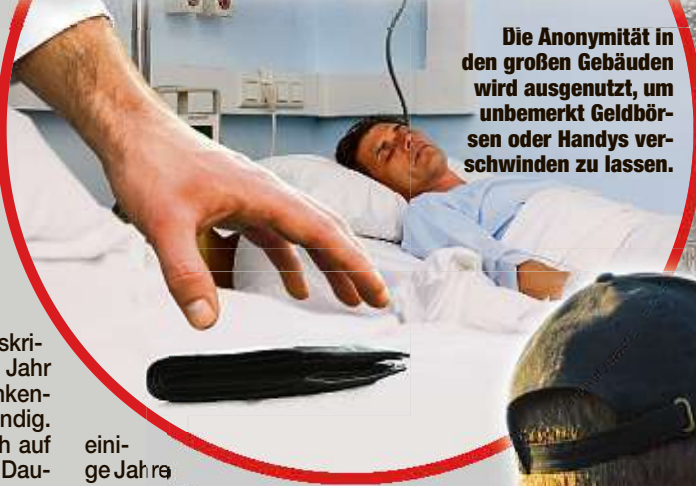
Die Anonymität in den großen Gebäuden wird ausgenutzt, um unbemerkt Geldbörsen oder Handys verschwinden zu lassen.

DRESDEN - Ob Geldbörsen, EC-Karten, Handys oder Ultraschallgeräte - in Sachsen Krankenhäusern wird gestohlen, was nicht nicht- und nagelfest ist. Die Langfinger nutzen die Anonymität in den oft ausgedehnten Gebäudekomplexen aus - und die Wehrlosigkeit der Patienten. Der Schaden geht in die Hunderttausende.