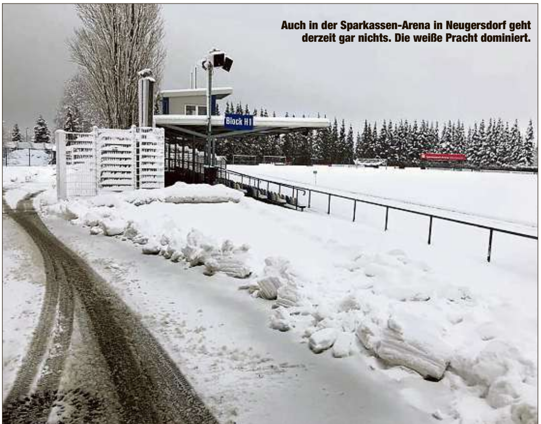
Auch in der Sparkassen-Arena in Neugersdorf geht derzeit gar nichts. Die weiße Pracht dominiert.

Man gibt den Bayern ja nie gern Recht, aber diese Regelung sorgt dafür, dass es zu keiner Flut an Absagen und zig englischen Wochen für die betroffenen Teams kommt. Unter der Woche spielen ist zwar schön, aber auch nicht auf Dauer - und es ist schwer für Amateurevereine wie den VfB. nahro