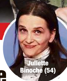
Juliette Binoche (54)

BERLIN - Was für ein bildhübsches Trio! Heike Makatsch (47), Andie MacDowell (60) und Iris Berben (68) haben gestern zum Start der Berlinale für reichlich Frauenpower und Glamour gesorgt. Als Markenbotschafterinnen der Kosmetikmarke L'Oréal Paris eröffneten die Damen ein Café, das die Gäste der Berlinale mit Leckereien verwöhnen soll. Doch natürlich werden bei den Filmfestspielen, die bis zum 17. Februar laufen, noch zahlreiche weitere prominente Gesichter erwartet, darunter die diesjährige Jurypräsidentin Juliette Binoche (54), Moritz Bleibtreu (47), Veronique Ferres (53) und Katja Riemann (55). Insgesamt konkurrieren 17 Produktionen um den Goldenen und die Silbernen Bären.