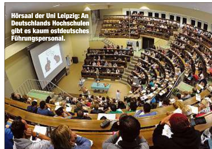
Hörsaal der Uni Leipzig: An Deutschlands Hochschulen gibt es kaum ostdeutsches Führungspersonal.

nicht viel geändert. Sein Erklärungsversuch: „Viele Ostdeutsche haben nicht den Habitus der Oberschicht, verfügen nicht über deren Geschmacksurteile und selbstbewusstes Auftreten.“