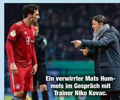
Ein verwirrter Mats Hummels im Gespräch mit Trainer Niko Kovac.

be irgendwie den Mittelweg gewählt. Das ist im Fußball meistens komplett falsch.“ Am Tag danach nahm sich Hummels selbst auf den Arm: Bei Instagram postete er ein Bild von sich mit ausgestreckten Armen, dazu schrieb er: „Ganz ruhig, ich seh' den Davie Selke schon. Oder auch nicht...“