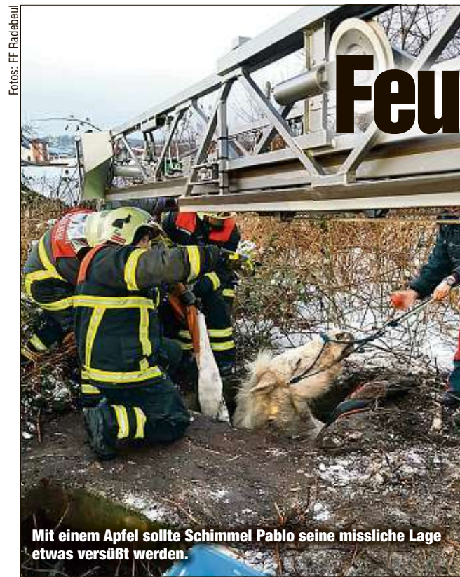
Mit einem Apfel sollte Schimmel Pablo seine missliche Lage etwas versüßt werden.

PIRNA - Städte und Dörfer, Häuser und Landschaften, die sich in Verbindung mit Richard Wagner (F.) während seiner Kindheitsjahre und seiner Zeit als Hofkapellmeister in Dresden bringen lassen, werden in der Sonderausstellung „Wo Wagner weilte - Häuser und Landschaften von Dresden bis Prag“ in den Richard-Wagner-Stätten in Graupa (F.o.) gezeigt. Geöffnet: täglich 10 bis 18 Uhr. Eintritt: 7/erm. 4 Euro. Kinder bis 18 Jahre frei.