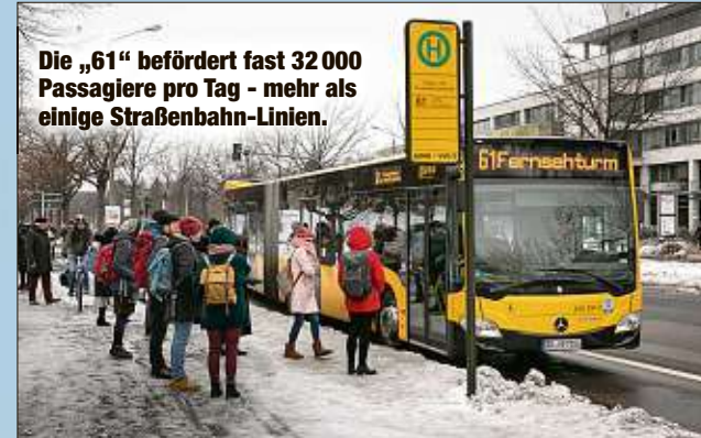
Die „61“ befördert fast 32 000 Passagiere pro Tag - mehr als einige Straßenbahn-Linien.

Breitere Straßenbahnen: 30 neue Stadtbahnwagen sollen bestellt werden. Dieses Jahr werden die Verträge geschlossen, 2020 könnte die Testbahn durch Dresden rollen, ein Jahr später folgen die ersten regulären Bahnen.