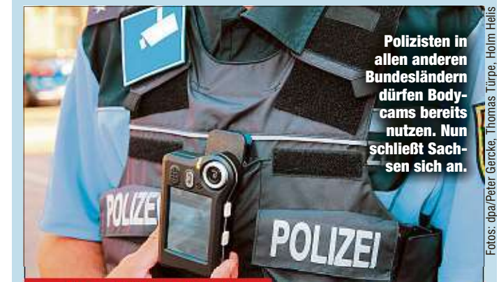
Polizisten in allen anderen Bundesländern dürfen Bodycams bereits nutzen. Nun schließt Sachsen sich an.