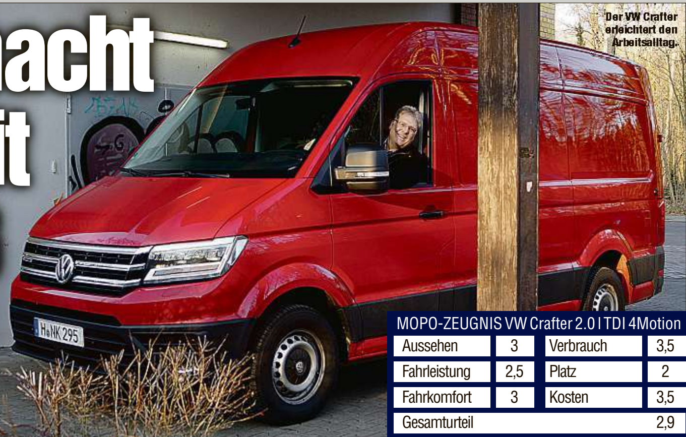
Der VW Crafter erleichtert den Arbeitsalltag.