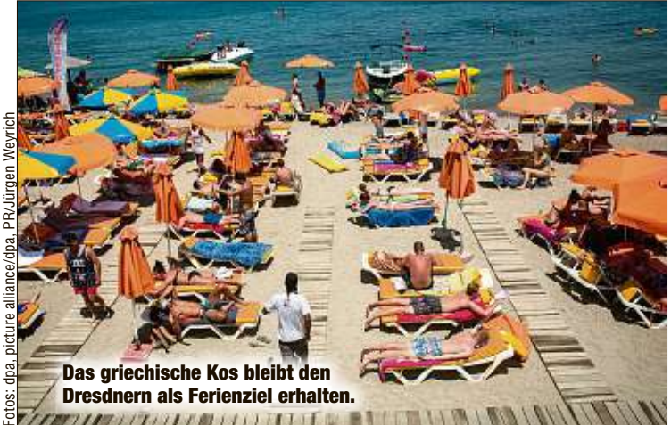
Das griechische Kos bleibt den Dresdnern als Ferziel erhalten.