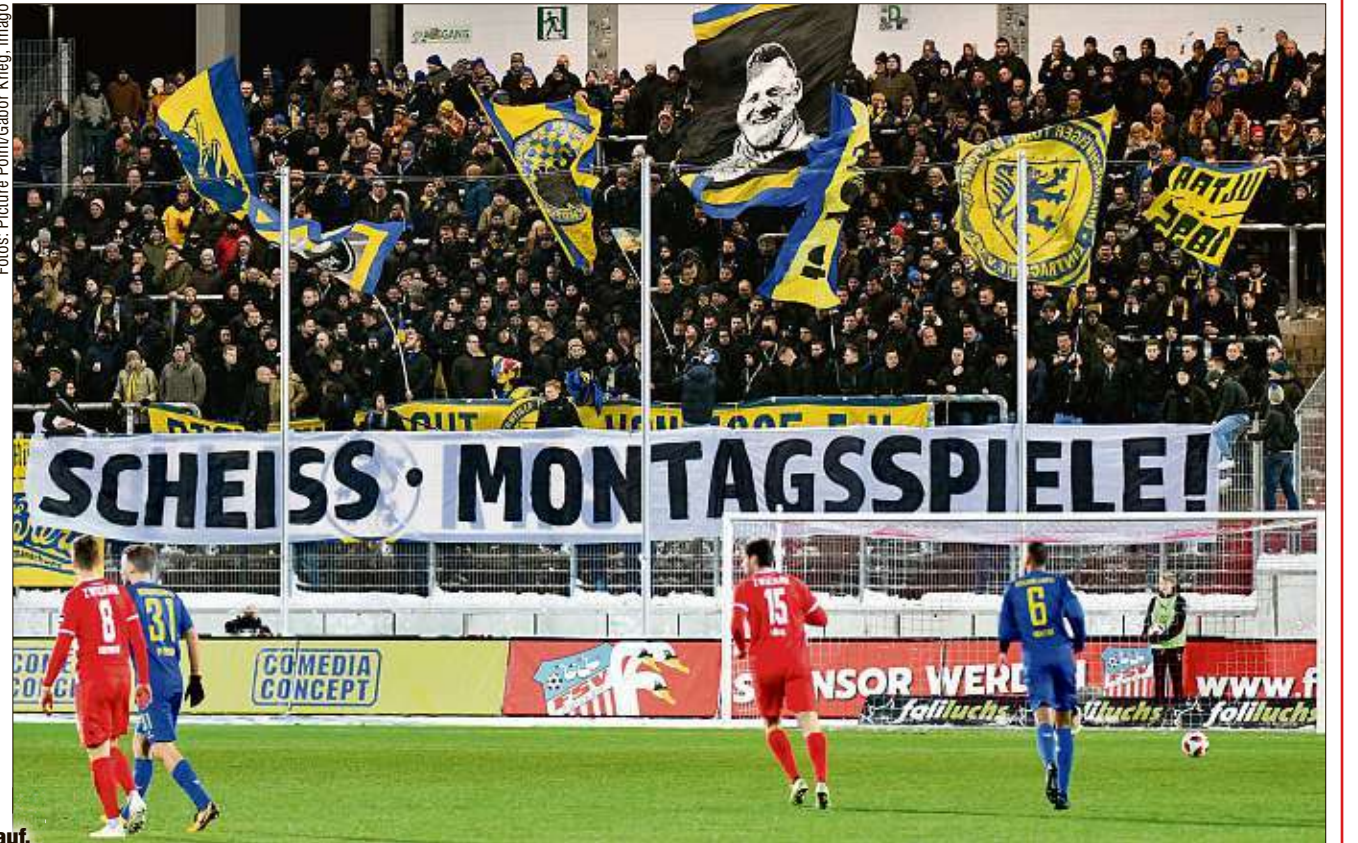
Auch die Braunschweiger Fans begehren in Zwickau gegen die Spiele am Montagabend auf.