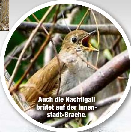
Auch die Nachtigall brüht auf der Innenstadt-Brache.

LEIPZIG - Der Bauboom in Leipzig lässt die grüne Lunge der Stadt dramatisch schrumpfen. Einer Dokumentation des Naturschutzbundes (NABU) zufolge sind in den letzten beiden Jahren 85 Hektar an Baum- und Strauchland diversen Bauprojekten zum Opfer gefallen - das sind 850 000 Quadratmeter oder rund 120 Fußballfelder! Entsprechend groß ist der Verlust von Lebensraum für viele Tiere. Um die letzte große innerstädtische Brutfläche wollen die Umweltschützer jetzt kämpfen.