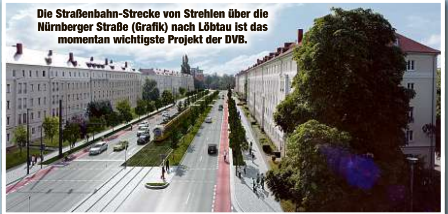
Die Straßenbahn-Strecke von Strehlen über die Nürnberger Straße (Grafik) nach Löbtau ist das momentan wichtigste Projekt der DVB.

260 Passagiere. Das entspricht 200 Autos, die auf einmal über eine Kreuzung kommen“, wirbt Hemmersbach.