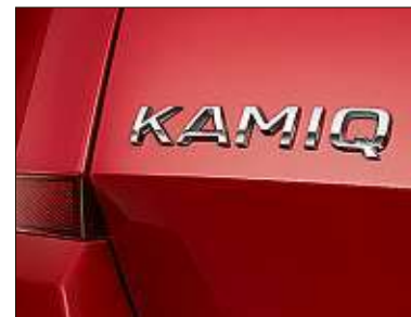
Bisher ist der Kamiq nur im Detail zu sehen.

Škoda hat im Vorfeld der Premiere auf dem Genfer Salon vom 7. bis 17. März den Namen seines neuen Mini-SUV bekannt gegeben: Kamiq heißt der Neuling, der sich namenstechnisch in die Crossover-Familie der Tschechen einfügt, die bislang aus den beiden größeren Modellen Karoq und Kodiaq besteht. Optisch dürfte sich der Kamiq an der Studie Vision X orientieren, die 2018 in Genf gezeigt wurde.