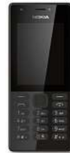
HANDY 216 von NOKIA | mit 2,4" Display, Mini SIM, Speicher: 16 MB (erweiterbar bis 32 GB), mit Kamera, Bluetooth, Dual SIM Art.-Nr. 45592