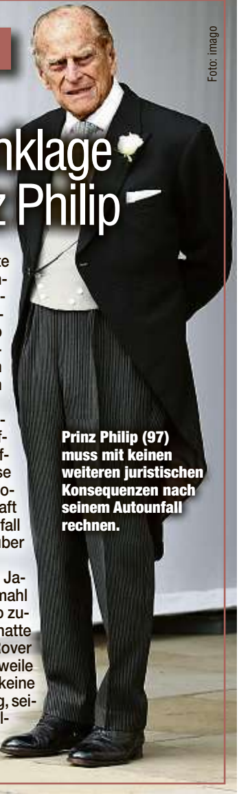
Prinz Philip (97) muss mit keinen weiteren juristischen Konsequenzen nach seinem Autounfall rechnen.

Bei dem Unfall am 17. Januar war der Prinzgemahl mit einem anderen Auto zusammengestoßen und hatte sich in seinem Land Rover überschlagen. Mittlerweile hat Philip, der damals keine Verletzungen davon trug, seinen Führerschein freiwillig abgegeben (MOPD berichtete).