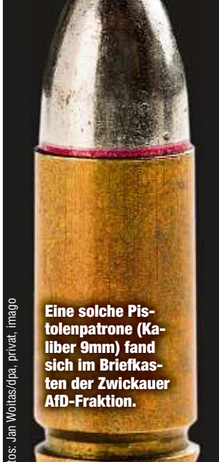
Eine solche Pistolenspatrone (Kaliber 9mm) fand sich im Briefkasten der Zwickauer AfD-Fraktion.