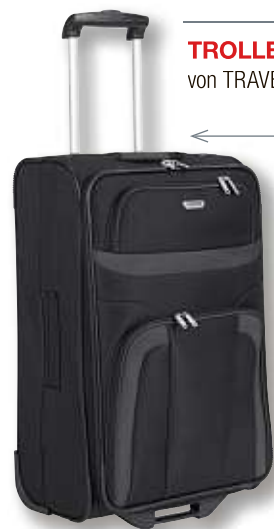
TROLLEY „ORLANDO“ von TRAVELITE | 63 cm, schwarz Art.-Nr. 54755