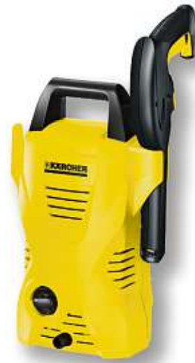
HOCHDRUCKREINIGER von KÄRCHER | K 2 Basic, max. 110 bar/1.400 Watt Art.-Nr. 10346