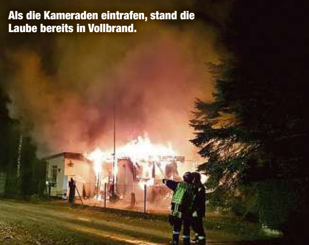
Als die Kameraden eintrafen, stand die Laube bereits in Vollbrand.