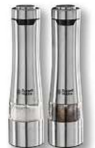
EDELSTAHL SALZ- UND PFEFFERMÜHLE „CLASSICS“ von RUSSELL HOBBS elektr., 2er-Set, mit Beleuchtung, Mahlggrad einstellbar, Batterien nicht enthalten Art.-Nr. 27242