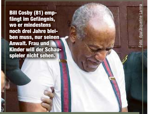
Bill Cosby (81) empfängt im Gefängnis, wo er mindestens noch drei Jahre bleiben muss, nur seinen Anwalt. Frau und Kinder will der Schauspieler nicht sehen.