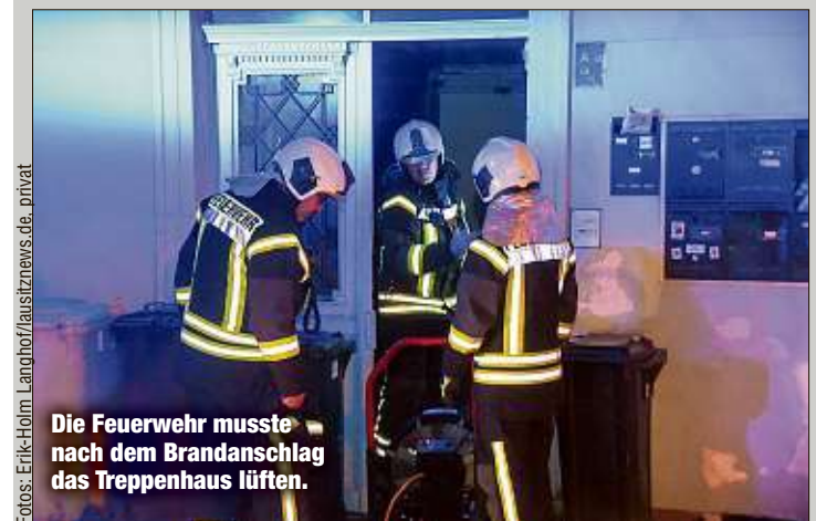
Die Feuerwehr musste nach dem Brandanschlag das Treppenhaus lüften.

benachbarte Gebäude und Bäume zu vermeiden.“ Das gelang, die brennende Laube selbst war jedoch nicht mehr zu retten und brannte bis auf die Grundmauern aus. Der Einsatz der 43 Kameraden dauerte rund vier Stunden, Verletzte gab es nicht. Die Kriminalpolizei hat die Ermittlungen aufgenommen. eho