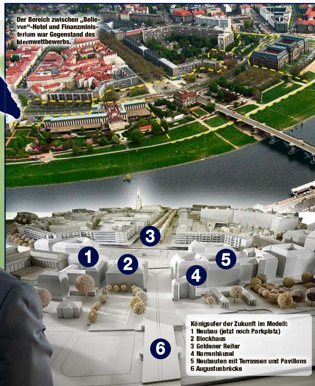
Königsufer der Zukunft im Modell: 1 Neubau (jetzt noch Parkplatz) 2 Blockhaus 3 Goldener Reiter 4 Narrenhäusel 5 Neubauten mit Terrassen und Pavillons 6 Augustusbrücke