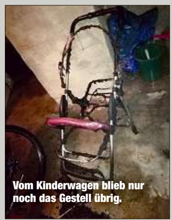
Vom Kinderwagen blieb nur noch das Gestell übrig.

brannte.“ Sofort schlug der Zittauer Alarm, brachte Frau und Kinder in Sicherheit. „Dreimal habe ich mit dem Eimer versucht zu löschen“, sagt er. „Aber es blieb nur noch das Gestell übrig.“ Die Feuerwehr rückte mit sechs Kameraden aus, konnten den gefährlichen Rauch aus den Gängen vertreiben. „Vor einem