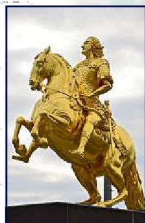
Rund um den Goldenen Reiter wird's wieder königlich hübsch.

Der Siegerentwurf wird kommenden Donnerstag im Zentrum für Baukultur (Schloßstraße 2) präsentiert. Dort gibt's auch alle anderen Entwürfe zu sehen. Die Ausstellung ist ab 22. Februar dienstags bis sonnabends von 13 bis 18 Uhr geöffnet.