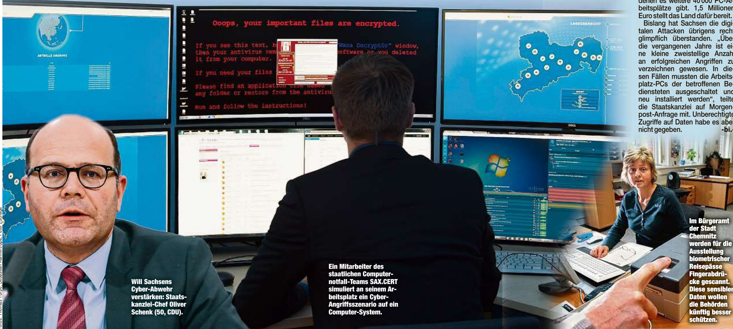
Will Sachsens Cyber-Abwehr verstärken: Staatskanzlei-Chef Oliver Schenk (50, CDU).

Bislang hat Sachsen die digitalen Attacken übrigens recht glimpflich überstanden. „Über die vergangenen Jahre ist eine kleine zweistellige Anzahl an erfolgreichen Angriffen zu verzeichnen gewesen. In diesen Fällen mussten die Arbeitsplatz-PCs der betroffenen Bediensteten ausgeschaltet und neu installiert werden“, teilte die Staatskanzlei auf Morgenpost-Anfrage mit. Unberechtigte Zugriffe auf Daten habe es aber nicht gegeben.