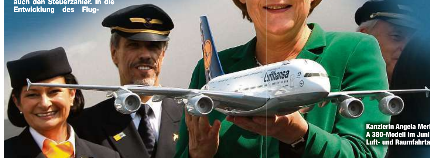
Kanzlerin Angela Merkel (64, CDU) mit einem A 380-Modell im Juni 2010 auf der Internationalen Luft- und Raumfahrt ausstellung (ILA) in Berlin.