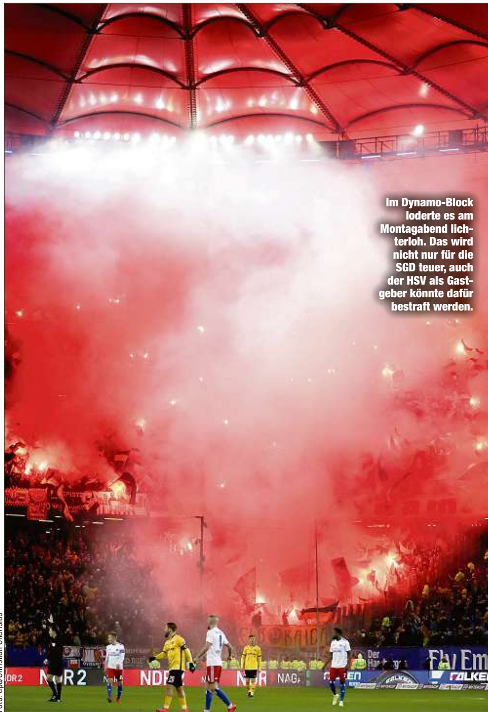
Im Dynamo-Block loderte es am Montagabend lichterloh. Das wird nicht nur für die SGD teuer, auch der HSV als Gastgeber könnte dafür bestraft werden.