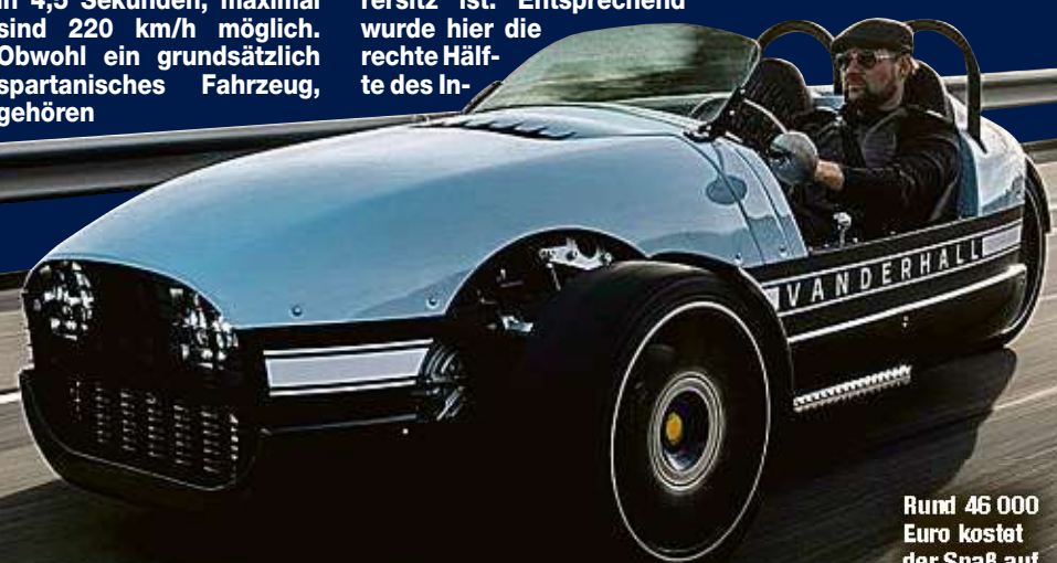
Rund 46.000 Euro kostet der Spaß auf drei Rädern.

abdeckung verkleidet. Im Frühling will Lenoir das Angebot um den edler ausgestatteten und 20 PS stärkeren Carmel erweitern. Im Sommer soll der rein elektrisch angetriebene Vanderhall Edison2 folgen. Preise sind noch nicht bekannt.