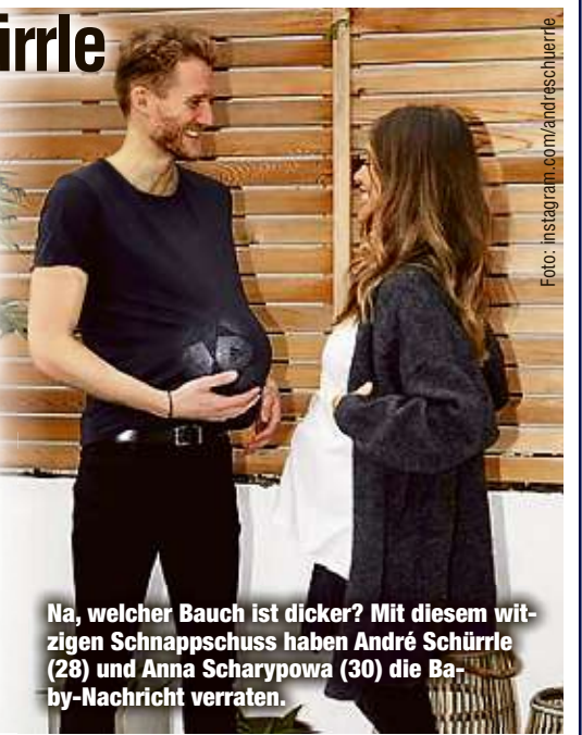
Na, welcher Bauch ist dicker? Mit diesem witzigen Schnapsschuss haben André Schürrie (28) und Anna Scharypowa (30) die Baby-Nachricht verraten.

„Worte können nicht beschreiben, wie glücklich wir sind“, schrieb der Stürmer, der derzeit beim englischen Erstligisten FC Fulham kickt, bei Instagram. Seine Frau ist demnach bereits im siebten Monat schwanger - im April ist Geburtstermin. Ob es ein Junge oder Mädchen wird, haben die beiden nicht verraten.