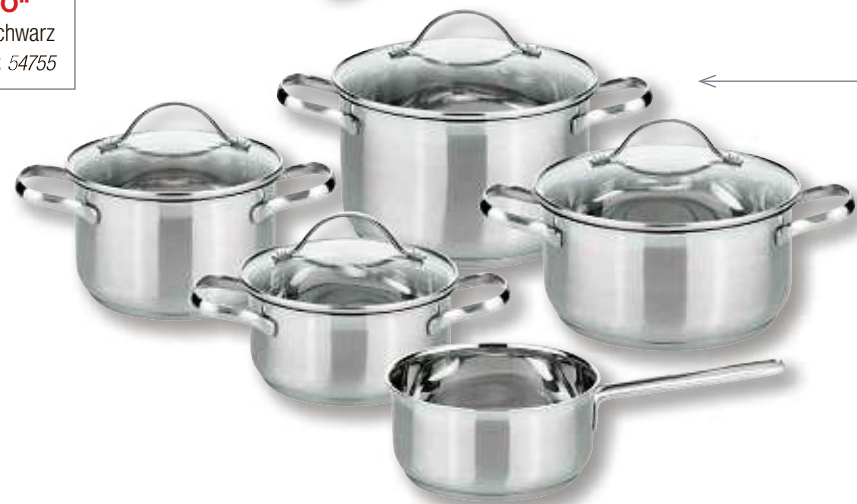
EDELSTAHL-TOPFSET „HORIZON“ von MEINE KÜCHE 9-tlg., für alle Herdarten geeignet Art.-Nr. 22318