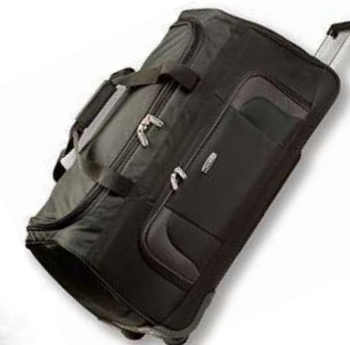
TROLLEY-REISETASCHE „ORLANDO“ von TRAVELITE ca. 73 l, 70 x 35 x 33 cm Art.-Nr. 52910