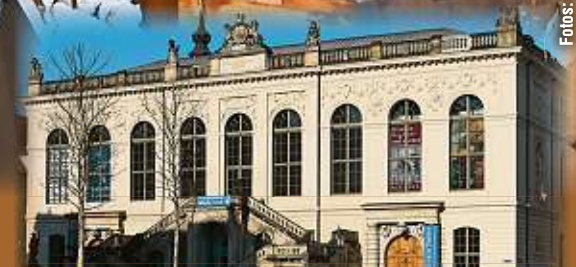
Das Verkehrsmuseum Dresden zeigt das Leben und Wirken Meißners in seiner neuen Ausstellung.