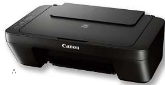
MULTIFUNKTIONSGERÄT „PIXMA 3-IN-1“ von CANON | Tintenstrahldruck/Scannen/Kopieren Art.-Nr. 51616