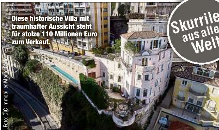
Diese historische Villa mit traumhafter Aussicht steht für stolze 110 Millionen Euro zum Verkauf.