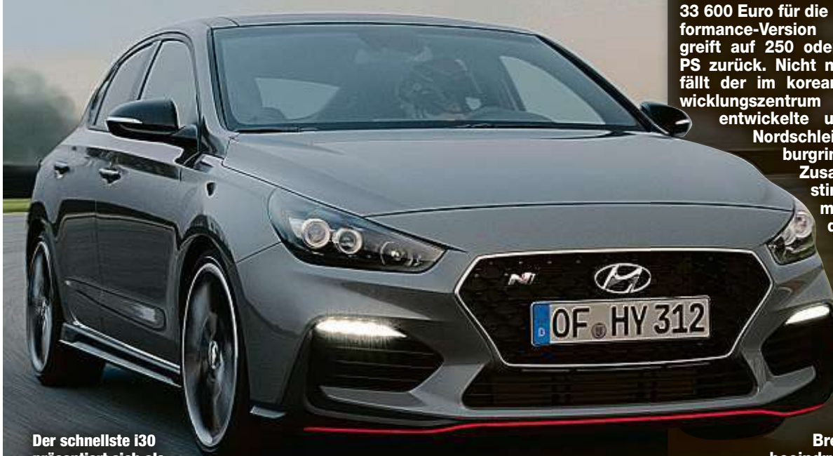
Der schnellste i30 präsentiert sich als kompletter Allrounder.

Eine elegante Limousine hat Hyundai mit dem i30 auf die Beine gestellt. Mit dem Zusatz N fährt zudem noch die stärkste Variante der Familie vor.