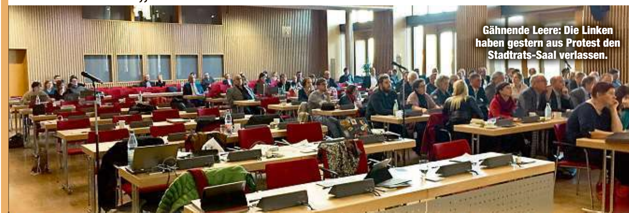
Gähnende Leere: Die Linken haben gestern aus Protest den Stadtrats-Saal verlassen.