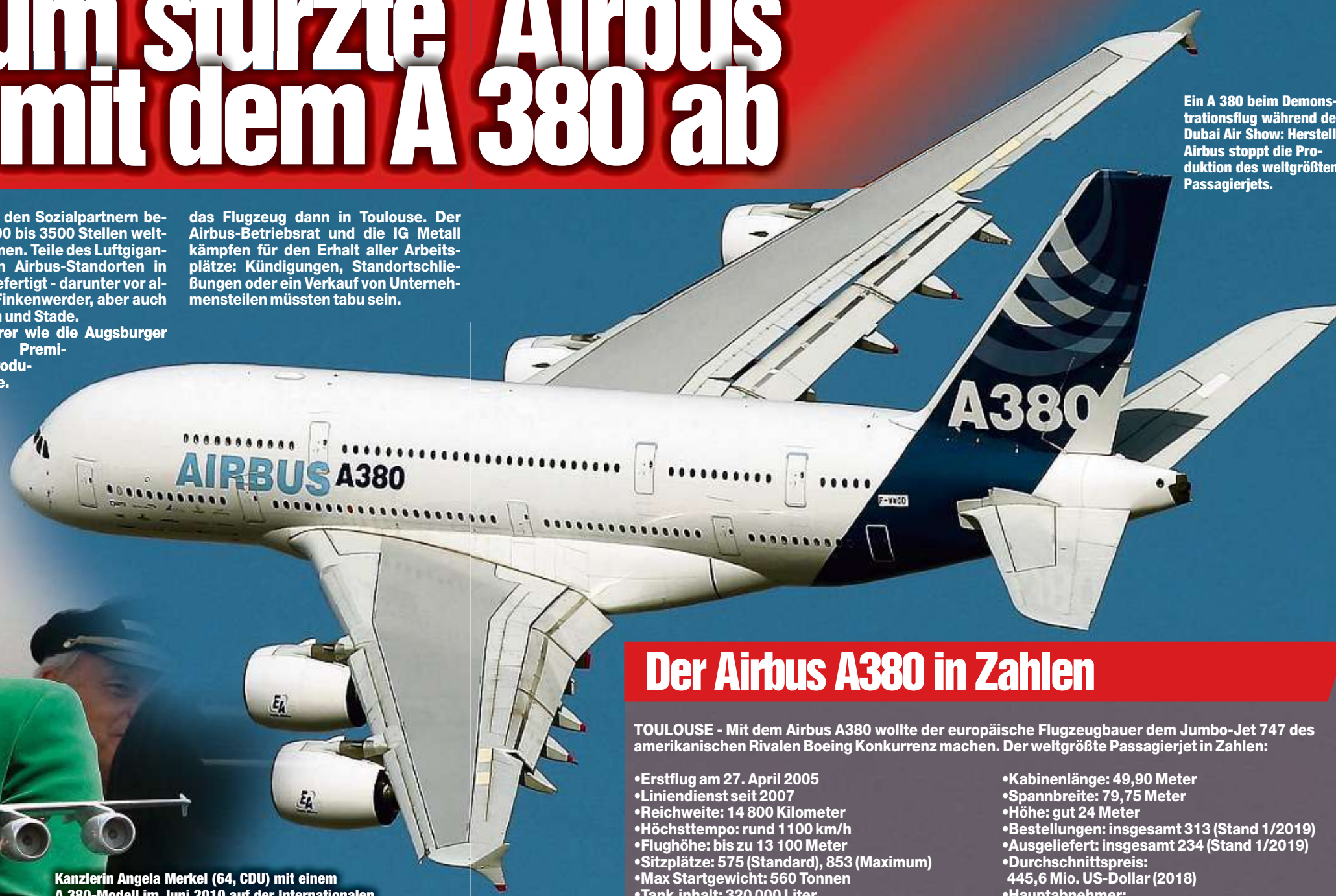
Ein A 380 beim Demonstrationsflug während der Dubai Air Show: Hersteller Airbus stoppt die Produktion des weltgrößten Passagierjets.

das Flugzeug dann in Toulouse. Der Airbus-Betriebsrat und die IG Metall kämpfen für den Erhalt aller Arbeitsplätze: Kündigungen, Standortschließungen oder ein Verkauf von Unternehmensteilen müssten tabu sein.