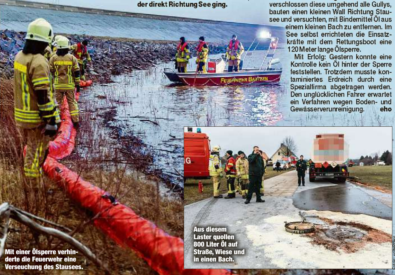
Aus diesem Laster quollen 800 Liter Öl auf Straße, Wiese und in einen Bach.

Mit Erfolg: Gestern konnte eine Kontrolle kein Öl hinter der Sperre feststellen. Trotzdem musste kontaminiertes Erdreich durch eine Spezialfirma abgetragen werden. Den unglücklichen Fahrer erwartet ein Verlahren wegen Boden- und Gewässerunreinigung. eho