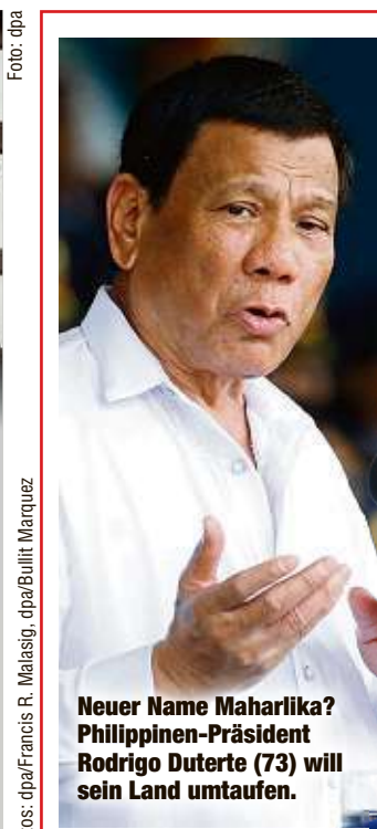
Neuer Name Maharlika? Philippinen-Präsident Rodrigo Duterte (73) will sein Land umbenennen.

Russland und der Iran leisten Syriens Machthaber Baschar al Assad (53) militärischen Beistand. Die Türkei wiederum steht auf der Seite der gemäßigten Rebellen und will vor allem ein Erstarken der Kurden im Nachbarland verhindern.