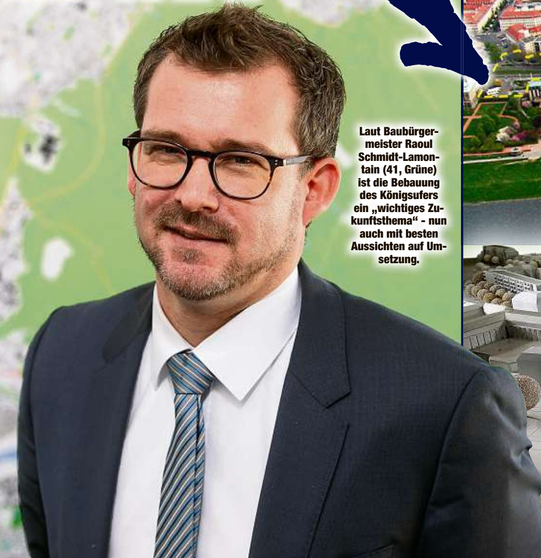
Laut Baubürgermeister Raoul Schmidt-Lamontain (41, Grüne) ist die Bebauung des Königsufers ein „wichtiges Zukunftsthema“ - nun auch mit besten Aussichten auf Umsetzung.