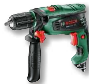
Schlagbohrmaschine EasyImpact 550 von BOSCH im Koffer, 550 Watt mit Antirutschgriff Art.-Nr. 70161