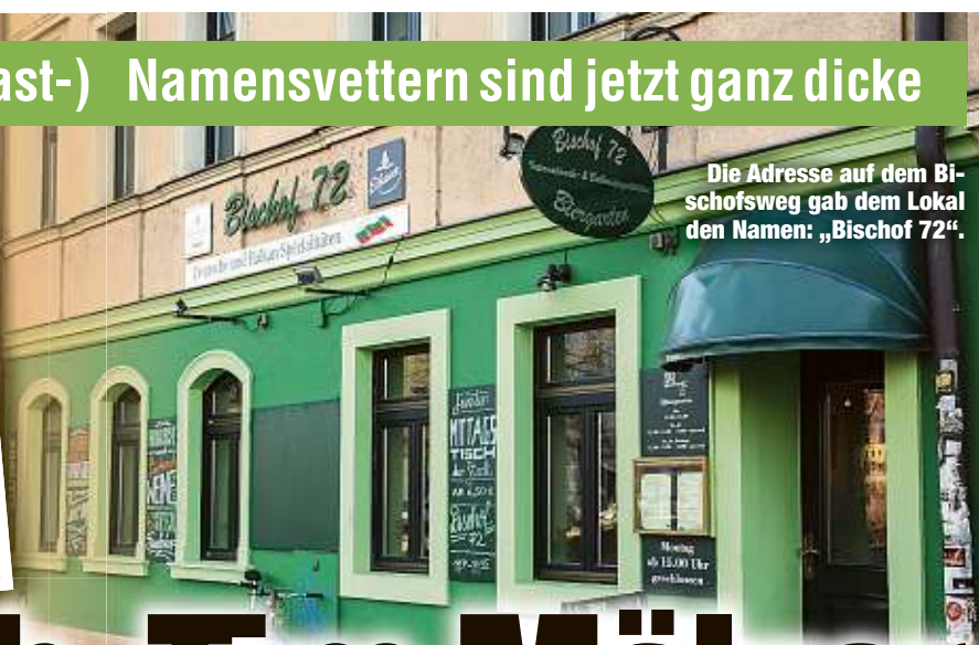
Die Adresse auf dem Bischofsweg gab dem Lokal den Namen: „Bischof 72“.