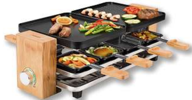
RACLETTE „PURE 8“ von PRINCESS | 8 Pfannen, mit Überhitzungsschutz Art.-Nr. 5688