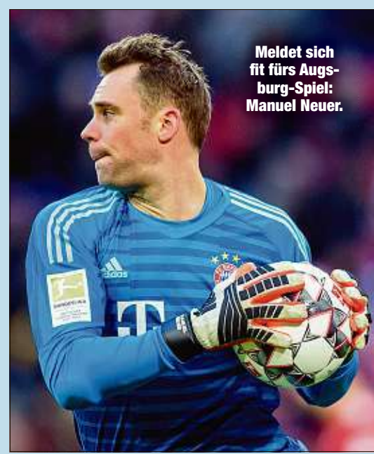
Meldet sich fit fürs Augsburg-Spiel: Manuel Neuer.