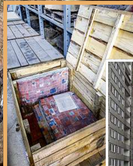
Das riesige Wandbild liegt jetzt zerlegt in mehreren Kisten im Lapidarium.