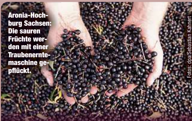
Aronia-Hochburg Sachsen: Die sauren Früchte werden mit einer Traubenerntemaschine gepflückt.