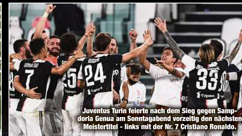
Juventus Turin feierte nach dem Sieg gegen Sampdoria Genua am Sonntagabend vorzeitig den nächsten Meistertitel - links mit der Nr. 7 Cristiano Ronaldo.

Die große Champions-League-Reform zur Saison 2018/19 hat das Auseinanderklaffen der Schere noch vergrößert. Auf Druck der Topclubs und aus der Angst, diese könnten sich in einer eigenen Europaliga zusammenschließen, entschied sich die UEFA für Maßnahmen, die die Dominanz der Spitzenvereine weiter zementiert hat. Wer erfolgreich ist, bekommt noch mehr Geld und wird damit noch erfolgreicher. Nur wenn dieser Kreislauf durchbrochen wird, besteht die Chance, auf mehr Spannung - sowohl international als auch national.