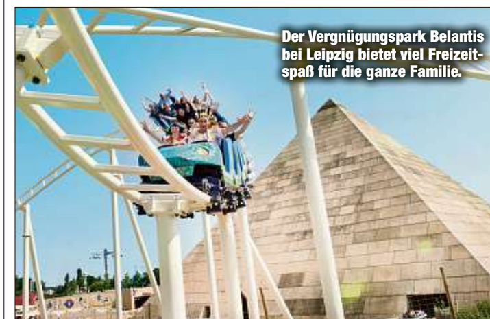
Der Vergnügungspark Belantis bei Leipzig bietet viel Freizeitspaß für die ganze Familie.