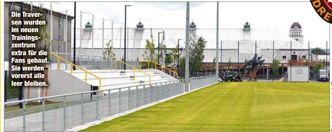
Die Traversen wurden im neuen Trainingszentrum extra für die Fans gebaut. Sie werden vorerst alle leer bleiben.

los. Für jeden stehen noch verschiedene medizinische sowie leistungsdiagnostische Untersuchungen im Universitätsklinikum Carl Gustav Carus in Dresden an. Zudem folgen noch für alle zwei Corona-Tests. Cheftrainer Markus Kauczinski hat in der Sommergezeit insgesamt fünfzehn Wochen Zeit, um seine Schützlinge bestmöglich auf die neue Spielzeit vorzubereiten, ehe es in der 1. Runde des DFB-Pokals (11. bis 14. September) gegen den HSV geht. Mögliche Testspielgegner auf dem Weg dorthin stehen noch nicht fest. nahro