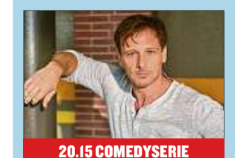
20.15 COMEDYSERIE Der Lehrer Der Schüler Yves Schwarz handelt sich mächtig Ärger ein, als er den G-Kurs boockt. Stefan Vollmer (Hendrik Duryng) wittert, dass im Hause Schwarz etwas Unwetter trotzten mussten.

19.50 Ein Sommer auf Usedom (4) Dokumentation 8-553-856 20.15 Lebensretter extra Magazin. Zerstörerische Tornados 4-673-030 21.00 Hauptsache gesund extra Gesundes vom Feld 9-304-382 21.45 MDR aktuell 9-117-276 22.10 artour Magazin U.a.: Der Erfinder des Weltgeistes - Der Philosoph Georg Wilhelm Friedrich Hegel (1770-1831) wird 250 / Ein neues Zentrum für Jena / „Heimaturlaub“ - Urlaub in Deutschland - ein Open Air und Filmprojekt am Theaterhaus Jena 8-004-818 22.40 Nahdram Magazin. Das Magazin für Lebensfragen. Welche Macht hat die Liebe? 4-745-301 23.10 Lebensläufe Porträtreihe Peter Schreier - Stimmwunder und Weltbürger 4-731-108 23.40 HD 20:00 16:9 Der andere Liebhaber Drama (F/B 2017) Mit Marine Vacht 66-795-011 1.25 Lebensretter extra Zerstörerische Tornados 71-529-615 2.10 artour 10-672-870