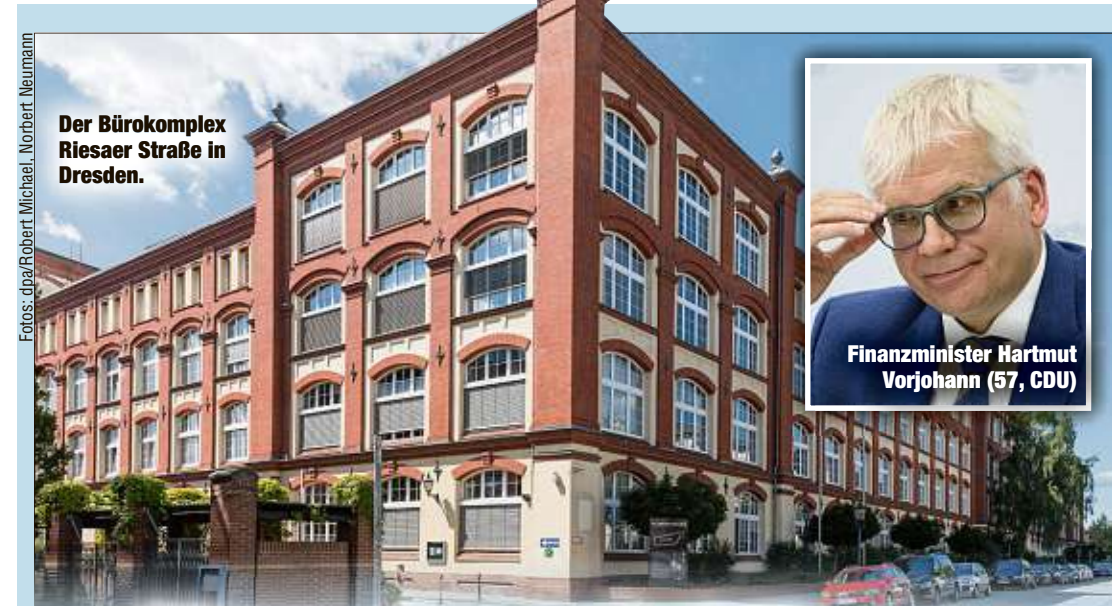
Der Bürokomplex Rieser Straße in Dresden.