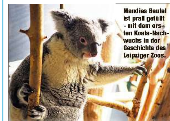
Mandies Beutel ist prall gefüllt - mit dem ersten Koala-Nachwuchs in der Geschichte des Leipziger Zoos.

nun die Polizei. Otto, seit Kindertagen begeisterter Feuerwehrmann: „Ich kann mir nicht erklären, was bei jemandem im Kopf vorgehen muss, um bei der Feuerwehr zu klauen“, sagt er. Zeugen beschreiben die beiden Langfinger als zwischen 13 und 16 Jahre alt. Einer hatte eine Mütze, der andere einen „Ostdeutschland“-Hut auf. Beide sollen am Abend den Elberadweg Richtung Riesa gefahren sein. Die Kriminalpolizei hat die Ermittlungen aufgenommen. eho