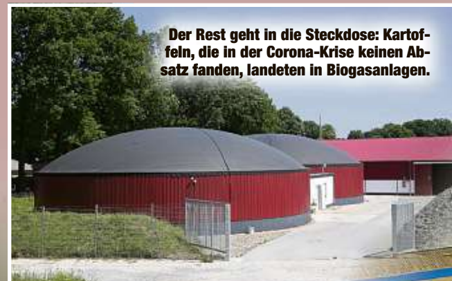
Der Rest geht in die Steckdose: Kartoffeln, die in der Corona-Krise keinen Absatz fanden, landeten in Biogasanlagen.

Mit der Lockerung der Corona-Regeln ist auch die Nachfrage bei Restaurants und Lokalen wieder angestiegen. Schon während des Lockdowns ist übrigens auch der Privatverbrauch gestiegen: Weil die Sachsen in dieser Zeit zu Hause wieder mehr gekocht haben, landeten dort auch mehr Kartoffeln im Topf: rechnerisch statt 30 Kilo jetzt 36 Kilo pro Kopf und Jahr. Das konnte die großen Verluste für die Bauern wenigstens ein bisschen ausgleichen.