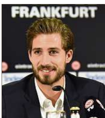
Kevin Trapp soll die Nummer eins im Tor der Eintracht bleiben.