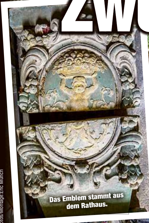
Das Emblem stammt aus dem Rathaus.