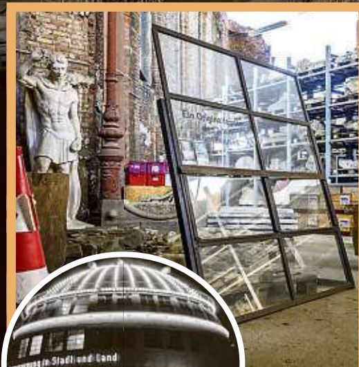
Dieses Fenster gehört zum 1938 von den Nazis abgerissenen Kugelhaus im Großen Garten.