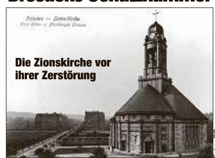
Die Zionskirche vor ihrer Zerstörung

Sie ist Dresdens Schatzkammer - die Ruine der ehemaligen Zionskirche an der Nürnberger Straße. Von kleinen Fliesen über kunstvoll bearbeitete Gesteinsbrocken in allen Formen bis hin zu großen Statuen und Denkmälern reiht sich hinter ihren Mauern ein historisches Artefakt aus Dresdens Stadtgeschichte an das andere.