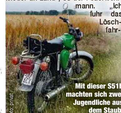
Mit dieser S51b machten sich zwei Jugendliche aus dem Staub.

19 Uhr trafen sich die Kameraden am Gerätehaus zur Ausbildung, diesmal stand Bootfahren auf dem Plan. Otto parkte seine grüne S51b vor dem Haus, dann ging es auf die Elbe. „Gegen 20.45 Uhr zogen wir das Boot wieder an Land“, so der Feuerwehrmann. „Ich fuhr das Löschfahrzeug.“