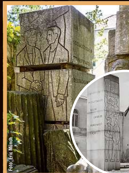
1999 wurde die Granitstele vor dem Kurhaus Bühlau entfernt.