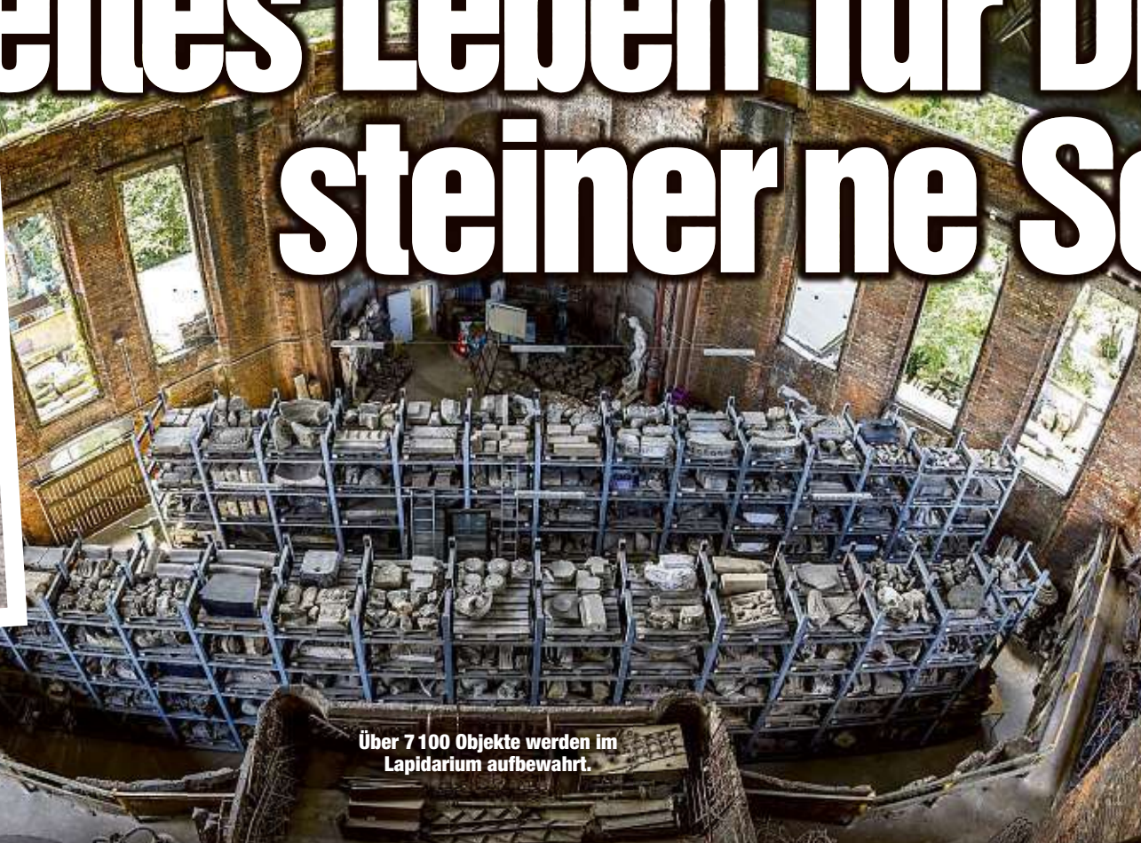
Über 7 100 Objekte werden im Lapidarium aufbewahrt.