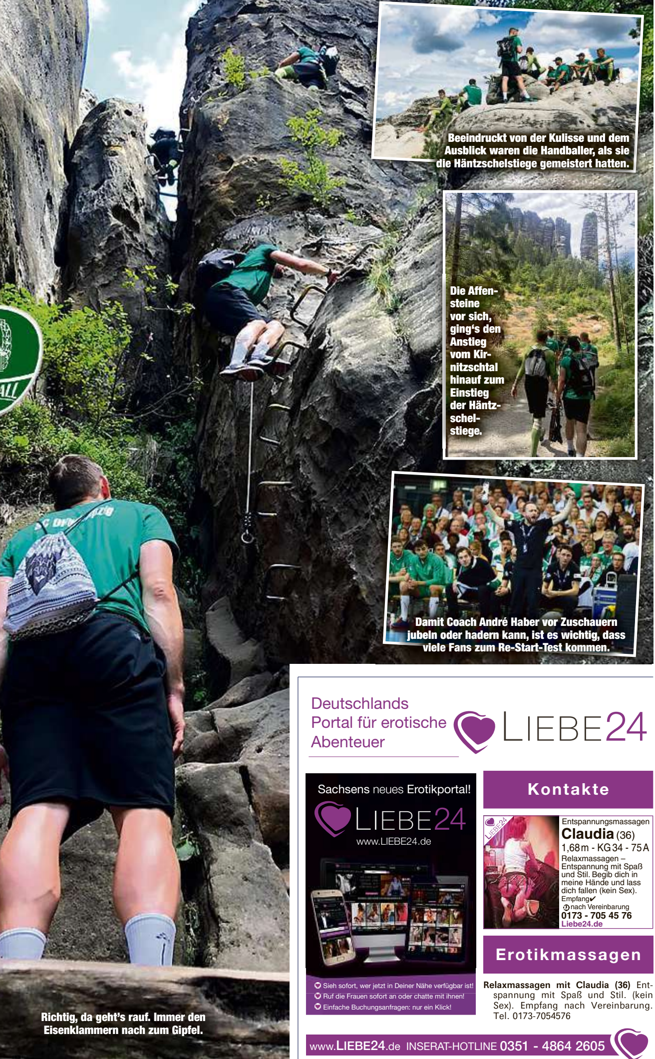
Beindruckt von der Kulisse und dem Ausblick waren die Handballer, als sie die Hantelsteige gemästert hatten.

Während gegen Dresden die Fans noch außen vor sind, sollen beim Testspiel gegen Zweitligist Aue (28. August) 250 in die Halle dürfen, zwei Tage später gegen den polnischen Club Kielce bereits 500. Im (Test)Duell mit den Füchsen Berlin am 5. September sollen es mindestens 500 Zuschauer sein. „Es wird alles davon abhängen, ob die Lage stabil bleibt und wir die Genehmigungen bekommen“, so der DHfK-Geschäftsführer.