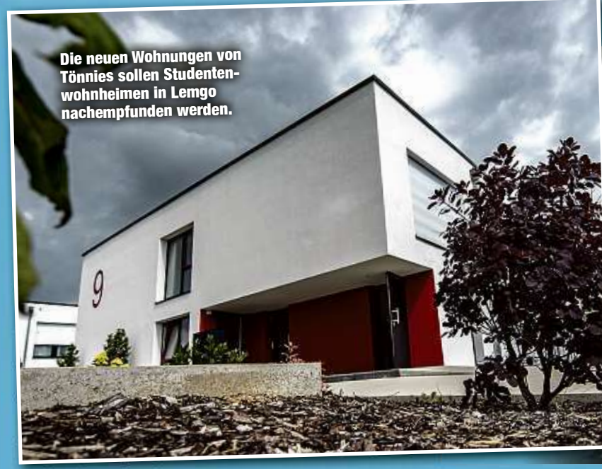
Die neuen Wohnungen von Tönnies sollen Studentenwohnheimen in Lemgo nachempfunden werden.