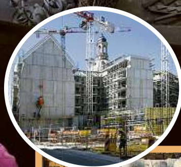
Dieses Figurenensemble aus dem zerstörten Palais Hoym soll demnächst dorthin zurückkehren. Der Wiederaufbau läuft.