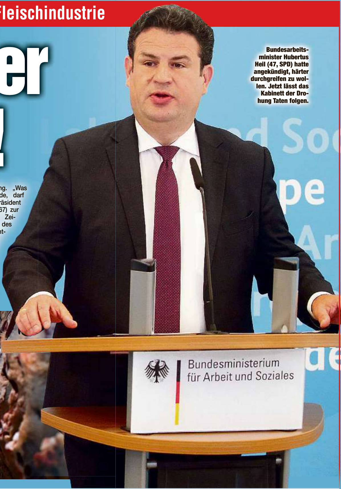
Bundesarbeitsminister Hubertus Heil (47, SPD) hatte angekündigt, härter durchgreifen zu wollen. Jetzt lässt das Kabinett der Drohung Taten folgen.

Regierungsentscheidung. „Was da beschlossen wurde, darf nicht wahr sein“, so Präsident Friedrich-Otto Ripke (67) zur „Neuen Osnabrücker Zeitung“. Die Aussagen des Ministers seien „schlichtweg unsinnig“, man setze die Fleischproduktion in Deutschland aufs Spiel. Die Branche sei bereit, auf den Werkvertrag zu verzichten, aber „wir brauchen Leiharbeiter“.