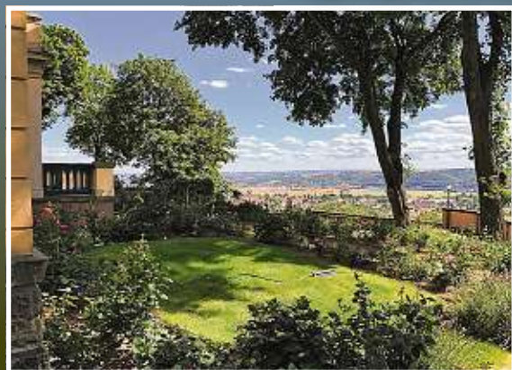
Für die Millionen gibt es einen Park und den unverbaubaren Blick obendrauf.