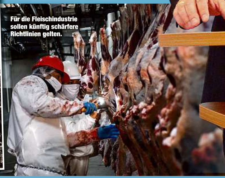
Für die Fleischindustrie sollen künftig schärfere Richtlinien gelten.