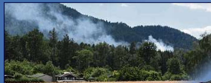
Da brennt's: Rauchentwicklung soll künftig mit 5G-Technologie und dem Einsatz von Drohnen früher erkannt und in eine Leitzentrale gemeldet werden.

Görlitz am Dienstag mit. Gesteuert werden soll das System über eine Feuerwehrleitzentrale. Durch den Einsatz der 5G-Technologie soll es künftig möglich sein, Wald- und Schmelbrände über Monitoring in Echtzeit bereits im Ansatz zu erkennen und zu bekämpfen, hieß es.