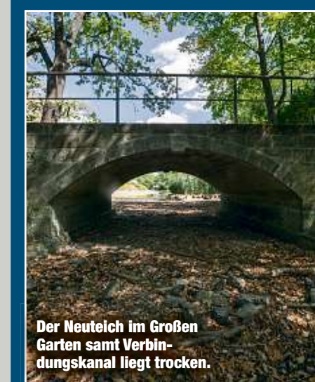
Der Neuteich im Großen Garten samt Verbindungskanal liegt trocken.

Egal ob Palaisteich, Carolasee oder Neuteich: Auch in den Gewässern im Großen Garten ist zurzeit teils erschreckend wenig Wasser. Zumindest am Palaisteich hängt das aber nicht mit der Trockenheit der letzten Monate zusammen. Stattdessen entschlammte dort der Freistaat den künstlich angelegten Teich. Der Schlamm entsteht hauptsächlich durch das Laub der umliegenden Bäume. Mit dem Ende der 320 000 Euro teuren Arbeiten wird langsam wieder Wasser aus dem Kaitzbach eingelassen. Doch das Bächlein führt momentan selbst kaum Wasser. Das hat Folgen: Damit zumindest im Carolasee der Wasserstand gehalten werden kann, „opfert“ das Schlösserland aktuell den dritten großen Teich, der eigentlich mit Kaitzbach-Wasser gefüllt werden sollte: den Neuteich. Die Kanäle dorthin liegen trocken, der Wasserstand im Teich sinkt. „Besucher entdeckten jetzt die großen Steine an der Uferbefestigung des Neuteichs, die sonst unter der Wasseroberfläche lagen, und werfen diese in den Teich“, sagt Schlösserland-Sprecher Uli Kretschmar (44). Das führt jedoch dazu, dass die Befestigung beschädigt wird und der Teich eher ausgebaggert werden muss. „Wir hoffen auf die Vernunft unserer Gäste.“ DiHe