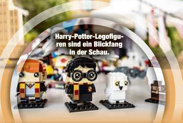
Harry-Potter-Legofiguren sind ein Blickfang in der Schau.