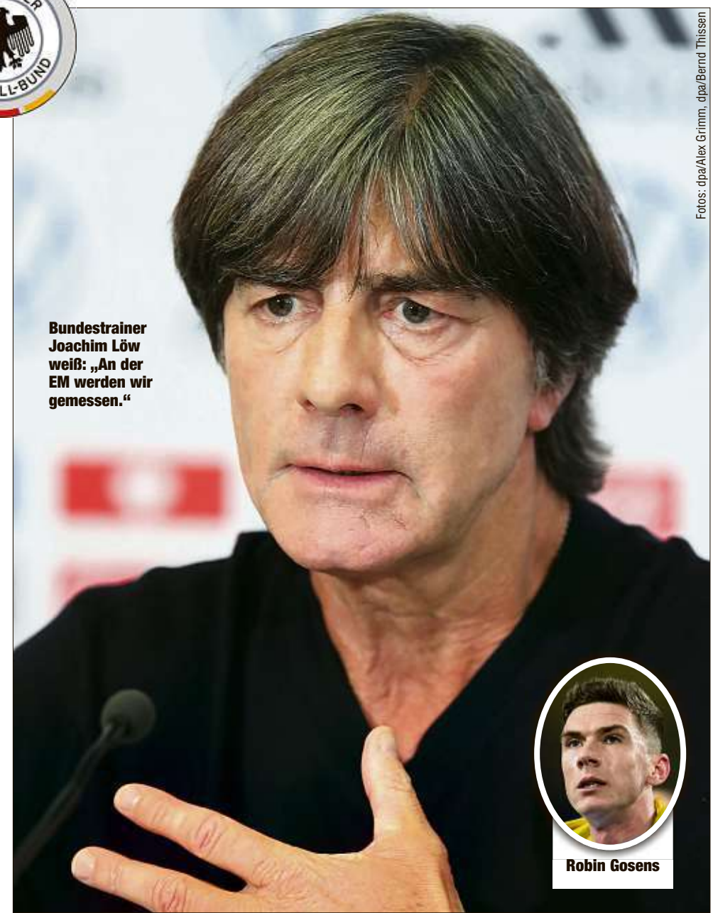
Bundestrainer Joachim Löw weiß: „An der EM werden wir gemessen.“