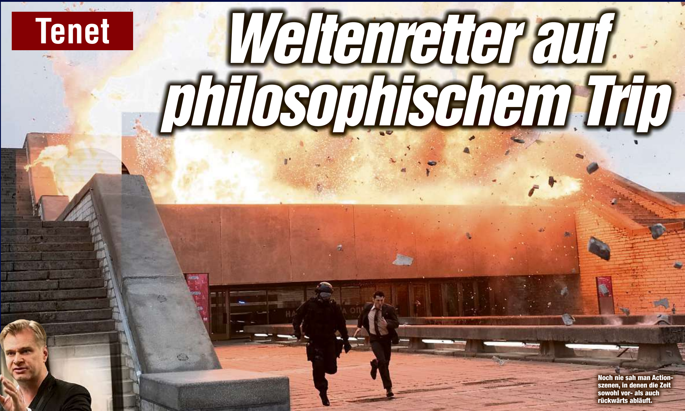
Noch nie sah man Action-szenen, in denen die Zeit sowohl vor- als auch rückwärts abläuft.

Kenneth Branagh, der auch in Nolans „Dunkirk“ spielte, ist grandios als russischer Waffenhändler. Schönste Dialogzeile zwischen Branagh und dem ebenfalls wunderbar spielenden Washington: Branagh: „Wie wollen Sie sterben?“ Washington: „Alt.“ Hat Branaghs Russe Andrei Sator, der schnell zum Haupt-Antagonisten Washingtons avanciert, mal wieder einen Gegner per Goldbarren ins Jenseits geprügelt, blickt er danach stets