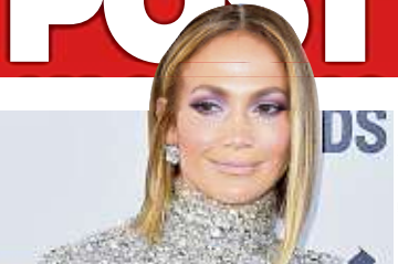
Jennifer Lopez (51) geht unter die Beauty-Unternehmer.