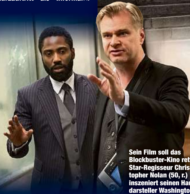
Sein Film soll das Blockbuster-Kino retten: Star-Regisseur Christopher Nolan (50, r.) inszeniert seinen Hauptdarsteller Washington.