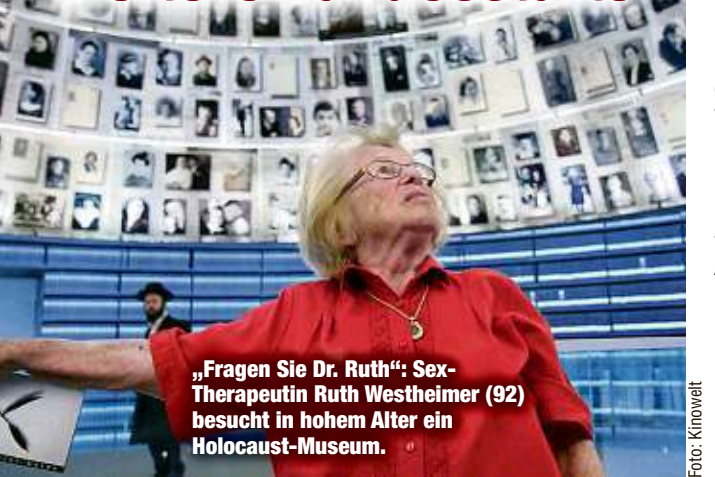
„Fragen Sie Dr. Ruth“: Sex-Therapeutin Ruth Westheimer (92) besucht in hohem Alter ein Holocaust-Museum.