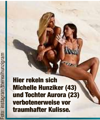
Hier reckeln sich Michelle Hunziker (43) und Tochter Aurora (23) verbotenerweise vor traumhafter Kulisse.