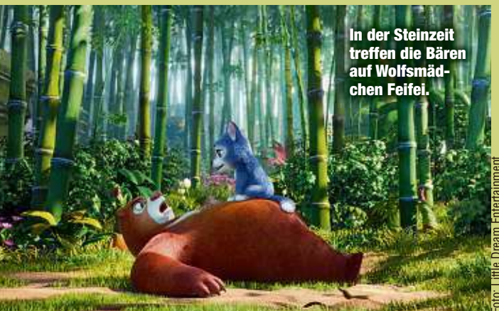
In der Steinzeit treffen die Bären auf Wolfsmädchen Feifei.

Actionszenen aufgepeppt wird. Warum etwa auf einmal der glitzernde Schmetterling auftaucht, der die Bären in die Vergangenheit katapultiert, das wird nicht erklärt. Überhaupt sollte man sich als erwachsener Zuschauer nicht allzu sehr mit manchem Logiksprung befassen - vielleicht gefällt es der jüngeren Begleitung ja trotzdem. Immerhin: Putzig anzusehen sind so manche Steinzeitwesen durchaus. Fazit: Solides Familienabenteuer. Aliki Nassoufis (Ufa, Rundkino, CinemaxX, Schauburg, PKO, CineStar Chemnitz)