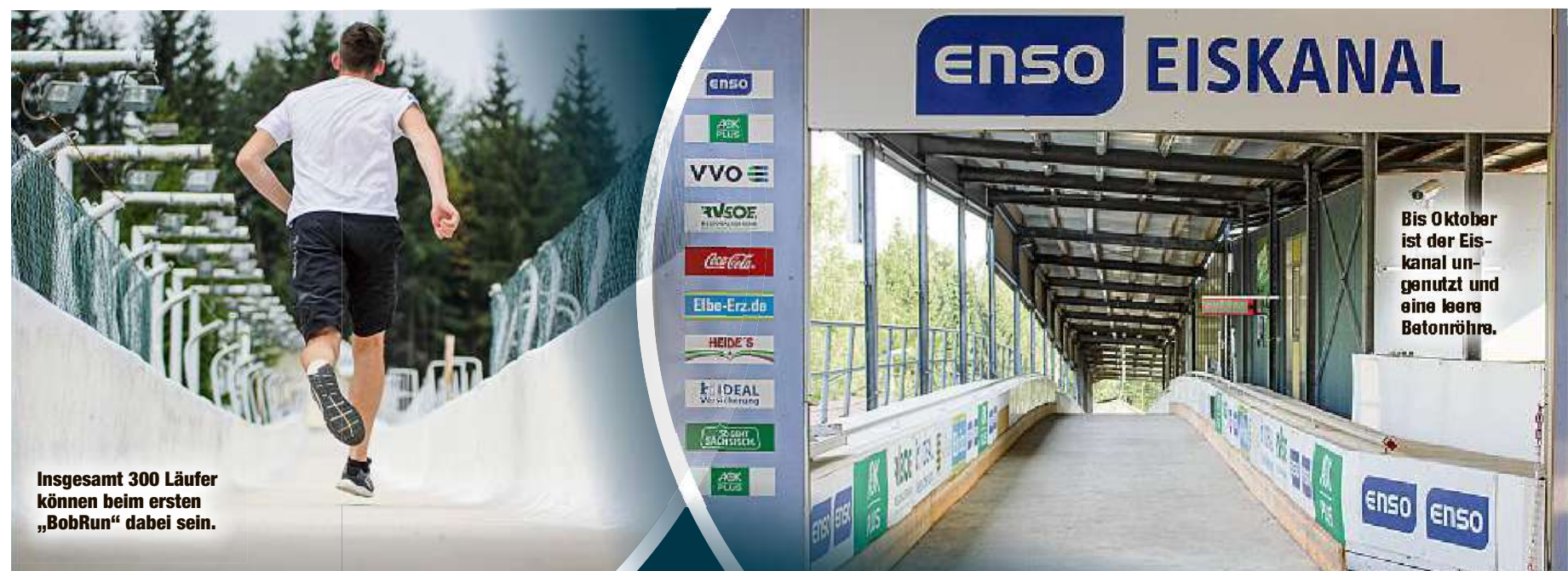
Insgesamt 300 Läufer können beim ersten „BobRun“ dabei sein.