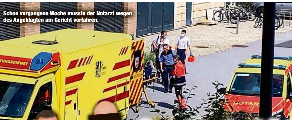
Schon vergangene Woche musste der Notarzt wegen des Angeklagten am Gericht vorfahren.

strafen (mindestens 15 Jahre). Später hob der Bundesgerichtshof (BGH) das Urteil auf, da der „Vorsatz“ nicht korrekt begründet worden war. Dieser liegt vor, wenn es der Raser für möglich hält, dass ein Mensch sterben kann und er das billigend in Kauf nimmt. Ohne diesen Vorsatz ist von fahrlässiger Tötung auszugehen. Der Berliner Hauptangeklagte wurde später erneut wegen Mordes rechtskräftig verurteilt. Das Urteil gilt als Ausnahme, entscheidend ist immer der Einzelfall. tyx