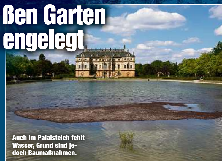
Auch im Palaisteich fehlt Wasser, Grund sind jedoch Baumaßnahmen.