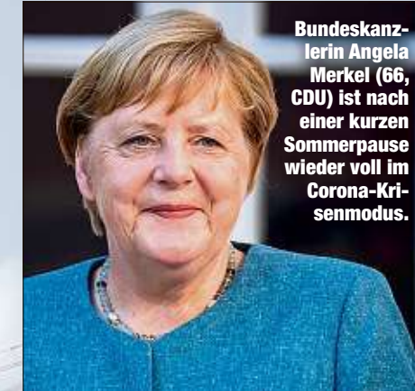
Bundeskanzlerin Angela Merkel (66, CDU) ist nach einer kurzen Sommerpause wieder voll im Corona-Krisenmodus.