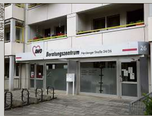
Wegen eines Corona-Falls ist das AWO-Beratungszentrum in Prohlis derzeit geschlossen.