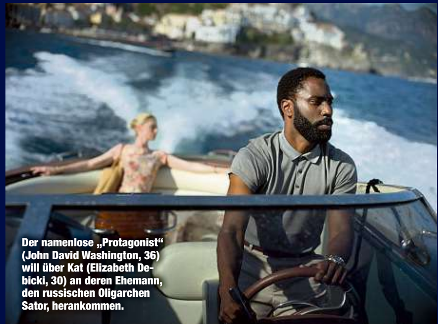
Der namenlose „Protagonist“ (John David Washington, 36) will über Kat (Elizabeth Debicki, 30) an deren Ehemann, den russischen Oligarchen Sator, herankommen.

Schon vor zehn Jahren hat Mastermind Nolan („The Dark Knight“) mit seinem von Traumebene zu Traumebene hüpfenden Rätselwerk „Inception“ manch Gehirnareal verknötet. Diesmal