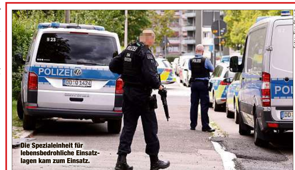
Die Spezialeinheit für lebensbedrohliche Einsatzlagen kam zum Einsatz.