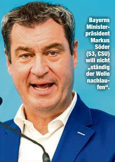
Bayerns Ministerpräsident Markus Söder (53, CSU) will nicht „ständig der Welle nachlaufen“.

Die Gesundheitsminister von Bund und Land hatten sich am Montag darauf verständigt, kostenlose Tests für Urlauber und Pflichttests für Rückkehrer aus Risikogebieten bald wieder abschaffen zu wollen.