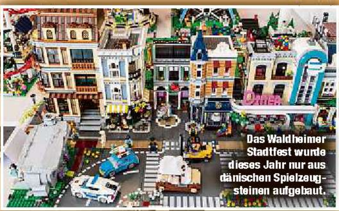
Das Waldheimer Stadtfest wurde dieses Jahr nur aus dänischen Spielzeugsteinen aufgebaut.