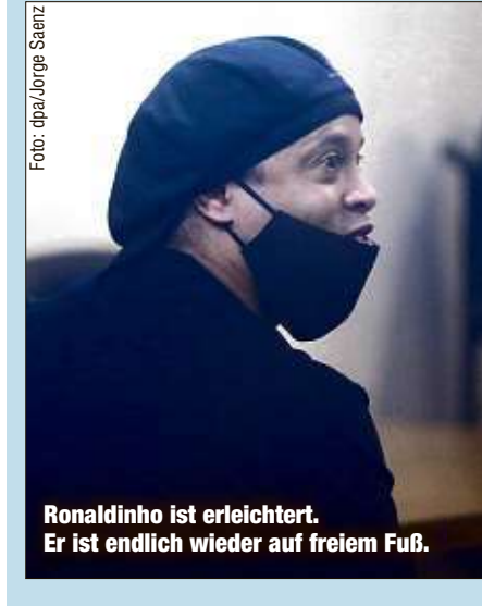
Ronaldinho ist erleichtert. Er ist endlich wieder auf freiem Fuß.

ASUNCION - Wie ein Champion sah Ronaldinho (40) am Tag seiner Freilassung nicht aus.