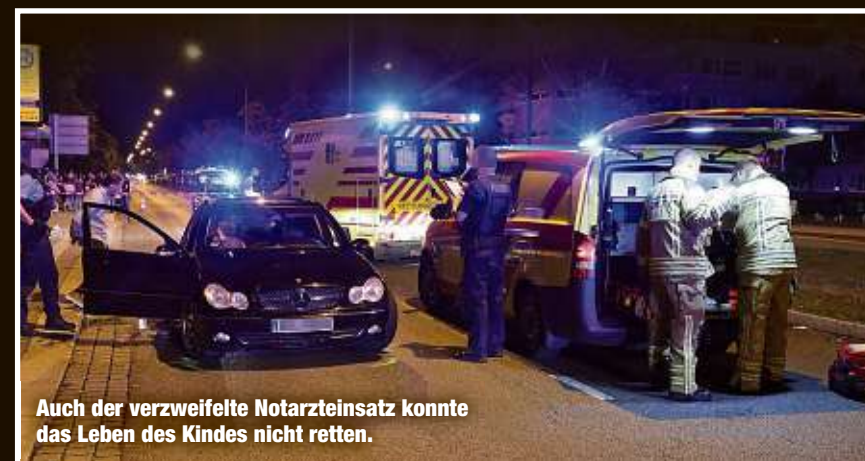
Auch der verzweifelte Notarzteinsatz konnte das Leben des Kindes nicht retten.