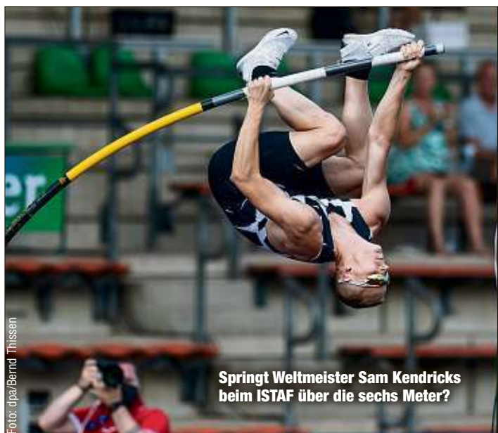
Springt Weltmeister Sam Kendricks beim ISTAF über die sechs Meter?

Die Organisatoren planen auf Basis eines ausgeklügelten Schutz- und Hygienekonzepts mit rund 3500 Fans im Olympiastadion. Die Infektionsschutzverordnung des Landes Berlin erlaubt im September Veranstaltungen im Freien mit bis zu 5000 Anwesenden. Beim ISTAF sind dies neben den rund 3500 Zuschauern unter anderem Athleten, Trainer, Kampfrichter, Techniker, Medienvertreter und Helfer.