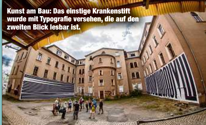
Kunst am Bau: Das einstige Krankenhaus wurde mit Typografie versehen, die auf den zweiten Blick lesbar ist.

Ins Gebäude dürfen an den kommenden zwei Wochenenden nur insgesamt 350 Besucher im Rahmen von Führungen. Die ersten 220 Plätze sind ausgebucht. Morgen, 19 Uhr, werden unter ibug-art.de 130 weitere vergeben. Der Eintritt zum Außengelände ist frei - allerdings auf zeitgleich 100 Personen beschränkt. Damit die „Ibug“ trotz fehlender Einnahmen überhaupt stattfinden kann, erhielt sie dieses Jahr die Rekordförderung von 85 000 Euro. MS