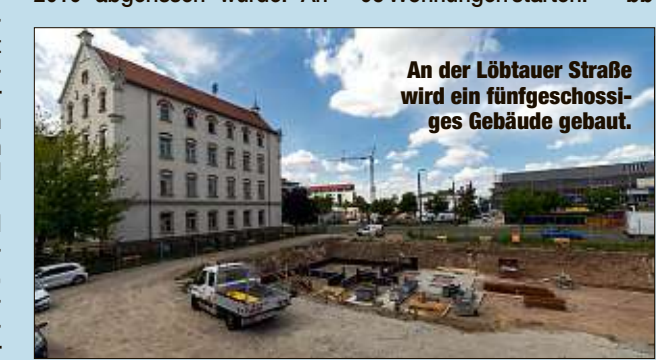
An der Löbtauer Straße wird ein fünfgeschossiges Gebäude gebaut.

erhält ein Eingang einen Aufzug. Wie die WiD mitteilt, soll das Gebäude voraussichtlich Ende März 2022 fertig werden. Am Thymianweg wird das Grundstück einer ehemaligen Kita bebaut, die im Februar 2019 abgerissen wurde. An