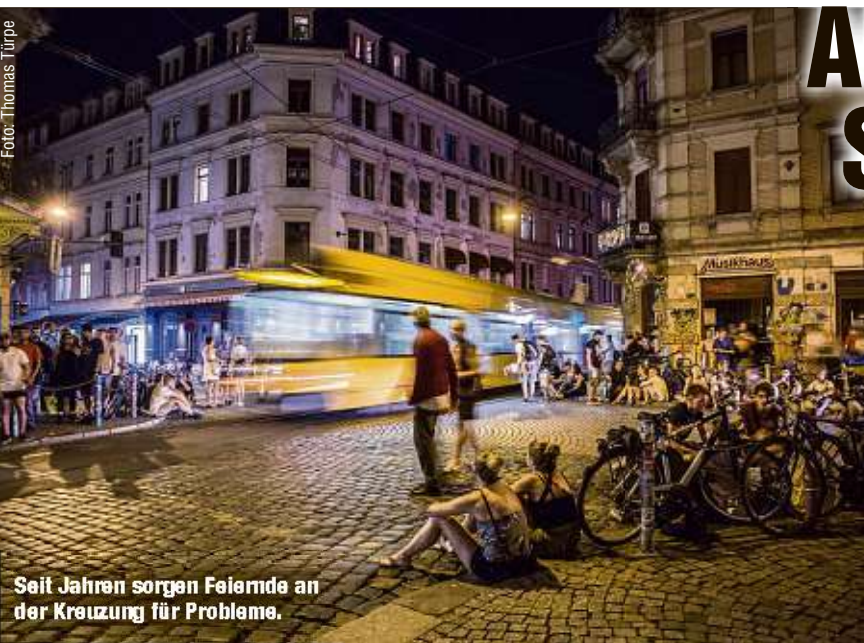
Seit Jahren sorgen Feiern an der Kreuzung für Probleme.