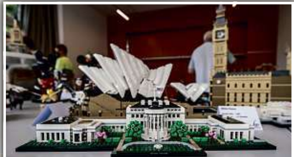
Im Stadt- und Museumhaus sind zum Beispiel das Weiße Haus, die Sydney-Oper oder Big Ben ausgestellt.