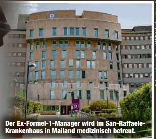
Der Ex-Formel-1-Manager wird im San-Raffaele-Krankenhaus in Mailand medizinisch betreut.