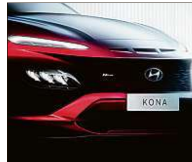
Der Kona erhält eine neue Front.

Hyundai verpasst dem Mini-Crossover Kona ein Update. Zum Start der zweiten Lebenshälfte gibt es eine neu gestaltete Front mit Haifischmaul-Kühlergrill und die neue Ausstattungsvariante „N-Line“ mit sportlicher Optik. Die Premiere dürfte noch in diesem Jahr erfolgen, zum Händler könnte der geliftete Kona rund um den Jahreswechsel rollen.