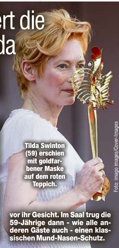
Tilda Swinton (59) erschien mit goldfarbener Maske auf dem roten Teppich.

Bevor die Oscar-Preisträgerin mit ihrer Auszeichnung für die Fotografen posierte, sorgte sie mit einer goldenen Schmetterlings-Maske für Aufsehen. Die Maske im venezianischen Stil hielt die Schottin auf dem roten Teppich immer wieder