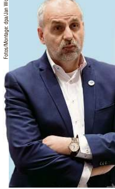
Versagt: Das Energie- und Klimaprogramm hätte die Staatsregierung längst vorlegen müssen - sagt die Opposition.