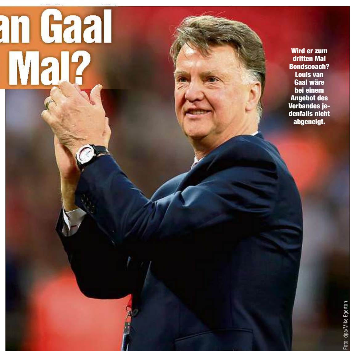
Wird er zum dritten Mal Bondscoach? Louis van Gaal wäre bei einem Angebot des Verbandes jedenfalls nicht abgeneigt.

Der General, wie der 69-Jährige wegen seines autoritären Auftretens genannt wird, hat seine Trainerkarriere nach einem missglückten Abstecher zu Manchester United zwar eigentlich bereits vor vier Jahren für beendet erklärt. Doch für eine dritte Amtszeit als Coach der Elftal würde van Gaal, der 2002 die WM in Japan und Südkorea verpasste, wohl eine Ausnahme machen. Sollte der KNVB auf ihn zukommen, „werde ich ernsthaft darüber nachdenken“, zitierte der TV-Sender NOS den früheren Bayern-Coach zuletzt.