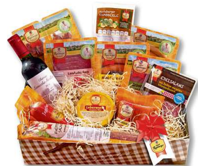
RADEBERGER SPEZIALITÄTEN-BOX von KORCH | mit erlesenen Wurst- und Schinkenspezialitäten im Wert über 40 Euro Art.-Nr. MOP018:Korch