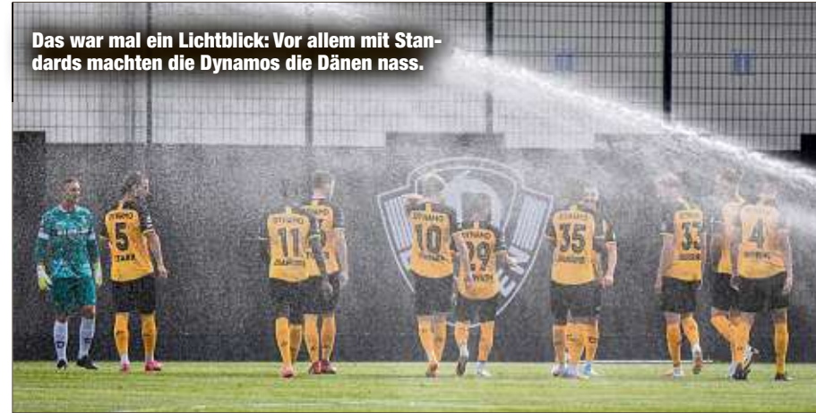
Das war mal ein Lichtblick: Vor allem mit Standards machten die Dynamos die Dänen nass.