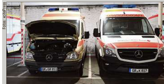
Der Görlitzer Katastrophenschutz muss seine Fahrzeuge in einer Halle ohne Abluft unterbringen.

Aber auch einsatztechnisch sieht der Retter Probleme: „Es fehlen übergreifende Konzepte“, sagt er. „Bei Großlagen liegt es an der Improvisationsfähigkeit des Einsatzleiters, wie der Einsatz abgewickelt wird.“ Auch gäbe es für Einsätze mit Giftstoffen keine einheitliche Ausbildung. Am 16. September wollen die Katastrophenschützer deshalb zum Landtag ziehen und hoffen so, auf die langsam beginnenden Haushaltsverhandlungen Einfluss nehmen zu können.