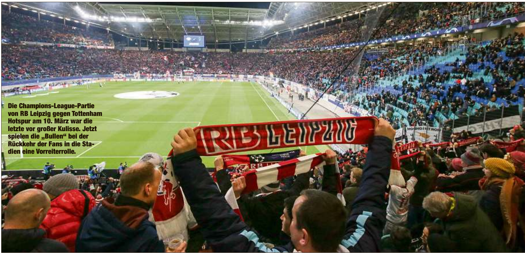
Die Champions-League-Partie von RB Leipzig gegen Tottenham Hotspur am 10. März war die letzte vor großer Kulisse. Jetzt spielen die „Bullen“ bei der Rückkehr der Fans in die Stadien eine Vorreiterrolle.

ganz wichtiges und sehr positives Zeichen sein. Ein Zeichen, dass sich tausende Menschen sehr wohl an Hygieneregeln halten wollen und halten können“, sagte Seifert. Sein Wunsch nach der Wiederzulassung von Zuschauern gelte auch für andere Sportarten. „Meine Kollegen im Eishockey, Basketball, Handball, Volleyball kämpfen in den nächsten Monaten um ihre blanke Existenz und viele Einzelsportarten auch“, sagte der DFL-Chef.