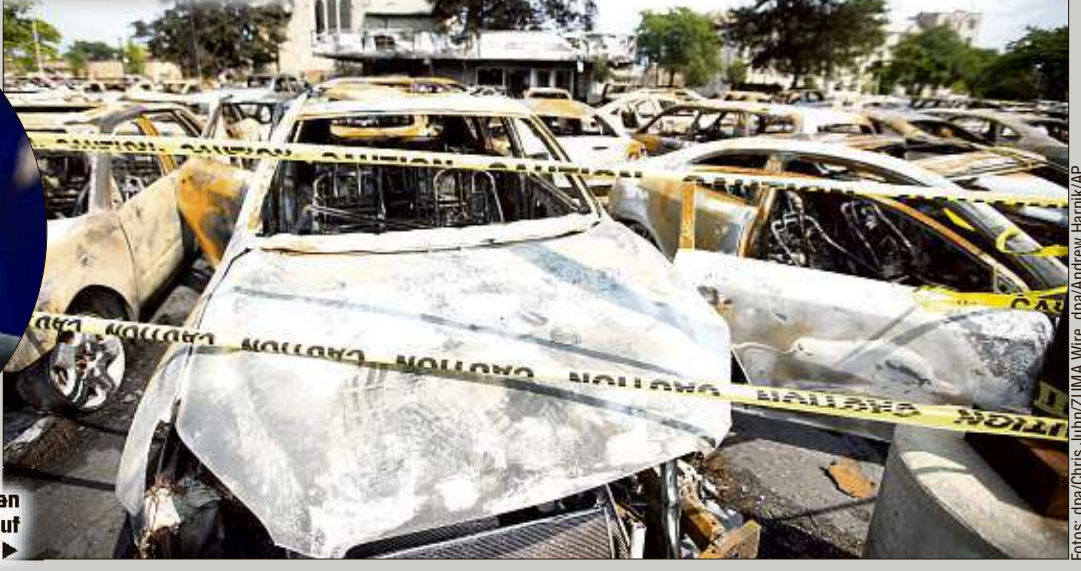
Ende August: Verbrannte Autos stehen nach teils gewaltsamen Protesten auf einem Parkplatz in Kenosha. ▶