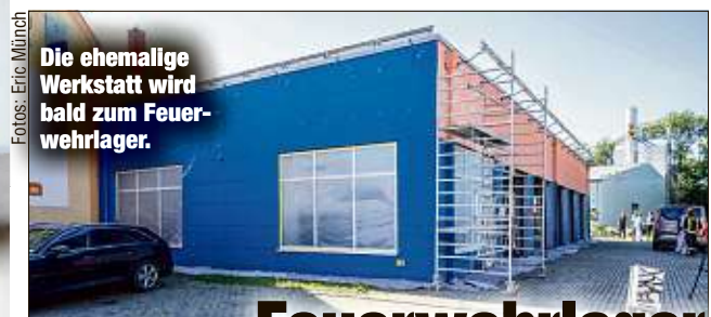
Die ehemalige Werkstatt wird bald zum Feuerwehrlager.