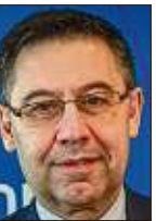
Josep Maria Bartomeu

Ein Treffen zwischen Jorge Messi und Barcelonas Vereinspräsident Josep Maria Bartomeu hatte keine Annäherung gebracht. „Sehr gut“, entfuhr es Messis Vater noch auf die Frage, wie das Treffen gewesen sei. Nach einer aufrichtigen Einschätzung des 62-Jährigen klang es allerdings nicht.