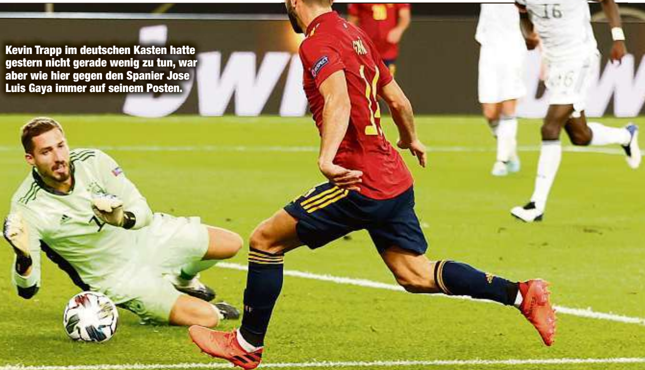
Kevin Trapp im deutschen Kasten hatte gestern nicht gerade wenig zu tun, war aber wie hier gegen den Spanier Jose Luis Gaya immer auf seinem Posten.

Die Spanier spielten mit hohem Pressing und provozierten Fehler in der Abstimmung zwischen Abwehr und Mittelfeld. Ein schwacher Rückpass von Emre Can, der etwas überraschend anstelle von Matthias Ginter in der Innenverteidigung begann, führte zum Missverständnis zwischen dem aus seinem Tor herauseilenden Kevin Trapp und Süle. Gegen den gedankenschnellen Rodrigo konnte Trapp gerade