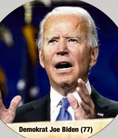
Demokrat Joe Biden (77)

KENOSHA - Bisher war der US-Bundesstaat Wisconsin wohl nur eingeweicht Sportfans ein näherer Begriff, doch nach den Schüssen auf den Afroamerikaner Jacob Blake (29) erlangt vor allem Kenosha eine zweifelhafte Berühmtheit. Nach US-Präsident Donald Trump (74) besuchte nun auch Herausforderer Joe Biden (77) die Stadt am Lake Michigan. „Mein Ziel wird sein, einen positiven Einfluss auf das Geschehen zu haben“, sagte Biden vor seiner gestrigen Reise. „Wir müssen heilen.“ Weiter sprach er sich dafür aus, dass der Polizist, der auf Blake schoss, angeklagt werden soll. Anders als Trump traf sich der Demokrat auch mit Mitgliedern von Blakes Familie, wie eine Sprecherin seines Wahlkampfteams vorab dem TV-Sender „CNN“ mitteilte.