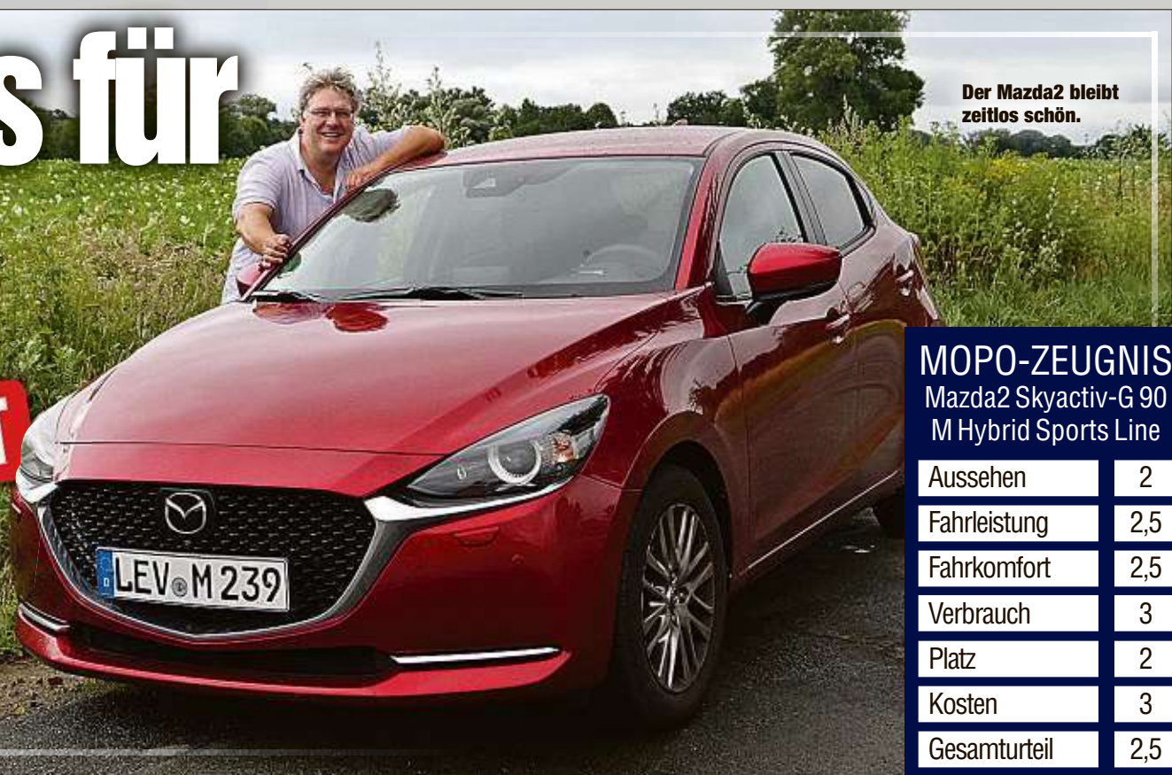
Der Mazda2 bleibt zeitlos schön.

MOPO-ZEUGNIS Mazda2 Skyactiv-G 90 M Hybrid Sports Line