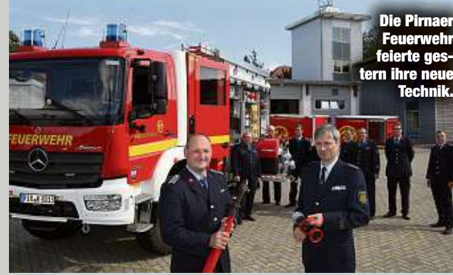
Die Pirnaer Feuerwehr feierte gestern ihre neue Technik.

Vom Freistaat gab es weitere 555.000 Euro Fördermittel. Davon soll es bis Ende 2021 eine neue Drehleiter geben. Schon seit 28. August haben die Pirnaer Kameraden ein neues Löschfahrzeug. Es ist bei der Freiwilligen Feuerwehr in Copitz im Einsatz und wurde vom Bund finanziert.