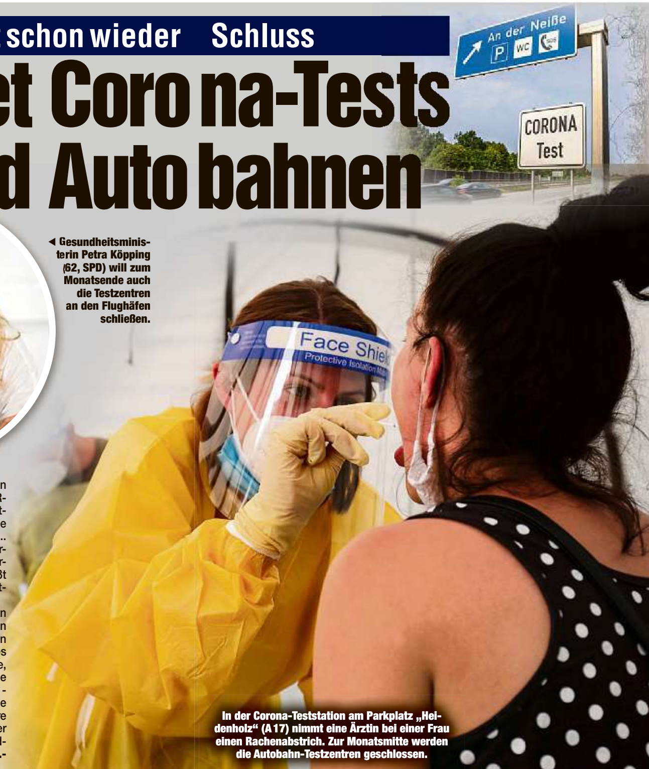
In der Corona-Teststation am Parkplatz „Heidenholz“ (A 17) nimmt eine Ärztin bei einer Frau einen Rachenabstrich. Zur Monatsmitte werden die Autobahn-Testzentren geschlossen.