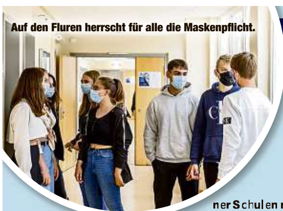
Auf den Fluren herrscht für alle die Maskenpflicht.

• Maskenpflicht • Handhygiene • Abstand auf dem Pausenhof