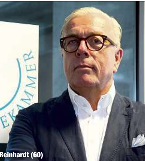
Ärztepräsident Klaus Reinhardt (60)

Die Gripeschutzimpfung führt zwar nicht zu einer spezifischen Immunisierung gegen das Coronavirus, kann aber das Immunsystem so stärken, dass eine Infektion harmloser verläuft. „Außerdem äußerte er die Vermutung, dass die Grippe dieses Jahr schwächer sein könnte als sonst.“ Durch die Corona-Routine, also durch häufiges Händewaschen, Maskentragen und Abstandhalten, werden Infektionen insgesamt reduziert.