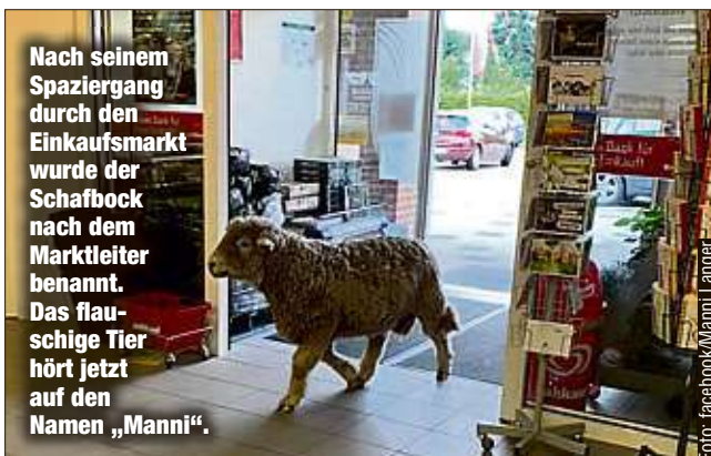
Nach seinem Spaziergang durch den Einkaufsmarkt wurde der Schafbock nach dem Marktleiter benannt. Das flauschige Tier hört jetzt auf den Namen „Manni“.