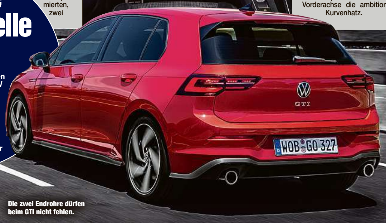
Die zwei Endrohre dürfen beim GTI nicht fehlen.

D er GTI ist nur der erste von mehreren Sportmodellen. Schon bald reicht VW auch den Power-Diesel GTD und den Plug-in-Hybriden GTE nach. Und statt eines Performance-Modells steht eine voraussichtlich rund 300 PS starke GTI-TCR-Version in den Startlöchern. Und dann kommt ja auch noch der Golf R. Der fährt dann sicherlich wieder mit Allrad vor.