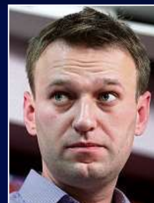
Der russische Kreml-Kritiker Alexej Nawalny (44).

In dieselbe Richtung argumentiert auch Bayerns Ministerpräsident Markus Söder (53, CSU). „Das eine hat mit dem anderen aus unserer Sicht zunächst mal nichts zu tun.“ Damit schloss er sich der Meinung von Kanzlerin Merkel an (66, CDU), die erst gestern ihren Willen für einen Weiterbau bekräftigte.