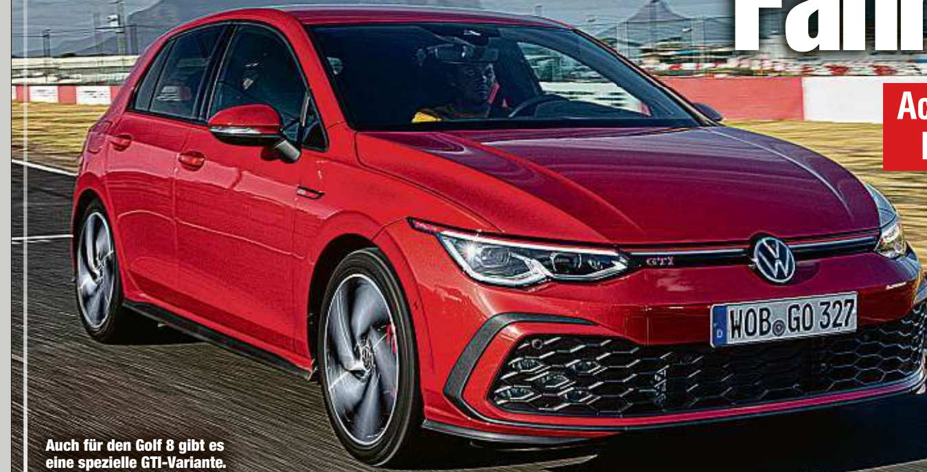
Auch für den Golf 8 gibt es eine spezielle GTI-Variante.

K ein Golf ohne GTI: Auch die neue Variante greift auf die traditionellen Elemente zurück.