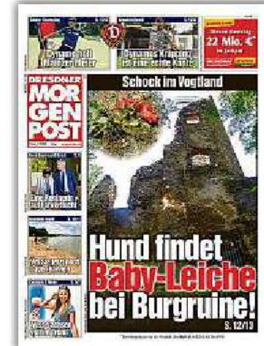
So berichtete die Morgenpost.

Eine Zeugin beobachtete, wie die Frau den Waldweg zwischen der Rentzschmühle und Barthmühle entlangsteuerte. Etwa 20 Minuten kehrte die Frau mit zügiger Geschwindigkeit in Richtung Rentzschmühle zurück. Der kompakte, dunkle Transporter mit etwa fünf bis acht Sitzplätzen war rundherum mit Fensterscheiben ausgestattet. Die Polizei erhofft sich von der Kleinbus-Fahrerin wertvolle Hinweise. Aber vielleicht habe sie sich auch nur im Wald verfahren. „Die Ermittler der Mordkommission und die Rechtsmedizin Gera-Zwickau beschäftigt vor allem die Frage, seit wann genau die Leiche dort lag“, sagt ein Polizeisprecher. Um den Zeitpunkt einzu-