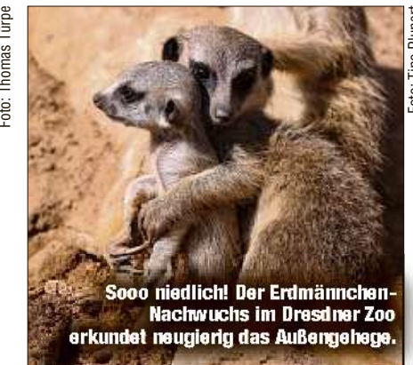
Sooo niedlich! Der Erdmännchen-Nachwuchs im Dresdner Zoo erkundet neugierig das Außengehege.