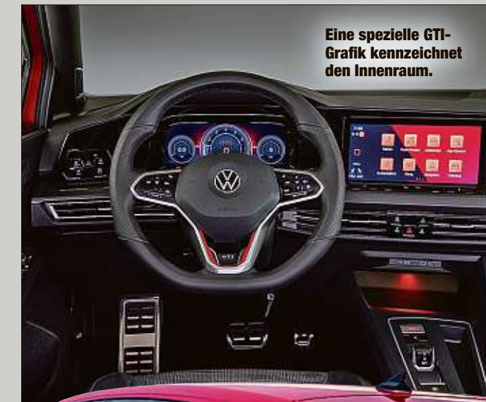
Eine spezielle GTI-Grafik kennzeichnet den Innenraum.

Liter großen Vierzylinder-Turbo-benziner. Dabei wurde die ehemalige Performance-Variante zum Standard: 245 PS und 370 Newtonmeter Drehmo-ment liefert der Ottomotor im Idealfall ab.