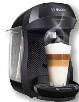
HEISSGETRÄNKE-AUTOMAT TAS1002 „TASSIMO HAPPY“ von BOSCH | Farbe: Schwarz Art.-Nr. 2003837