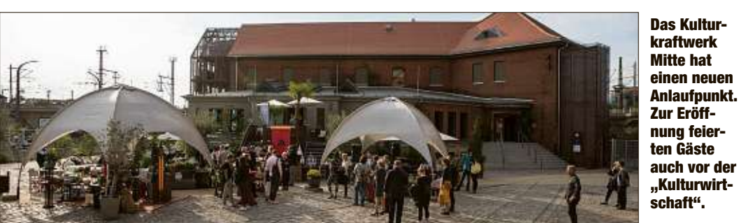
Das Kulturkraftwerk Mitte hat einen neuen Anlaufpunkt. Zur Eröffnung feierten Gäste auch vor der „Kulturwirtschaft“.