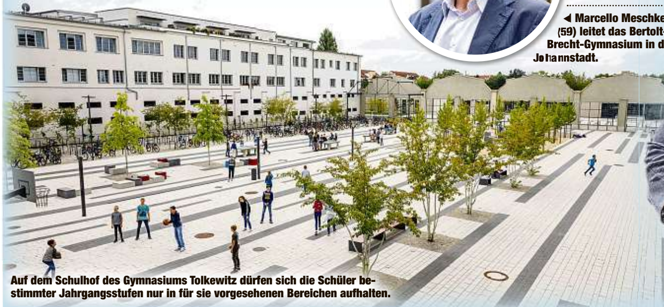
Auf dem Schulhof des Gymnasiums Tolkewitz dürfen sich die Schüler bestimmter Jahrgangsstufen nur in für sie vorgesehenen Bereichen aufhalten.