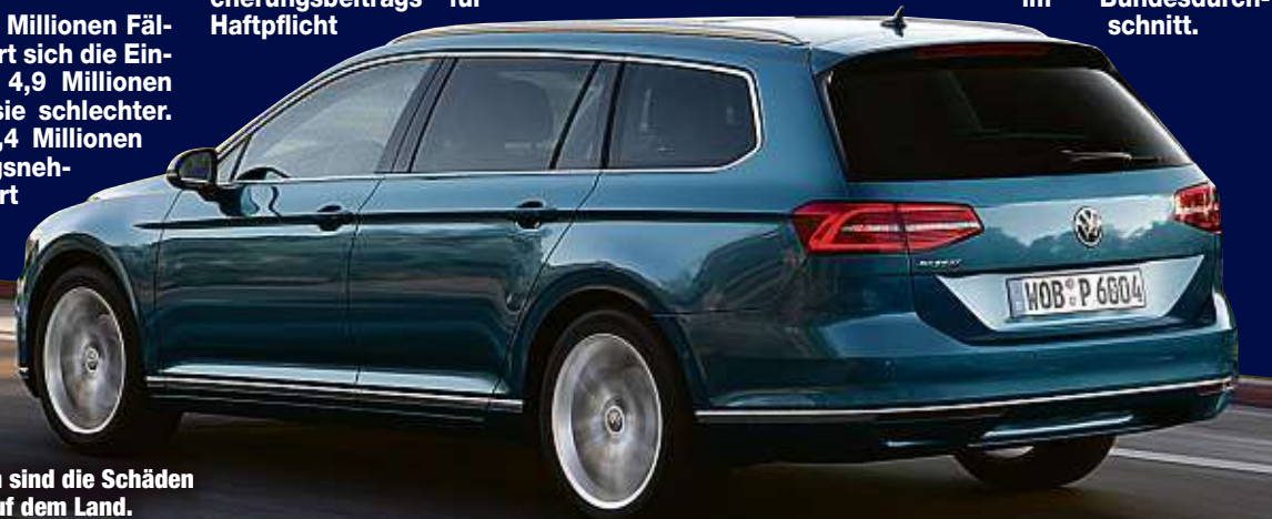
In Großstädten sind die Schäden häufiger als auf dem Land.

Ebenfalls gut schnitten die Bundesländer Schles-wig-Holstein, Niedersachsen und Mecklenburg-Vor-pommern ab. Besonders teure Regionalklassen gelten in Großstädten so-wie in Teilen Bayerns. Die schlechteste Schadenbilanz hatte, wie schon in den Vorjahren, Berlin, wo die Schäden um mehr als ein Drittel höher lagen als im Bundesdurchschnitt.