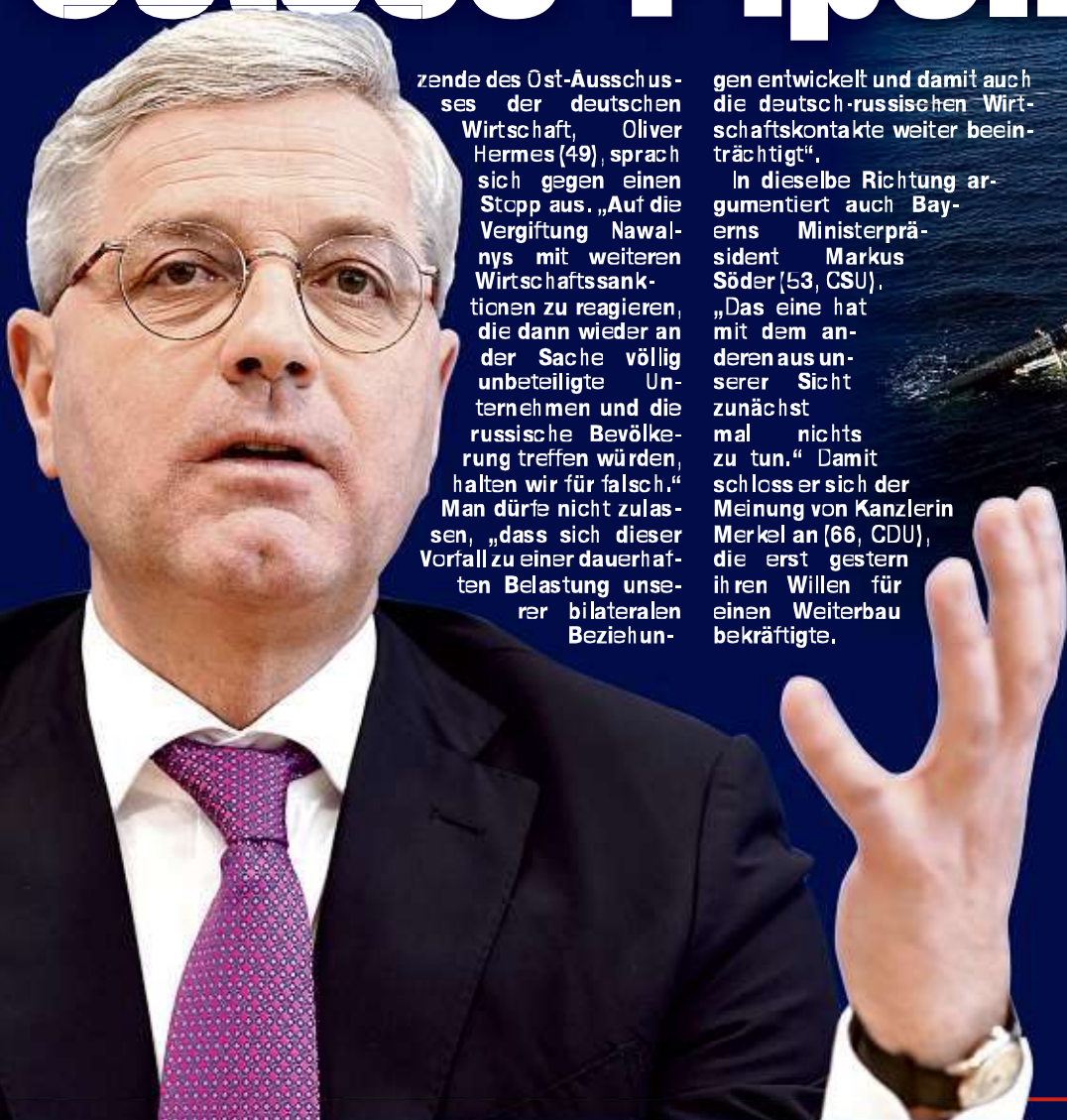
Norbert Röttgen (55, CDU) stellt nach den neuesten Ereignissen auch die Ostsee-Pipeline infrage.

„Jetzt sind wir erneut brutal mit der menschenverachtenden Realität des Regimes Putin konfrontiert worden“, so der Vorsitzende des Auswärtigen Ausschusses des Bundestages, Norbert Röttgen (55, CDU), in den „Tagesthemen“. Der Fall Nawalny sei aber kein deutsch-russisches Thema, sondern es müsse eine „klare, harte europäische Antwort geben“, bei der alles auf den Prüfstand kommt. Dazu zähle seiner Meinung nach auch die Ostsee-Pipeline Nord Stream 2, deren Weiterbau eine „maximale Bestätigung und Ermunterung“ für Wladimir Putin (67) und dessen Politik wäre. „Ein Regime, das Giftmorde organisiert, ist kein Partner für große Kooperationsprojekte - auch nicht für Pipeline-Projekte“, stimmte auch FDP-Chef Christian Lindner (41) im „Morgenmagazin“ ein. Doch das sieht nicht jeder so. Der Vorsitz-