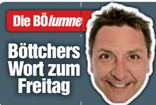
Die BÖlume: Böttchers Wort zum Freitag

sich da drei Polizisten heldenhaft in den Weg gestellt haben: Wenn die Verantwortlichen ihren Job gemacht hätten, bräuhete es keine Helden. Sie haben das mitbekommen: Drei Beamte reichen als Objektschutz des Reichstages. Okay, zur Unterstützung der armen Männer hat man ja noch die Rasensprenger angestellt. Nein, nicht Wasserwerfer. Die Rasensprenger auf der Wiese vor dem Bundestagsgebäude. Konnte ja keiner ahnen, dass bei einer Demo, die „Sturm auf Berlin“ heißt, die wirklich machen, was sie ankündigen. Demonstrieren ist ein hohes demokratisches Gut. Und auch wenn es schwerfällt und die Gründe noch so abstrus sind, erlaubt. Aber wer beim Aufruf zur Demo schon offen auf die Verfassung