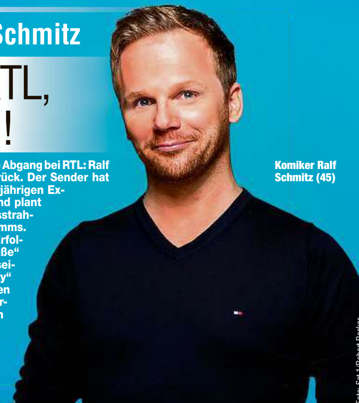
Komiker Ralf Schmitz (45)

UNTERFÖHRING - Der nächste Abgang bei RTL: Ralf Schmitz (45) kehrt zu Sat.1 zurück. Der Sender hat mit dem Comedian einen mehrjährigen Exklusivvertrag abgeschlossen und plant mit ihm unter anderem die Ausstrahlung seines Live-Bühnenprogramms. Schmitz hatte die ersten Erfolge mit der Sat.1-„Schillerstraße“ gefeiert und war bis 2009 mit seiner Show „Schmitz in the City“ bei dem Sender zu sehen. In den vergangenen Jahren moderierte der 45-Jährige mit großem Erfolg die RTL-Kuppel-Show „Take me Out“ und zuletzt auch das RTL-Format „Hotel Verschmitzt“.