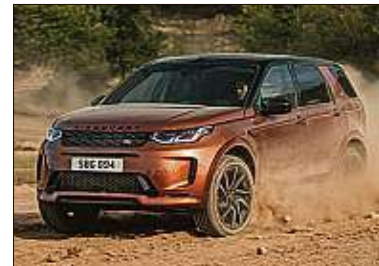
Land Rover spendiert neue Triebwerke.

Mit zwei neuen Dieselmotoren (D165/ D200) sowie den neuen Benzinern P160 und P290 starten die Land-Rover-Bau-reihen Evoque und Discovery Sport ins Modelljahr 2021. Neu im Programm sind außerdem die Ausstattungen Autobiography (Evoque) und Black Sport (Discovery), das Infotainmentsystem Pivi sowie neue Luftreinigungstechnik für die Klimaanlage. Die Preise starten bei rund 37.000 bzw. 38.000 Euro (Evoque).