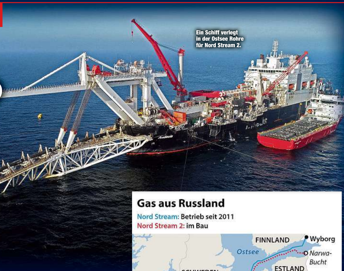
Ein Schiff verlegt in der Ostsee Rohre für Nord Stream 2.