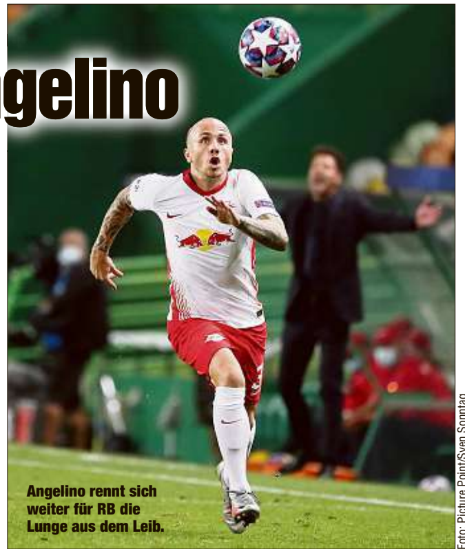
Angelino rennt sich weiter für RB die Lunge aus dem Leib.

RB verpflichtete den offensiven Mittelfeldspieler Lazar Samardzic von Hertha BSC. Der hochveranlagte 18-Jährige kostet 500000 Euro Ablöse und kommt für fünf Jahre. Auch der FC Bayern war an ihm dran.