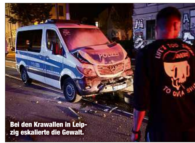
Bei den Krawallen in Leipzig eskalierte die Gewalt.

Personell wird der „Doppelklick“ keine Konsequenzen haben, technisch aber möglicherweise: „Wir stehen mit dem Anbieter des genutzten Social-Media-Management-Tools in Kontakt und lassen prüfen, die Funktion zum Retweeten sperren zu lassen“, so Ziehm. Für Samstag sind in Leipzig weitere Versammlungen angezeigt.