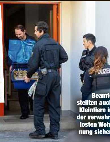
Beamte stellten auch Kleintiere in der verwahrlosten Wohnung sicher.