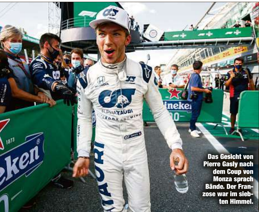
Das Gesicht von Pierre Gasly nach dem Coup von Monza sprach Bände. Der Franzose war im siebten Himmel.

Wobei Letzteres nur teilweise zutrifft. AlphaTauri ist schließlich das Ausbilder-Team des Brause-Konzerns. Und Gasly fuhr schon für Red Bull - allerdings nur nach zwölf Rennen Schluss. Ein Jahr später der Paukenschlag, was neben seinem Kumpel Charles Leclerc (Ferrari) auch Weltmeister Lewis Hamilton besonders freute. „Er hat sich das so verdient“, schrieb