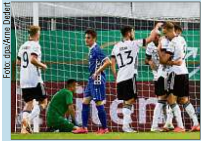
Beim 4:1 gegen Moldau hatten unsere Bubis schon mal reichlich Grund zum Jubeln. Und was wird heute?