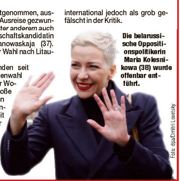
Die belarussische Oppositionspolitikerin Maria Kolesnikowa (38) wurde offenbar entführt.

MINSK - Von Maria Kolesnikowa (38), eine der wichtigsten Anführerinnen der Opposition in Belarus, fehlt seit gestern jede Spur. Ihre Kollegen hätten keinen Kontakt mehr zu ihr, teilte der Koordinierungsrat der Demokratiebewegung in Minsk mit. Einer Augenzeugin zufolge haben Unbekannte Kolesnikowa gestern Morgen in einen Minibus gesteckt und entführt. Dies wurde vom Koordinierungsrat bislang jedoch nicht bestätigt. Die 38-Jährige ist eine der wichtigsten Oppositionellen, die sich gegen den umstrittenen Staats-Chef Alexander Lukaschenko (66) stellen. Einige Kollegen des Gremiums waren