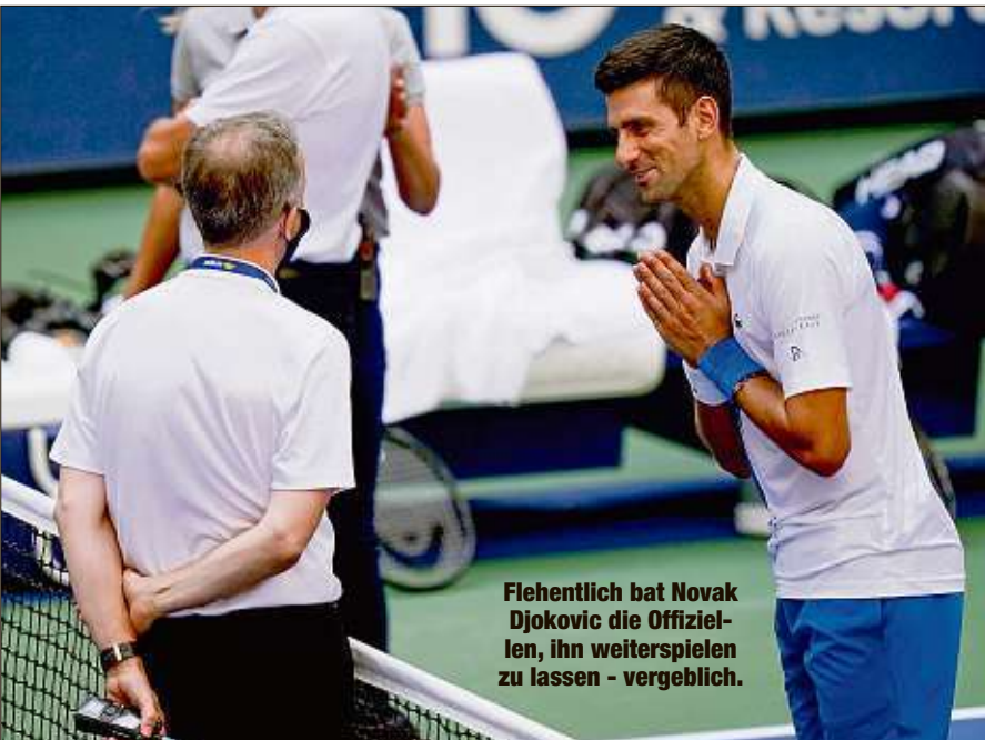
Flehentlich bat Novak Djokovic die Offiziellen, ihn weiterspielen zu lassen - vergeblich.