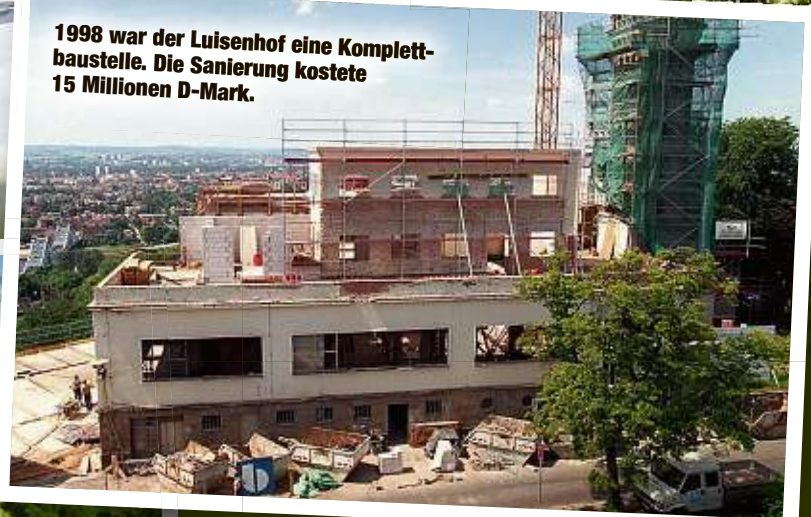
1998 war der Luisenhof eine Komplettbaustelle. Die Sanierung kostete 15 Millionen D-Mark.