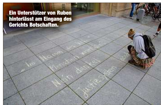
Ein Unterstützer von Ruben hinterlässt am Eingang des Gerichts Botschaften.