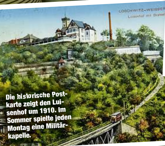
Die historische Postkarte zeigt den Luisenhof um 1910. Im Sommer spielte jeden Montag eine Militärkapelle.