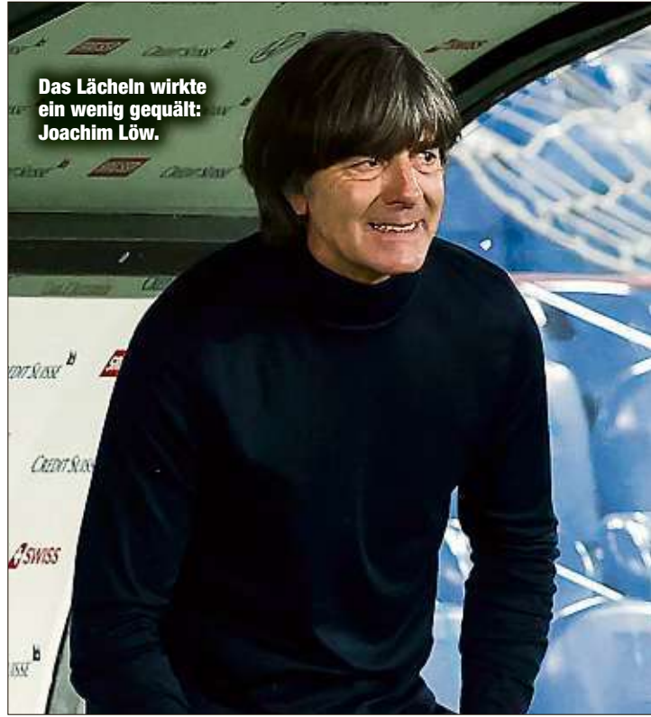
Das Lächeln wirkte ein wenig gequält: Joachim Löw.

Im heißen Herbst mit noch sechs Spielen „werden wir mit der vollen Kapelle antreten“, kündigte der Bundestrainer nach dem teil-