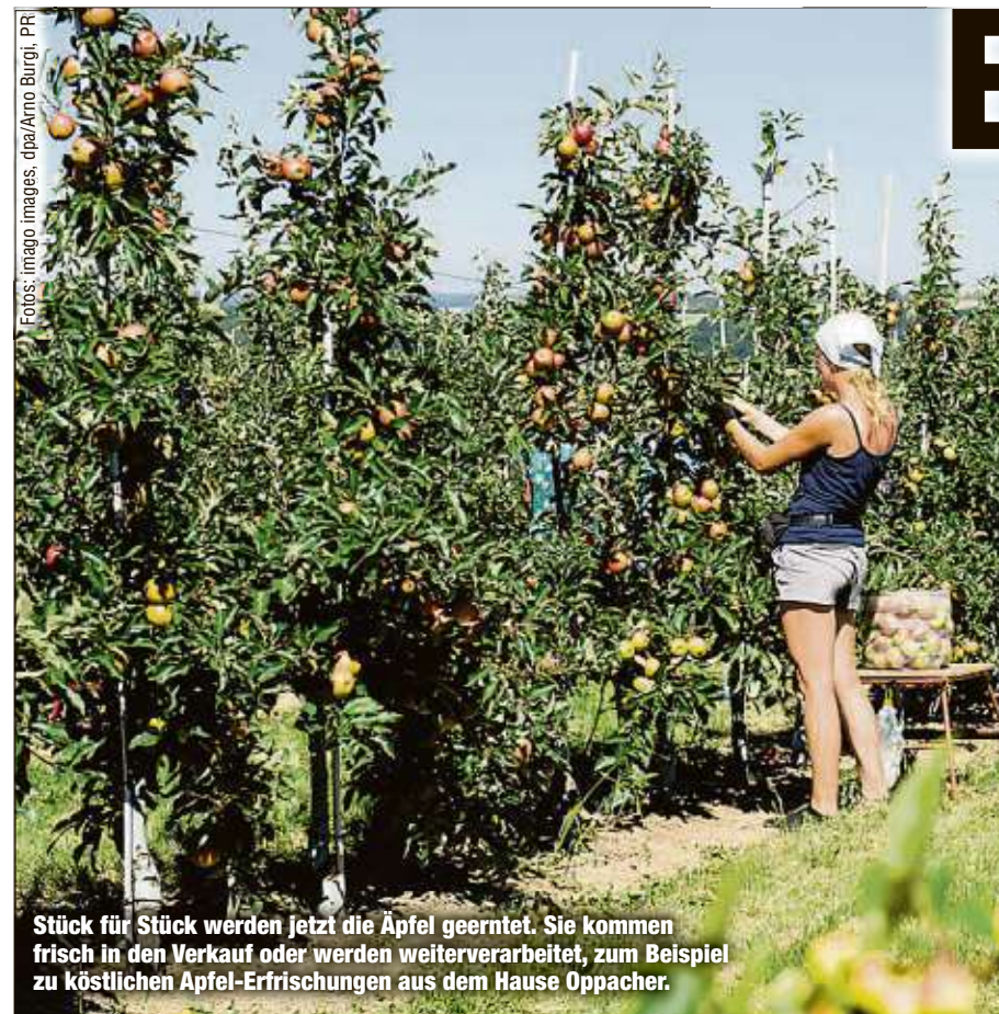
Stück für Stück werden jetzt die Äpfel geerntet. Sie kommen frisch in den Verkauf oder werden weiterverarbeitet, zum Beispiel zu köstlichen Apfel-Erfrischungen aus dem Hause Oppacher.

Wanderfreunde, die an der „MOPO-Herbstwanderung“ teilnehmen, können das schmecken. Oppacher ist Partner der Morgenpost-Herbstwanderung und versorgt die Wanderer an der gesamten Strecke mit ausreichend Getränken: ein Stückchen Heimat aus dem Hause Oppacher - stärkend und durstlöschend. K.F.