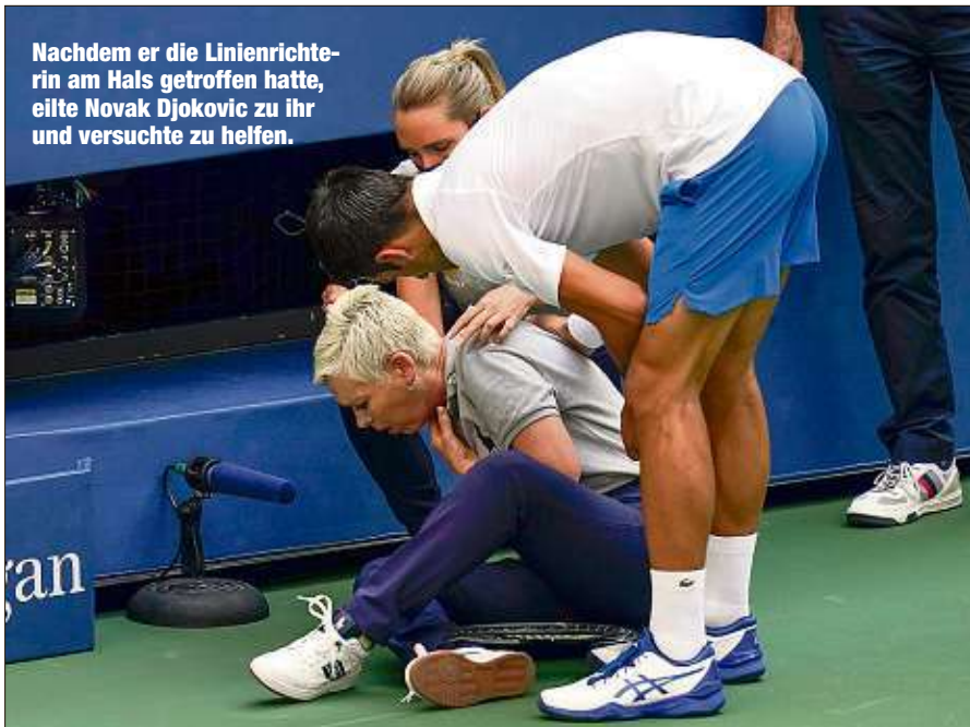
Nachdem er die Linienrichterin am Hals getroffen hatte, eilte Novak Djokovic zu ihr und versuchte zu helfen.