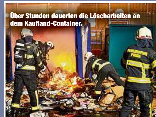
Über Stunden dauerten die Löscharbeiten an dem Kaufland-Container.

Zuerst eilten die Kameraden gegen 19.40 Uhr zur Struppener Straße (neben dem Sportplatz). Dort rauchte es oberhalb des Nummernschildes aus einem abgeparkten MAN-Brummi. Hier fackelten die Kameraden nicht lange, griffen zu einer vollen Gießkanne und erstickten den Brandherd mit einem gezielten Schwapp. Eine Stunde später reichte dieses Mittel nicht mehr aus. Ebenfalls an der Struppener Straße loderten die Flammen meterhoch. Diesmal brannte ein mit Pappe bestückter Container. 38 Kameraden waren bis in die Nacht im Einsatz. Inzwischen wurden sie gegen 21 Uhr zu einem dritten Einsatz gerufen. Am Hausberg/Schandauer Straße brannte ein Holztor, das schnell gelöscht wurde. „Wir ermitteln wegen Brandstiftung und prüfen die Zusammenhänge“, so Polizeisprecher Lukas Reumund (43). Anne Müller