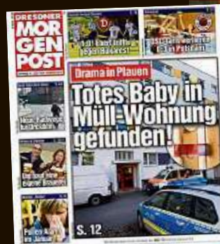
So berichtete die Dresdner Morgenpost am 16. Januar über den Fund der Babyleiche.