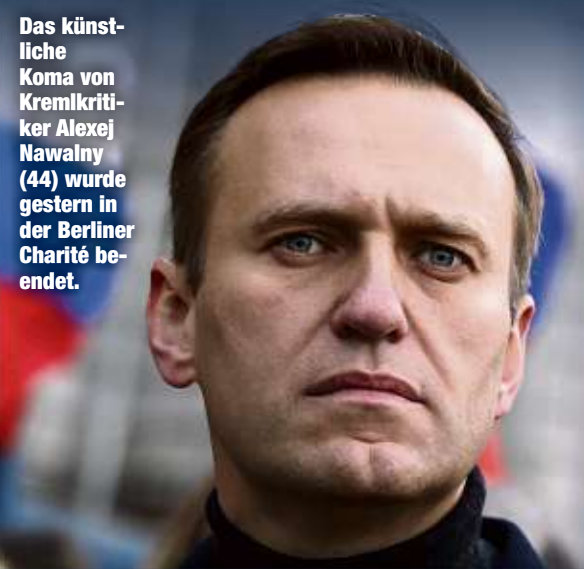
Das künstliche Koma von Kremkritiker Alexej Nawalny (44) wurde gestern in der Berliner Charité beendet.

BERLIN - Beim russischen Kremkritiker Alexej Nawalny (44) ist das künstliche Koma beendet worden. Er wird nun schrittweise von der maschinellen Beatmung entwöhnt. Der Gesundheitszustand von Nawalny habe sich verbessert, er reagierte bereits auf Ansprechen, teilte die Berliner Charité gestern mit. Nawalny war am 20. August ins Koma gefallen und später auf Drängen seiner Familie in die Charité verlegt worden. Die Bundesregierung hatte nach Untersuchungen eines Spezial-Labors der Bundeswehr mitgeteilt, dass sie es als zweifelsfrei erwiesen anse-