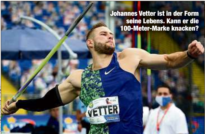
Johannes Vetter ist in der Form seine Lebens. Kann er die 100-Meter-Marke knacken?