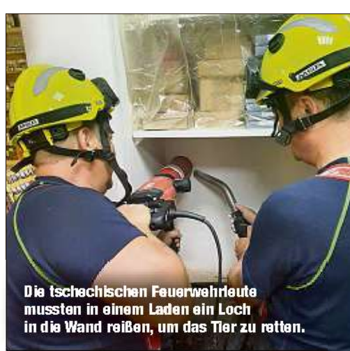
Die tschechischen Feuerwehrlaute mussten in einem Laden ein Loch in die Wand reißen, um das Tier zu retten.

KLADNO - Mit schwerem Gerät hat die Feuerwehr in Tschechien eine Katze aus einer misslichen Lage befreit. Der süße Vierbeiner war in Kladno bei Prag in einen 30 Zentimeter breiten Spalt zwischen zwei Häusern gesürzt und konnte sich keinen Zentimeter mehr bewegen. Zunächst versuchten die Einsatzkräfte, die Katze mit einem Seil herauszuholen. Erfolglos. Es half also nix: Die Kameraden mussten ein Loch in eine der beiden Wände reißen. „Das musste sehr vorsichtig geschehen, damit das Tier keine weiteren Verletzungen erleidet“, erklärte eine Sprecherin gestern. Nach der dreistündigen Rettungsaktion konnte die Katze dann endlich ihrer Besitzerin übergeben werden.