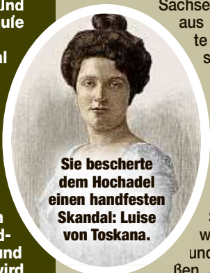
Sie bescherte dem Hochadel einen handfesten Skandal: Luise von Toskana.

Der Name „Luisenhof“ erinnert an Luise von Toskana (1870-1947), die Gattin von Prinz Friedrich August von Sachsen. Die in der Bevölkerung überaus beliebte Kronprinzessin brachte sechs Kinder zur Welt. Mit dem siebten Kind vom Hauslehrer ihrer Kinder schwanger, floh die österreichische Erzherzogin mit ihrem Bruder Richtung Genfer See.