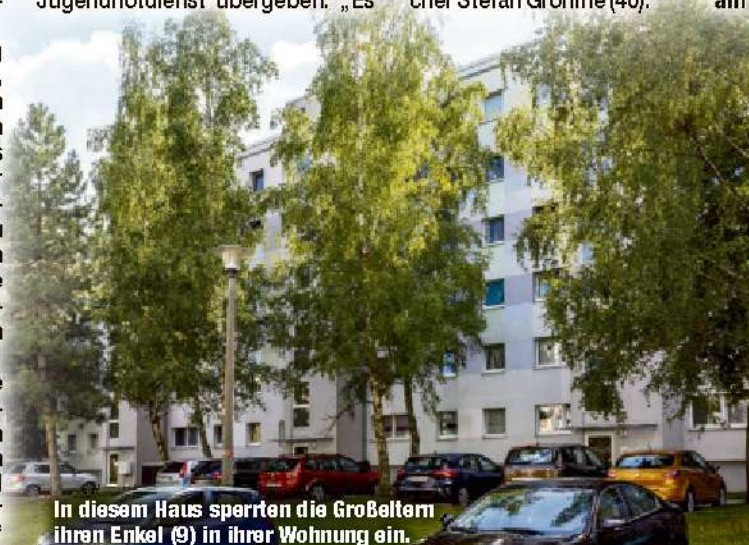
In diesem Haus sperrten die Großeltern ihren Enkel (9) in ihrer Wohnung ein.

offensichtlich leichter gewesen als der Rückweg am Abend. Der Junge wurde dem Kinder- und Jugendnotdienst übergeben. „Es besteht Verdacht auf Kindeswohlgefährdung. Wir prüfen, ob eine Straftat vorliegt“, so Polizeisprecher Stefan Grohme (40). am