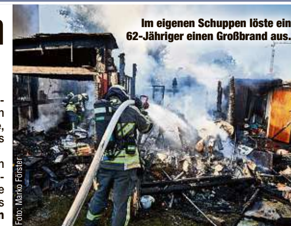
Im eigenen Schuppen löste ein 62-Jähriger einen Großbrand aus.

Freie retten, jedoch geriet der Schuppen in Brand. Die Flammen erfassten die angrenzende Garage und Laube, auch das Dach des Nachbarhauses und die Fassade wurden beschädigt. 17 Kameraden löschten den Brand. „Ein Brandursachenermittler wird nach der genauen Ursache schauen“, so Polizeisprecher Lukas Reumund (43). am