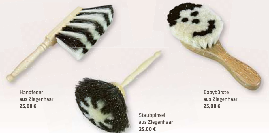
Handfeiger aus Ziegenhaar 25,00 €

Eines haben fast alle Bürsten gemeinsam: Sie sind nicht nur schön und praktisch, sondern vor allem echte Naturbürsten. Bei der Auswahl der Materialien stehen natürliche und nachhaltige Rohstoffe immer an erster Stelle. Entdecken auch Sie die Vielfalt.