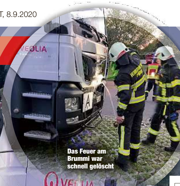
Das Feuer am Brummi war schnell gelöscht