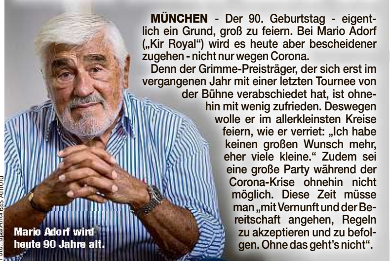
Mario Adorf wird heute 90 Jahre alt.

MÜNCHEN - Der 90. Geburtstag - eigentlich ein Grund, groß zu feiern. Bei Mario Adorf („Kir Royal“) wird es heute aber bescheidener zugehen - nicht nur wegen Corona. Denn der Grimme-Preisträger, der sich erst im vergangenen Jahr mit einer letzten Tournee von der Bühne verabschiedet hat, ist ohnehin mit wenig zufrieden. Deswegen wolle er im allerkleinsten Kreise feiern, wie er verriet: „Ich habe keinen großen Wunsch mehr, eher viele kleine.“ Zudem sei eine große Party während der Corona-Krise ohnehin nicht möglich. Diese Zeit müsse man „mit Vernunft und der Bereitschaft angehen, Regeln zu akzeptieren und zu befolgen. Ohne das geht's nicht“.