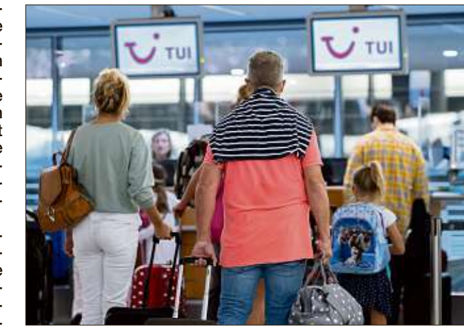
Die Reiseverwarnungen sind keinesfalls nur für Touristen ein Problem - auch die deutsche Wirtschaft leidet unter ihnen.

BERLIN - Spitzenverbände der deutschen Wirtschaft haben die Bundesregierung zu einem Kurswechsel bei Beschränkungen von Auslandsreisen aufgefordert. Die verlängerten und ausgeweiteten Einschränkungen hätten vielfältige negative wirtschaftliche Auswirkungen, die weit über den Tourismus hinausgingen. Es müsse zu einer „verhältnismäßigen“ Strategie kommen. In einer Erklärung der Verbände heißt es, die Wirtschaft sei sich bewusst, dass Reisebeschränkungen ein Instru-