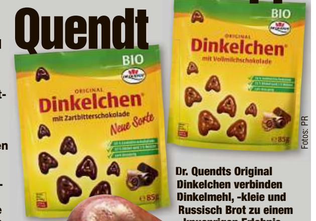
Dr. Quendts Original Dinkelchen verbinden Dinkelmehl, -kleie und Russisch Brot zu einem knusprigen Erlebnis.

Dr. Quendt versüßt seit Generationen das Leben. Dresdner Christstollen, Russisch Brot, Original Dominosteine - das sind die wohl bekanntesten sächsischen Spezialitäten, die aus dem Dresdner Traditionsunternehmen stammen. Gebäck, Snacks, Stollen, Confiterie - die Liebe zur Backtradition brachte sehr viele köstliche Gebäck-Kreationen hervor. Dazu gehören auch Dinkelchen und Bemmenchen.