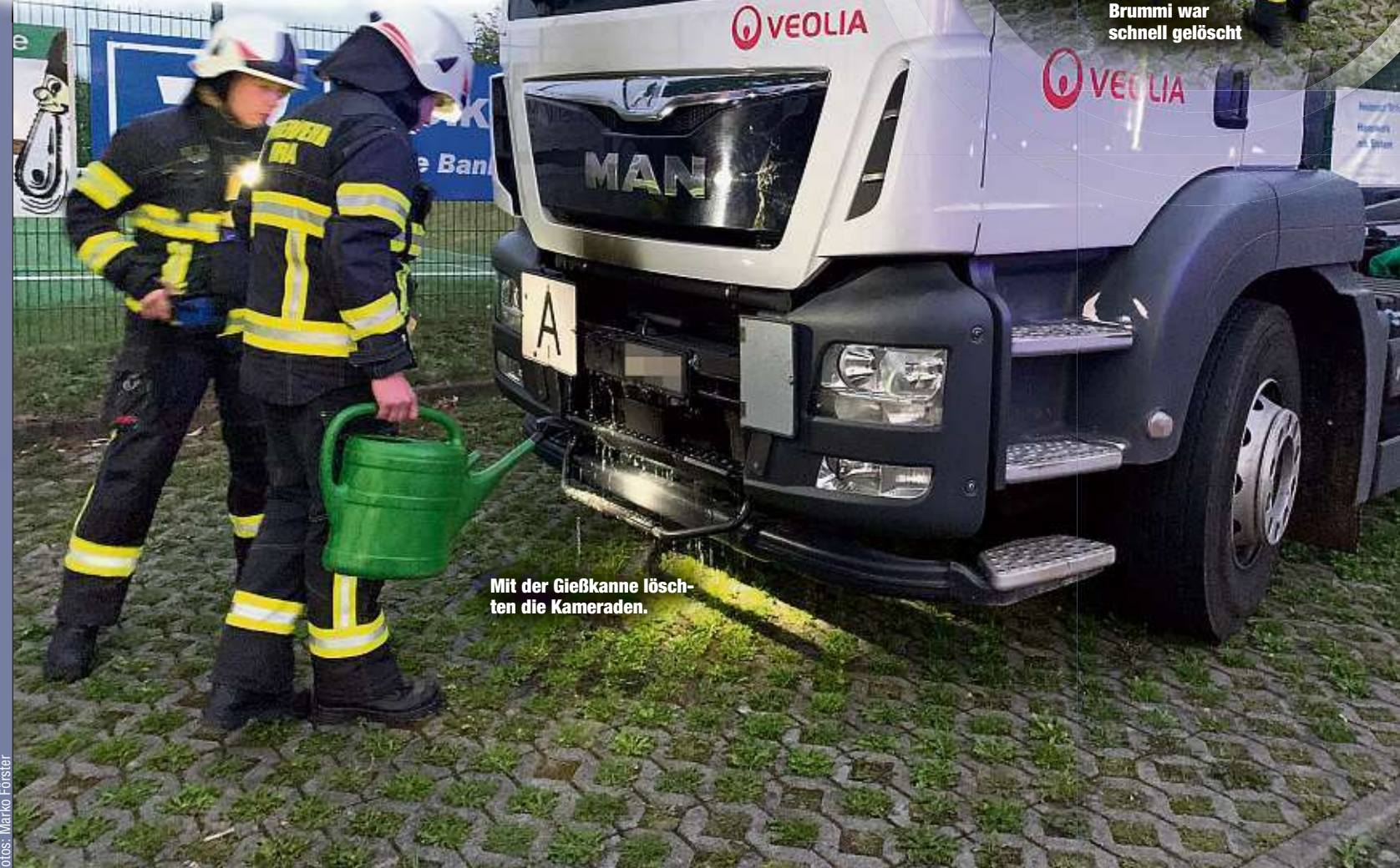
Mit der Gießkanne löschten die Kameraden.