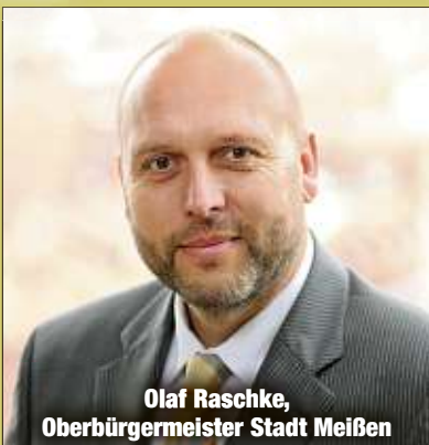
Olaf Raschke, Oberbürgermeister Stadt Meißen

Verwunschene Mühlen, sprudelnde Bäche, Wälder, Wiesen und Weiden und immer wieder wunderschöne Panoramablicke nach Meißen und ins Elbtal - eine Tour durch die linkselbischen Täler ist für Wanderfreunde ein echter Geheimtipp.