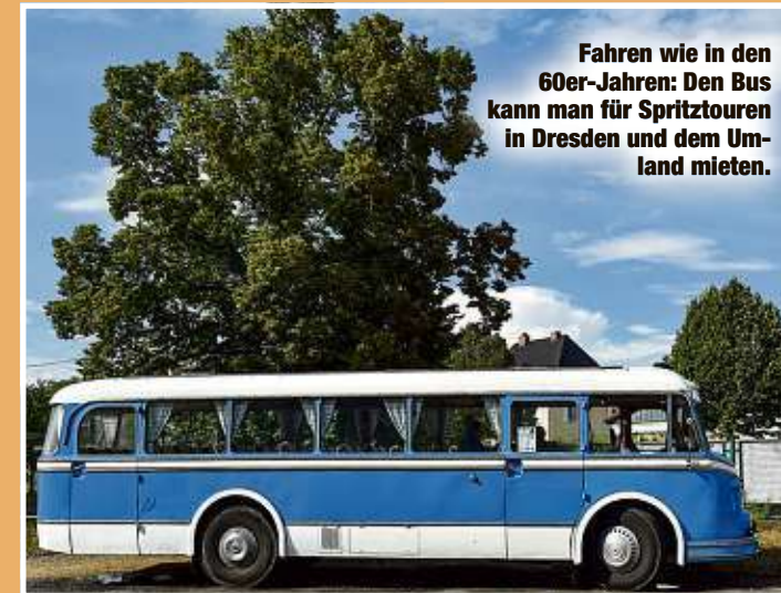
Fahren wie in den 60er-Jahren: Den Bus kann man für Spritztouren in Dresden und dem Umland mieten.

Der Freitaler kaufte den Bus, restaurierte ihn zwei Jahre lang, erneuerte Blech, Böden, Lackierung. „Mich fasziniert diese Technik. Wo