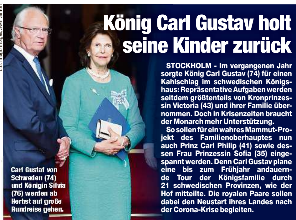
Carl Gustav von Schweden (74) und Königin Silvia (76) werden ab Herbst auf große Rundreise gehen.

STOCKHOLM - Im vergangenen Jahr sorgte König Carl Gustav (74) für einen Kahlschlag im schwedischen Königshaus: Repräsentative Aufgaben werden seitdem größtenteils von Kronprinzessin Victoria (43) und ihrer Familie übernommen. Doch in Krisenzeiten braucht der Monarch mehr Unterstützung. So sollen für ein wahres Mammut-Projekt des Familienoberhauptes nun auch Prinz Carl Philip (41) sowie dessen Frau Prinzessin Sofia (35) eingespannt werden. Denn Carl Gustav plane eine bis zum Frühjahr andauernde Tour der Königsfamilie durch 21 schwedischen Provinzen, wie der Hof mitteilte. Die royalen Paare sollen dabei den Neustart ihres Landes nach der Corona-Krise begleiten.