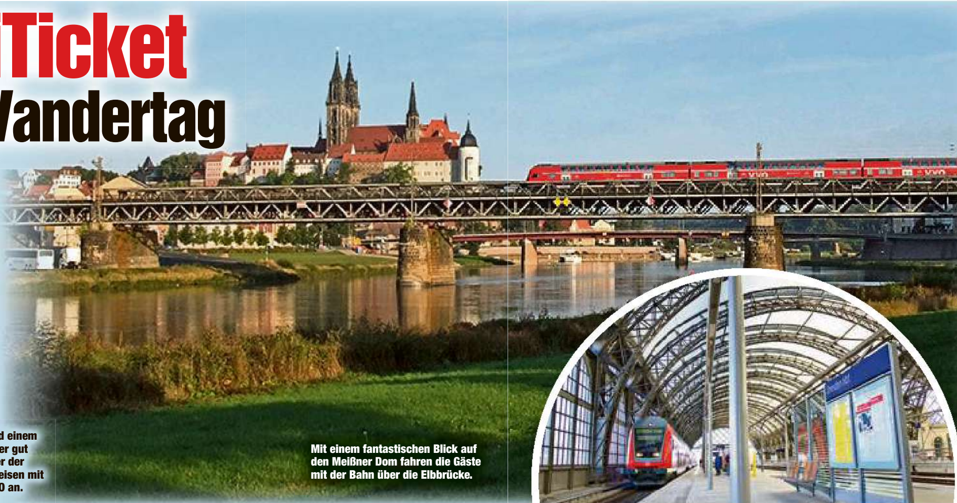
Mit einem fantastischen Blick auf den Meißner Dom fahren die Gäste mit der Bahn über die Elbbrücke.

Mit dem aktuellen Plan und einem übersichtlichen Flyer immer gut ankommen: Alle Teilnehmer der MOPO-Herbstwanderung reisen mit einem KombiTicket der VVO an.