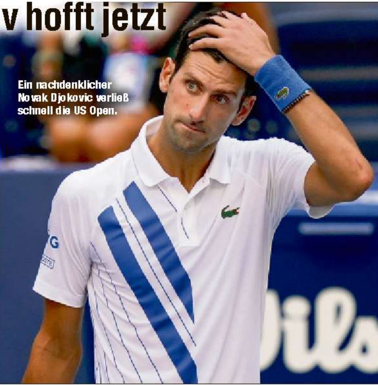
Ein nachdenklicher Novak Djokovic verließ schnell die US Open.

Bei der von ihm organisierten Adria-Tour sorgten Djokovic und andere Spieler mit Partybildern in der Corona-Pandemie für negative Schlagzeilen. Unmittelbar vor Beginn der US Open versetzte er mit der Gründung einer neuen Spielergewerkschaft die Branche in Aufruhr. Seine Erzrivalen Nadal und Federer machten sofort ihre Ablehnung öffentlich.