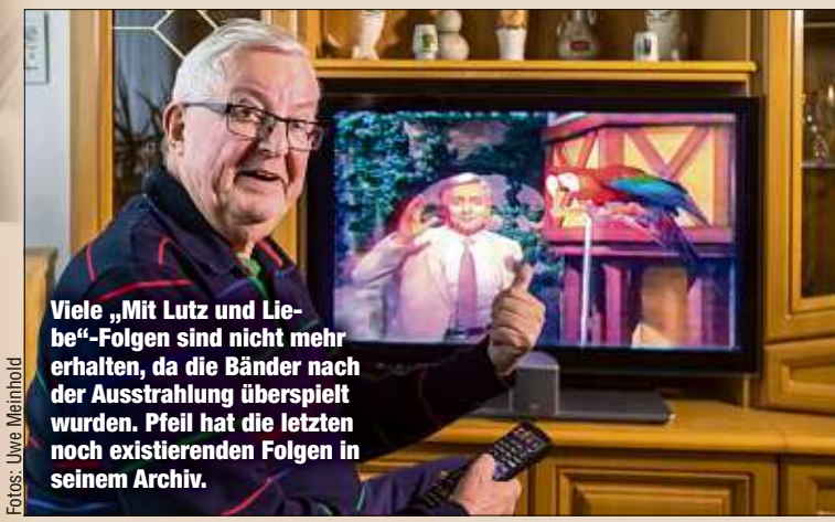
Viele „Mit Lutz und Liebe“-Folgen sind nicht mehr erhalten, da die Bänder nach der Ausstrahlung überspielt wurden. Pfeil hat die letzten noch existierenden Folgen in seinem Archiv.