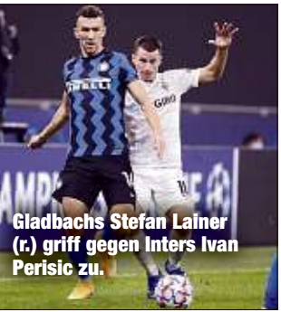
Gladbachs Stefan Lainer (r.) griff gegen Inters Ivan Perisic zu.

Borussia Mönchengladbach hat in der Fußball-Oper San Siro ein echtes Drama erlebt: Bei ihrem Champions-League-Comeback nach vier Jahren drehte die Fohlen-Elf gegen Inter Mailand zunächst einen Rückstand in eine 2:1-Führung, musste sich