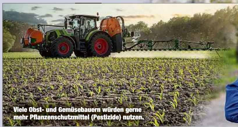
Viele Obst- und Gemüsebauern würden gerne mehr Pflanzenschutzmittel (Pestizide) nutzen.

weiter zurückgedrängt werden“, teilen die Verbände mit. Der Geschäftsführer des Landesverbandes Sächsisches Obst, Udo Jentzsch (55): „Die Verbote der Pflanzenschutzmittel machen uns das Leben schwer, führen auch zu Ernteeinbußen. So sind wir machtlos gegen manche Schädlinge.“ Durch die Globalisierung würden sich ohnehin immer mehr Schädlinge auf den Feldern ausbreiten. Eine der Forderungen ist darum, wieder mehr Pestizide zu erlauben. tyx