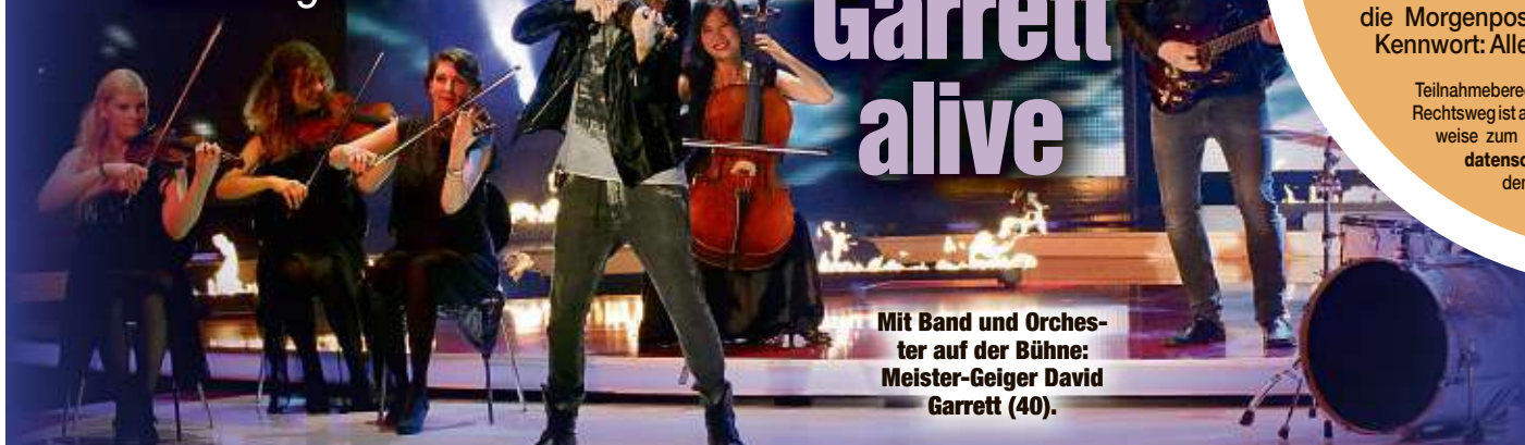
Mit Band und Orchester auf der Bühne: Meister-Geiger David Garrett (40).

Nun liegt es vor, das 11. Album des Stargeigers David Garrett (40). Mit „ALIVE - My Soundtrack“ erfüllt sich damit der Superstar der Klassik, Rock- und Popmusik selbst seine persönlichen Musikwünsche.