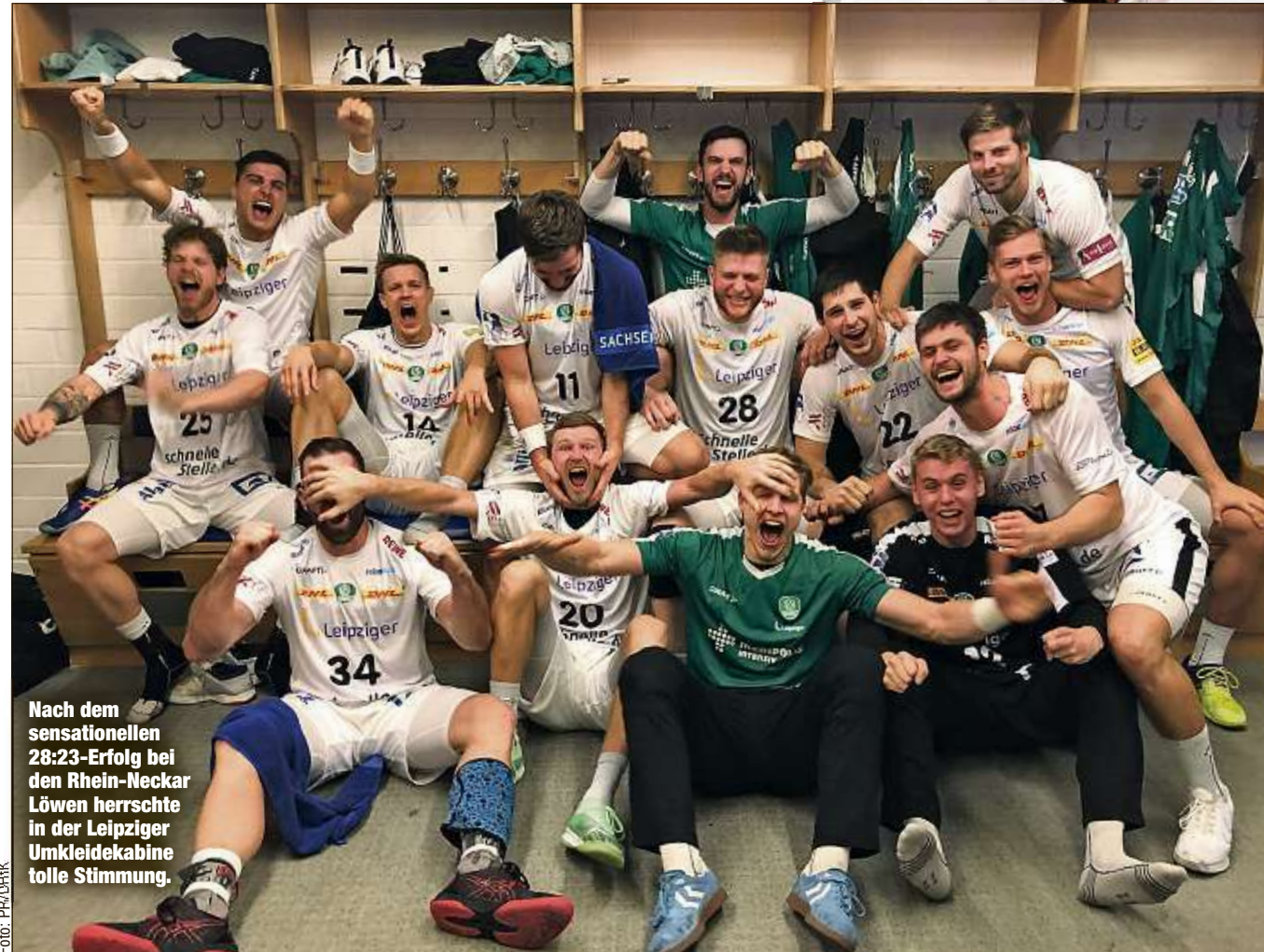
Nach dem sensationellen 28:23-Erfolg bei den Rhein-Neckar Löwen herrschte in der Leipziger Umkleidekabine tolle Stimmung.