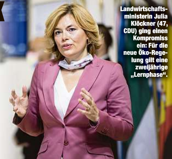
Landwirtschaftsministerin Julia Klöckner (47, CDU) ging einen Kompromiss ein: Für die neue Öko-Regelung gilt eine zweijährige „Lernphase“.

Grünen-Chef Robert Habeck (51) teilte Klöckners