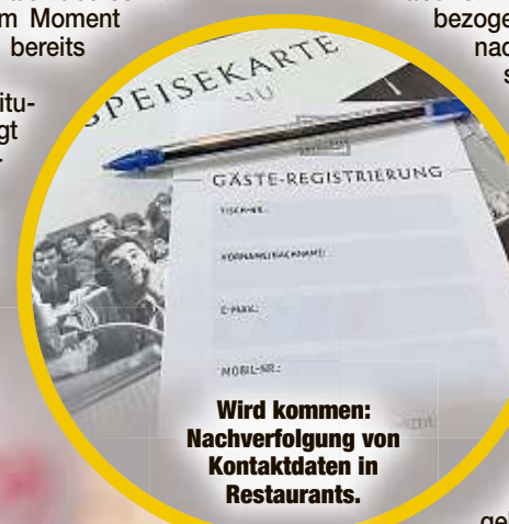
Wird kommen: Nachverfolgung von Kontaktdaten in Restaurants.

Tschechien ist bereits Corona-Hotspot. Gesundheitsministerin Köpping rät zu Änderungen im Grenzverkehr. „Meine Empfehlung lautet schon, angesichts der Infektionslage den kleinen Grenzverkehr einzuschränken. Aber aus zwingend notwendigen beruflichen, sozialen oder medizinischen Gründen soll der Grenzübergang weiter möglich sein“, so Köpping gestern auf MOPO-Anfrage. Einen Alleingang ohne Konsens in der Regierung will sie aber nicht wagen.