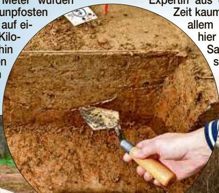
Archäologie ist manchmal auch Feinarbeit mit kleinen Schaufelchen.

als Umzäunung einer Herde diente, dafür verlief er zu gradlinig. Möglicherweise handelte es sich um eine Art Markierung innerhalb der Landschaft.“ Genaueres könne man aber nicht sagen. „Wir hoffen natürlich immer, dass wir noch weitere Hinweise finden. Vielleicht kann uns die Auswertung der Luftbildaufnahmen neue Erkenntnisse bringen.“