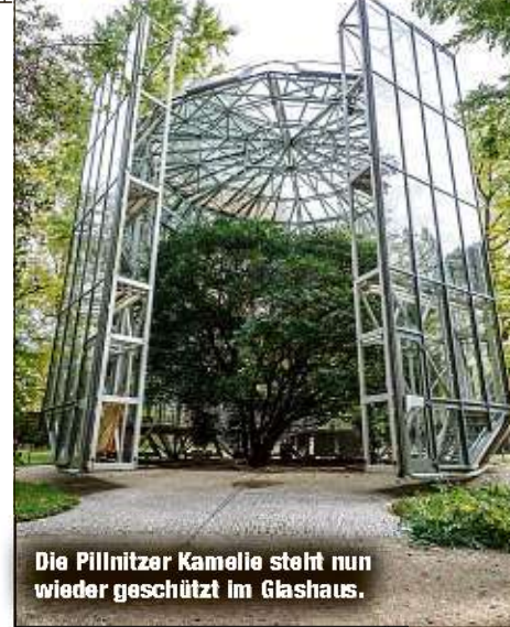
Die Pillnitzer Kamelie steht nun wieder geschützt im Glashaus.

Die Pillnitzer Kamelie ist wieder in ihrem Winterquartier. Das fahrbare Glashaus wurde gestern Vormittag im Pillnitzer Schlosspark um die älteste und größte Kamelie nördlich der Alpen geschoben. Nur zehn Minuten hat's gedauert, dann war die Kamelie wieder in ihrem Glashaus und ist nun vor dem Frost geschützt. Sie überwintert bei 4 bis 6 Grad und wird von Mitte Februar bis Mitte Mai ihre karminrote, tausendfache Blütenpracht entfalten. Der Klimacomputer des 54 Tonnen schweren und über 13 Meter hohen Gewächshauses übernimmt vollautomatisch die Steuerung von Temperatur, Belüftung, Luftfeuchte und Beschattung. Die Pillnitzer Kamelie wurde 1801 als bereits 30-jährige Pflanze von Hofgärtner Carl Adolph Terscheck im Schlosspark ausgepflanzt. Nach mehr als 200 Jahren ist sie bis heute stattliche neun Meter in die Höhe gewachsen. Ihr Kronenumfang beträgt 37 Meter. KK