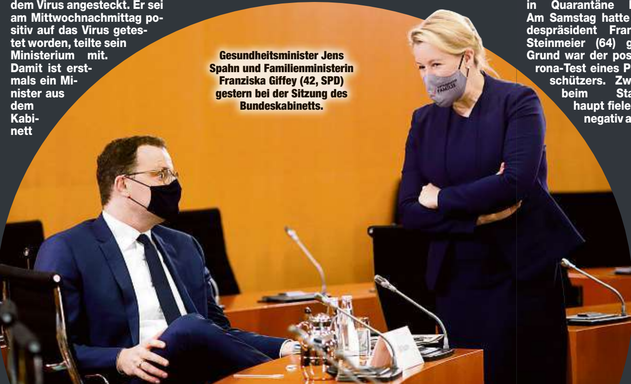
Gesundheitsminister Jens Spahn und Familienministerin Franziska Giffey (42, SPD) gestern bei der Sitzung des Bundeskabinetts.

Bundesgesundheitsminister Jens Spahn (40, CDU), eine Schlüsselfigur im Kampf gegen die Corona-Pandemie in Deutschland, hat sich mit dem Virus angesteckt. Er sei am Mittwochmittag positiv auf das Virus getestet worden, teilte sein Ministerium mit. Damit ist erstmals ein Minister aus dem Kabinett