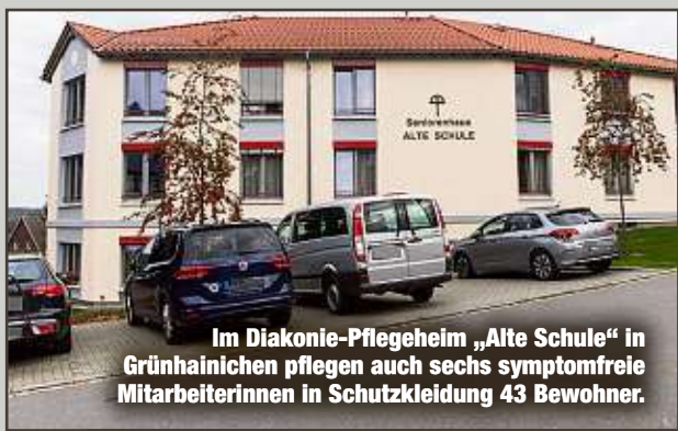
Im Diakonie-Pflegeheim „Alte Schule“ in Grünhainichen pflegen auch sechs symptomfreie Mitarbeiterinnen in Schutzkleidung 43 Bewohner.