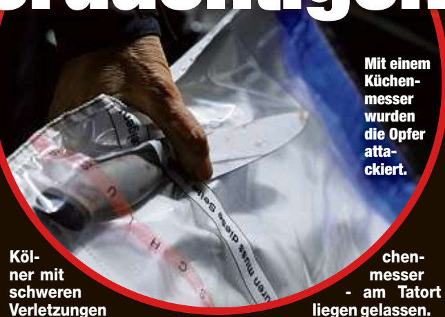
Mit einem Küchenmesser wurden die Opfer attackiert.

te die Soko „Schloßstraße“ mit 29 Beamten seit einer Woche, um den Messer-mord an einem Touristen († 55) aus Krefeld aufzuklären. Dieser war mit einem Freund (53) aus Köln am 4. Oktober gegen 21.30 Uhr an der Rosmaringasse/Ecke Schloßstraße von Abdullah mit einem Messer angegriffen worden. Während der