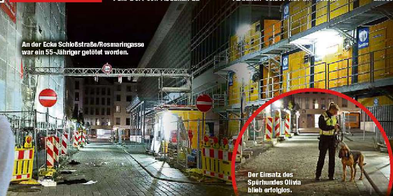
Der Einsatz des Spürhundes Olivia blieb erfolglos.