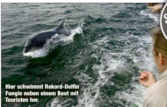
Hier schwimmt Rekord-Delfin Fungie neben einem Boot mit Touristen her.