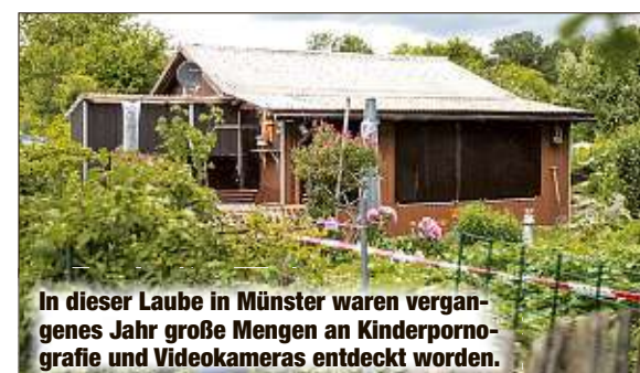
In dieser Laube in Münster waren vergangenes Jahr große Mengen an Kinderpornografie und Videokameras entdeckt worden.

Die Bundesregierung will Kindesmissbrauch in Zukunft deutlich härter bestrafen. Dem entsprechenden Gesetzentwurf von Justizministerin Christine Lambrecht (55, SPD) wurde gestern zugestimmt. Dieser sieht neben schärferen Strafen eine effektivere Strafverfolgung und eine verbesserte Prävention vor. „Um diese Gräueltaten mit