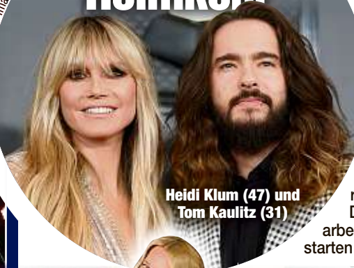
Heidi Klum (47) und Tom Kaulitz (31)

Germany hat seine Topmodel-Jurorin wieder! Heidi Klum (47) ist in Deutschland eingetroffen. Die Model-Mama und ihre Familie haben bereits ihr Quartier in Berlin bezogen.