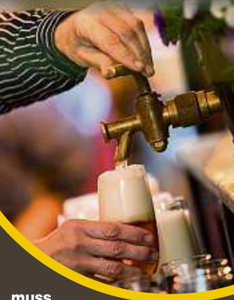
Künftig gilt von 23 bis 5 Uhr ein Verkaufsverbot von Alkohol.

Überall gilt von 23 bis 5 Uhr ein Verkaufsverbot von Alkohol. In Betrieben, Sportstätten, Restaurants und Unterküften sowie bei Ansammlungen im öffentlichen Raum und bei Groß- und Sportveranstaltungen müssen nun zur Kontaktnachverfolgung Name, Telefonnummer oder E-Mail-Adresse und Zeitraum des Besuchs angegeben werden. Ein Mund-Nasen-Schutz