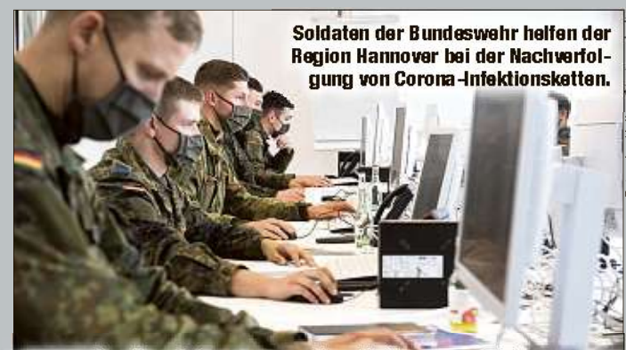
Soldaten der Bundeswehr helfen der Region Hannover bei der Nachverfolgung von Corona-Infektionsketten.