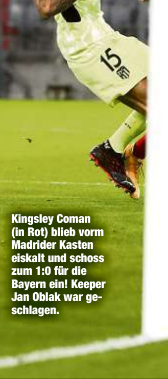
Kingsley Coman (in Rot) blieb vorm Madrider Kasten eiskalt und schoss zum 1:0 für die Bayern ein! Keeper Jan Oblak war geschlagen.