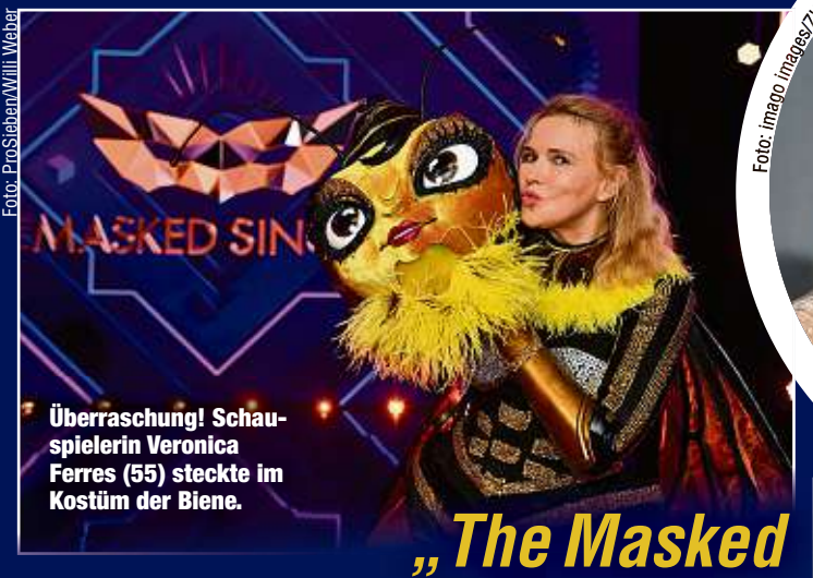
Überraschung! Schauspielerin Veronica Ferres (55) steckte im Kostüm der Biene.