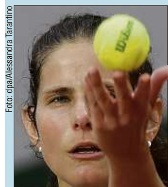
Julia Görges hat sich von der gelben Filzkugel verabschiedet.

REGENSBURG - Mit emotionalen Worten hat die frühere Wimbledon-Halbfinalistin Julia Görges ihre Karriere beendet.