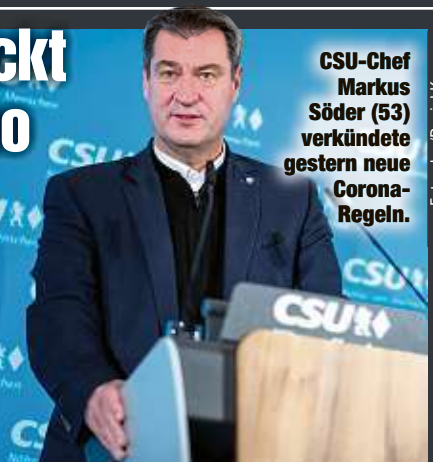
CSU-Chef Markus Söder (53) verkündete gestern neue Corona-Regeln.