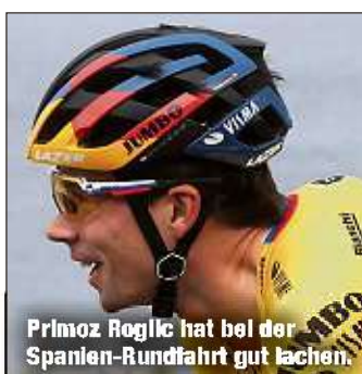
Primož Roglič hat bei der Spanien-Rundfahrt gut gelacht.

Bis zum entscheidenden Zeitfahren am Sonntag in Mailand stehen zwei weitere Bergetappen auf dem Programm. Der Spanier Marc Soler hat die zweite Etappe der Vuelta gewonnen. Der 26-Jährige setzte sich nach 151,6 Kilometern von Pamplona nach Lekunberri als Solist durch, nachdem er sich 15 km vor dem Ziel bei der Abfahrt von der letzten Bergwertung aus einer Spitzengruppe hatte absetzen können. Den Sprint der Verfolger gewann 19 Sekunden später