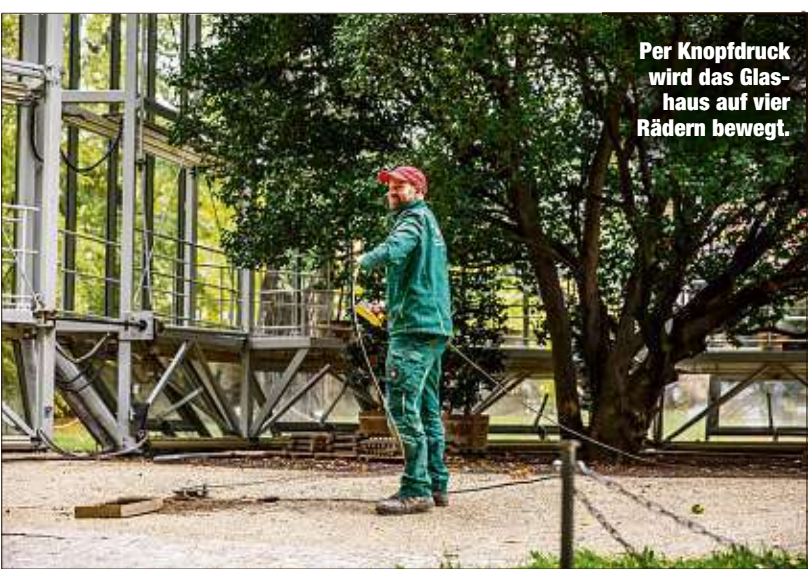
Per Knopfdruck wird das Glashaus auf vier Rädern bewegt.

Die Pillnitzer Kamelie ist wieder in ihrem Winterquartier. Das fahrbare Glashaus wurde gestern Vormittag im Pillnitzer Schlosspark um die älteste und größte Kamelie nördlich der Alpen geschoben. Nur zehn Minuten hat's gedauert, dann war die Kamelie wieder in ihrem Glashaus und ist nun vor dem Frost geschützt. Sie überwintert bei 4 bis 6 Grad und wird von Mitte Februar bis Mitte Mai ihre karminrote, tausendfache Blütenpracht entfalten. Der Klimacomputer des 54 Tonnen schweren und über 13 Meter hohen Gewächshauses übernimmt vollautomatisch die Steuerung von Temperatur, Belüftung, Luftfeuchte und Beschattung. Die Pillnitzer Kamelie wurde 1801 als bereits 30-jährige Pflanze von Hofgärtner Carl Adolph Terscheck im Schlosspark ausgepflanzt. Nach mehr als 200 Jahren ist sie bis heute stattliche neun Meter in die Höhe gewachsen. Ihr Kronenumfang beträgt 37 Meter. KK