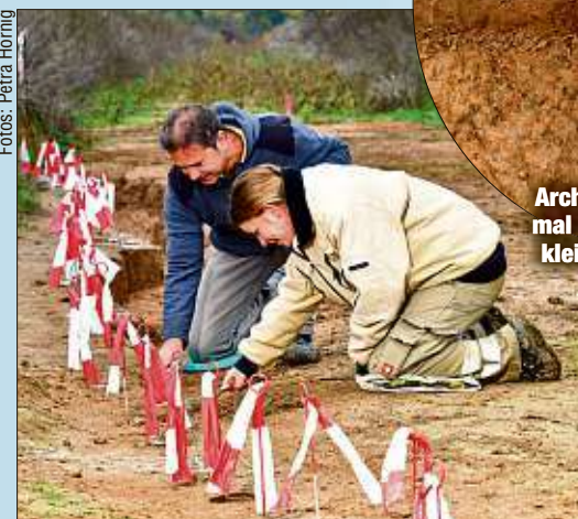
Mitarbeiter des Forschungsteams nehmen behutsam Proben aus dem Erdreich.