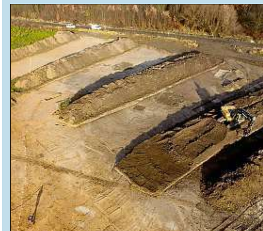
Aus der Luft betrachtet wird das ganze Ausmaß der riesigen Anlage erst sichtbar.