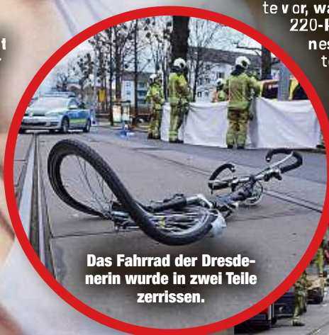
Das Fahrrad der Dresdnerin wurde in zwei Teile zerrissen.