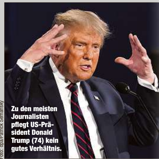
Zu den meisten Journalisten pflegt US-Präsident Donald Trump (74) kein gutes Verhältnis.